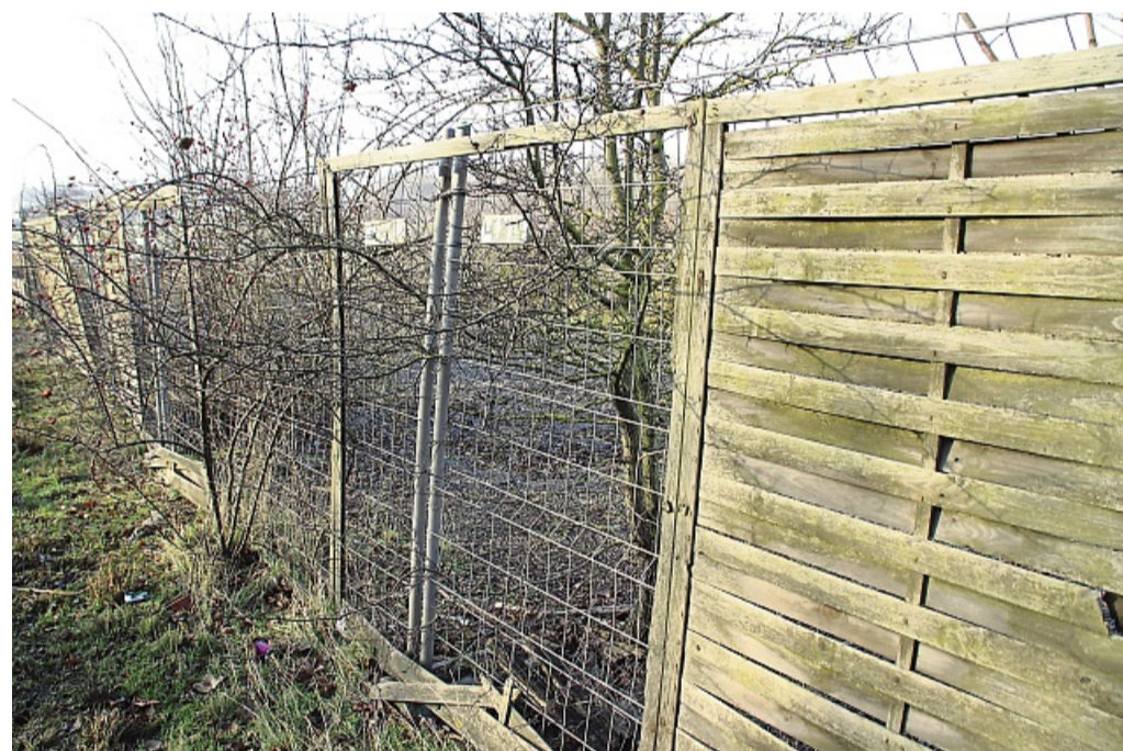
Halb Bauzaun, halb verwitterter Holzzaun: Blick auf den ehemaligen Schrottplatz von der Bundesstraße aus. Über die künftige Nutzung der Fläche ist nach Angaben des Eigentümers noch nicht entschieden.