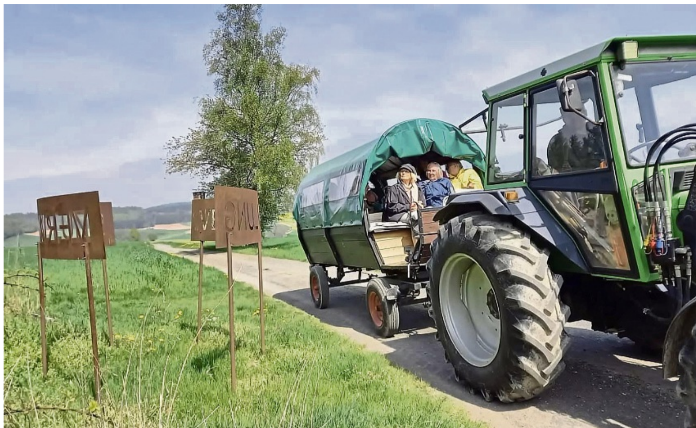
Kunst in der Natur entdecken: Auf vier verschiedenen Ars Natura-Rundwegen werden ab Mai Planwagenfahrten angeboten.