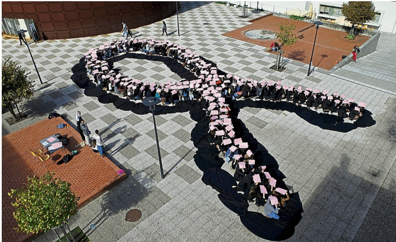
Die rosa Schleife ist ein internationales Symbol, das Bewusstsein für Brustkrebs schaffen will. Eine von acht Frauen ist im Laufe ihres Lebens davon betroffen.

Gut zu wissen: Ab einem Alter von 35 Jahren haben gesetzlich Versicherte alle zwei Jahre Anspruch auf ein Hautkrebscreening, das Hautärzte, aber auch Hausärzte mit entsprechender Weiterbildung durchführen. Der Arzt oder die Ärztin