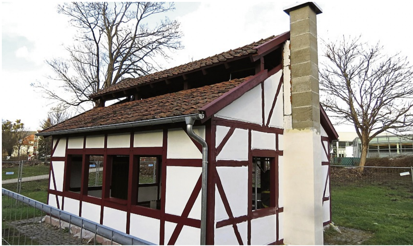
Vom Siedekot im Kurpark von Bad Sooden-Allendorf sind die Gefache bereits zugemauert, im Inneren ist die Siedepfanne schon aufgesetzt, so dass noch in diesem Jahr mit Schausiede-Vorführungen zu rechnen ist.

Was an Straßen-, Brücken- und anderen Baumaßnahmen in diesem Jahr erfolgen kann, hängt noch völlig von den Beratungen des städtischen Haushalts ab, will der Bürgermeister kein einziges denkbares Projekt für 2025 benennen. Trotzdem herrscht nicht Stillstand in der Badestadt, stattdessen wird in diesem Jahr auf einer wichtigen Verkehrsader mit Behinderungen zu rechnen sein. Konkret: Die Großbaustel-