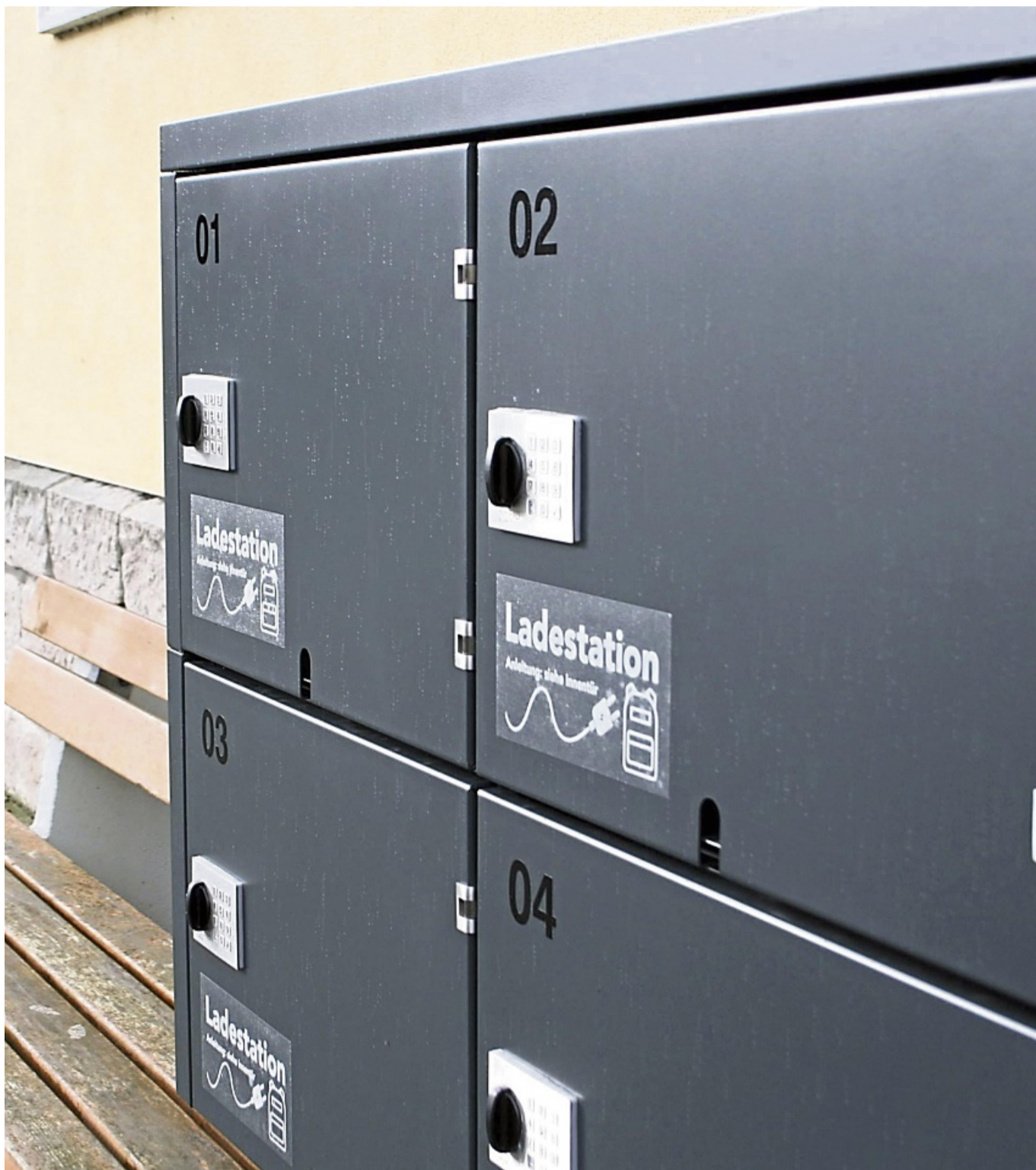
Kostenloser Service: E-Biker können die Akkus am Gebäude der Kurverwaltung aufladen.