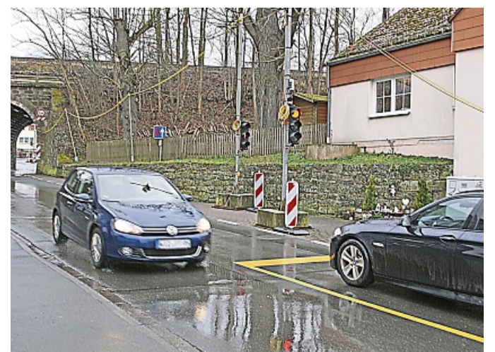
Wird bald ersetzt: die Ampelanlage am Bahnviadukt in Witzenhausens Stadtteil Gertenbach.

Gutachter hatten dem Mann wegen paranoider Schizophrenie und Verfolgungswahn Schuldfähigkeit attestiert, weswegen er unbefristet in die Psychiatrie eingewiesen worden war. Ziemlich genau vor einem Jahr hatte der Bundesgerichtshof die Revision des Mannes verworfen. CHRIS CORTIS