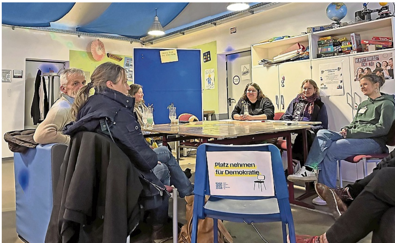
Ein Stuhl als Einladung: „Platz nehmen für Demokratie“ bedeutet, ins Gespräch zu kommen, andere Meinung auszuhalten und den Dialog zu suchen.

Wer die „StreitBar“ betritt, findet keinen sterilen Debatterclub vor. Stattdessen prägen ein Billardtisch, ein Boxsack, eine Chilldecke und eine gut sortierte Bar mit alkoholfreien Getränken das Bild. Es