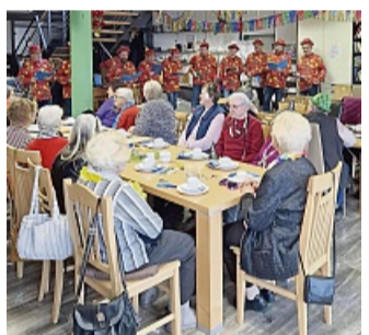
Viel Spaß beim Karneval 2024.