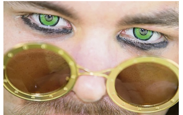
Schlechtere Sicht: Viele Party-Kontaktlinsen verkleinern die Pupille künstlich.