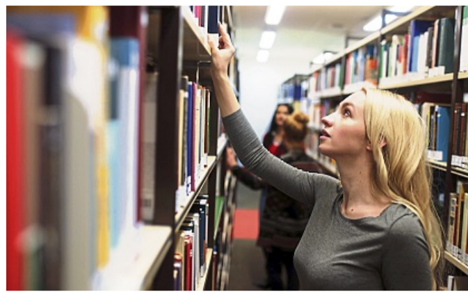
In die Bibliothek setzen und Stoff nachlesen? Beim Lernen für eine Prüfung bringt einen das nur bedingt voran.