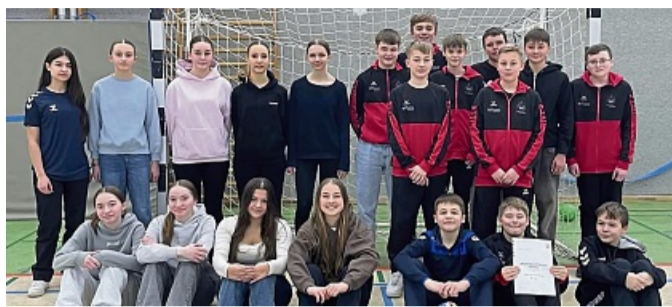
Schüler der Adam-von-Trott-Schule belegen den 2. und 4. Platz beim Regionalscheid Handball

Unsere Mädchen erreichten einen beachtlichen 2. Platz und verpassten mit nur einem Tor die Qualifikation zum Landesentscheid. Sie traten gegen die Winfriedschule aus Fulda sowie gegen die Werratschule aus Heringen an. Sie schlugen im ersten Spiel souverän die Winfriedschule mit 24:14. In einem packenden Finale gegen die Mädchen aus der Werratschule Heringen mussten unsere Mädels in die Verlängerung. Sie gingen in Führung, konnten