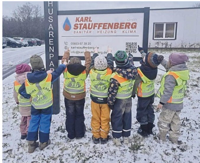
Viele Eindrücke und Spaß hatten die „Riesen“ beim Besuch des Unternehmens Stauffenberg.

Kindertagesstätte Ulfen beteiligt sich an Wettbewerb