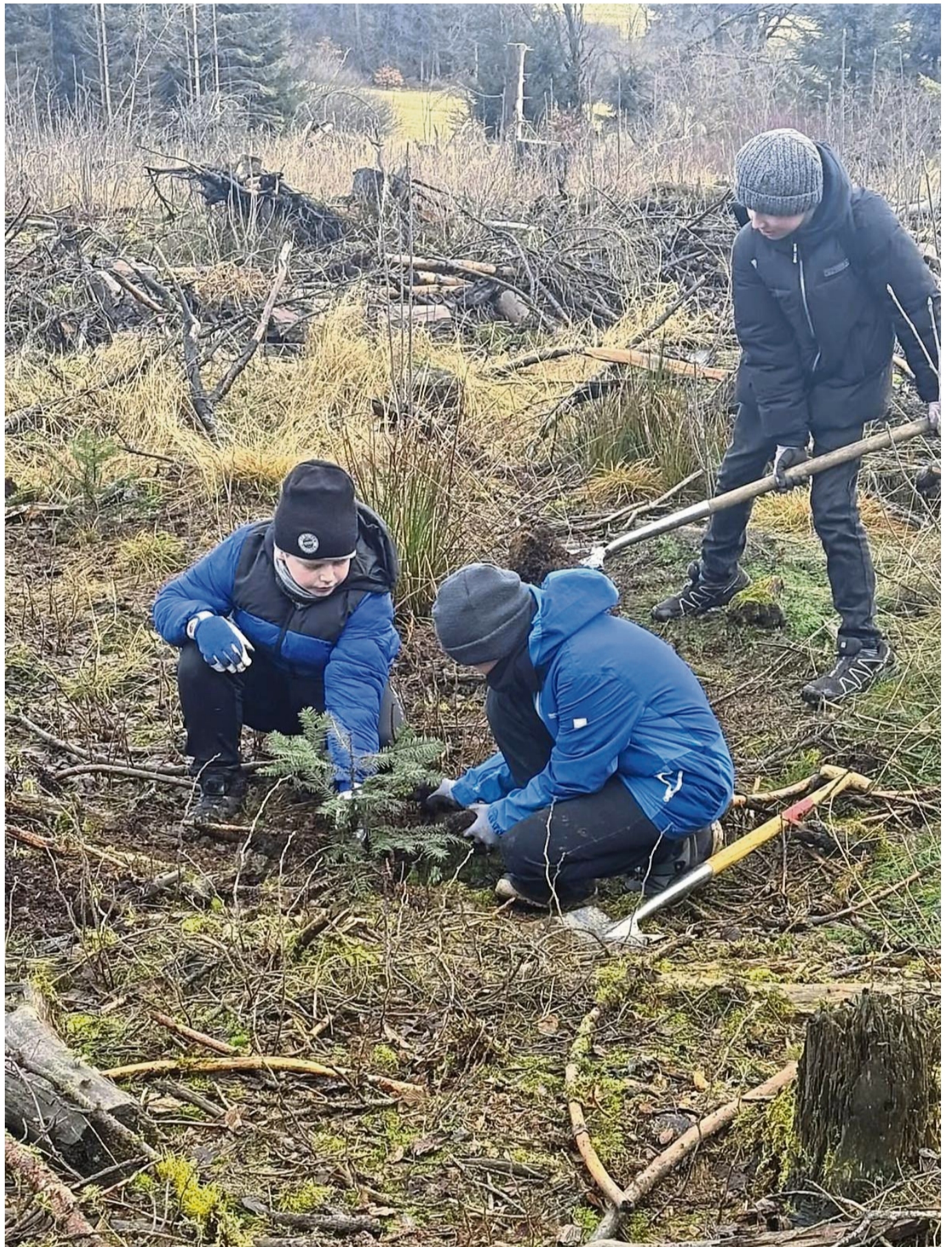
Packten tatkräftig mit an: Die Fünftklässler der Anne-Frank-Schule in Eschwege leisteten im Rahmen eines Aktionstags auf dem Hohen Meißner mit Begeisterung einen praktischen Beitrag zum Erhalt des Waldes. Durch den praktischen Einsatz erlebten die Kinder, warum Mischwälder stabiler sind als Monokulturen, wie abgestorbenes Holz Lebensraum für Tiere und Pflanzen bietet, aber auch gezielt entfernt werden muss und welche Rolle junge Bäume für die Zukunft des Waldes spielen.

Nach einem Tag voller Bewegung, Natur und Teamarbeit ging es zurück nach Eschwege – mit dem Bewusstsein, dass jeder Einzelne etwas für die Umwelt tun kann. Der Aktionstag auf dem Hohen Meißner hat den Kindern eindrucksvoll gezeigt, dass nachhaltiges Handeln mit kleinen Schritten beginnt.