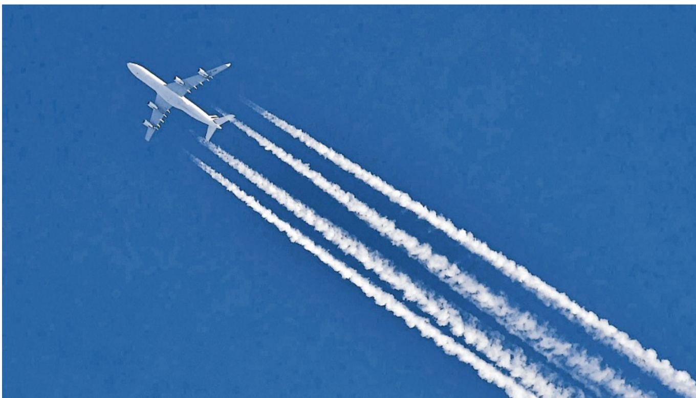
Fliegen gilt als besonders klimaschädliche Form des Reisens - über Ausgleichszahlungen lassen sich die verursachten Klimafolgen zumindest teilweise kompensieren.