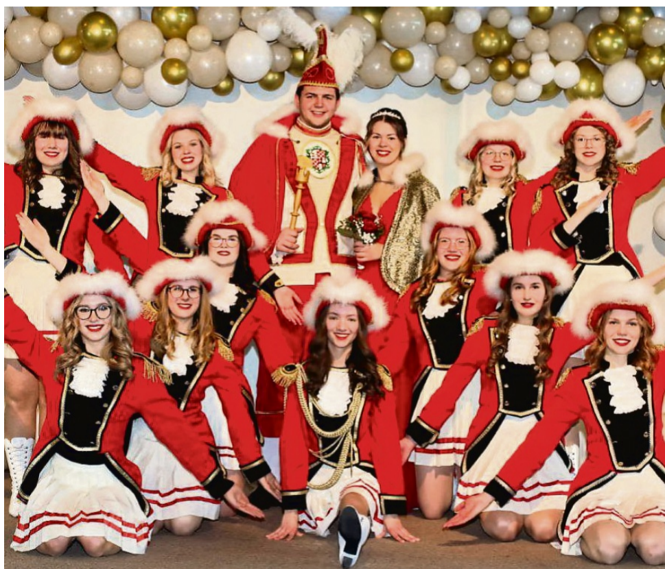
Kinderkarneval, Weiberfastnacht, Narrensitzung, Rosenmontagsumzug und großer Festball: Die Karnevalisten „Rot-Weiss“ Medebach haben erlebnisreiche Feste geplant.

Am 26. Februar steht der traditionelle Besuch des Elferrates mit Prinzenpaar und Funkengarden im St.-Mauritius-Wohn- und Pflegeheim auf dem Programm. An „Weiberfastnacht“ starten die Karnevalisten wieder morgens mit dem Besuch der „Hansegrundschule“ und den beiden Medebacher Kindergärten, bevor abends die große Weiberfastnachts-party in der Schützenhalle