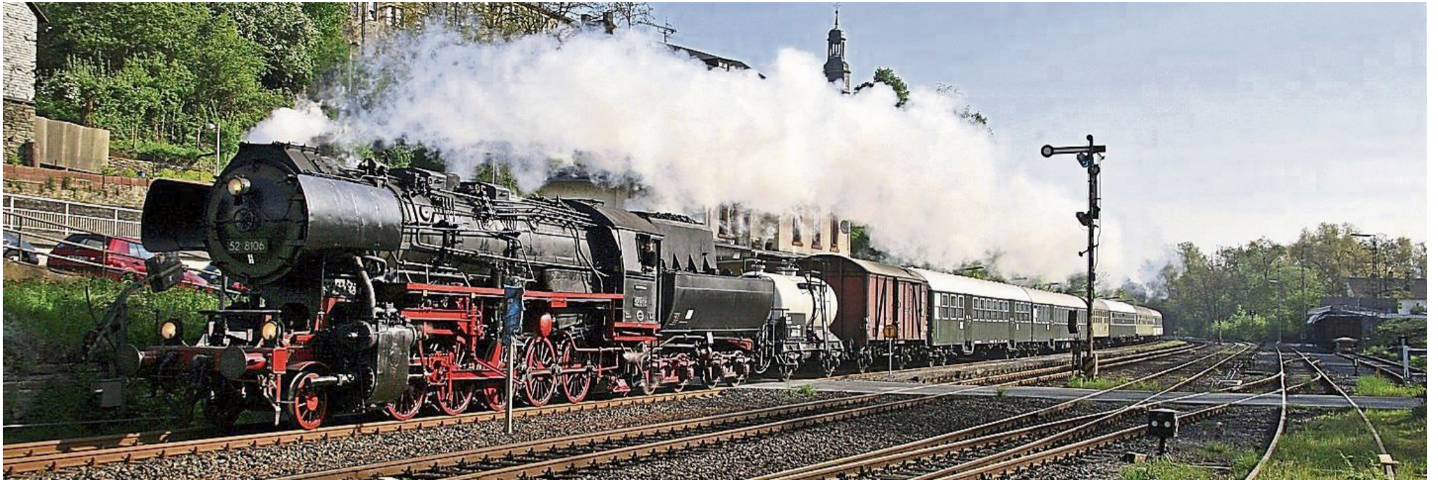
Dampfsonderzüge Eisenbahnfreunde Treysa