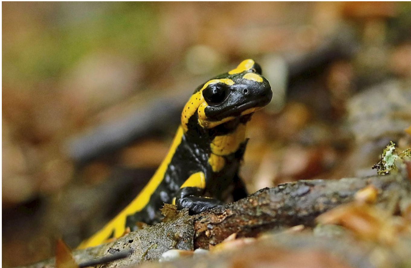
Von tödlichem Hautpilz bedroht: Im Nationalpark Kellerwald-Edersee wurden zahlreiche tote Feuersalamander gefunden, die an dem Hautpilz Bsal verendet sind.

Bsal, auch Salamanderpest genannt, tötet nicht nur Feuersalamander, sondern gefährdet auch andere Schwanzlurchearten. Feuersalamander zie-