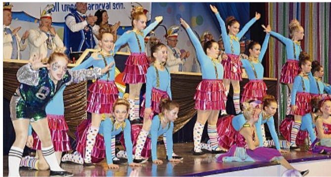
„Alle einsteigen, Türen schießen ... uuuund Abfahrt!“ hieß es beim Show-Tanz der Magic-Kids, die das Publikum mit auf große Fahrt nahmen.