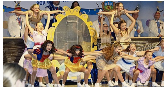
Beim Showtanz der KVH-Funkengarde „Zoff im Märchenland“ ging es für einzelne Aktive auch hoch hinaus bis zur dritten Ebene.