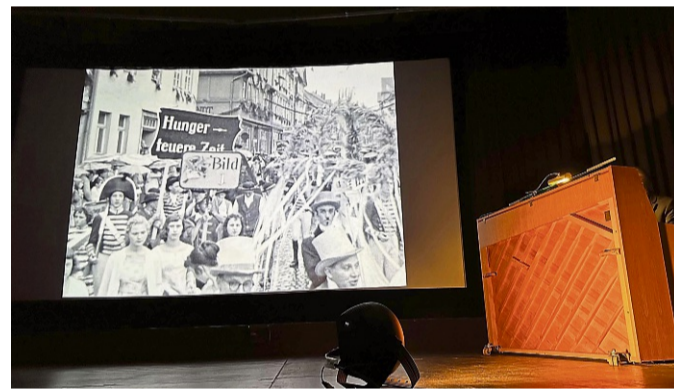
Die alten Aufnahmen zeigen die Stadt, ihre Feste und das Leben vergangener Generationen.