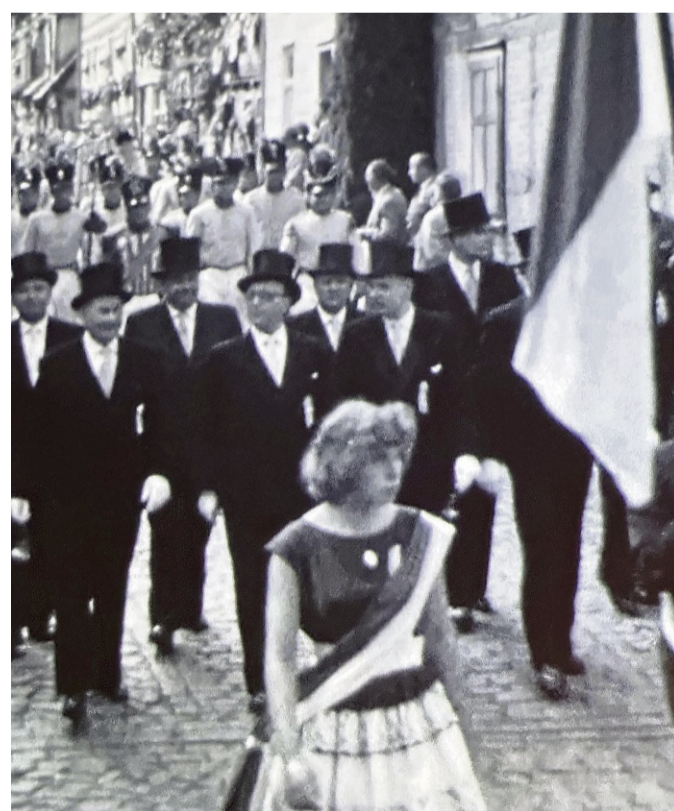
Vergangenheit trifft Gegenwart: Die Stadtgeschichte Witzenhausens entfaltet sich in beeindruckenden Archivaufnahmen auf der großen Leinwand.