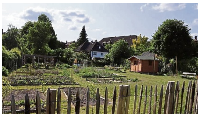
Der Internationale Gemeinschaftsgarten war im Sommer des vergangenen Jahres gut bepflanzt. Auch ein Brunnen und ein Gartenhaus wurden angeschafft.

Riemann melden oder kommen zum ersten Gartentreffen am Samstag, 1. März, in den Bürgertreff an der Ziegelstraße 56. kir