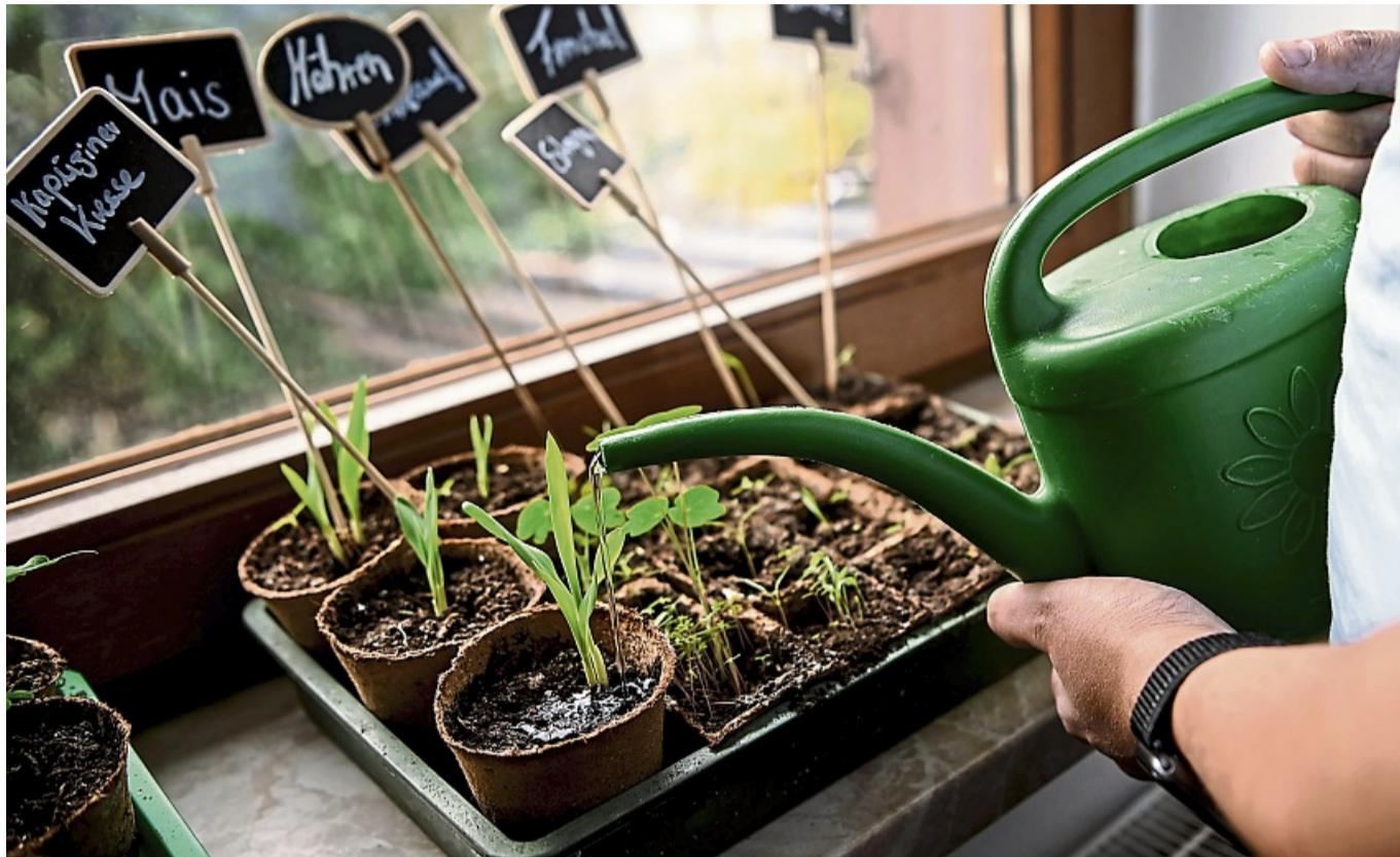
Anzucht auf dem Fensterbrett: In Sachen Belichtung eignet sich für zarte Pflänzchen am besten ein Platz am Ost- oder Westfenster.

Pflanzen wie etwa Basilikum brauchen Licht, damit die Keimhemmung abgebaut wird. Sie dürfen keinesfalls mit