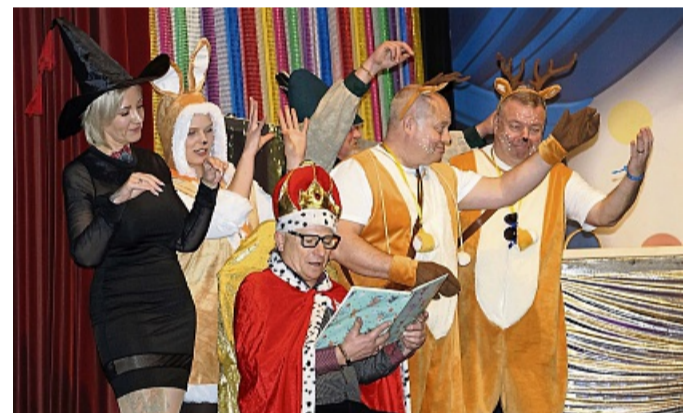
Mit einer närrischen Variante des Märchens „Schneewittchen und die sieben Zwerge“ begeisterten die Reiser Weiber und lieferten lustige Episoden aus dem „Wirtshaus der sieben Sünden“.

bist du der Star“, einer Mischung aus „Top Gun“, „Sister Act“ und „East High Wildcats“. Für großartige Stimmung über vier Stunden sorgten auch die kleinen und großen Tanz-