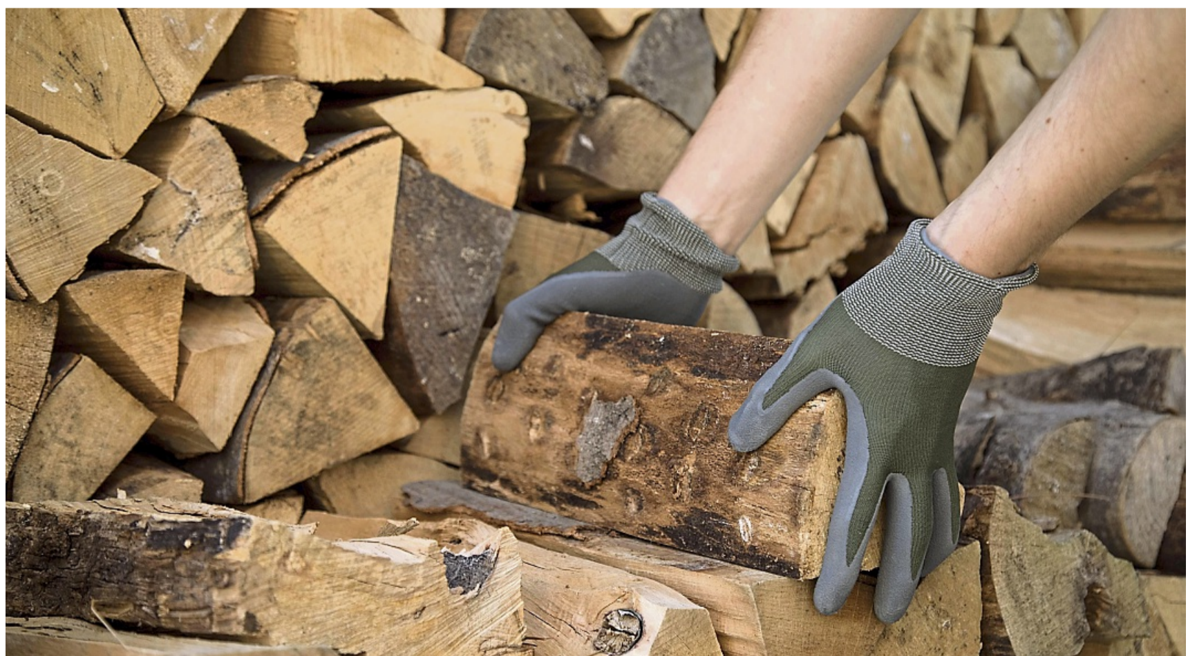
Laut HKI normalisiert sich der Brennholzpreis wieder. Im bundesweiten Durchschnitt kostet der Festmeter 80 Euro.

Die angegebenen Preise beziehen sich auf sogenannte Polter, die man bei Forstämtern be-