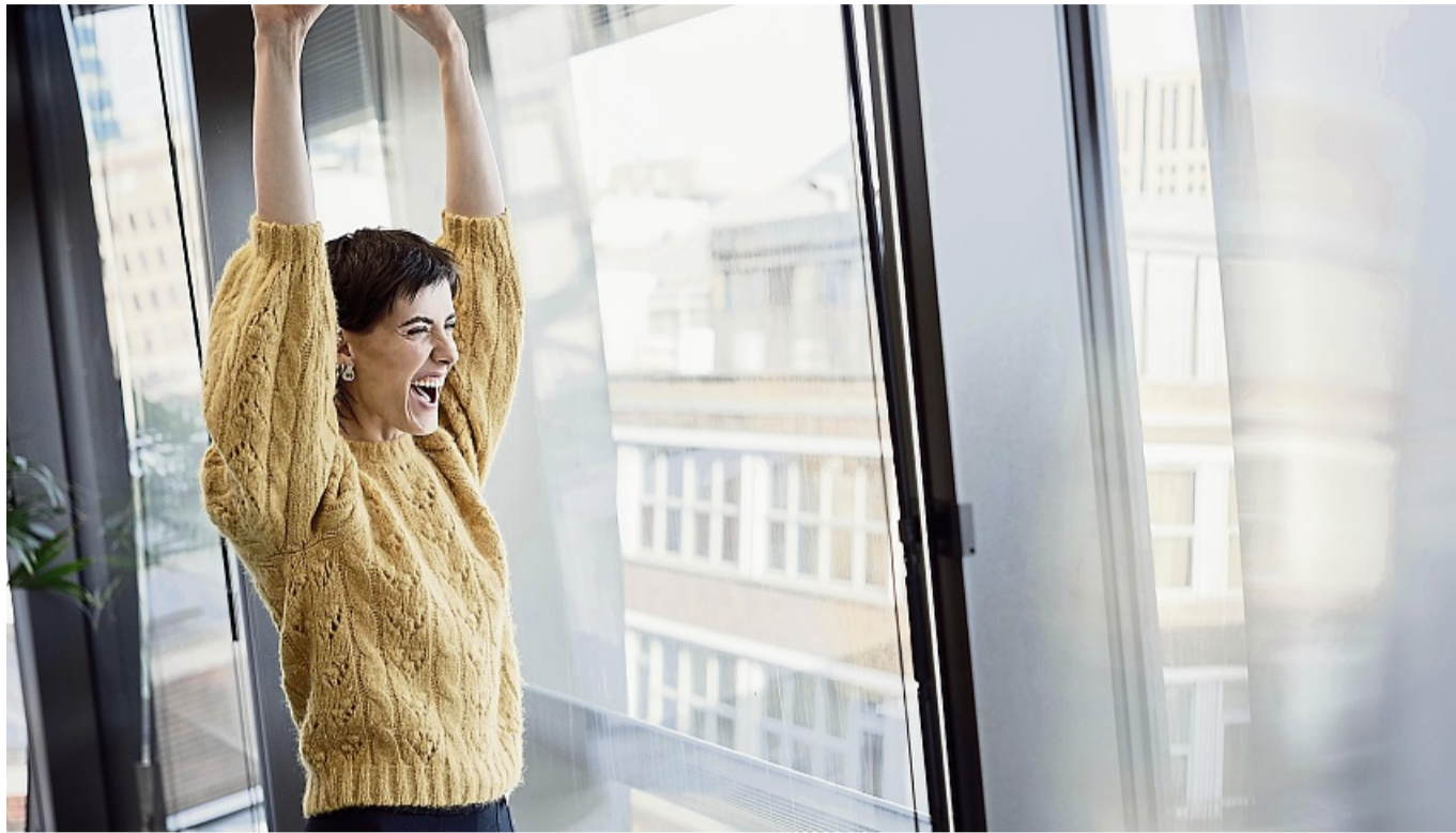
Alles geschafft! Wer bestimmte Methoden anwendet, kann viel Arbeit oft auch in weniger Zeit wuppen.