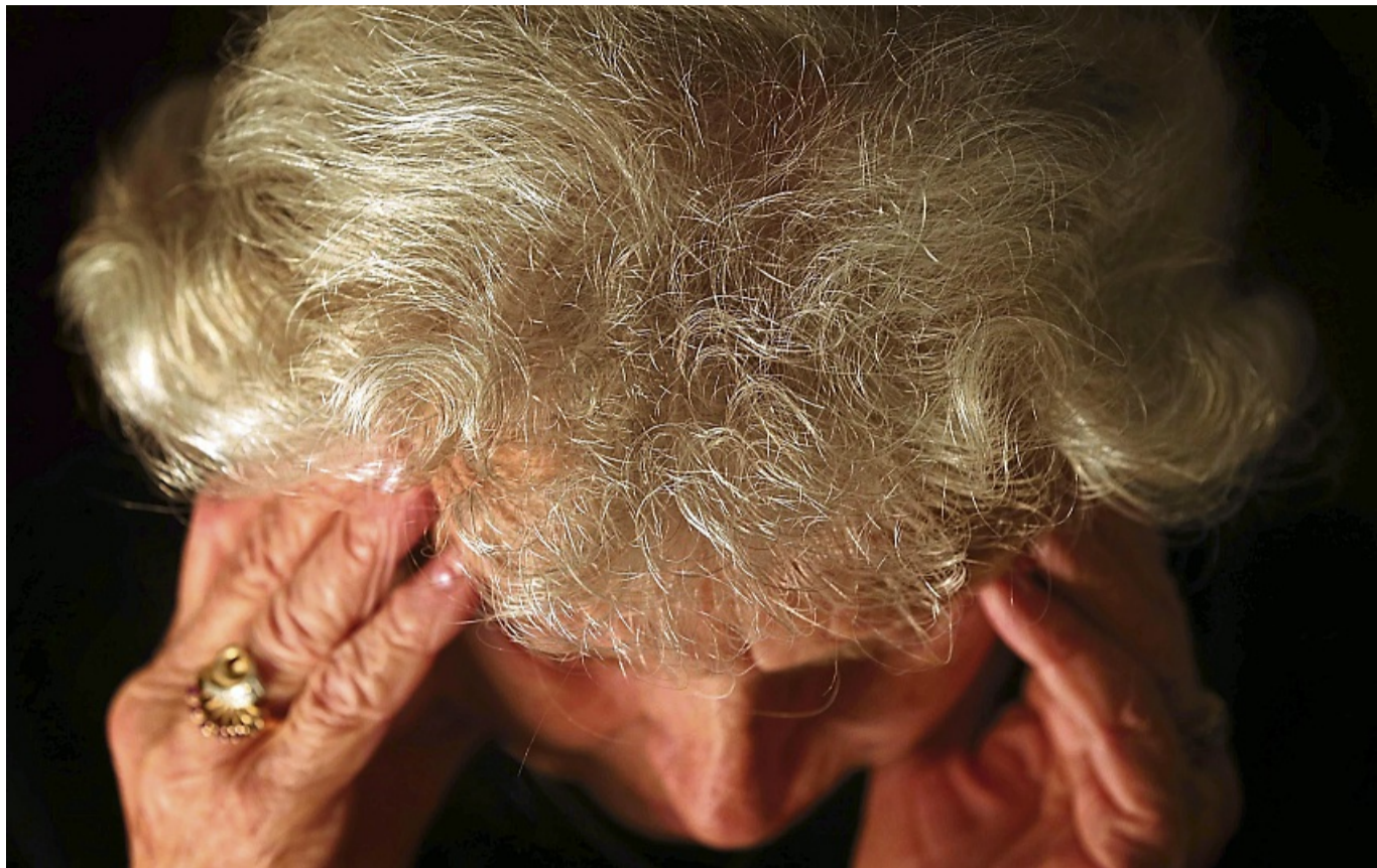
Mit einer Vorsorgevollmacht darf sich eine bestimmte Person um alle rechtlichen Angelegenheiten des oder der Demenzkranken kümmern.

Mit einer Vorsorgevollmacht darf sich die darin bestimmte Person um alle rechtlichen Angelegenheiten des oder der Demenzkranken kümmern.