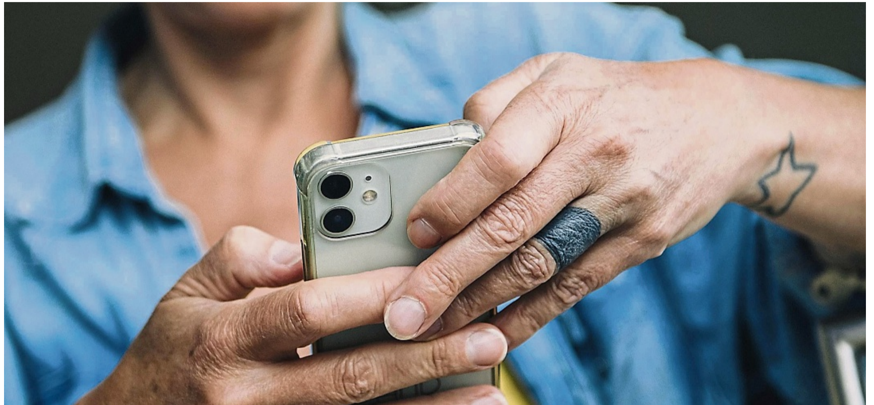
Harmlos oder nicht? Symptom-Checker sollen bei Krankheiten eine Einschätzung geben, ob und wie schnell man eine Praxis aufsuchen soll.

Bei der Treffsicherheit der Verdachtsdiagnosen gibt es große Unterschiede. Die Symptom-Checker „Ada“ und „Symptomate“ liefern verlässliche Er-