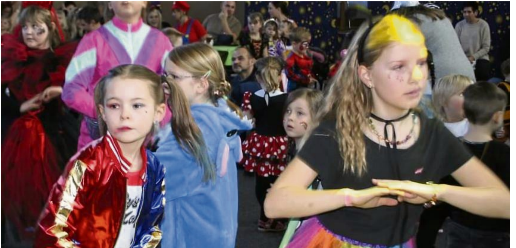
Beim Kinderfasching in Oberrieden blieb die Tanzfläche nie leer.