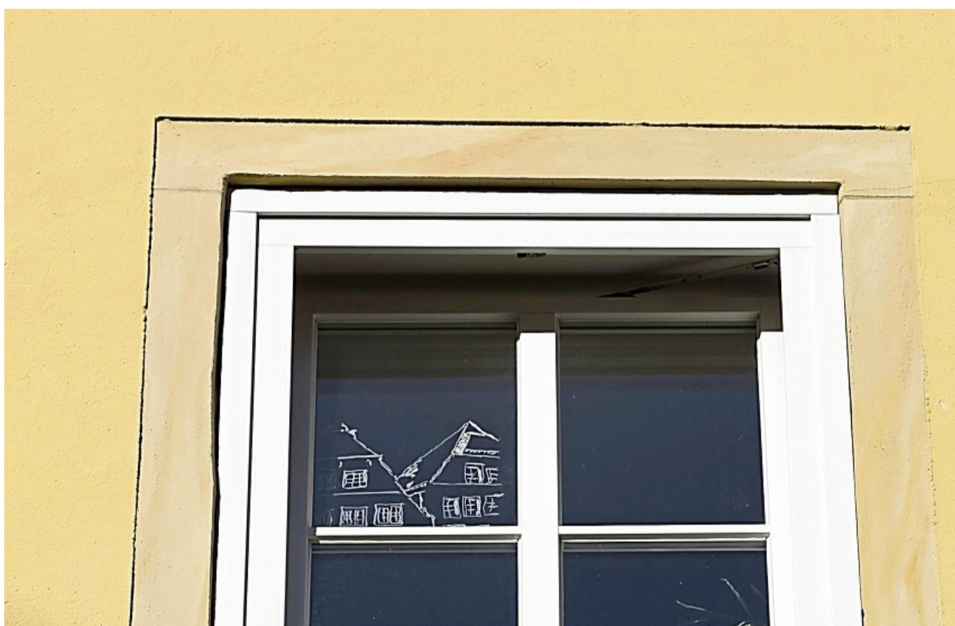
Wenn es nach der Winterkälte wieder wärmer wird, sollte die Fassade auf Risse überprüft werden.

Risse in der Fassade beheben Risse in der Fassade können die Bausubstanz beeinträchtigen, so der Verband Wohneigentum - genauso wie abgeplatzte Farbe oder abgeplatzter Putz. Um schwerwiegende Feuchtschäden zu vermeiden, sollten Eigentümer solche Schäden zeit-