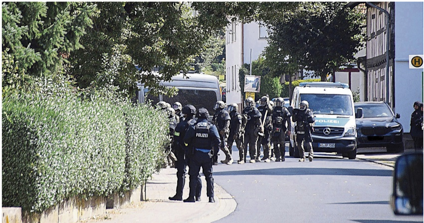
Massives Polizeiaufgebot: Beamte in Schutzausrüstung rückten im August 2023 auf das Anwesen im Schenkklengsfelder Ortsteil Oberlengsfeld vor.

Oberlengsfeld – Der Einsatz eines Spezialeinsatzkommandos (SEK) im August 2023 auf einem landwirtschaftlichen Anwesen im Schenkklengsfelder Ortsteil Oberlengsfeld bleibt für den damals gesuchten Mann voraussichtlich ohne gerichtliches Nachspiel.