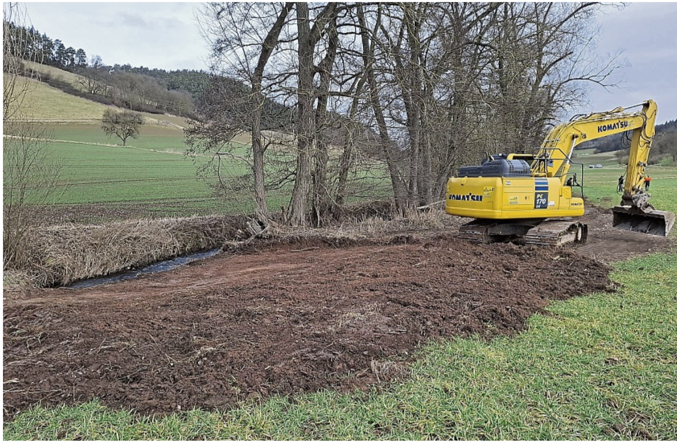
Bagger im Einsatz: Die Gude kehrt in ihr Bachbett zurück.

Das Thema sorgte nicht nur bei den Landwirten für Diskussionen. Auch Naturschützer von Nabu und BUND sahen sich die Gegebenheiten vor Ort an. Sie sind überzeugt, dass vor allem langanhaltende Niederschläge für die Überschwemmungen verantwortlich waren und wiesen auf die Bedeutung der Tiere als „Ökosysteminge-