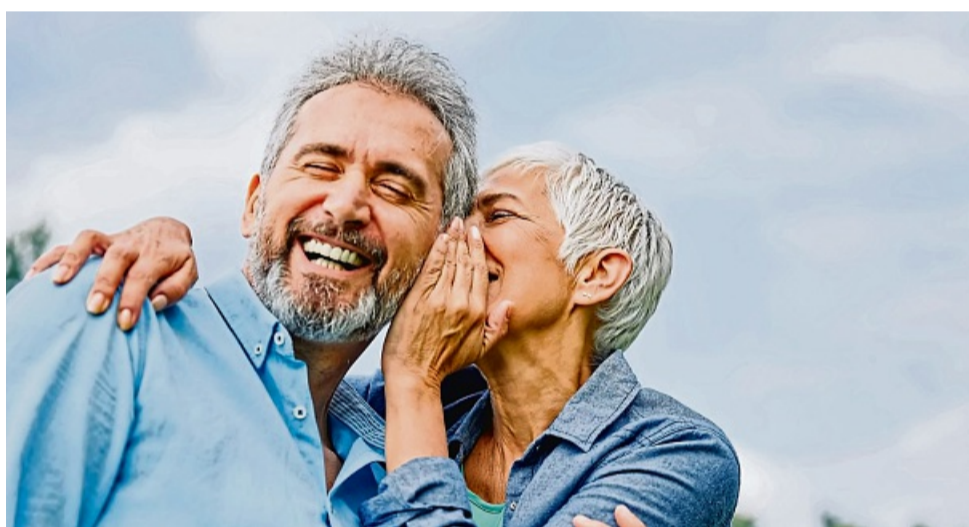
Ins Ohr schreien? Nicht nötig – mit einer guten Hörversorgung klappt Kommunikation wieder reibungslos.

Denn gerade die ersten Monate im Jahr sind ideal, um in puncto Gesundheit die Weichen bis zum Frühjahr neu zu stellen und gute Vorsätze wirklich durchzuführen. Wer merkt, dass das Gehör nicht mehr richtig mitspielt, kann es sich leicht machen und mit einem Anruf eine kostenlose und unverbindliche Hörberatung beim geschulten Experten veranlassen.