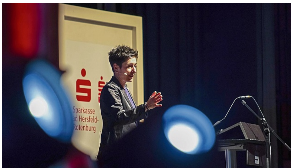
Mal locker, mal eindringlich und noch im Outfit aus dem Morgenmagazin: Journalistin und ZDF-Moderatorin Dunja Hayali beim Sparkassen-Forum am Wochenende in Rotenburg.