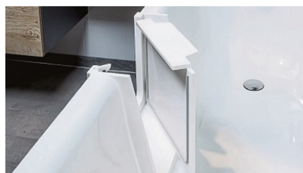
Praktisch: Barrierearme Badlösungen dank einer neuen Wannentür.