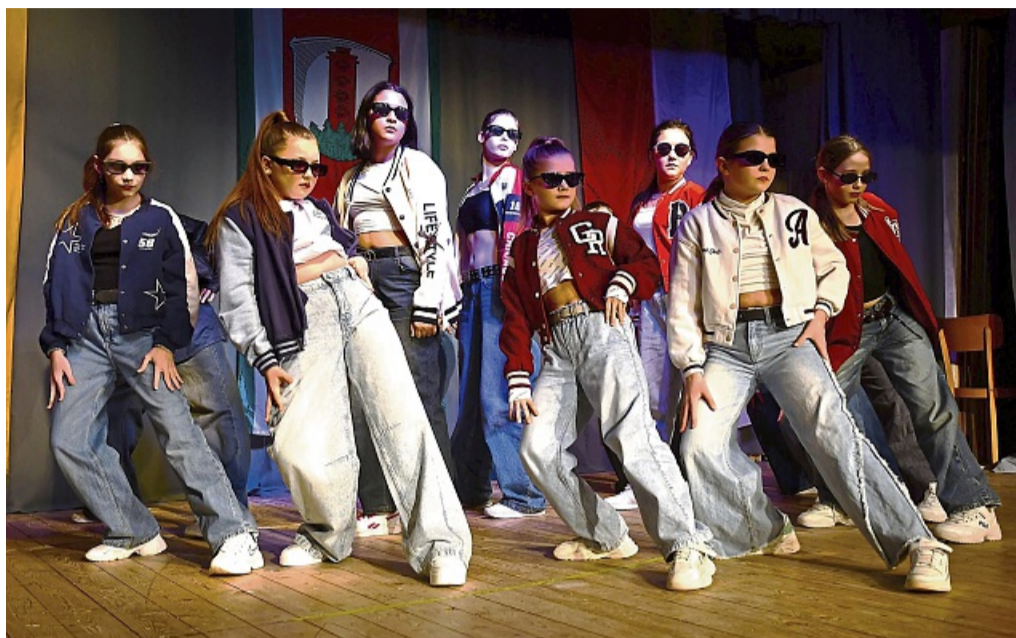
Lässig: Die von der ukrainischen Tanzchoreographin trainierten Urban Kids begeisterten mit zwei Tänzen. Weitere Fotos gibt es unter hna.de/rotenburg

In seinem kommunalpolitischen Rückblick mit Anmerkungen „zur Lage der Nation“ ging der Bürgermeister kurz auf das eine oder andere Projekt ein, das im vergangenen Jahr umgesetzt worden ist. Dabei verwies er auf die Neueinrichtung einer halben Stelle im Bereich Seniorenarbeit/Seniorenhilfe, die Etablierung des neuen Gemeindeblättchens und der Bürger-App sowie diverse Baumaßnahmen. Mit Blick auf die Auswirkungen der Grundsteuerreform, die viele Bürger trotz moderater Hebesatz-Beschlussfassung der Gemeindevertretung „in wenig angenehmer Weise“ getroffen habe, gab er der Hoffnung Ausdruck, dass das Land nachbessern werde. Besserung zeichne sich schon jetzt ab bei der Verlegung des Glasfasernetzes, der Sanierung der Straßenverhältnisse zwischen Nieder- und Obergude und der Sanierung von gemeindlichen Jugendräu-