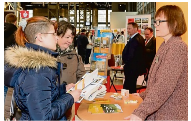
Energieberatung mit den Experten aus der Region

Los geht es in der Bad Hersfelder Schilde-Halle (Benno-Schilde-Platz 4) am Samstag, 8. März, um 10 Uhr und die Messe geht bis