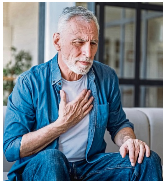
Bei einer Herzinsuffizienz pumpt das Herz nicht mehr ausreichend Blut durch den Körper. Die Patienten leiden unter einer zunehmenden körperlichen Leistungsschwäche.

Betroffene sollten sich an ihren behandelnden Arzt oder ihre Ärztin wenden. Falls die Person für das innovative Verfahren geeignet ist, kann sie an eines der medizinischen Zentren überwiesen werden, das die Implantation des BAT-Medizingerätes durchführt. djd