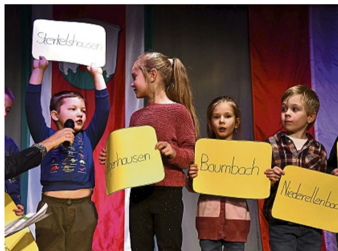
Von ihm war sogar der Landrat begeistert: Der für Sterkelshausen sprechende junge Mann machte sich für den Jugendraum in seinem Ort stark.

kob Klassen zum Ausdruck, der für alle Gemeindepolitiker ein Buch mit Erkenntnissen für jeden Tag mitgebracht hatte. Weitere geistliche Akzente setzte der Posaunenchor der Evangelischen Chrischona Ge-