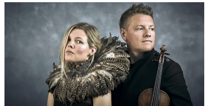
Treten im Buchcafé auf: Die dänische Folksängerin Helene Blum und Geiger Harald Haugaard.