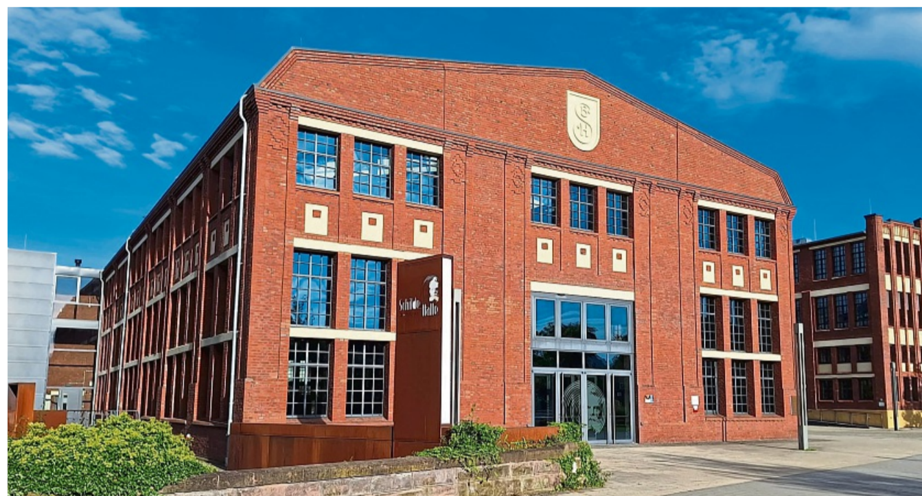
In der Schilde-Halle geht es nächstes Wochenende rund um Energie und Klima.