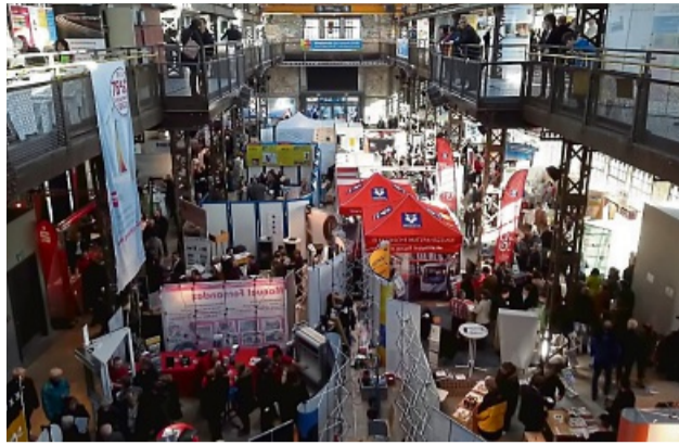
Geballtes Fachwissen an einem Ort: Bei den Energie- und Klimatagen in Bad Hersfeld.

Die Verbraucher- und Informationsmesse für alle Themen rund um Energiesparen, Energieeffizienz, intelligente Gebäudetechnik, ökologisches Bauen und Heizen, Fassadentechnik, Photovoltaik, Klimaschutz und Klimaanpassung knüpft an die erfolgreichen Veranstaltungen an, die zuletzt im Jahr 2018 stattfanden.