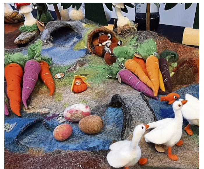
Ein abwechslungsreiches Angebot bietet der Kunsthandwerkermarkt zum Thema Frühling und Ostern in Rotenburg.