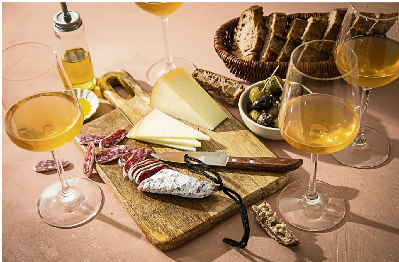
Orange- oder auch Amberwein hat seine Farbe dadurch, dass die Winzer für ihn Traubenschalen und Most miteinander vergären lassen.

Das Ergebnis sind Weine, die mal dem klassischen Geschmacksbild entsprechen, mal davon abweichen: „Es kann auch vorkommen, dass sie ein bisschen muffen“, sagt Schrade. „Dann hilft es, das Glas durchzuschwenken.“ Der Effekt ähnele dann dem, wie wenn man ein stickiges Zim-