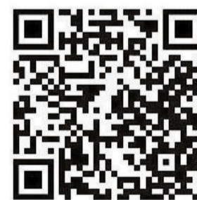
Gemeinsam vorsorgen: QR-Code zur Anmeldung