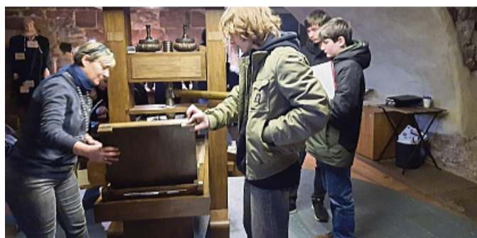
Schüler erleben Geschichte auf der Wartburg

Ein besonderes Highlight war dann der Workshop zum Buchdruck, bei dem die Schülerinnen und Schüler selbst erleben konnten, welche revolutionäre Wirkung diese Erfindung im 16. Jahrhundert hatte. Mit einem selbstgedruckten Exemplar der Wartburg im Gepäck wurde dann der Abstieg zu Fuß