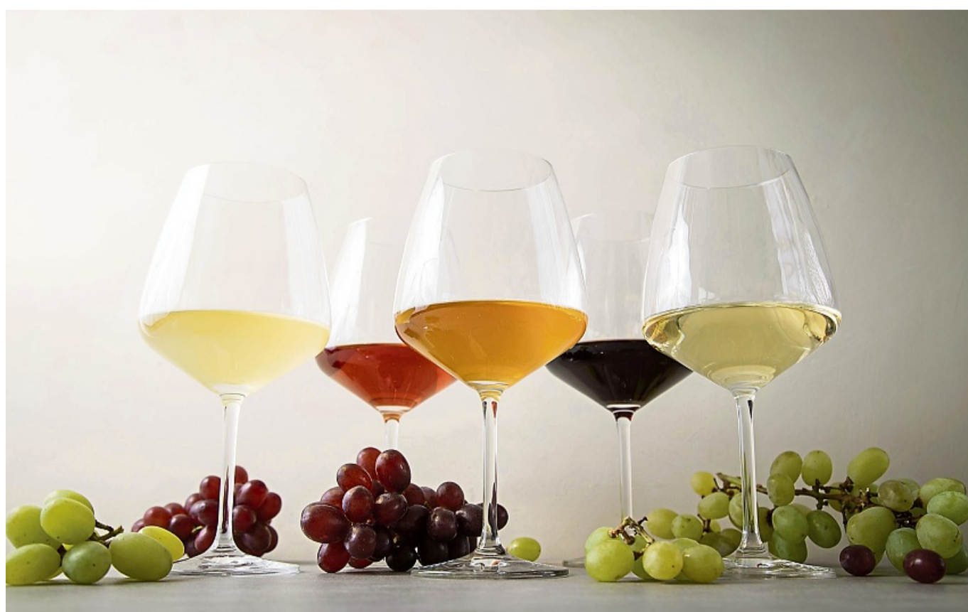
Naturtrüb, bernsteinfarben oder mit ungewöhnlichen Aromen: Wer bei der Weinbestellung mutig ist, kann Neues entdecken.