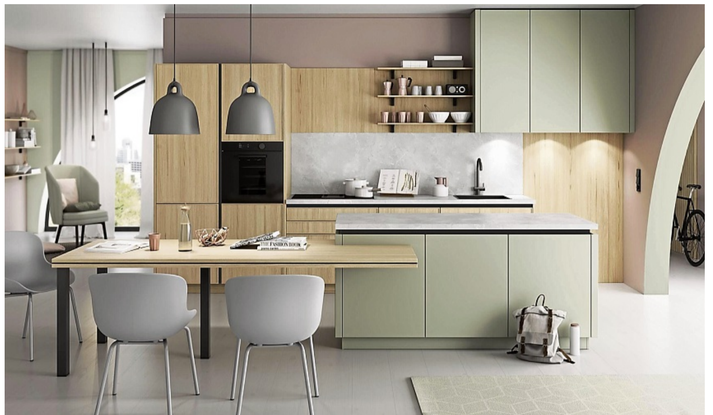
Material- und Farb-Mix erwünscht – die Kombination verschiedener Materialien bewirkt, dass die Küche gemütlich und hell wirkt.

Dafür eignen sich etwa Weinkisten oder alte Schubladen oder Regalbretter mit Baumkante. Sie empfiehlt einen Materialmix aus Natur- und Metallelementen. „Setzen Sie Kon-