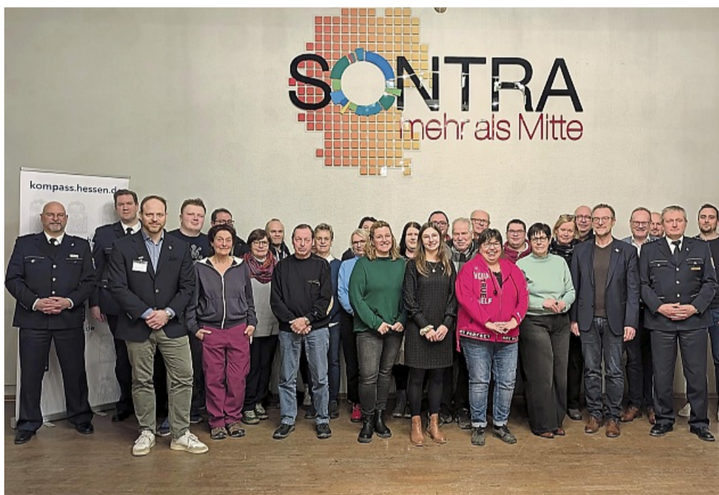
Wie sicher lebt es sich in Sontra: Dieser Frage gingen zahlreiche Experten auf der ersten Kompass-Sicherheitskonferenz in Sontra nach. An dem Sicherheitsprogramm des Landes nimmt die Stadt Sontra seit 2023 teil.

Die Kriminalitätsfurcht vor einer Körperverletzung oder einem Terroranschlag war mit