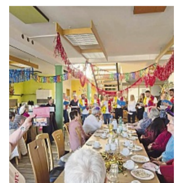
Viele Sontraerinnen und Sontraer waren zum gemeinsamen Karnevalfeiern in die Bürgerhilfe gekommen.

Die Bürgerhilfe Sontraer Land e.V. möchte sich ganz herzlich bei den Hänselfrauen, Hänselfrauen und den beiden Büttenrednern für de-