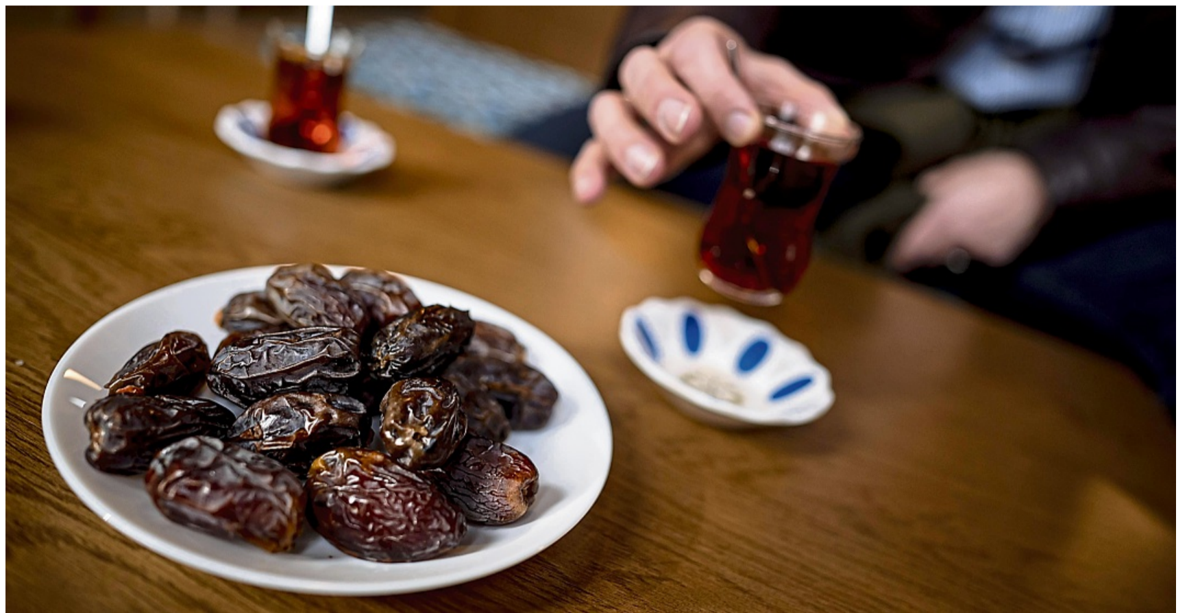
Am 1. März beginnt Ramadan. Für viele Musliminnen und Muslime bedeutet das: nichts essen und nichts trinken zwischen Sonnenauf- und Sonnenuntergang.

Auf der sicheren Seite ist, wer sich vorab ärztlichen Rat holt und/oder das Thema in der Apotheke anspricht. Im Ramadan auf eigene Faust die Dosierung zu verändern oder Medi-