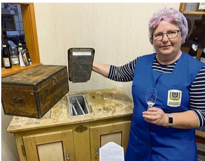
Sorgt für eine Stärkung: „S'Else“ begrüßt die Gruppe im Brauereimuseum.

Tourismusgesellschaft Melsunger Land bietet 20 Kilometer Nachtwanderung an