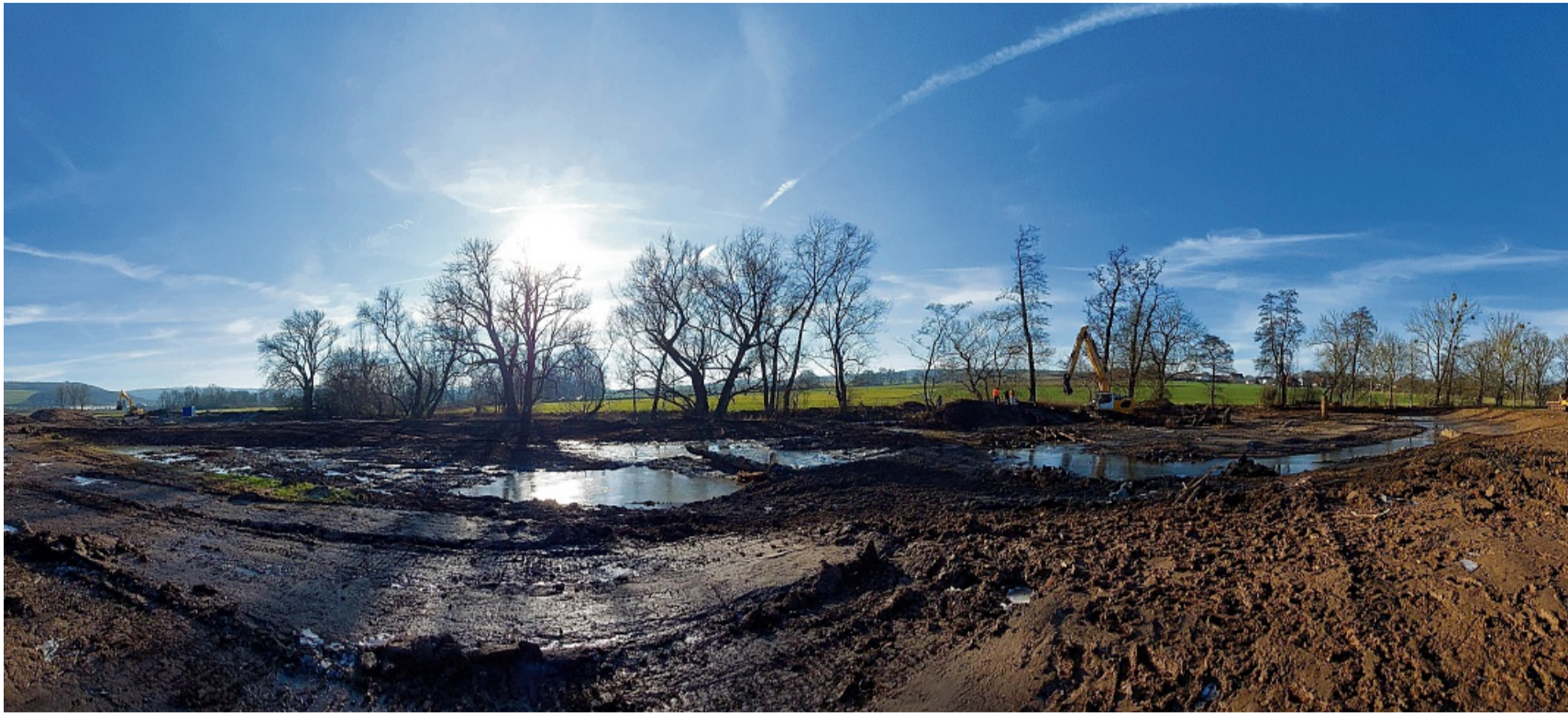
Renaturierung der Ohe bei Caßdorf.