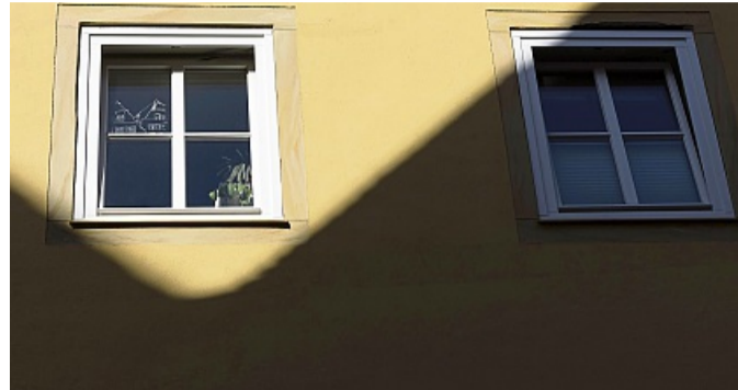
Wenn es nach der Winterkälte wieder wärmer wird, sollte die Fassade auf Risse überprüft werden.

lingshaften Temperaturen nicht trocknen, kann dies ein Hinweis darauf sein, dass ein größeres Problem dahintersteckt. Dann sollten Eigentümer schnell handeln - auch damit die Schäden nicht auf angrenzende Bereiche übergehen. Sind die Schäden an der Fassade großflächiger, sollten Eigentümer über eine komplette Renovierung der Hauswand nachdenken. Der Verband Wohneigentum rät: Sind ohnehin umfangreichere Arbeiten nötig, kann es sinnvoll sein, für das gesamte Haus auch gleich eine Dämmung anzubringen.