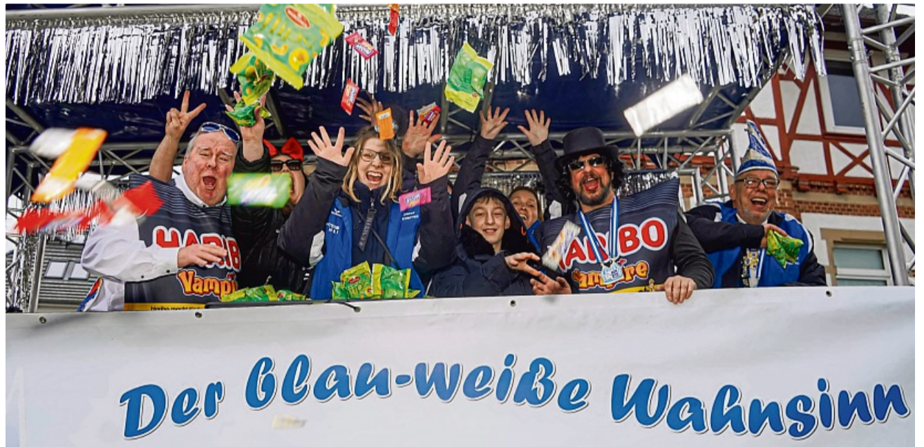
Der wahrgewordene blau-weiße Wahnsinn: Die Fritzlarer Stadtnarren sind wieder mit am Start.