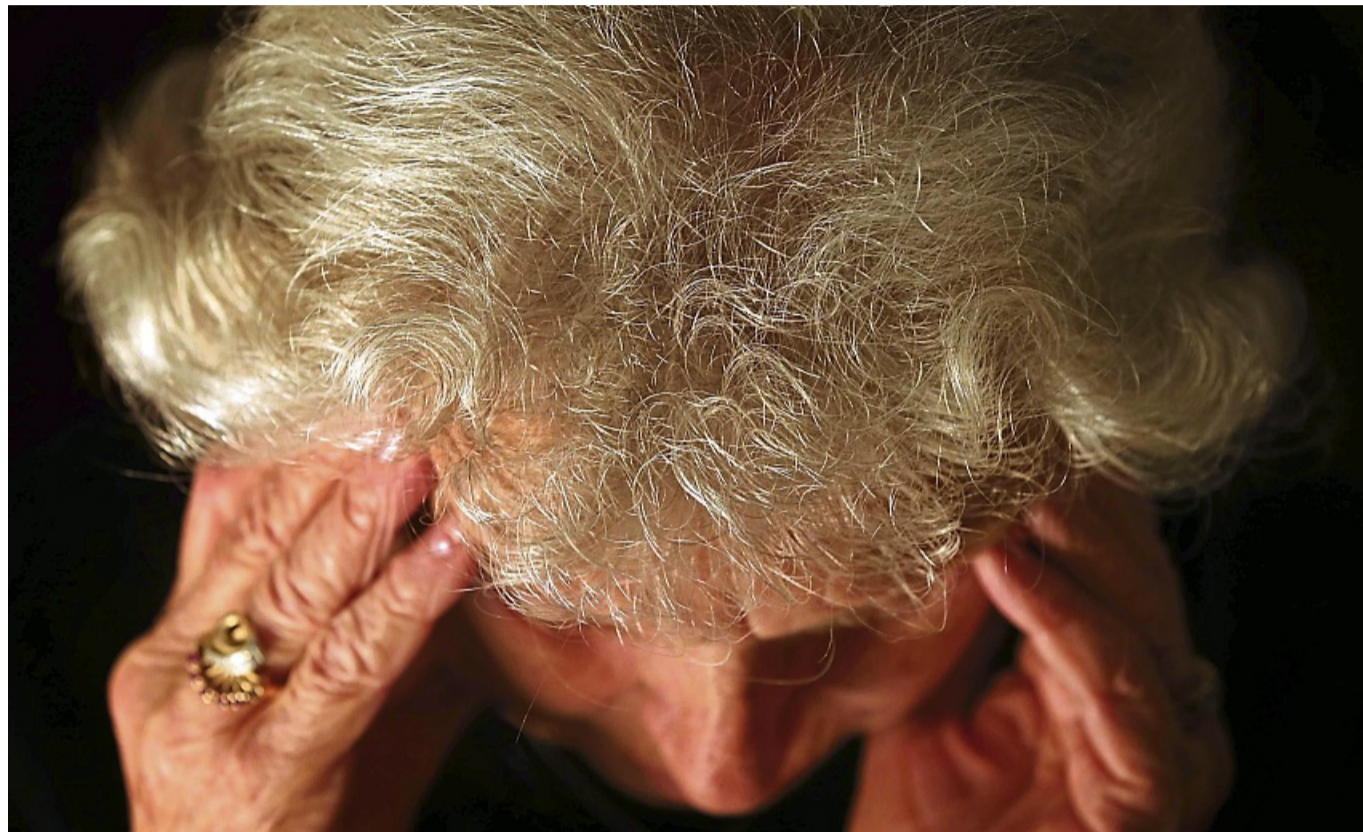
Mit einer Vorsorgevollmacht darf sich eine bestimmte Person um alle rechtlichen Angelegenheiten des oder der Demenzkranken kümmern.