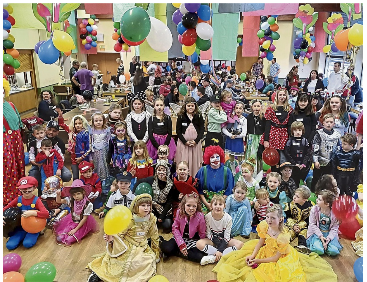
So bunt feierte Rhünda den Kinderkarneval im Dorfgemeinschaftshaus.

34549 Edertal-Wellen • Tel: 05621-3098 www.landmaschinen-schaefer.de