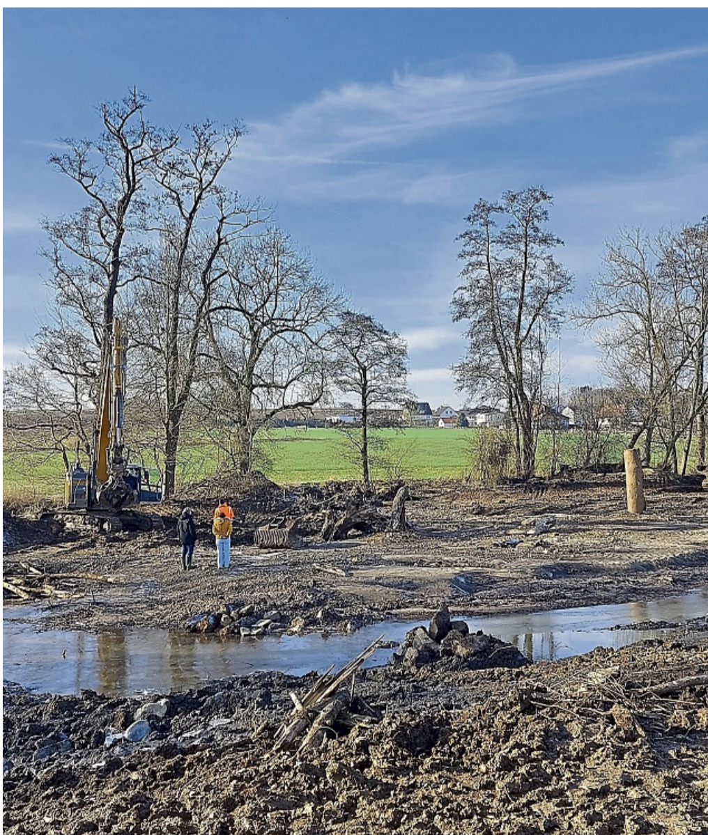
Neue Umgebung für den Fluss: Die Ohe in Caßdorf wird renaturiert.