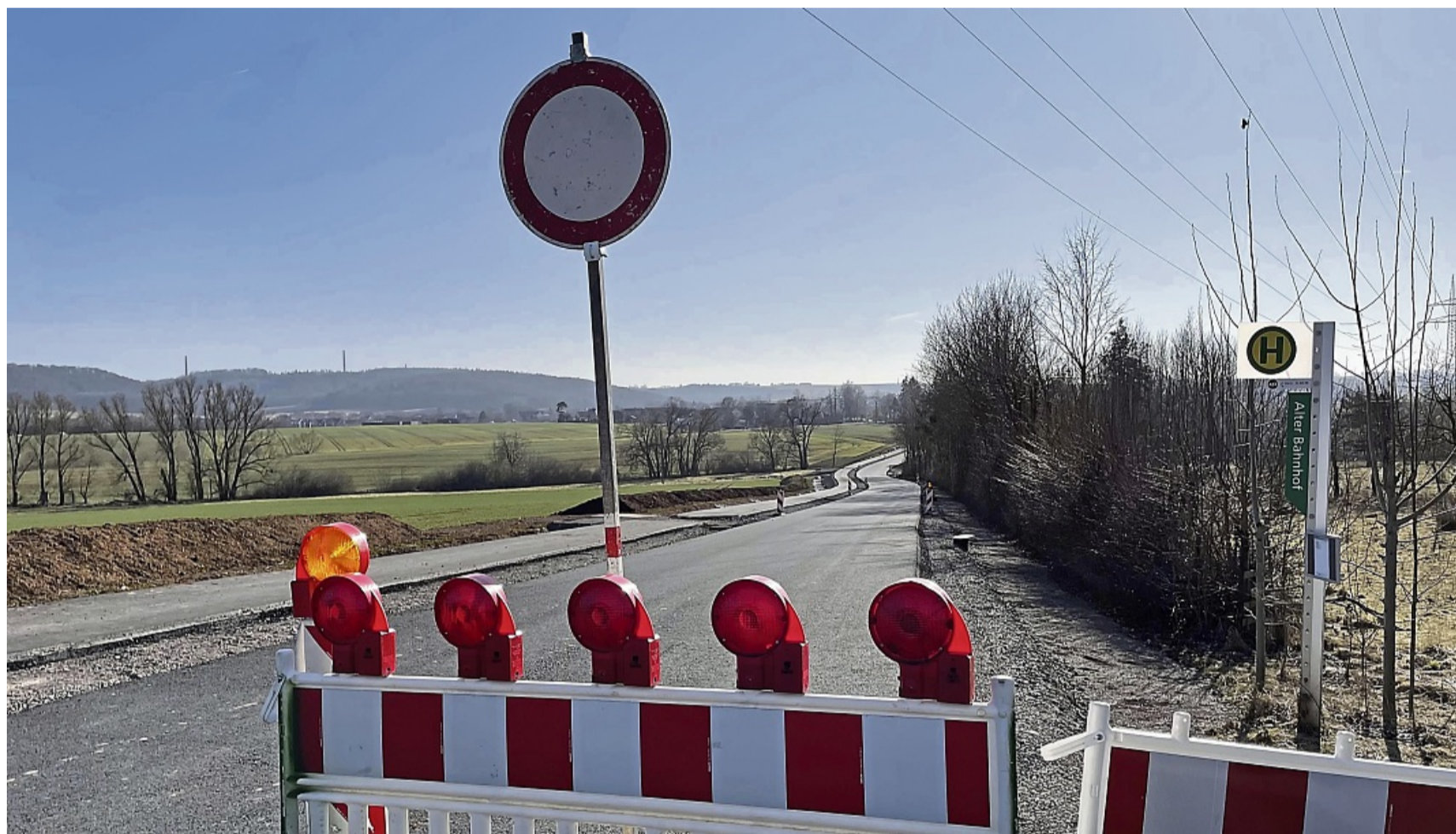
Fortführungsmaßnahme: Zwischen den Twistetaler Ortsteilen Berndorf und Mühlhausen wird die Landesstraße seit vergangenem Jahr ausgebaut und um einen Radweg ergänzt. In 2025 geht es Richtung Mühlhausen weiter.