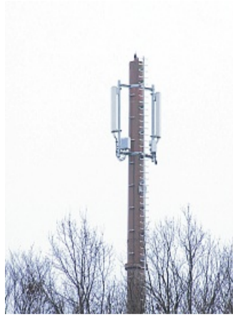
Der Standort Richtung Fischbach wird aufgerüstet.

Datendienste und mobiles Internet verfügbar.