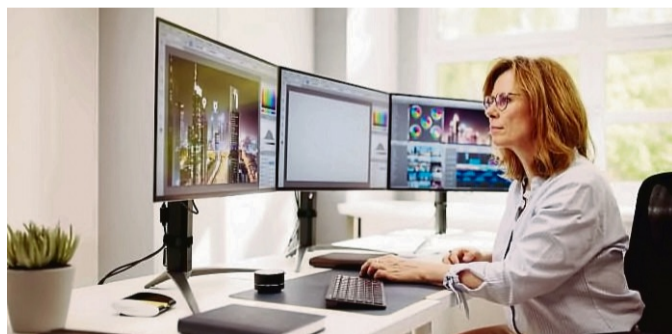
Am Bildschirmarbeitsplatz können durch richtige Höheneinstellungen und die richtige Positionierung Fehlhaltungen vermieden werden.

Der diesjährige Tag der Rückengesundheit stellt den Nacken in den Fokus. Erfreulicherweise lassen sich die meisten Nacken- und Schulterschmerzen durch eigene individuelle Verhaltenswei-