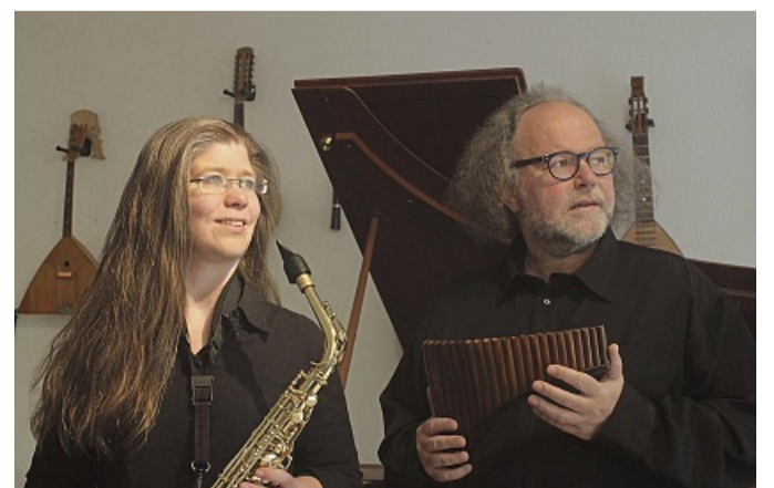
Das Duo „WindWood & Co“ will einen musikalischen Blick in die Passionszeit ermöglichen.

Sammler sucht alles aus dem 1.+2. Weltkrieg. ☎ 05623-9336251 oder 0151-72016498