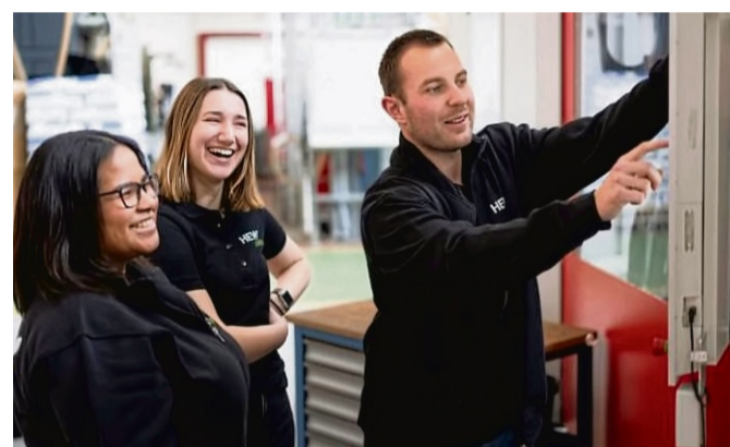
Auszubildende bei HEWI.