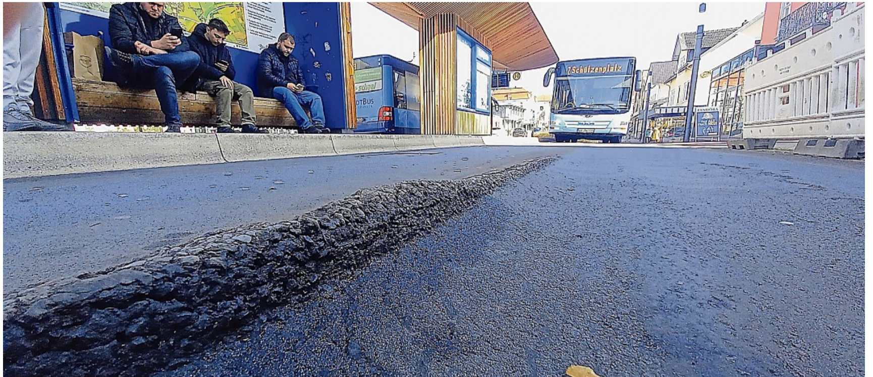
Klar zu sehen: Jetzt wird's höchste Eisenbahn, dass die Treffpunkthaltestelle des Wildunger Stadtbusse saniert wird.

Darum tritt er an die Stelle des Asphalts, den die Stadt von der beauftragten Firma entfernen lässt. Zur Brunnenstraße hin erhält der Beton eine Schutzkante aus Edelstahl. Außerdem wird die gesamte Fläche mit Zwei-Komponenten-Harz beschichtet und wird abschließend mit der Optik des „Blauen Bandes“ versehen, das sich auf den Fußgängerwegen