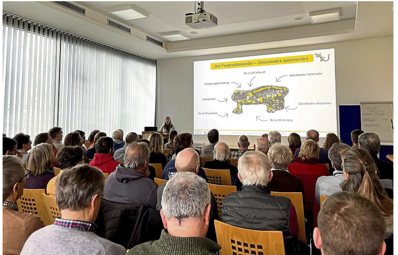
Alle sind im Bilde im Publikum über die große Gefahr für die Feuersalamander, nachdem sie die Informationen bei dem Vortrag im Nationalpark erhalten haben.