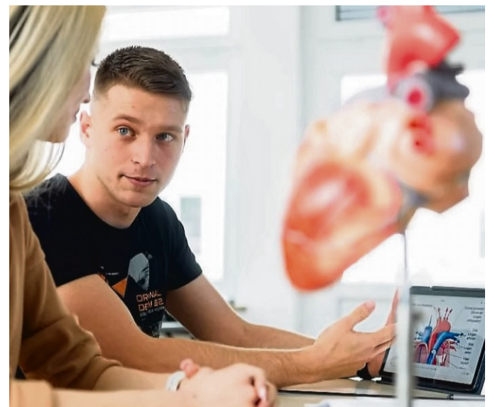
Die Pflegeausbildung am Korbacher Stadtkrankenhaus ist vielfältig und spannend.

Hauptschulabsolventen können die Ausbildung absolvieren, wenn sie über eine