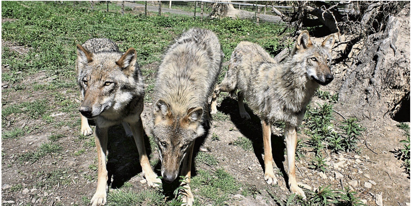
Europäische Wölfe im Wildtierpark Edersee: Am Dienstag ist eine junge Wölfin über den Gehegezaun gesprungen. Das Tier wurde auf seiner Flucht erschossen.

■ CINE K Korbach Becoming Led Zeppelin: Di 19.45 h Bridget Jones - Verrückt nach ihm: Sa bis Mo 17 u. 19.30 h, Sa auch 15 h, Di 17 u. 19.45 h, Mi 17.15 u. 19.30 h Captain America - Brave New World: Sa 17.30 u. 22 h, So 17 u. 19.30 h, Mo bis Mi 17 h Der Prank - April, April: Tägl. 15 h, Sa u. So auch 13 h Die drei ??? und der Karpatenhund: Tägl. 15 h Die Heinzels - Neue Mützen, neue Mission: Sa u. So 13 h Dragonball Z - Kampf der Götter: Di 19.45 h Ein Mädchen namens Willow: Tägl. 15 h, Sa u. So auch 13 h Feuerwehrmann Sam - Pontypandys neue Feuerwache: So 13 h Funny Birds - Das Gelbe vom Ei: Mi 20 h Heldin: Sa 17.15 u. 20 h, So 17.30 u. 19.30 h, Mo u. Mi 17.15 u. 19.30 h, Di 17.15 u. 19.45 h Kneecap: Mi 19.45 h Konklave: Sa u. Di 17.15 h, So u. Mo 17 h Love Hurts - Liebe tut Weh: Sa 22.15 h Met Opera - Ludwig van Beethoven - Fidelio: Sa 18 h Mickey 17: Sa 19.30 u. 21.30 h, So 19.45 h, Mo 19.15 h, Di 19.30 h, Mi 17 h Mufasa - Der König der Löwen: So 14.30 h Overlord - The Sacred Kingdom: So, Mo u. Mi 17.15 h Paddington in Peru: Sa u. So 13 u. 15.15 h, Mo bis Mi 15 h Sneak Preview: Mo 19.45 h Super Charlie: Sa 13 h, Mo bis Mi 15 h The Monkey: Sa 22 h Wunderschöner: Sa 19.45 h, So 19.30 h, Mo 19.5 h, Di 17 h