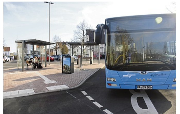
Die Bushaltestelle auf dem neu gestalteten Parkplatz Brunnenallee 1 wird für die Bauzeit zum neuen „Treffpunkt“ der Stadtbuslinien.

Gewährleistungsansprüche gegen die Firmen, die vor zehn Jahren den Asphalt aufbrachten, hat die Stadt in den vergangenen Jahren nicht geltend machen können unter Hinweis auf die hohen Belastungen, denen der Belag täglich ausgesetzt war. MATTHIAS SCHULDT