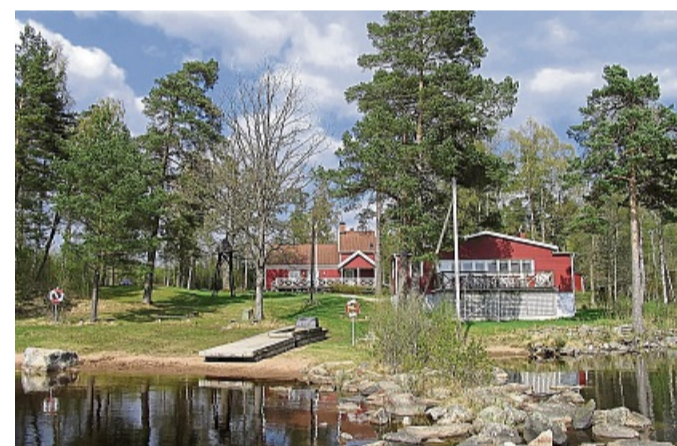
In dieses Haus führt die Sommerfreizeit.

Die Interessengemeinschaft Edertaler Gewerbetreibender und die Firma Landskron unterstützen die Freizeit. Platzvergabe nach Eingang der schriftlichen Anmeldung. Infos und die Anmeldung: www.ev-jugend-eder.de und im Instagram-Kanal der Ev. Jugend Eder @evjungeder . red