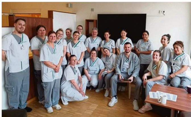
Die Auszubildenden haben eine Station der Asklepios Stadtklinik geleitet.

Bad Wildungen. Nach drei intensiven Wochen ist das Projekt „Auszubildende leiten eine Station“ in der Asklepios Stadtklinik erfolgreich abgeschlossen. Die Auszubildenden des Oberkurses und des Teilzeitkurses hatten die Möglichkeit, die pneumologische Station eigenverantwortlich zu führen und ihre theoretischen Kenntnisse in der praktischen Patientenversorgung anzuwenden.