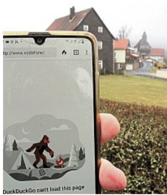
Kein mobiler Empfang: Das soll es ab Sommer in und um Armsfeld für D2-Nutzer nicht mehr geben.

„Bislang konnten über diesen Standort lediglich mobile Telefonate geführt und SMS verschickt werden. Nach Abschluss der Bauarbeiten hat dieser Standort die modernsten Antennen für die Breitband-Technologien LTE und 5G an Bord“, sagt Petendorf zu. Diese verbesserten die Mobilfunkversorgung erheblich, denn dann seien auch mobile