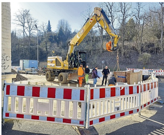
Die Bauausführende Firma Küllmer ist gerade mit dem Einbau eines Schachtes zur Verlegung der Kanal- und Trinkwasserleitungen beschäftigt.

Die geplante Fertigstellung des Bahnhofsvorplatzes ist für den Herbst vorgesehen, gefolgt von Pflanzarbeiten, die den Platz weiter aufwerten und eine angenehme Atmosphäre schaffen werden. Es ist ein spannendes Vorhaben, das zur Attraktivität des Bahnhofs und zur Verbesserung der Aufenthaltsqualität in Sontra beitragen wird.