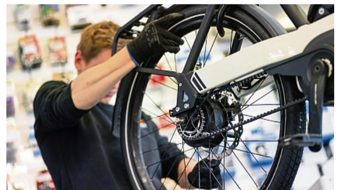
Check: Wer ein gebrauchtes E-Bike kaufen will, sollte sich das Wunschobjekt genau anschauen oder bei einem vertrauenswürdigen Händler kaufen.

seriös ist, lässt sich anhand von Siegeln wie Trusted Shops oder Trustpilot checken“, sagt H. David Koßmann. Ebenfalls wichtig: vollständige und korrekte Angaben im Impressum und funktionierende Telefonnummern.