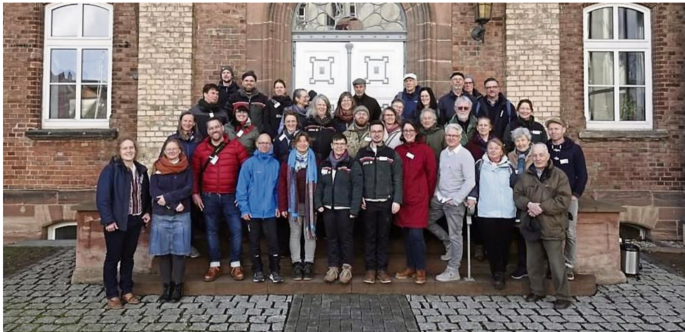
Engagiert für die Natur: Die Naturparkführer des Geo-Naturparks Frau-Holle-Land begleiten Gäste durch die Landschaft der Region.

Von den blühenden Kirschbäumen im Frühling über die Mohnfelder des Sommers bis hin zu den leuchtenden Herbstwäldern, das Veranstaltungsangebot deckt die gesamte Bandbreite der regionalen Naturschätze ab. Neben bewährten Formaten wie Vogelstimmenwanderungen und der „Glück-Auf“-Radtour gibt es auch einige Neuheiten. So werden in Rockensüß besondere botanische Raritäten vorgestellt, während in einem anderen Angebot die Heilkraft der Kirschen thematisiert wird. Für sportlich Ambitionierte gibt es eine geführte Radtour von Wanfried über Großstöpfer nach Frieda. Ein Höhepunkt des neuen