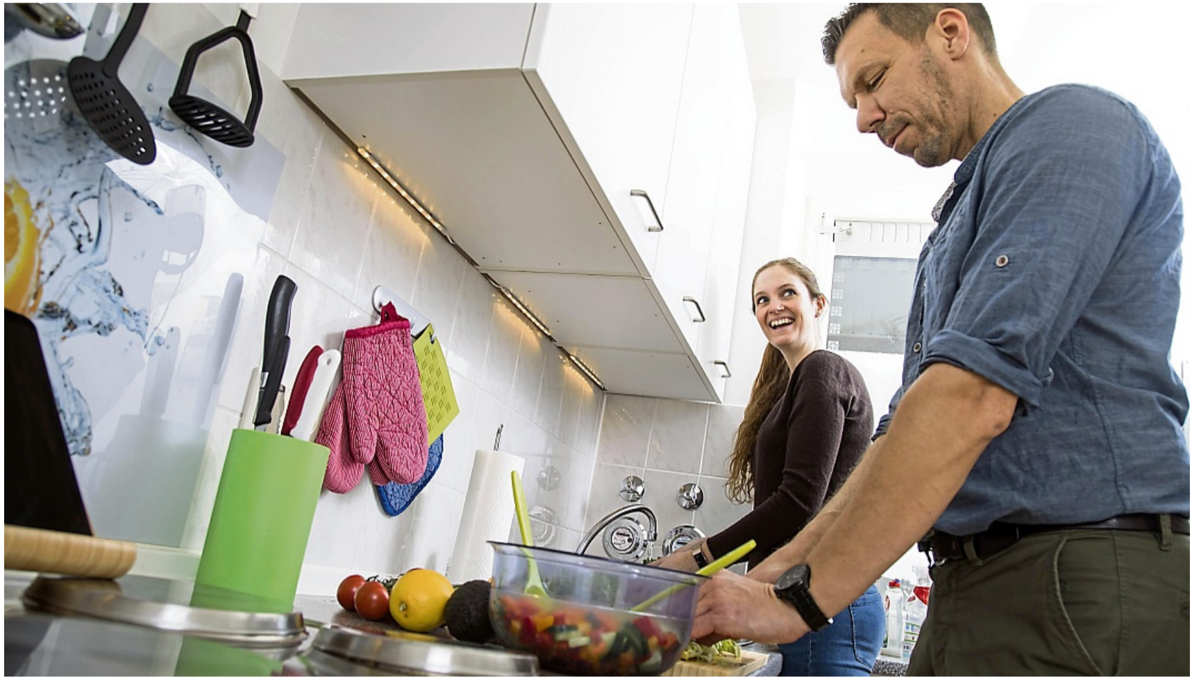
Wer den Nieren etwas Gutes tun möchte, setzt beim Kochen auf viel Gemüse, Hülsenfrüchte und gesunde Fette.

Wer auf Dauer viel Salz zu sich nimmt, riskiert Bluthochdruck – und der belastet die Nieren. Die Deutsche Gesellschaft für Ernährung (DGE) rät, höchstens sechs Gramm Kochsalz am Tag zu sich zu nehmen – das entspricht etwa einem Teelöffel. Die Empfehlung der Weltgesundheitsorganisation