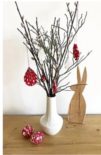
Selbstgemachter Osterschmuck: Aus buntem, gefaltetem Papier werden Anhänger für den Osterstrauß.

Einfache Variante: Wer mit jüngeren Kindern bastelt oder wenig Zeit hat, kann auch einfach ein Hasengesicht oder eine Häschenform aus dem Karton ausschneiden. „Den Karton