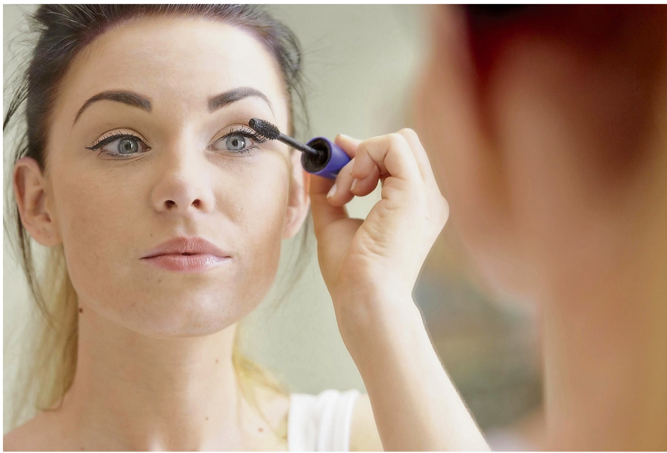
Perfekter Schwung ohne Klümpchen: Zickzack-Bewegungen nach oben verteilen die Wimperntusche gleichmäßig.

Ein häufiger Fehler ist das Auftragen einer zu dicken Schicht Mascara. Besser ist es, die Farbe in mehreren dünnen Schichten aufzubauen. So lässt sich die Klümpchenbildung vermeiden und die Wimpern wirken definierter. Besonders wichtig ist laut Wythe, dass die Farbe nicht nur von unten, sondern auch von oben aufgetragen wird, um helle Wimpern-