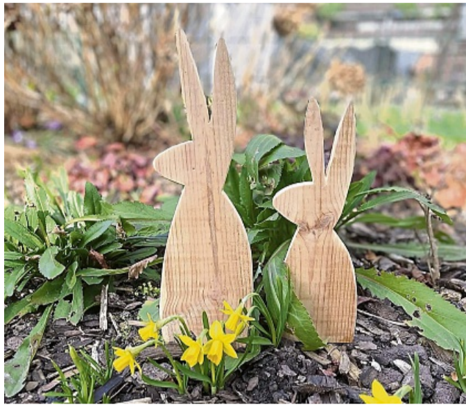
Die Osterhasen aus Palettenholz eignen sich für drinnen und draußen.

Alter Versandkarton – am besten unbedruckt, Bastelkleber, Schere, Nadel und Faden, Acrylstift, Bommel/Pompons