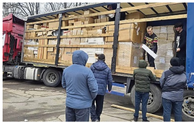
Das Team , das durch ukrainische Helfer verstärkt wurde, belädt den Lastwagen in Eschwege.

Der Lkw ging nach Erledigung aller Formalitäten, die auch erst vom Team gelernt werden mussten und nur in enger Zusammenarbeit mit Mitarbeitern in Kiew umgesetzt