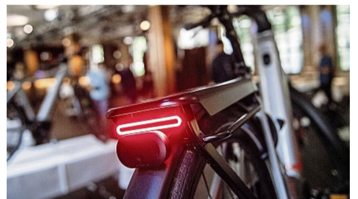
Alles klar? Ein Pedelec ist auch immer ein normales Fahrrad, sprich beim Gebrauchtkauf müssen auch alle normalen Komponenten wie etwa die Beleuchtung ordnungsgemäß funktionieren.

Es gibt stationäre Fachgeschäfte und Online-Shops, die gebrauchte Elektrofahrräder anbieten. „Ob ein Online-Shop