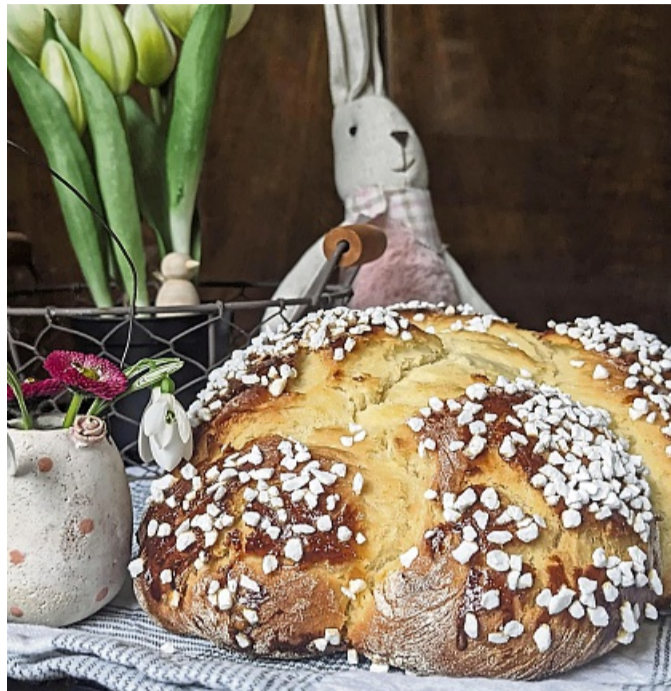
Ein luftiger Hefezopf, reichlich mit Hagelzucker bestreut, darf an Ostern nicht fehlen.

2. 500 g Mehl in eine große Schüssel geben, mit den Händen eine Kuhle in der Mitte formen und die „Hefemilch“ hin-