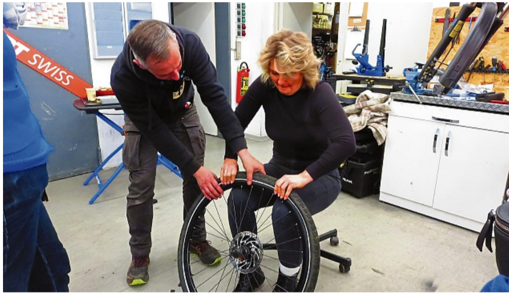
Auch das Wechseln eines Fahrradschlauchs gehörte zum Programm.