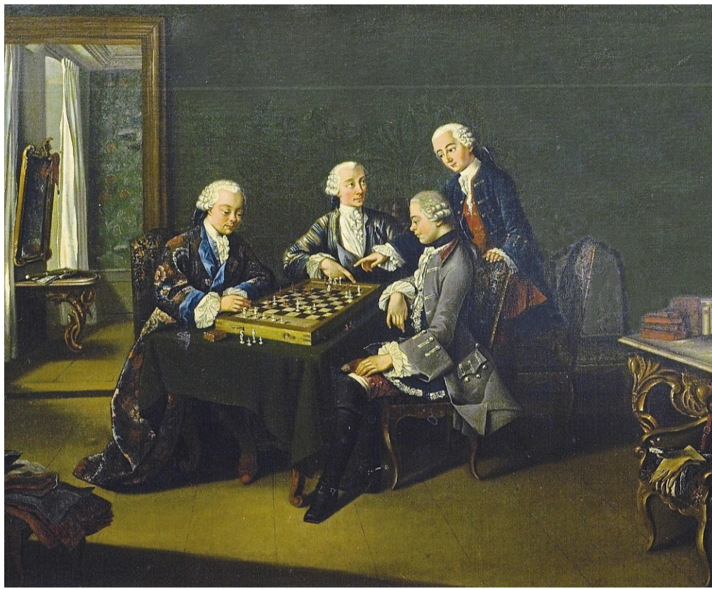
Die Prinzen beim Schachspiel ist der Titel dieses Bildes von Johann Valentin Tischbein. Es sind die Prinzen zu Hohenlohe-Kirchberg.

Die besondere Bedeutung Johann Valentins Tischbeins (1715-1768) rührt nach ihren Worten nicht nur von seinem eigenen künstlerischen Schaffen her, sondern auch von der Tatsache, dass er als erster in der Familie erfolgreich den Weg zur Malerei einschlug. „Er hat dann seinen Brüdern, Söhnen, Neffen und Nichten ebenfalls Zugang zu dieser Welt verschafft“, sagt die Kunsthistorikerin. „Die zu-