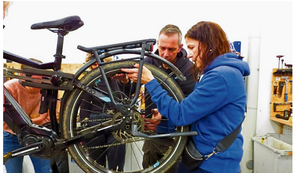
Bei dem Schrauberinnenkurs in Frankenberg lernten die Teilnehmerinnen unter anderem, wie man die Kette am Fahrrad löst und auch reinigt.

Röth kündigte eine geplante Kidical-Mass für den 25. Mai in Korbach an: Dabei handelt es sich um eine Fahrraddemo, die auf die Belange von Kindern im Straßenverkehr aufmerksam macht. nh/jpa