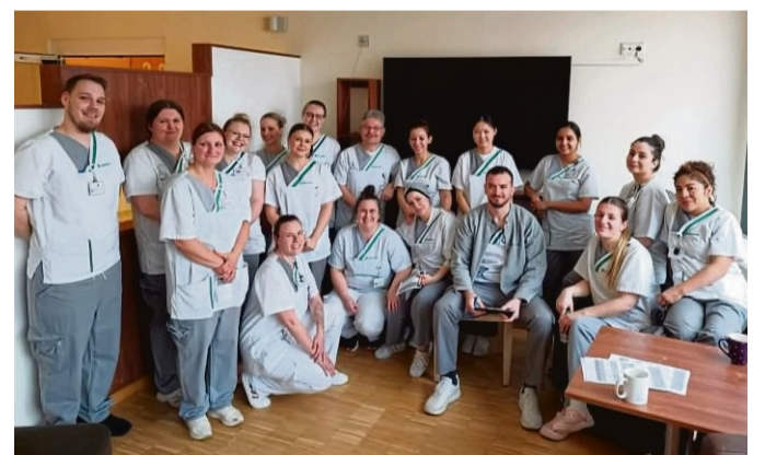
Die Auszubildenden haben eine Station der Asklepios Stadtklinik geleitet.

Durch die eigenverantwortliche Übernahme dieser anspruchsvollen Aufgaben konnten die Auszubildenden wertvolle Kompetenzen entwickeln. Neben der praktischen Anwendung pflegerischer und medizinischer Kenntnisse standen insbe-