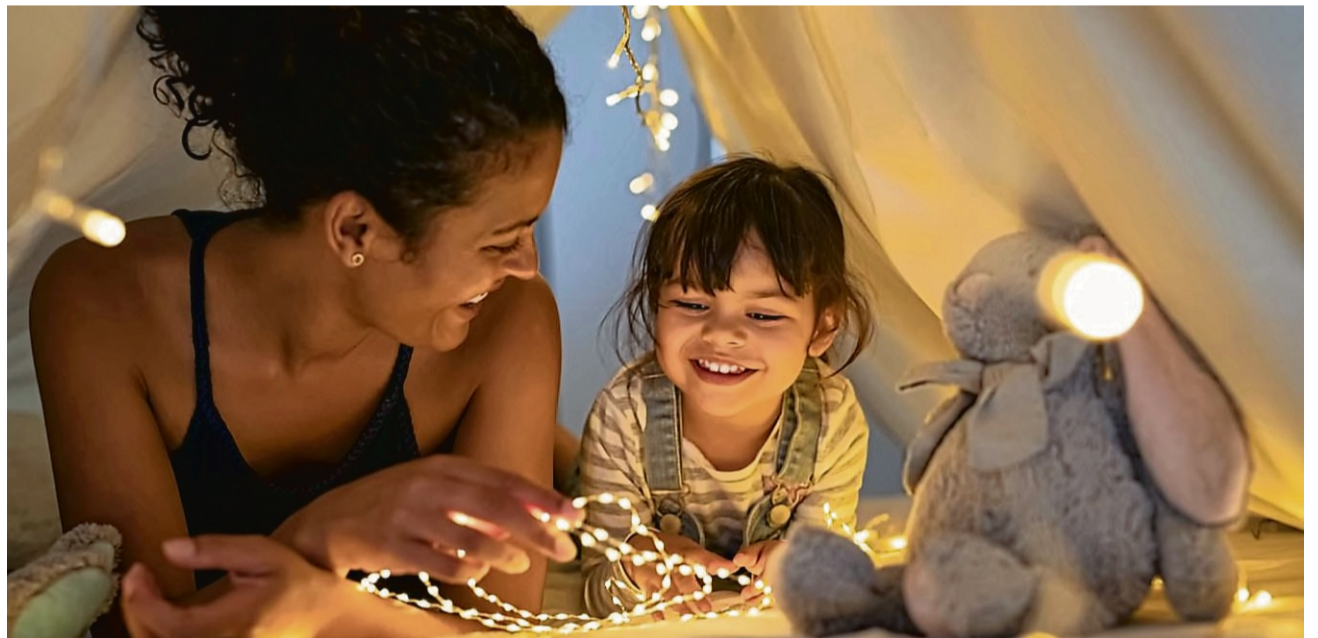
Hilfreiche Beratung bei der Umsetzung eines Wärmepumpenprojektes ist der Grundstein für eine behagliche Wärme Zuhause.