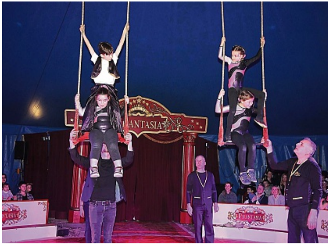
Wagten sich aufs Trapez: Auch artistische Einlagen gehörten zum Programm, das die Burgsitzschüler und Kitakinder präsentierten.