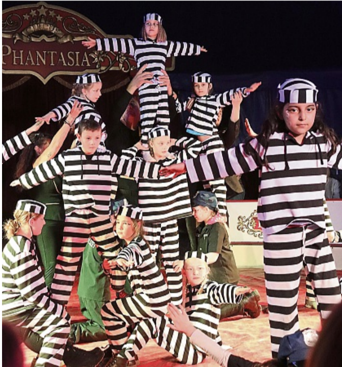
Menschliche Pyramide: Der Zirkus hatte auch für jedes Kind ein Kostüm im Gepäck.