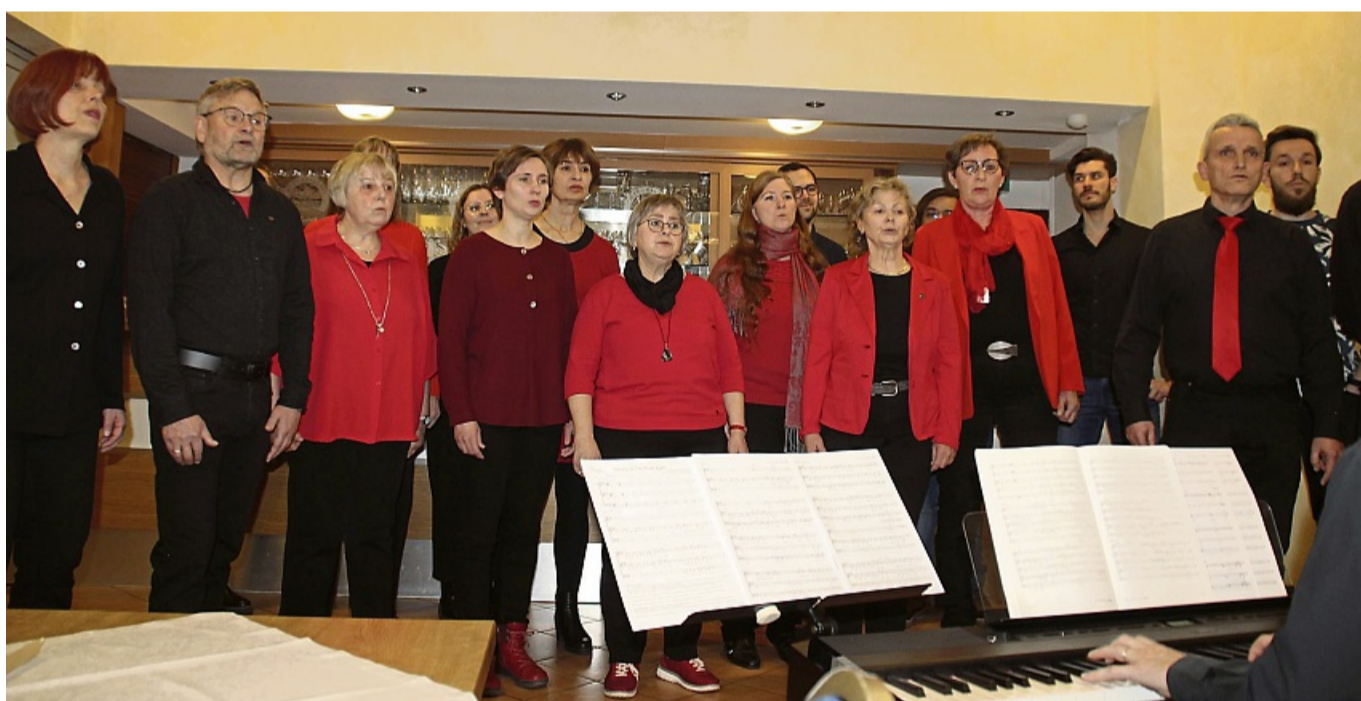
Herzlich willkommen: Der Gesangverein 1889 Grifte mit seinen Chören Niu Quaia/Young Voices begrüßten die Delegierten des Kreissängertages des Sängerkreises Heiligenberg.