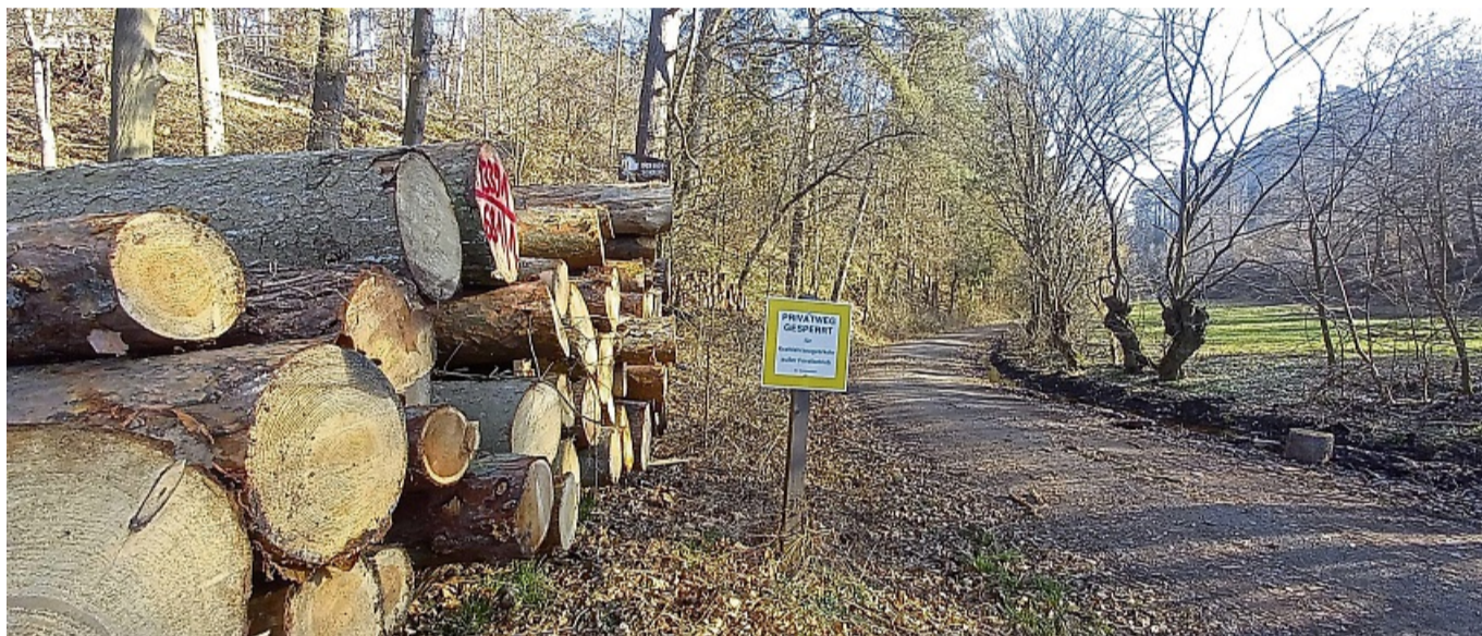
Auf absehbare Zeit sind aus dem Edertaler Wald (hier Wellen) keine Gewinne aus Holzverkauf mehr zu erwarten.