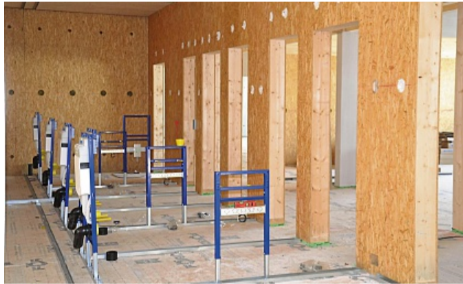
Einzelne Toiletten ohne Vorraum sind eine Empfehlung der Montag-Stiftung.