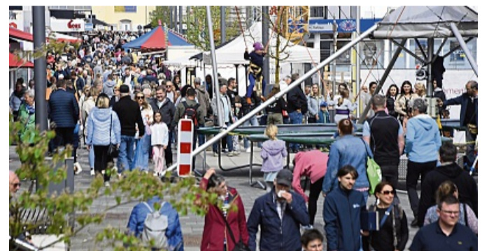
Immer ein Besuchermagnet: Das Frühlingsfest der Hanse lockt zahlreiche Gäste in die Korbacher Innenstadt.

Die Veranstaltung richtet sich an die ganze Familie und lädt zum gemeinsamen Einkaufsbummel durch die Hansestadt ein.