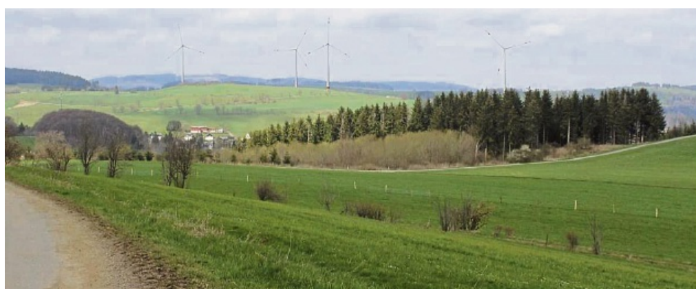
Zentral im Upland zwischen Usseln, Rattlar, Willigen und Schwalefeld soll ein Windpark entstehen – hier der Blick vom Hang des Kahlens Pöns bei Usseln.