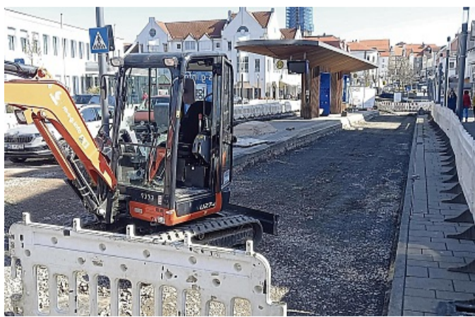
Die Rendezvous-Haltestelle „Treffpunkt“ des Stadtbusses wird umfangreich saniert.

Die beauftragte Firma schneidet dann Dehnungsfugen in den Beton, damit er nur an den dafür vorgesehenen