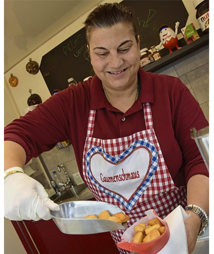
Für jeden Geschmack etwas dabei: Fliegende Händler bieten Spezialitäten aller Art an.

Korbach – Die Hansestadt Korbach steht am ersten April-Wochenende ganz im Zeichen des Frühlings. Am Samstag, 5. April, und Sonntag, 6. April, veranstaltet die Korbacher Hanse ihr traditionelles Frühlingsfest mit verkaufsoffenem Wochenende. Besucher können am Samstag von 10 bis 18 Uhr und am Sonntag von 12 bis 18 Uhr durch die Geschäfte bummeln und das vielfältige Rahmenprogramm genießen.