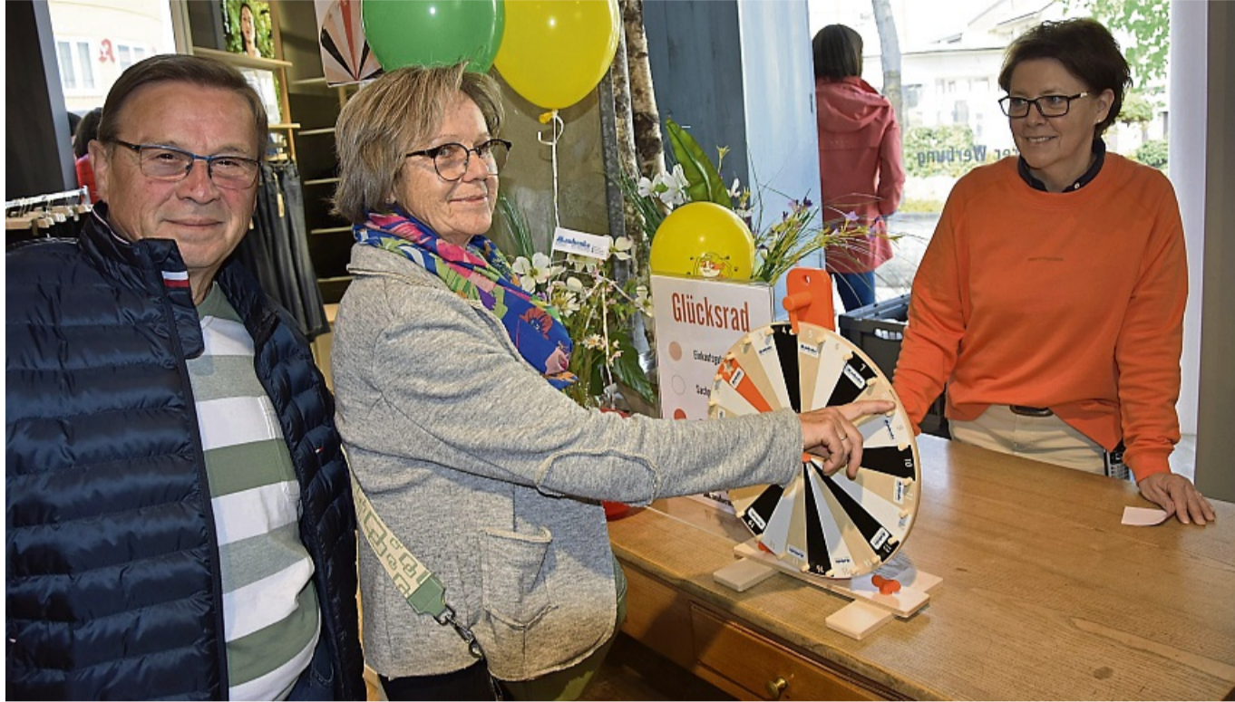
Ein buntes Rahmenprogramm wartet auf die Besucher des Frühlingsfestes am Wochenende.