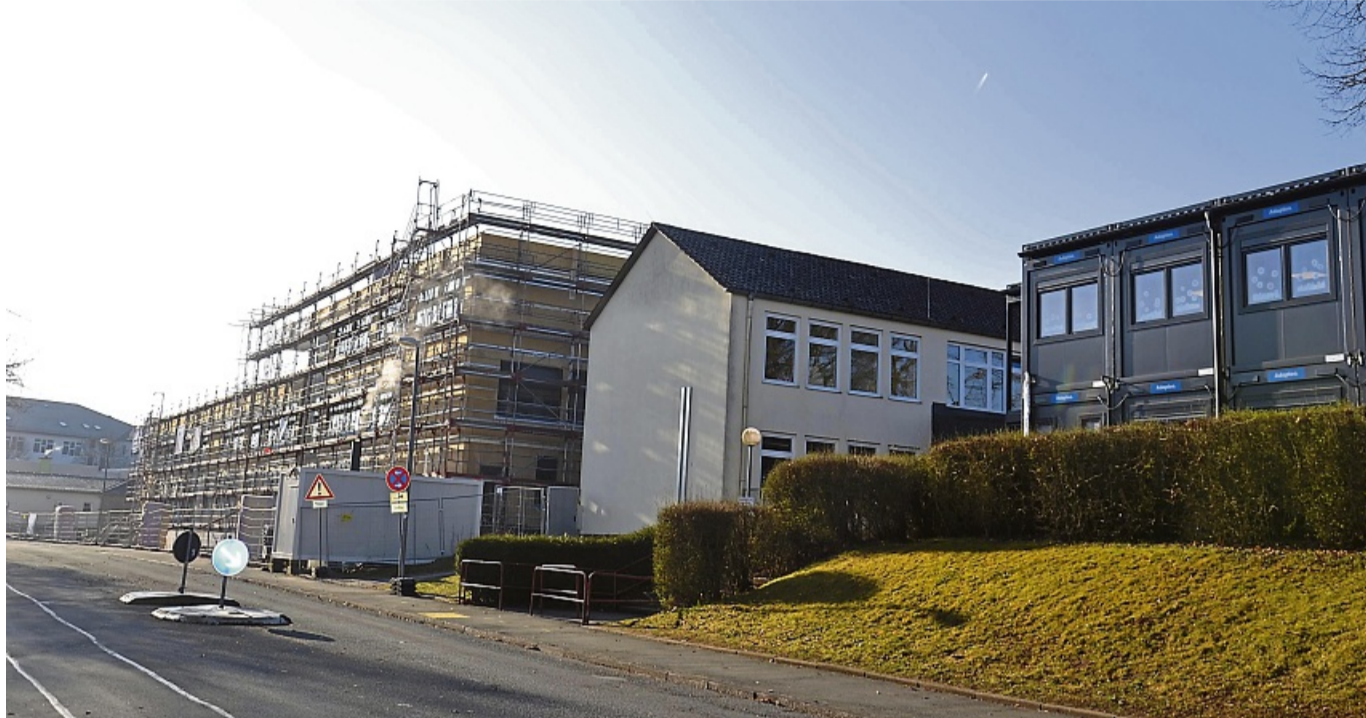
Neubau geht voran: Die Außenwände der Berliner Schule stehen und sind weitgehend dicht.

Auch wenn der längste Teil der Bauarbeiten noch bevorsteht: Erahren lässt sich schon,