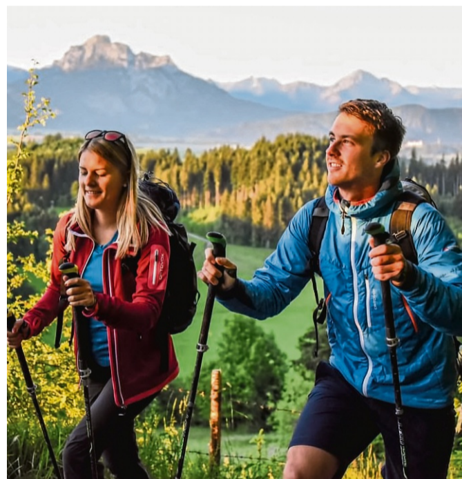
Frühlingserwachen in den Bergen.

An den liebevoll gestalteten Stationen erfahren die Wanderer viel über die Sagen und Mythen der Region.