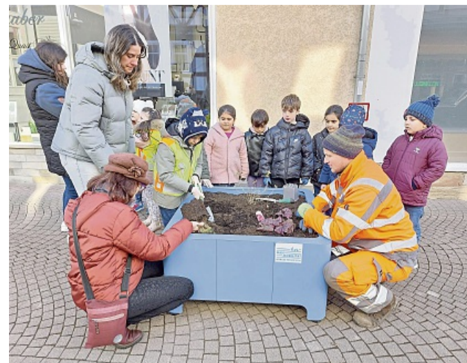
Gemeinsame Pflanzaktion: Kitas und Bauhof bepflanzen die Blumenkästen.

wehr Breitau bereits mehrfach gefördert, unter anderem durch die Beschaffung von Bekleidung für die Kinderfeuerwehr und als Mitsponsor einer Wärmebildkamera für die Einsatzabteilung. Mit ihrer Spende hoffen sie, weitere Mitbürger zu motivieren, die Freiwillige Feuerwehr zu unterstützen.