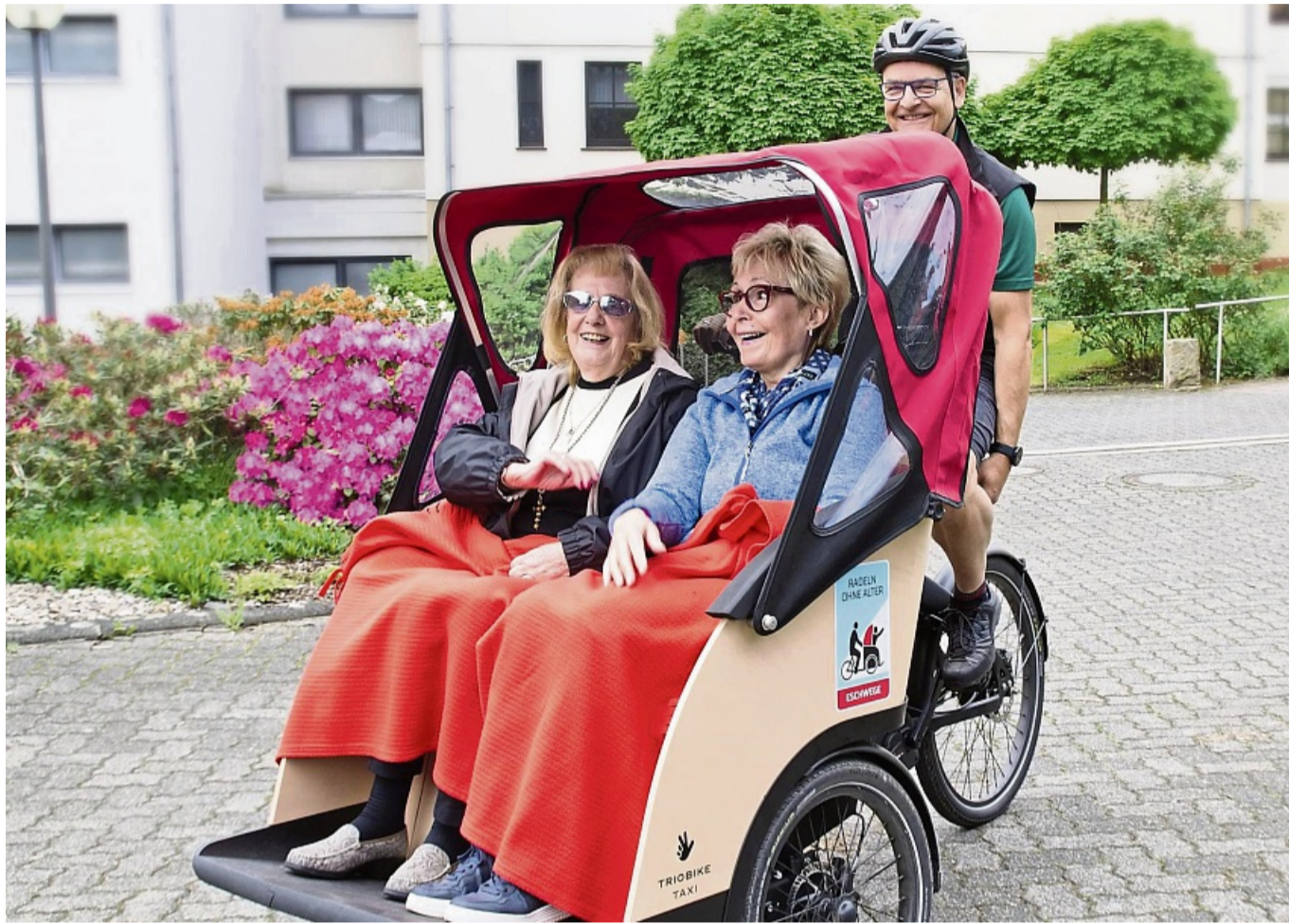
Soll alle Generationen ansprechen: Fahrten mit der Rikscha seien nicht nur eine schöne Möglichkeit, die Umgebung zu erkunden, sondern auch Gelegenheit für soziale Begegnungen.

Dem Austausch zwischen Generationen und der gegenseitigen Unterstützung komme dabei eine besondere Bedeutung zu.