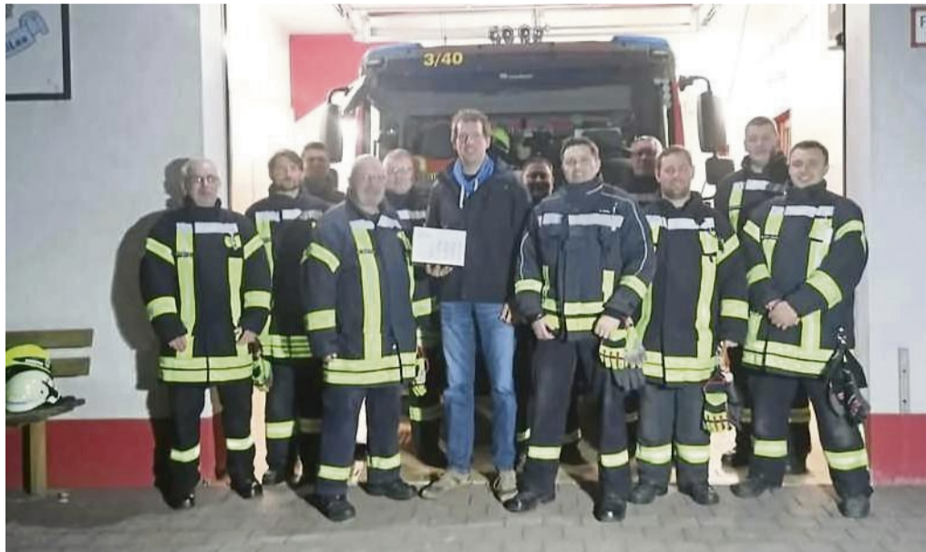
Feuerwehrhaus und Einsatzfahrzeuge in Breitau mit Rauchmeldern ausgestattet

Die Idee zur Anschaffung entstand nach dem verheerenden Brand des Feuerwehrhauses in Treffurt (Thüringen) vor einigen Wochen. Moderne Einsatzfahrzeuge sind mit immer mehr Elektronik, Ladegeräten