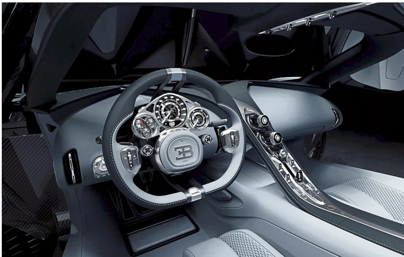
Krieg der Knöpfe und Uhrensammlung: Das Interieur des Hypersportwagens Bugatti Tourbillon dürfte jeden Steampunk in Ver-zückung bringen.

Das Sicherheits-Konsortium Euro NCAP hat daher angekündigt, ihre Bewertungskriterien ab 2026 zu ändern. Damit möchte sie Hersteller aufrufen und ermutigen, „separate, physische Bedienelemente für Grundfunktionen auf intuitive Weise zu verwenden“. Wichtige Bedienelemente wie Blinker, Hupe, Scheibenwischer, SOS-Notruf und Warnblinker sollen möglichst (wieder) als physische Bedienelemente verbaut werden. Die maximal fünf Sterne gibt es dann nur noch mit Tasten. Die Tests sind aber nicht gesetzlich vorgeschrieben, sondern dienen Verbrauchern zur Orientierung.