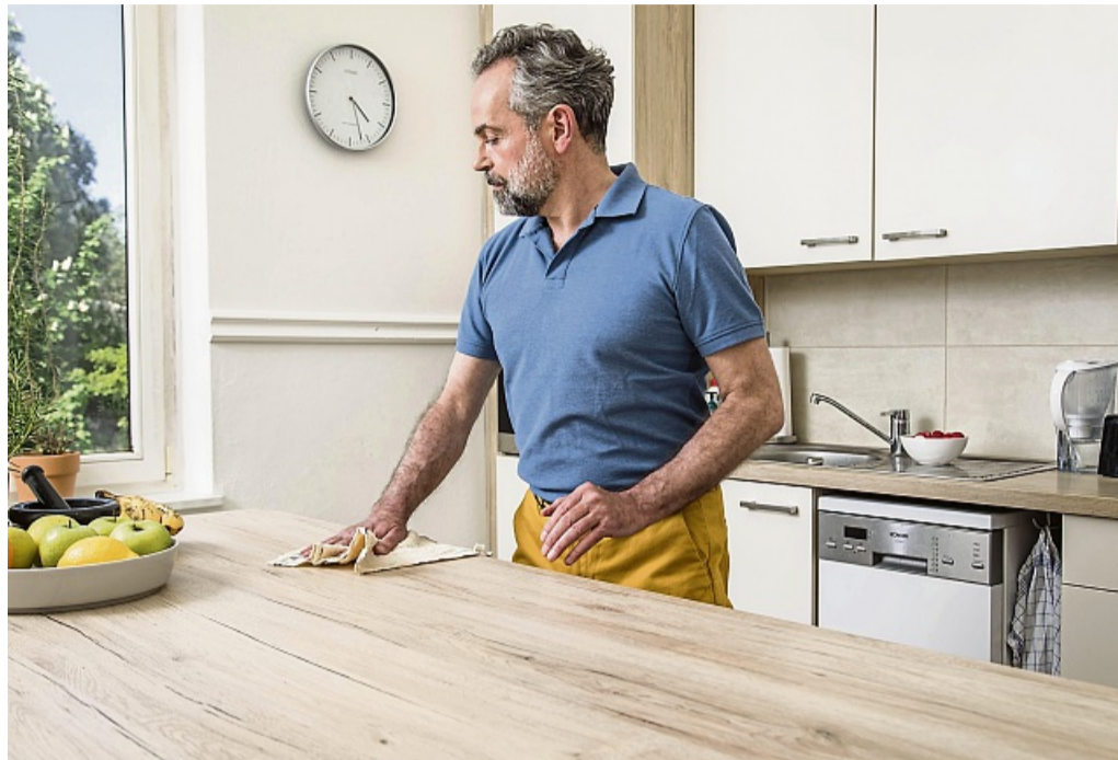
Mikrofaserlappen sorgen dafür, dass beim Putzen nicht zusätzlich Staub aufgewirbelt wird.

Schlafen zum Beispiel auch Geschwisterkinder im Raum