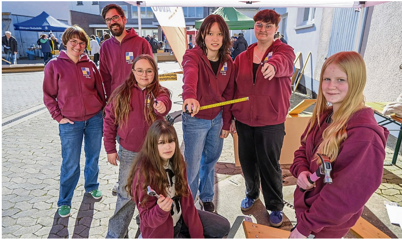
Die Courage-Gruppe der Brüder-Grimm-Schule Eschwege war vor Ort, um ihre Bank gegen Ausgrenzung aufzubauen und anschließend mit zur Schule zu nehmen.