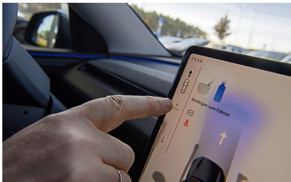
Moderne Zeiten beim Vor und Zurück: Wechsel des Fahrmodus mit dem Touchscreen im Tesla Model Y «Juniper».

Und beim neuen Hypersportwagen Tourbillon von Bugatti setzt der französische Hersteller nahezu vollständig auf analoge Anzeigen. Kleiner Nachteil für alle, die so etwas mögen: Trotz des Preises von 4,52 Millionen Euro ist der Tourbillon längst ausverkauft. tmm