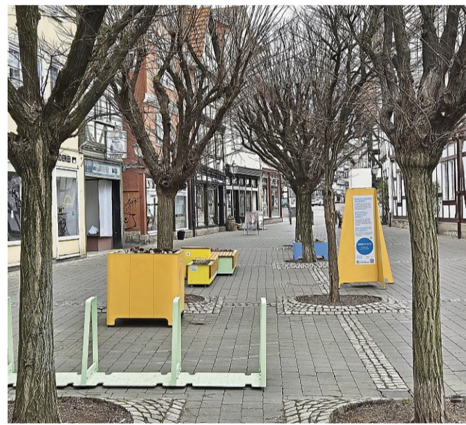
Vor dem Rathaus gibt es alle Varianten: Sitzgelegenheiten, Pflanzkübel und Fahrradständer.

Da die Möbel zum Ausprobieren neuer Standorte dienen, können sich alle Bürgerinnen und Bürger an der Bewertung der Möbel und Standorte beteiligen: Über QR-Codes an den Möbeln können direkt Rückmeldungen gegeben werden. Diese Feedbacks fließen in die zukünftige Gestaltung der Innenstadt ein. ts/esr