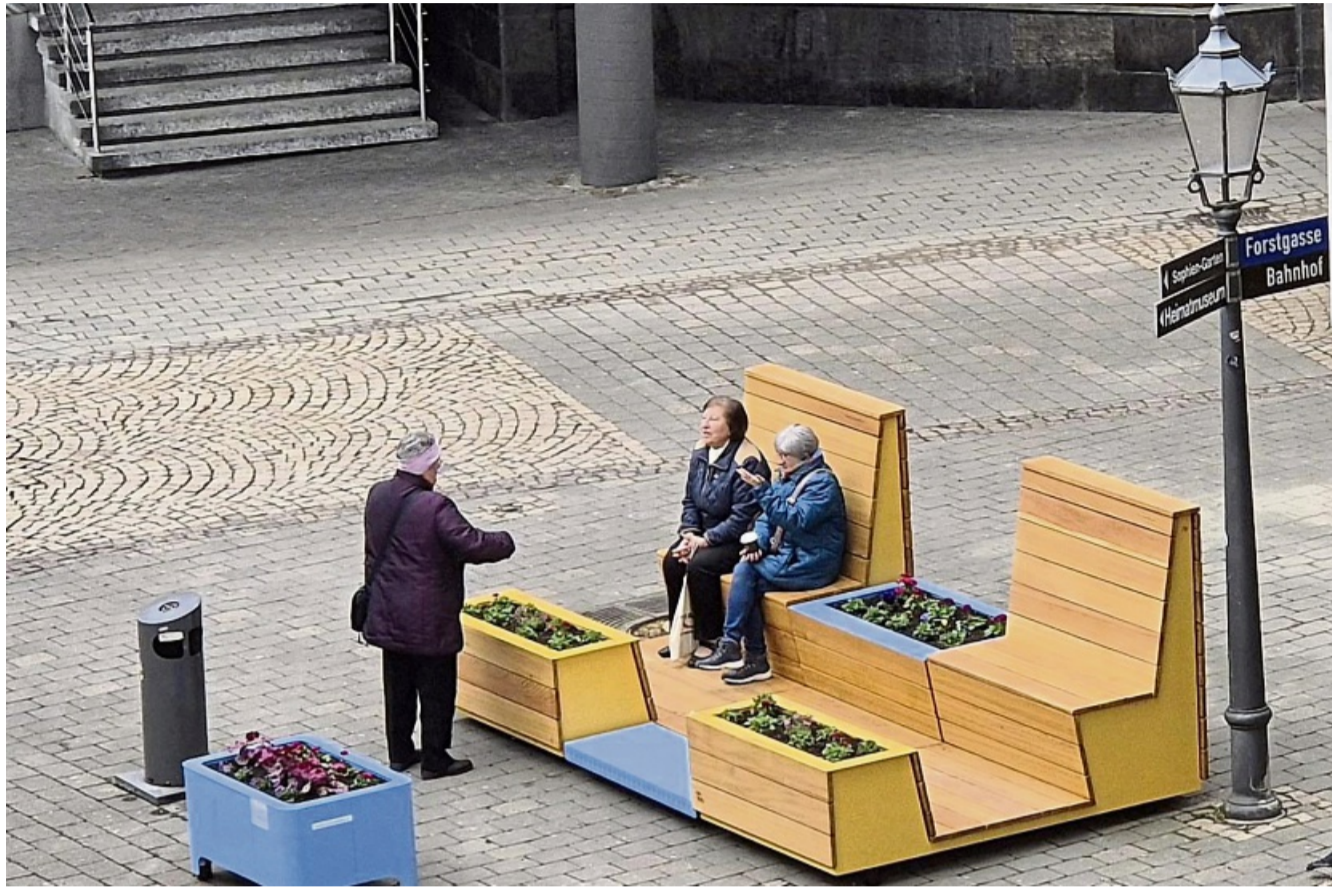
Wird von Anfang an gut angenommen: Das Sitzmöbel mit Bepflanzung an der Ecke Stad/Forstgasse ist fortwährend besetzt und dient der Kommunikation.

Es handelt sich um Leihmöbel, die mehreren Gemeinden in Hessen kostenfrei von der AGNH zur Verfügung gestellt werden. Unter dem Namen „Straßen neu entdecken“ ist dies ein Projekt des Hessischen Ministeriums für Wirtschaft, Energie, Verkehr, Wohnen und ländlichen Raum im Rahmen der Arbeitsgemeinschaft Nahmobilität Hessen zur Verbesserung der Aufenthaltsqualität und zur lokalen Stärkung des Fußverkehrs, heißt es vonseiten der Stadt Eschwege. „Die City-Decks-Möbel bieten eine erste Möglichkeit, den öffentlichen Raum auf eine neue Weise zu erleben“, berichtet die Sprecherin der Stadt Eschwege, Scarlett Grebestein. Diese Leihmöbel sollen bisher wenig attraktive Flächen mit Sitzgelegenheiten, Pflanzkübeln und