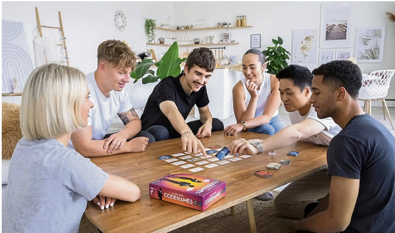
Verkaufsschlager: Das Spiel «Codenames» kam in unterschiedlichen Variationen - auch als erfolgreiche digitale App - heraus und ist mittlerweile in 47 Sprachen verfügbar.

Das Spiel vom tschechischen Autor Vlaada Chvátil wurde zum Verkaufsschlager, kam in unterschiedlichen Variationen - auch als erfolgreiche App - heraus und ist mittlerweile in 47 Sprachen verfügbar. Alle Varianten zusammen wurden nach Verlags-Angaben weltweit