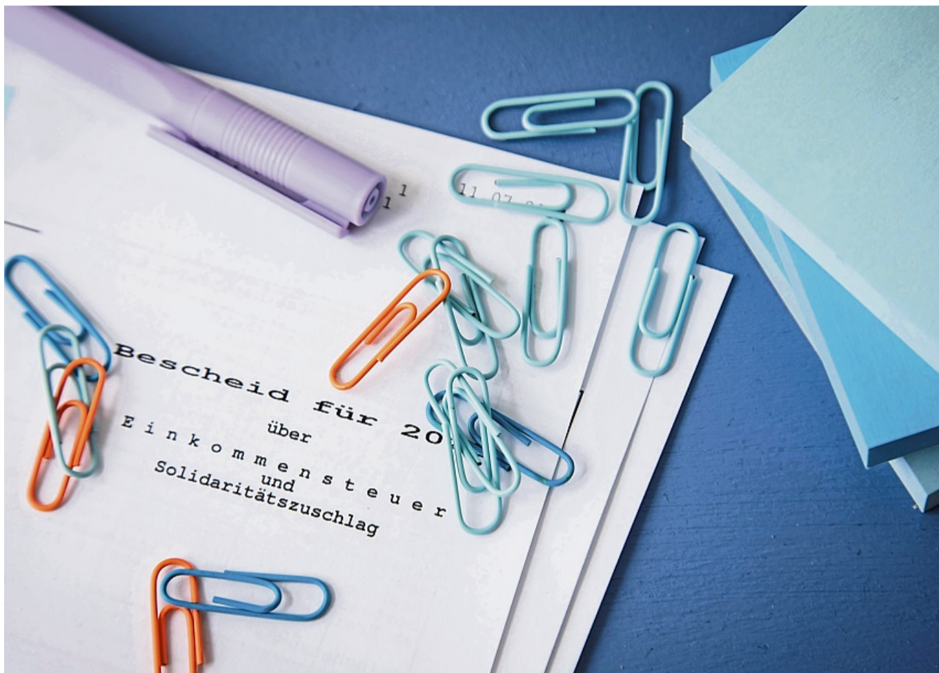
Damit der Steuerbescheid auch korrekt wird, sollten Steuerzahlerinnen und Steuerzahler in ihrer Steuererklärung alle relevanten Einnahmen und Ausgaben angeben.

Beiträge für die Riester-Rente lassen sich in der Steuererklärung als Sonderausgaben bis maximal 2.100 Euro geltend machen. Von dieser Summe zieht das Finanzamt erhaltene Zulagen ab. „Fällt die steuerli-