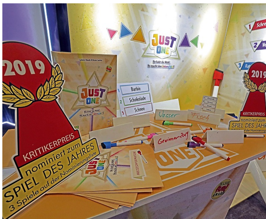
Das Spiel «Just One» wurde 2019 zum «Spiel des Jahres» gewählt.