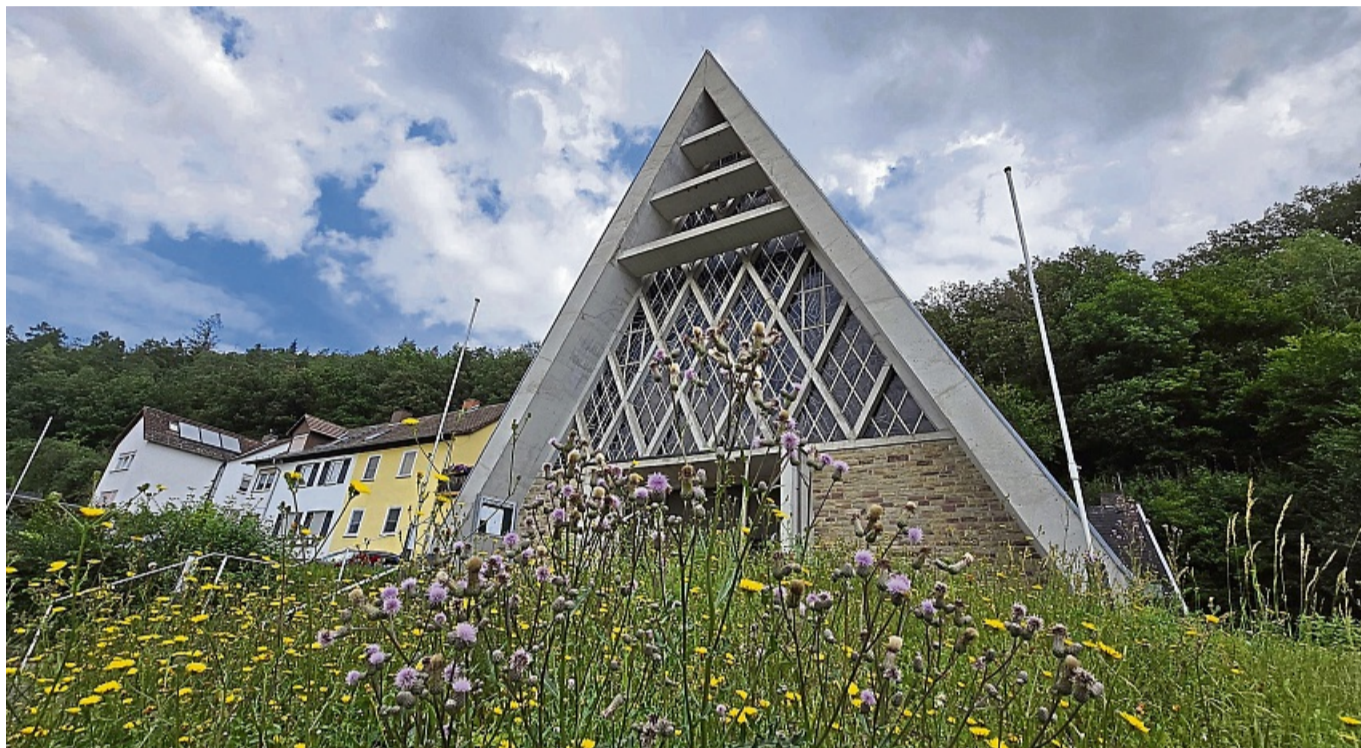
Im Angebot auf Ebay-Kleinanzeigen: die katholische Kirche in Grebendorf. Die Kirche muss sich von dem Gotteshaus trennen, die Profanierung fand im September vorigen Jahres statt.

Alle drei Gotteshäuser stammen aus dem Ende der 1950er-beziehungsweise aus den 1960er-Jahren und wurden im September vorigen Jahres profaniert – das heißt in einer Messe entweiht. Die beiden Kirchengebäude in Grebendorf und Abterode sind architektonisch klare Vertreter des sogenannten Brutalismus – eine extrem nüchterne, schnörkellose und funktionale Form- und Gestaltungsrichtung, die typisch für den Zeitgeist der Nachkriegsepoche steht. Lediglich bei der Kirche in Richelsdorf handelt es sich um eine kleine klassische Holzkirche.