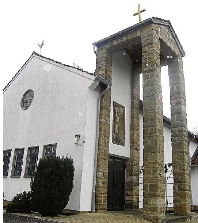
Zu verkaufen: die katholische Kirche Abterode.

An den Kauf eines ehemaligen Kirchengebäudes knüpft die Kirche trotz der Profanierung jedoch einige Bedingungen. Wie Pfarrer Mario Lukes sagt, gibt es einige Klauseln in den Kaufverträgen. So dürften aus den ehemaligen Kirchen keine okkulten Stätten oder Bordelle werden.