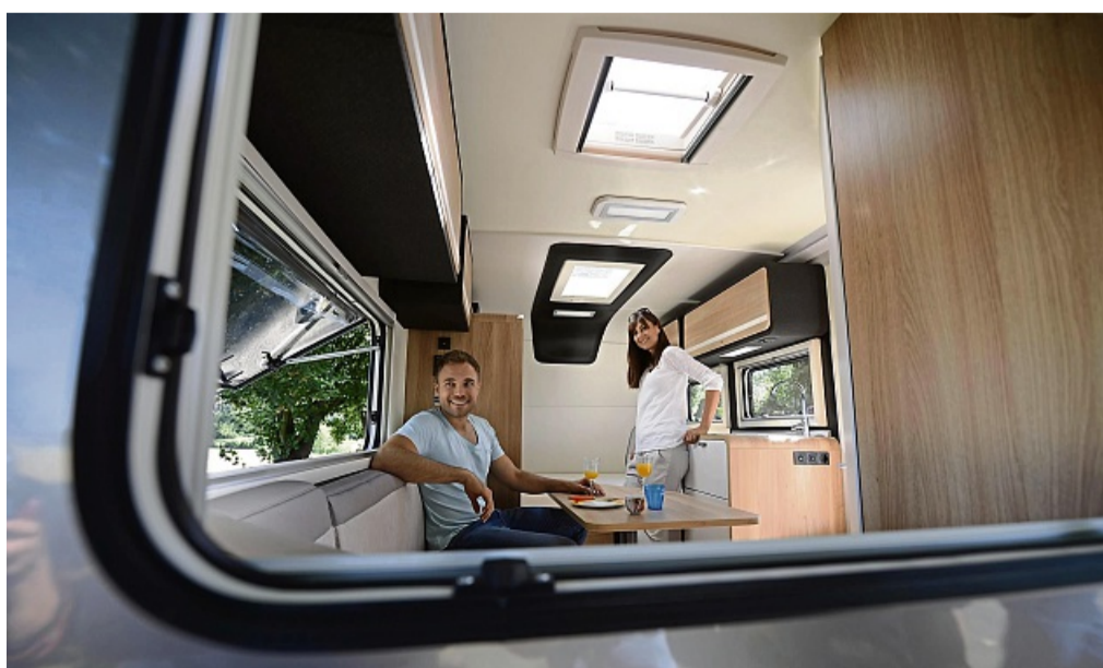
Technikcheck und Grundreinigung sind im Frühjahr nötig bevor es auf die erste Tour geht.

Wer die Batterie über den Winter ausbaute, sollte sie auf ihren Ladungszustand kontrollieren und gegebenenfalls nachladen. Wer sie an ein Ladungserhaltungsgerät geklemmt hat, kann sich letzteres in der Regel vor dem Einbau sparen. Dann gilt ein Blick den Füllständen der Flüssigkeiten wie Motoröl und Kühlwasser sowie der Bremsflüssigkeit.