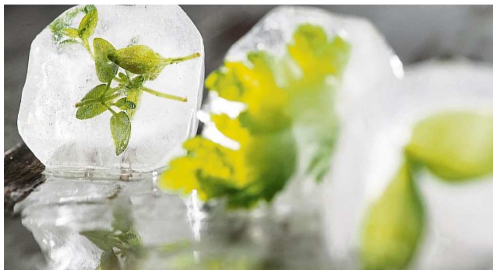
Auch Kräuter lassen sich gut einfrieren – hier sogar als besonderer Clou in einem Eiswürfel.