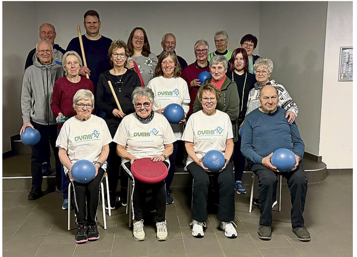
Besteht seit 40 Jahren: Jeden Donnerstagabend trifft sich die Morbus-Bechterew-Selbsthilfegruppe in Korbach.

„Bewegung, Begegnung und Beratung“ ist der Leitspruch des Selbsthilfenetzwerks für Menschen mit Morbus Bechterew – und jeden Donnerstagabend setzt die Korbacher Gruppe mit großer Motivation,