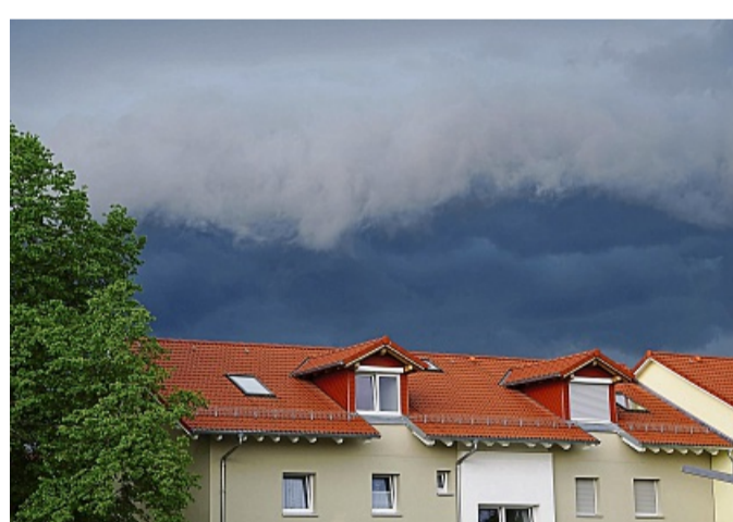
Bei der Planung und dem Bau eines neuen Eigenheims sollte man an Schutz und Sicherheit bei Starkregen oder Hitzewellen denken.

Wichtig ist eine fachgerechte Planung und Bauausführung in der Hausgründung, denn Baumängel in diesem Bereich können teure Schäden nach sich ziehen. Sinnvoll ist es daher, sich bereits in der Planungsphase unabhängig beraten zu lassen. Bauherrenberater des BSB bieten zusätzlich eine baubegleitende Qualitätskontrolle an, um eventuelle Mängel frühzeitig zu erkennen und spätere Schäden zu vermeiden. Unter www.bsb-ev.de gibt es