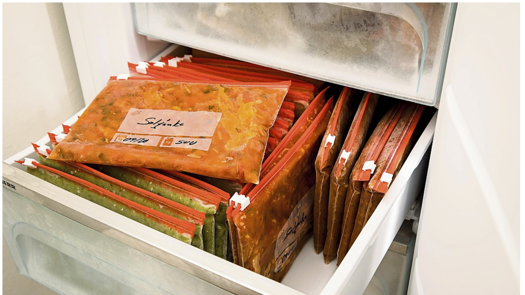
Portionsweise eingefrorene Essensreste ersparen an anderen Tagen das Kochen.

Laut Ute Gomm bleibt die Lebensmittelqualität eingefroren sehr gut erhalten. „Man darf sich aber nichts vormachen: Auch bei minus 18 Grad finden weiterhin Stoffwechselprozesse in den Lebensmitteln statt und beispielsweise Vit-