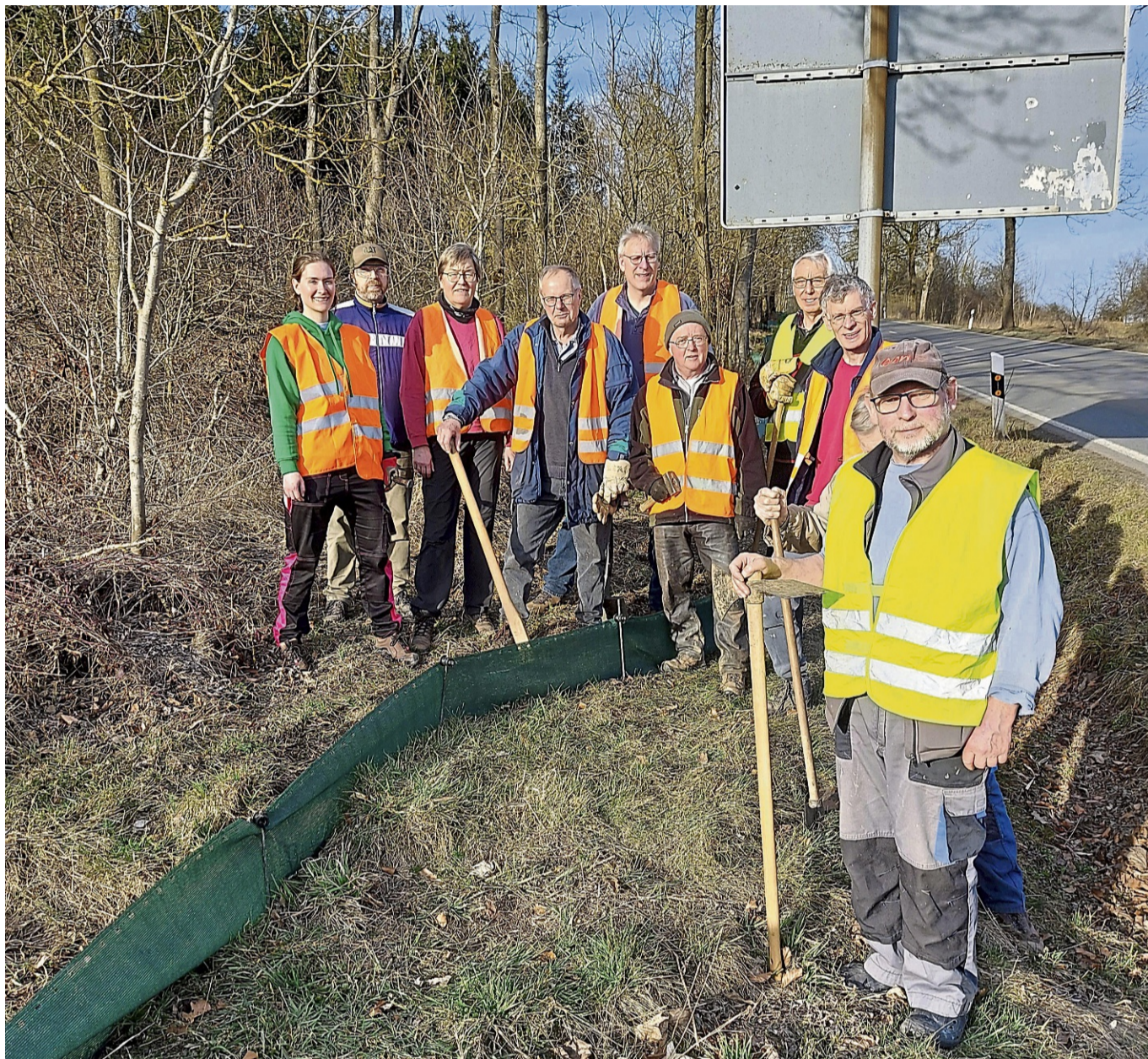
Mitglieder der Korbacher NABU-Gruppe haben auch 2025 wieder einen Zaun am Wald zwischen Lengefeld und Eppe aufgebaut, um Amphibien zu schützen. Seit 1978 sind sie dort ehrenamtlich aktiv, um die Tiere vor dem Straßentod zu retten.

Zur Fortpflanzung kehren viele Amphibienarten an ihr Geburtsgewässer zurück. Die Winterquartiere wie Hecken, Wälder, aber auch Gärten liegen teilweise weit entfernt von