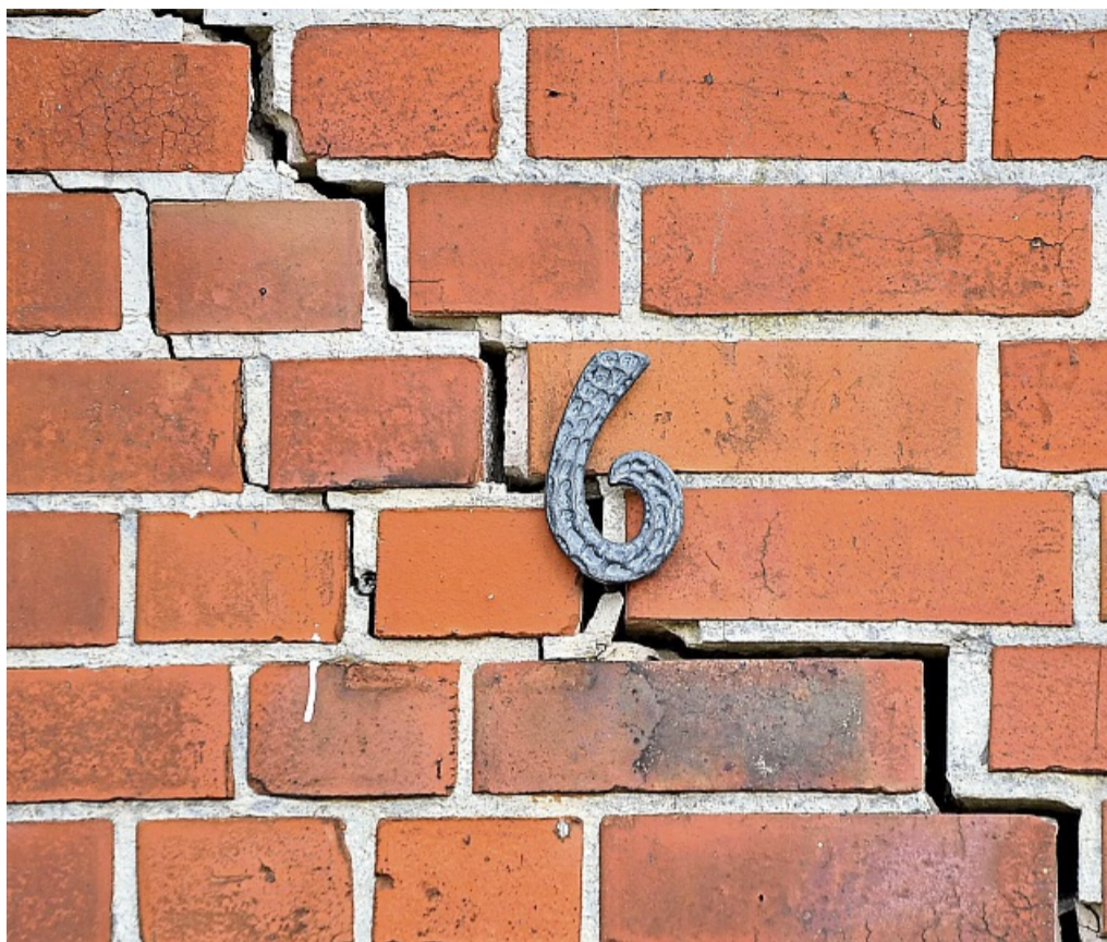
Tiefe Risse in der Fassade – viele Schäden entstehen über eine längere Zeit und selten nur durch etwas Frost im Winter.

Nicht immer besteht die Notwendigkeit, sofort zu handeln. Befindet sich eine grün-graue Algenschicht auf der Fassade? Dann ist dies zwar unschön, aber kein Grund zur Sorge. „Im