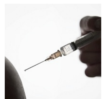
Ein Großteil der Krankenkassen zahlt die Kosten für Reiseimpfungen in vollem Umfang.

Es gilt: Damit die Krankenkasse die Kosten übernimmt, sind laut dem Bericht eine ärztliche Empfehlung und fast im-