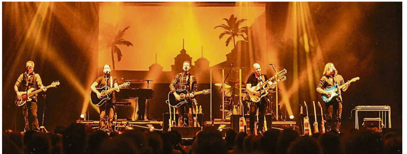
Ultimate Eagles, Eagles-Coverband

Die Bandmitglieder sind alle Profis, die ihre Bühnenauftritte mit Größen wie Joe Cocker, Paul Young, Roger Daltrey, Bonnie Tyler, Tom Jones und auch Queen krönten. Einige Musiker der Band arbeiteten zusammen mit Barbara Streisand, Janet Jackson, Status Quo und Iron Maiden. Für die Show gibt es auch ein begrenztes Sitzplatzangebot. Karten gibt es über Reservix und Eventim, ab 38 Euro. Beginn 20 Uhr, Einlass 18.30 Uhr. Die Veranstaltung findet im Rahmen der Reihe „Die Schwalm rockt“ statt. aqu