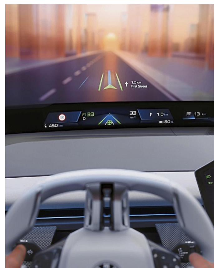
Alles im Blick? Nun, zumindest vieles wird im BMW Panoramic iDrive im Head-up-Display angezeigt.