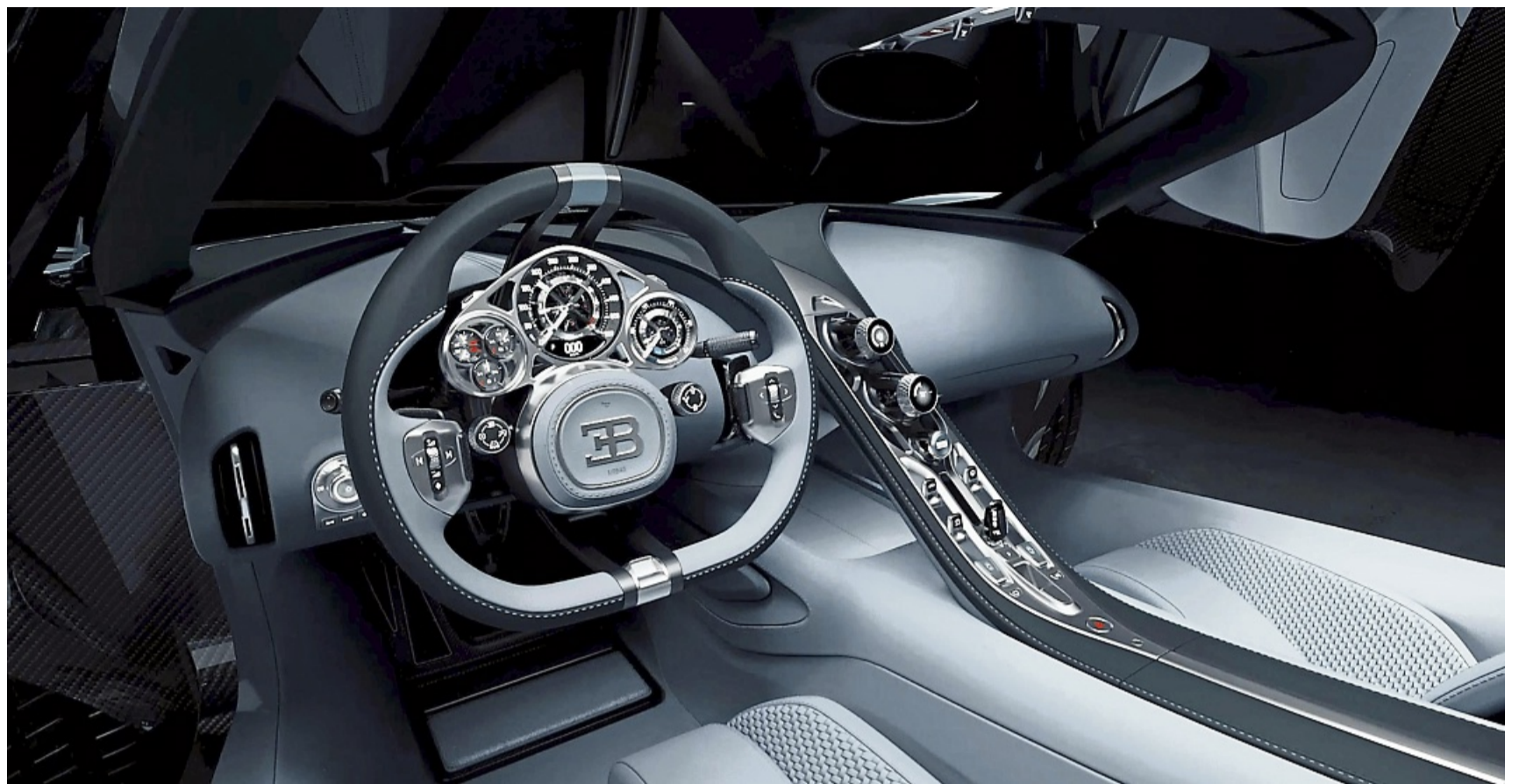
Krieg der Knöpfe und Uhrensammlung: Das Interieur des Hypersportwagens Bugatti Tourbillon dürfte jeden Steampunk in Verzückung bringen.

Das Sicherheits-Konsortium Euro NCAP hat daher angekündigt, ihre Bewertungskriterien ab 2026 zu ändern. Damit möchte sie Hersteller aufrütteln und ermutigen, „separate, physische Bedienelemente für Grundfunktionen auf intuitive Weise zu verwenden“. Wichtige Bedienelemente wie Blinker, Hupe, Scheibenwischer, SOS-Notruf und Warnblinker sollen möglichst (wieder) als physische Bedienelemente verbaut werden. Die maximal fünf