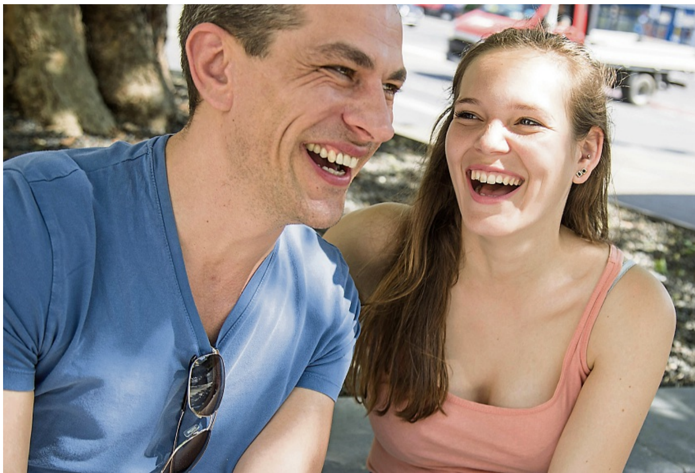
Zwei von fünf Glücks-Bausteinen des PERMA-Modells auf einem Bild: Wir brauchen Beziehungen zu anderen Menschen und positive Emotionen.

Glück: Ganz genau. Wenn wir dauerhaft im Überlebensmodus sind – also in einem Zustand von Stress und Angst –, haben wir biologisch bedingt nur eingeschränkten Zugriff auf unsere Fähigkeiten und unser Potenzial. Das macht uns handlungsunfähig und blockiert uns. Wenn wir aber gut für unser eigenes Wohlbefinden sorgen, haben wir eine ganz andere innere Haltung und können besser auf Heraus-