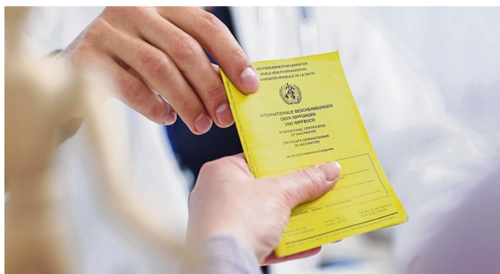
Vor Fernreisen ist ein rechtzeitiger Blick in den Impfpass ratsam. Da das Infektionsrisiko sehr individuell ist, kann man sich bei Fragen auch reisemedizinisch beraten lassen.

Spezialisierte Ärztinnen und Ärzte lassen sich zum Beispiel über das Forum Reisen und Medizin finden, dass eine Online-Suchfunktion nach Postleitzahl oder Ort anbietet. Das Centrum für Reisemedizin hat eine