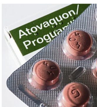
Tabletten mit dem Wirkstoff Atovaquon Proguanilhydrochlorid dienen der Vorbeugung gegen Malaria. Die Prophylaxe mit Tabletten bezuschussen aber 11 der 68 von der Stiftung Warentest untersuchten gesetzlichen Versicherer nicht.

Das Infektionsrisiko ist aber stets individuell – Grunderkrankungen können ebenso ei-