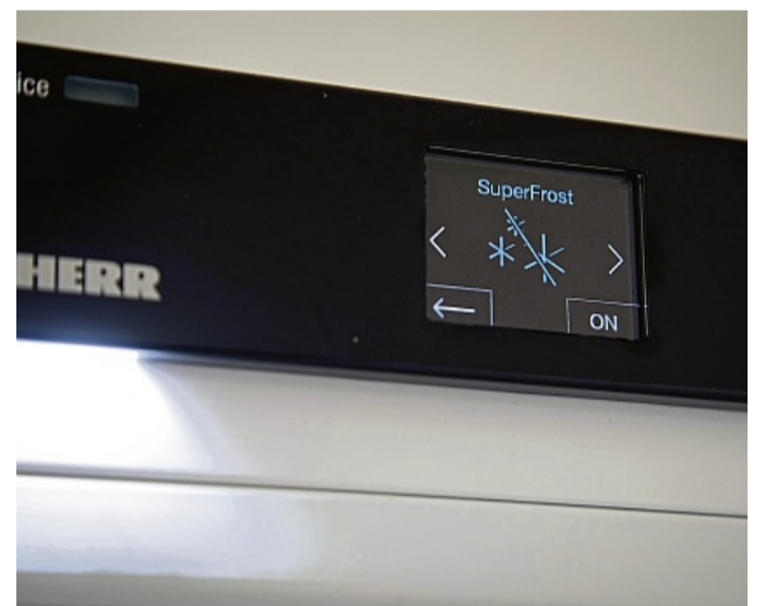
Wer größere Mengen einfrieren will, kann vor dem Einlagern im Gerät eine Kältereserve schaffen.