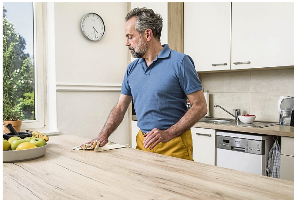
Mikrofaserlappen sorgen dafür, dass beim Putzen nicht zusätzlich Staub aufgewirbelt wird.

Schlafen zum Beispiel auch Geschwisterkinder im Raum