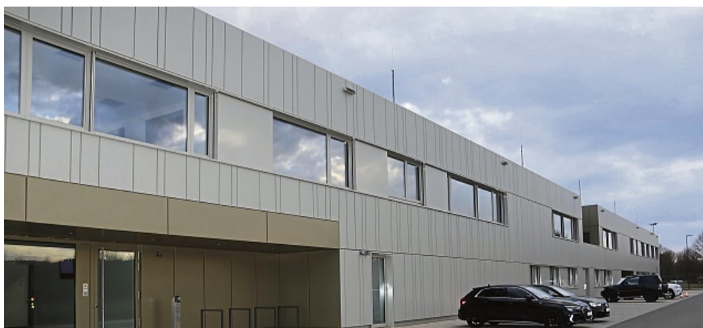
Der neue Feuerwehrstützpunkt kostete am Ende rund 14,5 Millionen Euro. Der neue Stützpunkt ist das bislang größte Bauprojekt der Stadt Frankenberg.