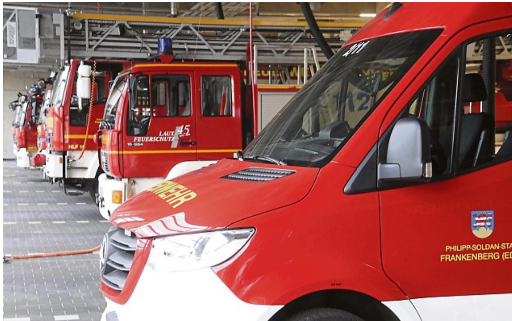
In dem neuen Gebäude ist Platz für 13 Feuerwehrfahrzeuge

Nach anfänglich anvisierten 8,4 Millionen kostete der Neubau letztlich 14,5 Millionen Euro, da sind die noch abzuschließenden Arbeiten bereits enthalten. Das Land Hessen beteiligt sich an dem Projekt mit rund 5,1 Millionen Euro, der Landkreis Waldeck-Frankenberg mit 750 000 Euro. Den restlichen Betrag in Höhe von 8,65 Millionen Euro trägt die Stadt. Allein die Kosten für die Einrichtung des Stützpunktes belaufen sich auf etwas mehr als 900 000 Euro. Die Einrichtung umfasst beispielsweise die Atemschutzwerkstatt, die Umkleiden, die komplette IT-Infrastruktur, Industriewaschmaschinen und -trockner sowie allgemeines Mobiliar.