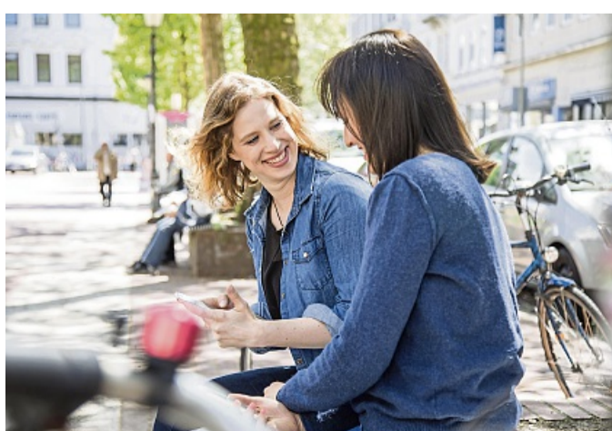
Wer das Smartphone aus der Hand legt, zeugt mehr Respekt und kann den anderen besser wahrnehmen.