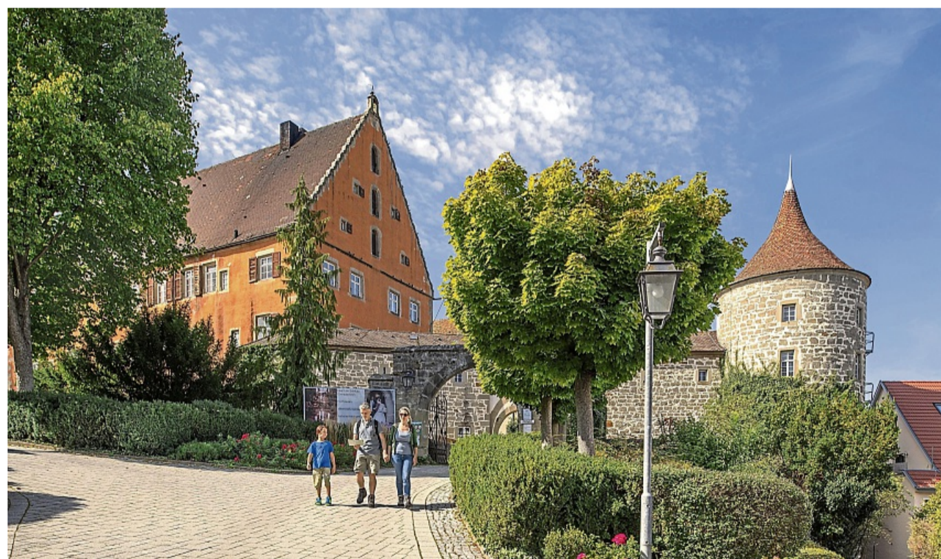
In Obersontheim führt der Bühlertalwanderweg am Schloss entlang.

In der Dorfkäserei können sie auch regionale Käse-Spezialitäten aus Bio-Heumilch probieren. Den „Wald im Wandel“ zeigt dagegen ein Rundweg in Abtsgmünd-Pommertsweiler, der durch dichte Wälder zum Büchelberger Grat führt. Die Panoramaaussicht reicht über den Hohenberg, das imposante Schloss Baldern, die Kapfenburg sowie die majestätische Schwäbische Alb. Und „An der historischen Konfessionsgrenze“ zwischen Bühlertal und Obersontheim liegen eindrucksvolle Natur- und Kulturschätze am Wegesrand. djd