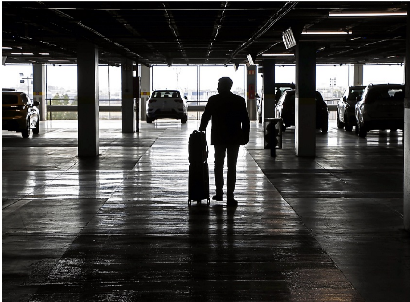
Versteckte Kosten: Unseriöse Anbieter wollen Reisenden für Mietautos häufig unnötige Zusatzversicherungen andrehen.

Es ist wichtig, den Mietvertrag vor der Unterschrift durch-