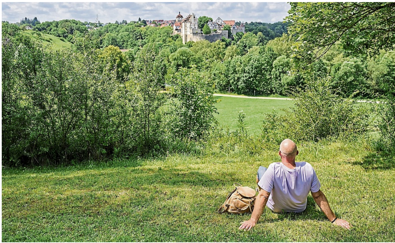
Rund um Vellberg führt eine Thementour zu Kräutern und Beeren am Wegesrand.

Die Rundwanderwege sind zwischen acht und 17 Kilome-