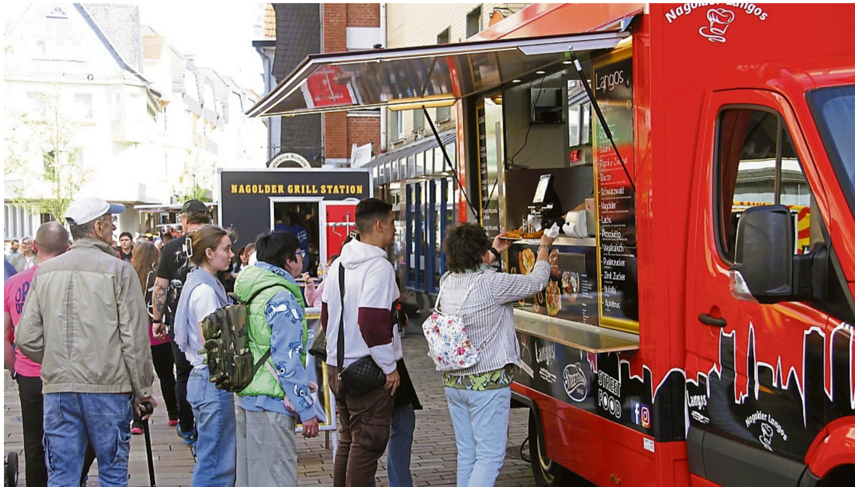
Das Street-Food-Festival findet am 5. und 6. April in Bahnhofstraße und Fußgängerzone in Frankenberg statt. Mehr als 20 Foodtrucks und kulinarische Marktstände laden dabei zum ausgiebigen Genießen und Schlemmen ein.

Am 5. und 6. April in der Fußgängerzone – Geschäfte am Sonntag offen