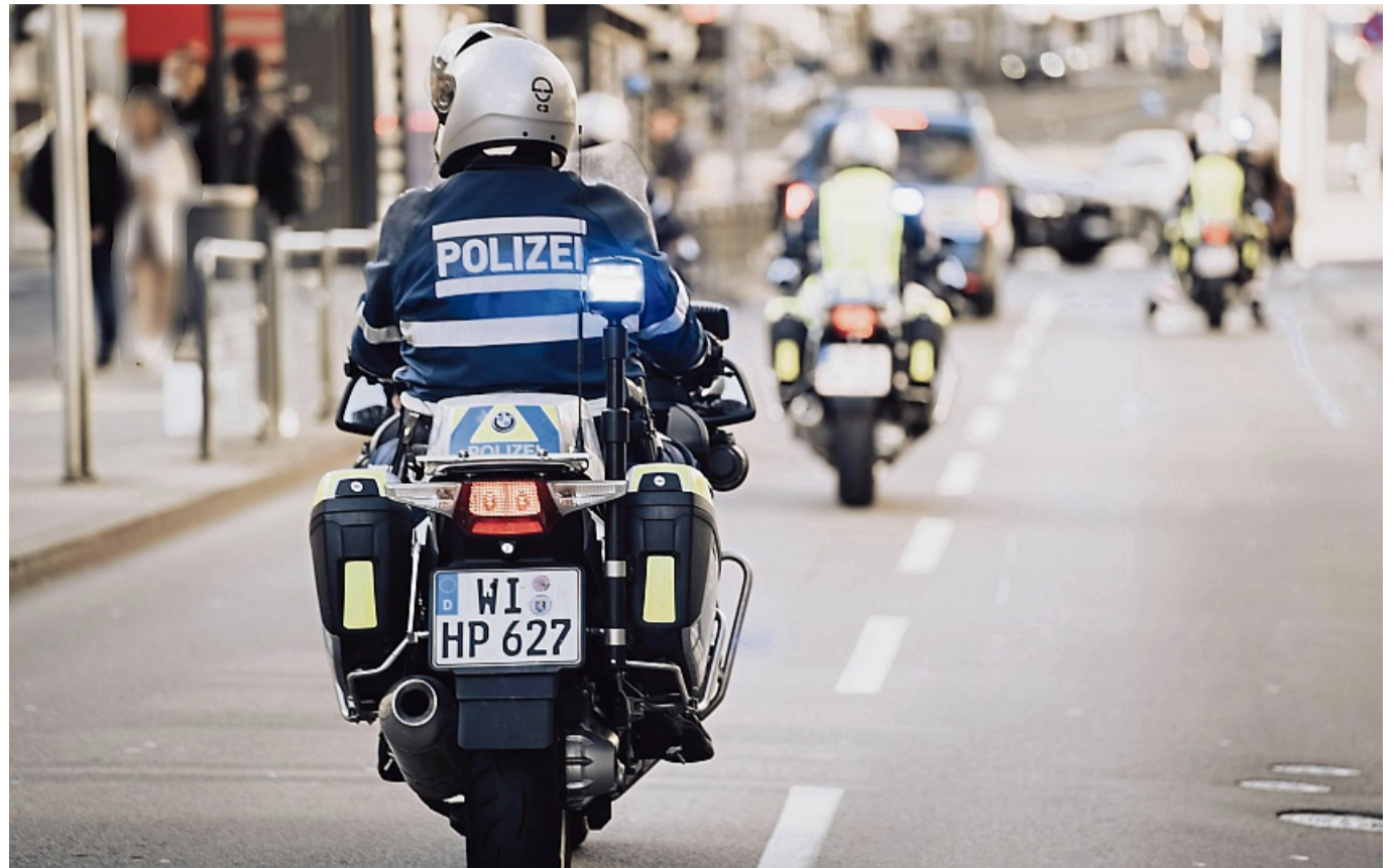
Zur Motorradsaison gibt die Nordhessische Polizei Tipps zum Saisonauftakt.

Checken Sie gründlich Ihre Maschine nach der Winterpause. Beachten Sie insbesondere Bremsen, Beleuchtung und Bereifung mit vorgeschriebenem Luftdruck. Schützen Sie sich mit geeigneter Motorradschutzbekleidung. Zur gesamten Ausrüstung gehören: Motorradhelm (keine sogenannten Braincaps), Leder- oder Textilkombi, Motorradhandschuhe und Stiefel. Verwenden Sie Protektoren, die das Verletzungsrisiko bei Stürzen vermindern. Nutzen Sie auffällige Reflektoren oder Warnwesten, damit sind Sie besser erkennbar und werden früher gesehen.