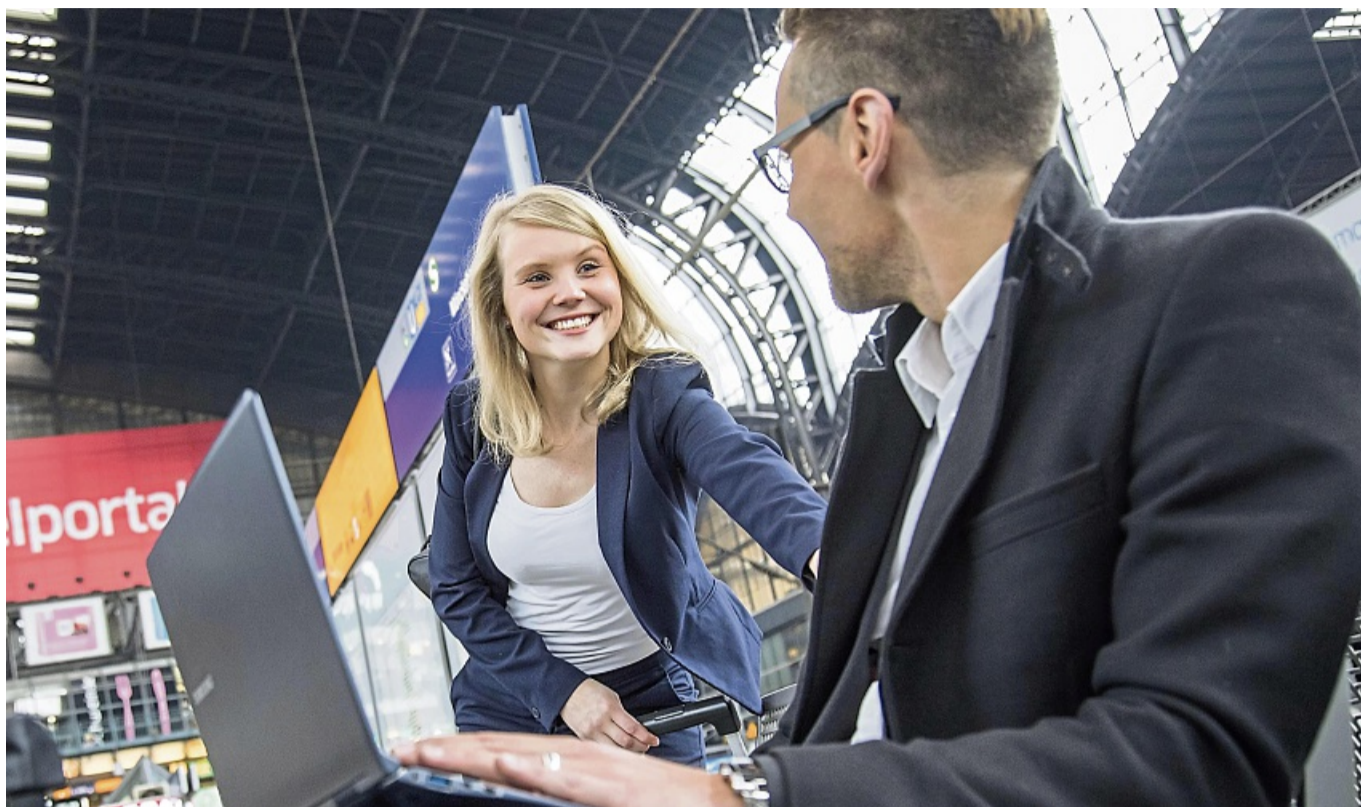
Lächeln - und ein Lächeln zurückbekommen: Das funktioniert.

Sich in andere hineinzuversetzen, fördert das gegenseitige Verständnis. „Wir wollen