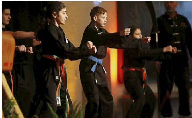
Sorgten für Stimmung: Die Kampfsportler des Selbstverteidigungs- und Fitnesssportvereins Hann. Münden mit ihren Darbietungen.