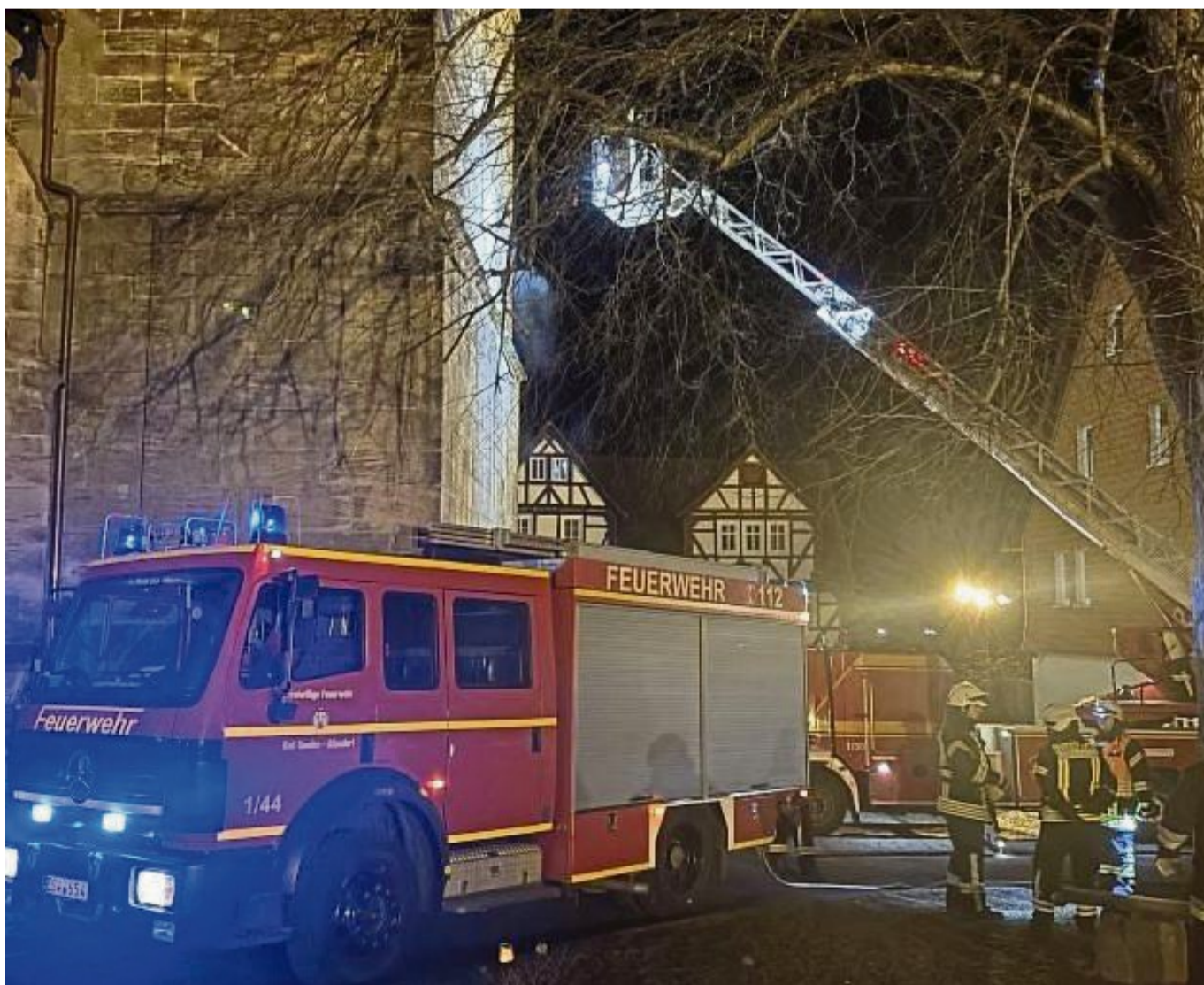
Abendlicher Einsatz: Bei einer Übung gingen die Feuerwehren von einem Brand im Turm der St.-Crucis-Kirche aus.

Dichter Qualm – ausgelöst durch eine so bezeichnete Nebelmaschine – lies drei Trupps von je zwei Mann nur mit Atemschutzgeräten zum Brandherd vorrücken. Gefangen war die Familie auf der ersten Empore des Turmes in einer Höhe von etwa 15 Metern.