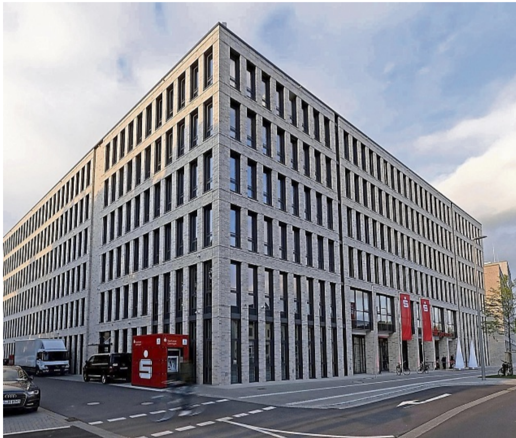
Modern: Der repräsentative Verwaltungssitz der Sparkasse Göttingen an der Kreuzung Groner Tor im Zentrum der Universitäts-Stadt.