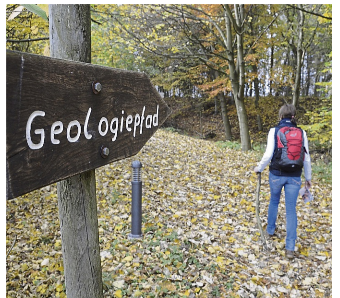
Das Entdecken unbekannter Naturparkwinkel ist auch Teil des Programms.

heimatpfleger, Förster, Naturpädagogen, Mitarbeiter des Naturparks Münden und viele an-