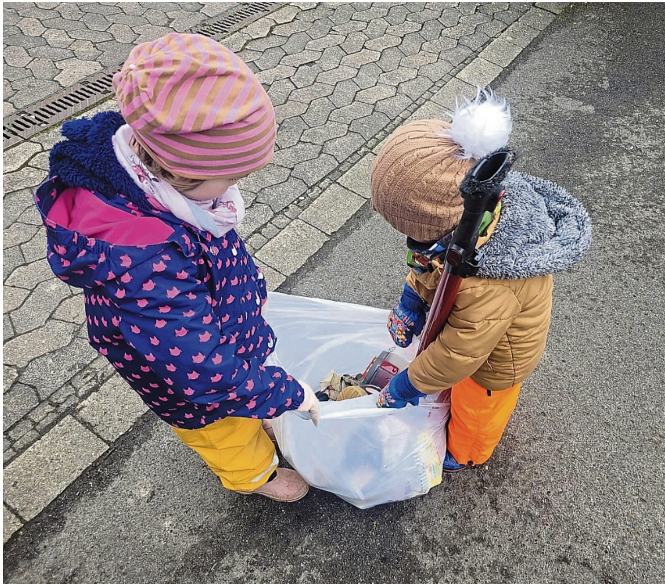
Die DRK Kita Hedemünden hatte sich in den vergangenen Jahren auch bei der Müllsammelaktion beteiligt.

Die Aktion „Hann. Münden putzt sich raus!“ wird vom Landkreis Göttingen, der THW-Ortsgruppe Hann. Münden, dem Verein der Fischfreunde sowie zahlreichen freiwilligen Helferinnen und Helfern aus den lokalen Vereinen und Initi-