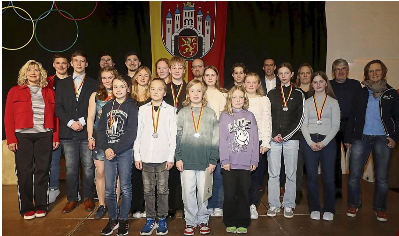
Sie durften sich freuen: Insgesamt 91 Einzel- und Teamsportler, von denen viele nicht persönlich dabei sein konnten, wurde bei der Sportlerehrung für ihre besonderen Leistungen ausgezeichnet.

Man blicke auf ein erfolgreiches Sportjahr 2024 zurück, was nicht zuletzt dadurch belegt sei, dass insgesamt 91 Einzel- und Teamsportlerinnen und -sportler aus neun Vereinen geehrt würden. „Einige von Euch haben bereits mehrfach Spitzenplatzierungen erreicht, während andere als vielversprechende Newcomer erstmals im Rampenlicht stehen“, so der Bürgermeister, der auch „die Menschen im Hintergrund“ wie Trainer, Betreuer, Eltern und Partner der Geehr-