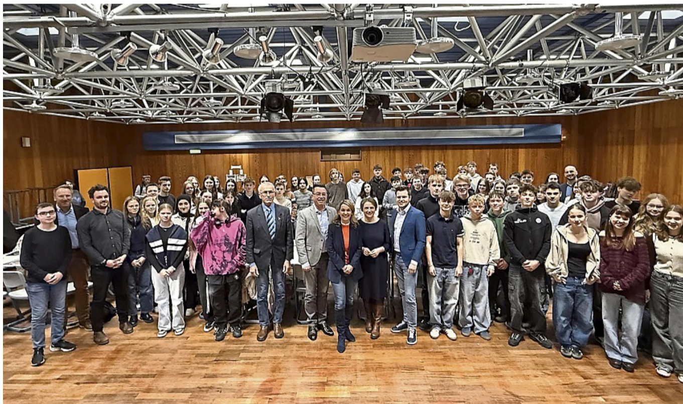
Demokratie live: Schüler, Lehrkräfte und Abgeordnete im direkten Austausch.