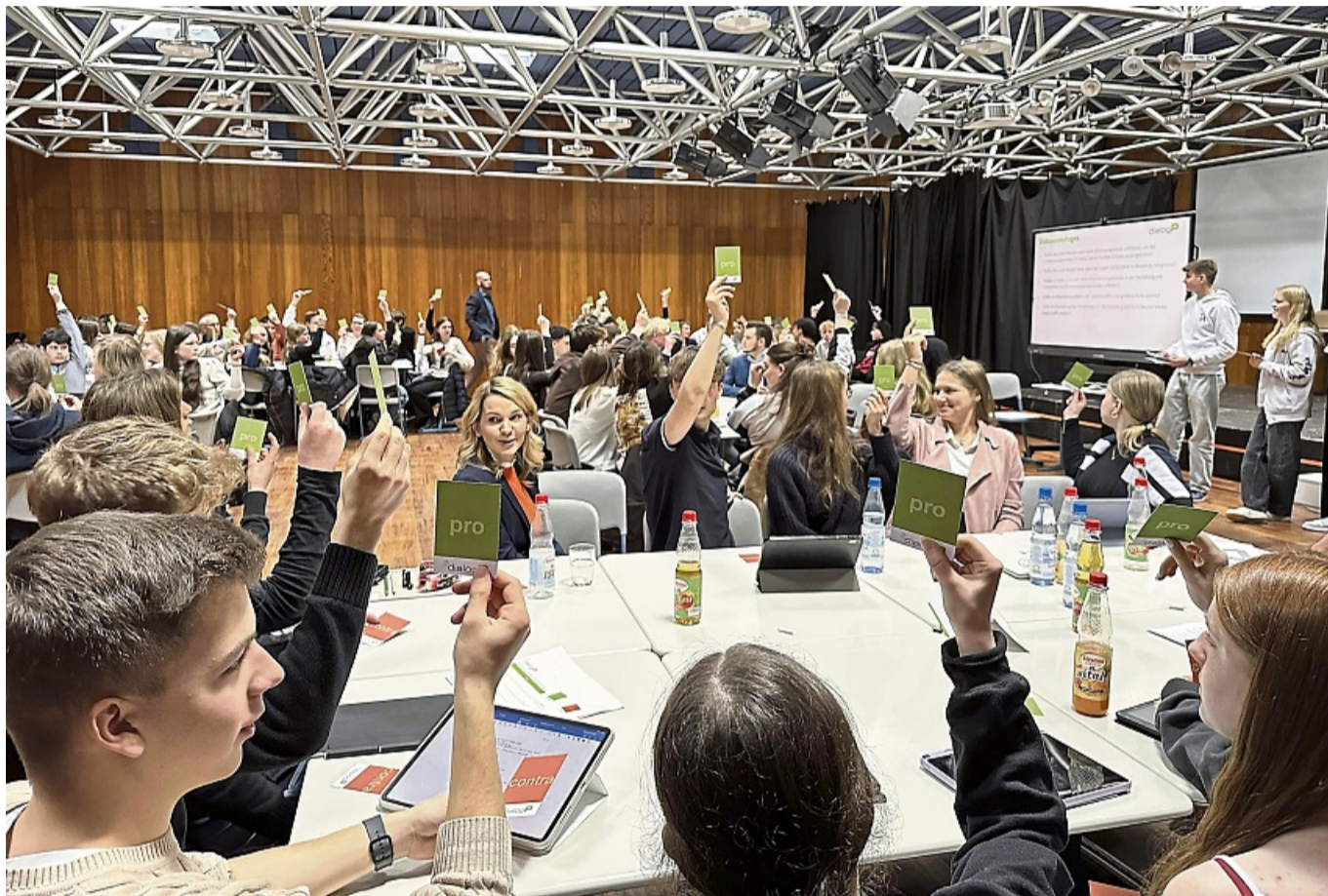
Landtagsabgeordnete im Schlagabtausch mit Schülern: Politik nahbar, kontrovers und auf Augenhöhe.

Auch das Thema Fehlerindex sorgte für Diskussionen. „Sollten wir nicht auf inhaltliche Qualität setzen, anstatt Schüler mit Lese-Rechtschreib-Schwäche zu benachteiligen?“, fragte eine Schülerin den Grünen-Po-