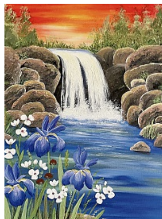
Liebe zur Natur und zur Leuchtkraft der Acrylfarben lässt die Bilder von Regina Meixner entstehen.

Oft seien ihre Landschaftsbilder nicht real, sondern würden