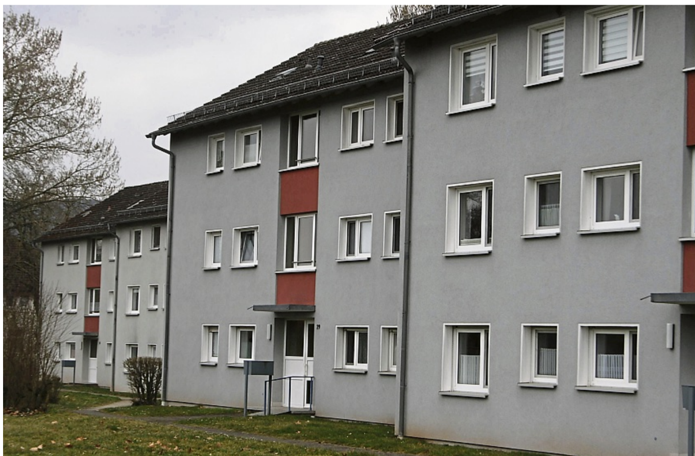
Sorge um höhere Grundsteuer: Auch Mieter wären betroffen, wie hier am östlichen Stadtrand von Allendorf.

Im Entwurf, so der Rathauschef, sei der Haushalt aktuell nicht genehmigungsfähig, weil bei Einnahmen von knapp 20 Millionen Euro und Ausgaben in Höhe von mehr als 22 Millionen Euro das Defizit bei über 2,3 Millionen Euro betrage. Das Regierungspräsidium in Kassel als Aufsichtsbehörde habe zwischenzeitlich allerdings signalisiert, dass eine Genehmigung erteilt werden könne, falls die Hebesätze mit