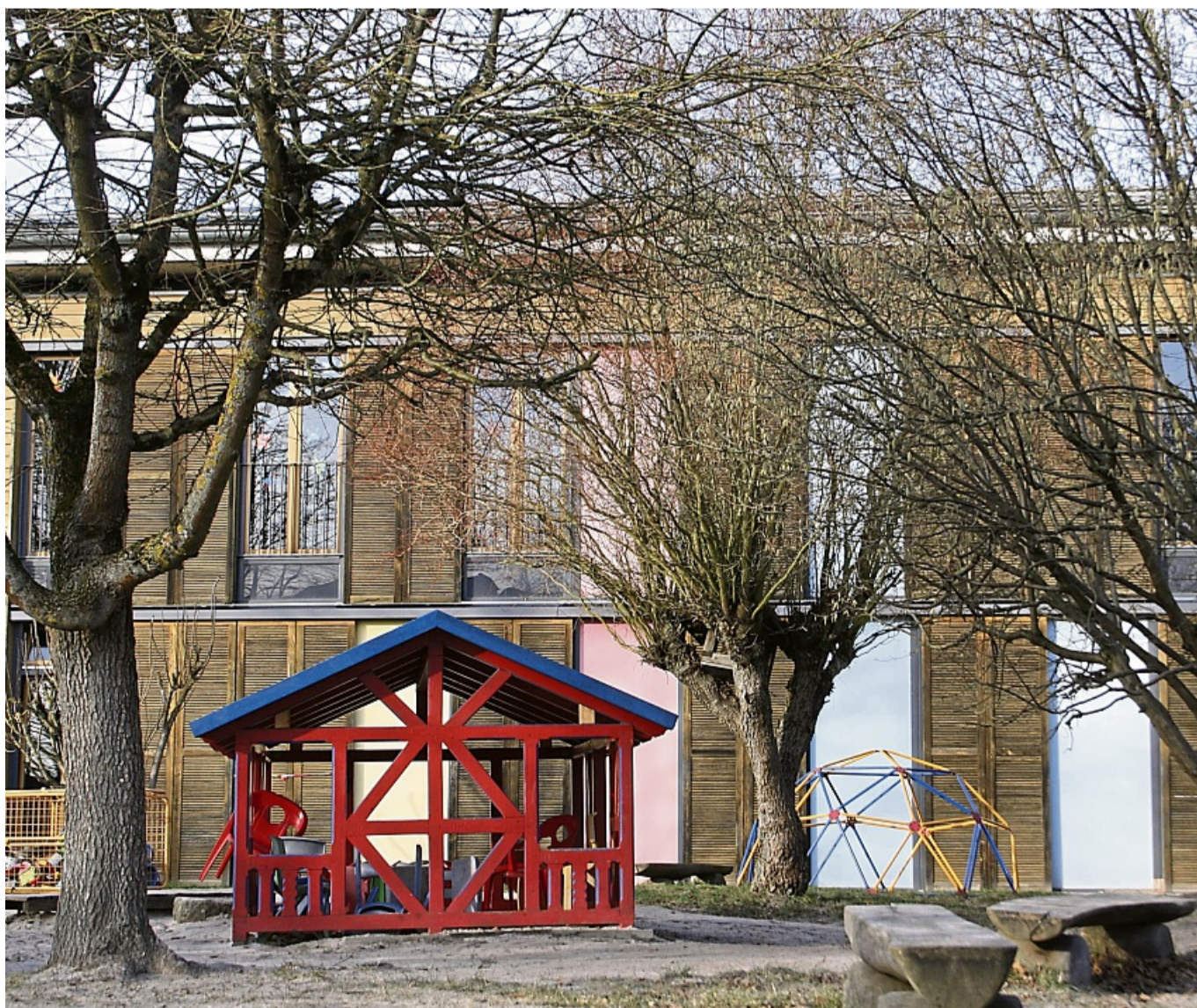
Laut Gutachten 765.000 Euro wert: der katholische Kindergarten St. Bonifatius.

Zunächst, so die einmütige Beschlussempfehlung des Gremiums für das Parlament, solle der Magistrat mit der Kirchengemeinde Verhandlungen über den Kauf der Immobilie aufnehmen, die laut einem Gutachten einen Verkehrswert von 765.000 Euro hat. Zugleich solle die Stadtverwaltung eine Fortschreibung des Integrierten Stadtentwicklungskonzeptes (ISEK) ausarbeiten – mit Be-