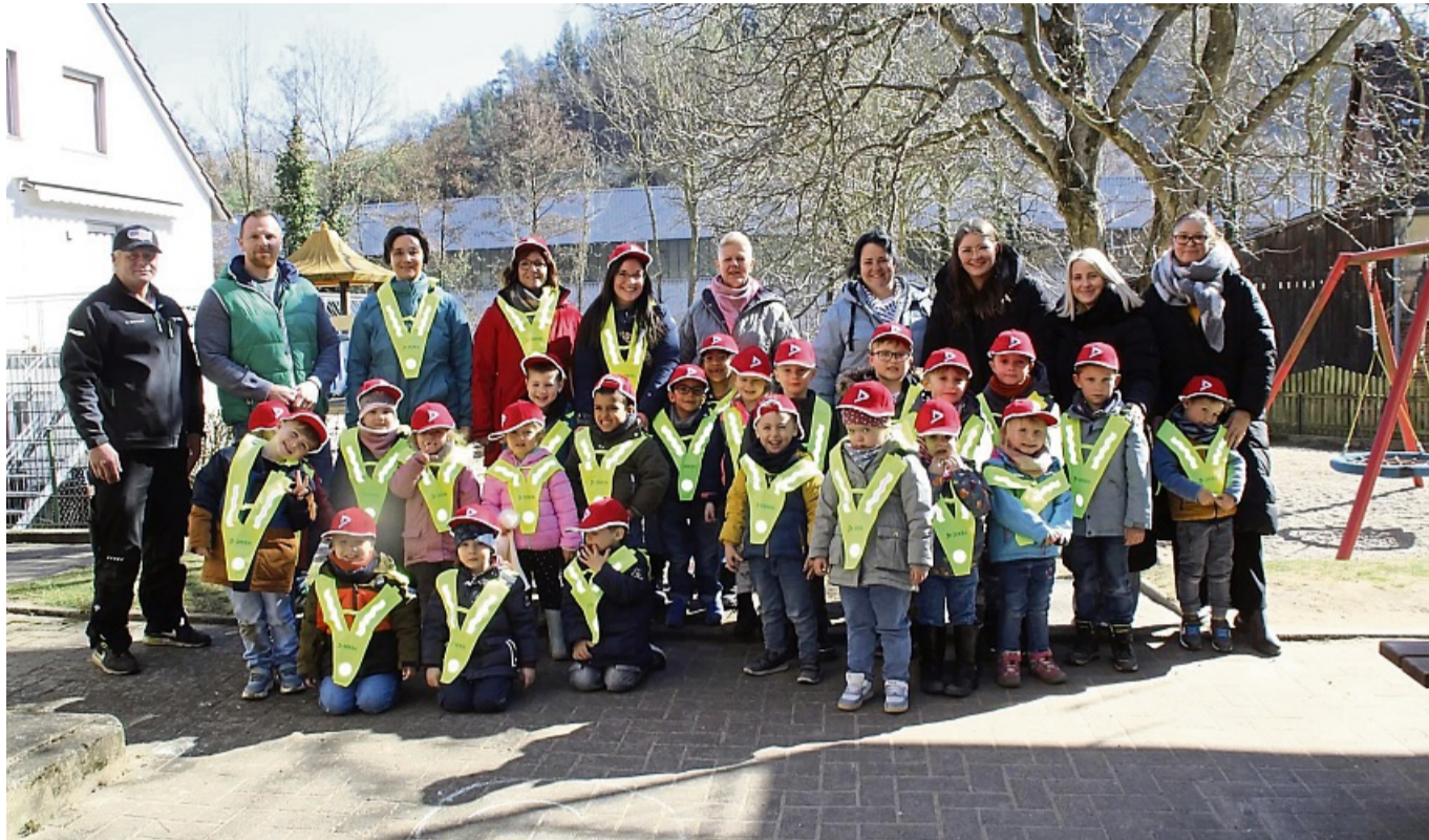
Freuen sich über die neue Ausstattung: Kinder, Mitarbeiterinnen und Vertreter der DEKRA bei der Spendenübergabe im Kindergarten.