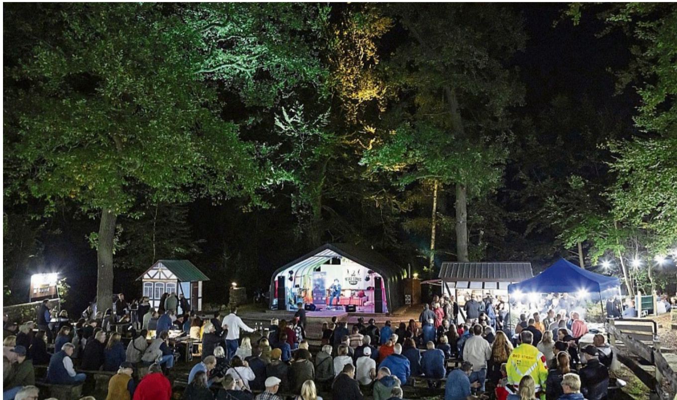
Gute Stimmung herrschte beim Abschlusskonzert am 21. September des Vorjahres mit More Songs about Sex und Andreas Leinemann.

Ein ganz besonderes Programm steht am Samstag, 17. Mai, 17.30 Uhr (Einlass ab 17 Uhr), an. Vier Bands (Flash-Back tot he Sixties, Ocean eyes, Hot