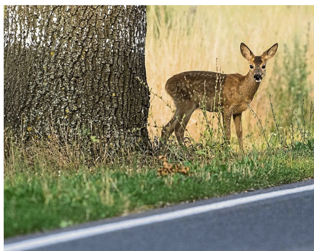
Mit der Umstellung auf Sommerzeit fällt ein Teil des morgendlichen Berufsverkehrs für Wochen wieder in die Dämmerung. Damit steigt die Gefahr von Wildunfällen.

Unfallstelle sichern: Warnblinker anschalten, die Warnweste überstreifen und das Warndreieck aufstellen – und immer die Polizei unter 110 an-