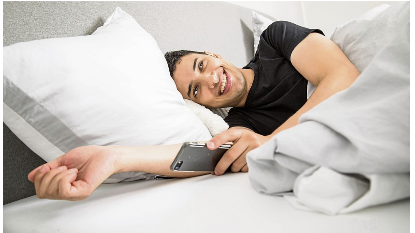
Guten Morgen! Es gibt Tricks, mit denen sich die Zeitumstellung besser wegstecken lässt.

Und es gibt weitere Tipps. Zum Beispiel vor der Zeitumstellung Tag für Tag eine Viertelstunde früher ins Bett zu gehen - und auch den Wecker etwas früher zu stellen. „So kann man sich langsam anpassen an die neue Zeit“, sagt Kneginja Richter.