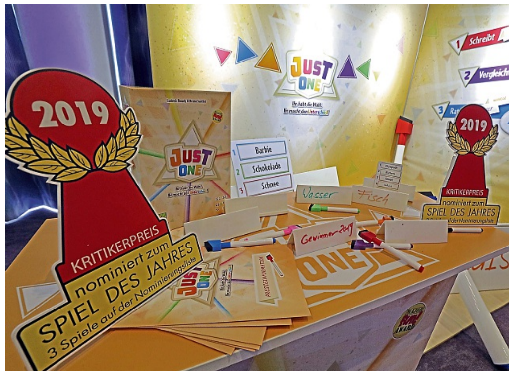
Das Spiel «Just One» wurde im Jahr 2019 zum «Spiel des Jahres» gewählt.