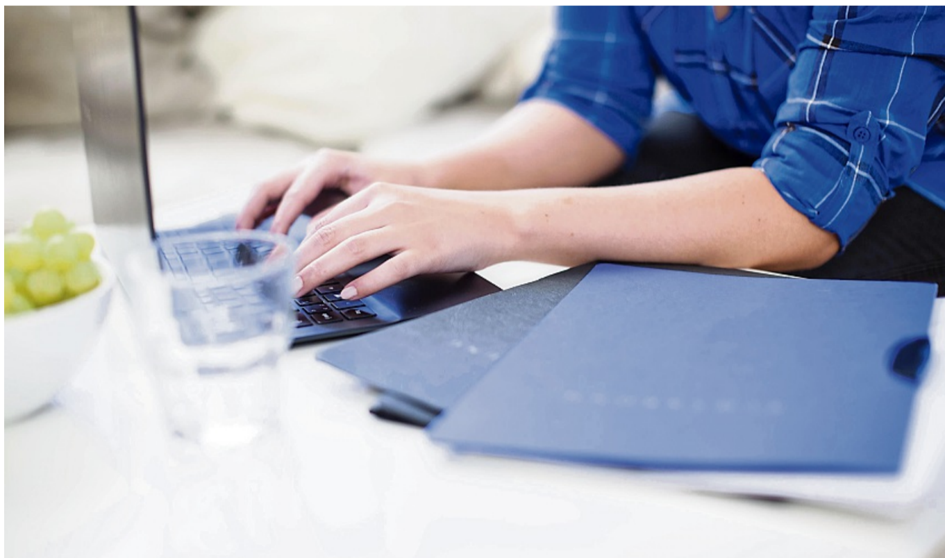
Mut zur Lücke: Phasen der Arbeitslosigkeit sollten Bewerberinnen und Bewerber nicht mit privaten Projekten, beruflicher Neuorientierung oder Selbstfindung kaschieren.

„Wirklich peinlich“ würden Personalrinnen und Personalr aber die gängigen Versuche finden, diese Phasen im Lebenslauf zu verstecken. No-Go: