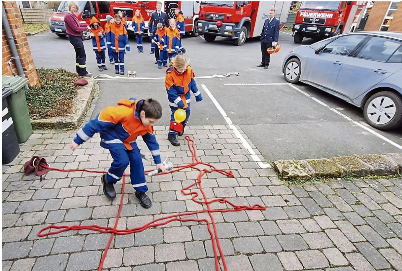
Bei der Jugendflamme müssen Jugendlichen ihr Wissen über Schläuche, und andere Feuerwehrgeräte beweisen. Unser Bild entstand bei den Wettbewerben in Groß Schneen.

Abgeschlossen wurde die Jugendflamme 1 mit einem sportlichen Spiel. 22 Flammen der Stufe 1 gingen an erfolgreiche Teilnehmerinnen und Teilnehmer aus der Samtgemeinde Dransfeld.