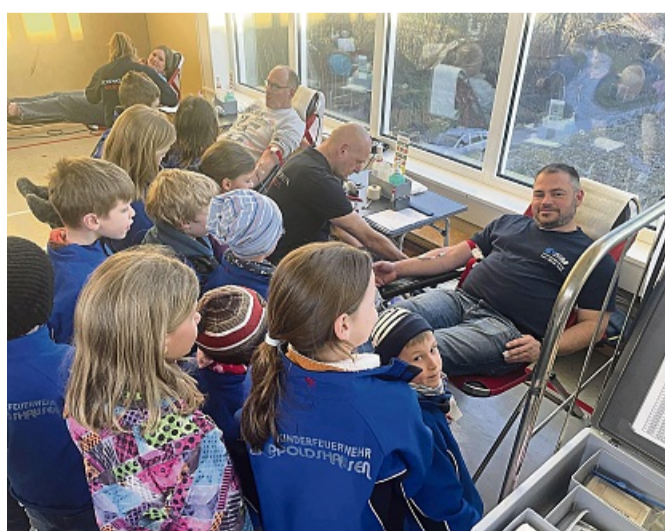
13 Mädchen und Jungen der Kinderfeuerwehr Lippoldshausen informierten sich über die Blutspendeaktion des Ortsvereins.

Angefangen von der Aufnahme der Daten über die Blutspende-App und dem Ausfüllen eines mehrseitigen Fragebogens - nebenbei natürlich viel trinken -, über die Abnahme eines kleinen Blutropfens und dem Messen der Körpertemperatur sowie das anschließende