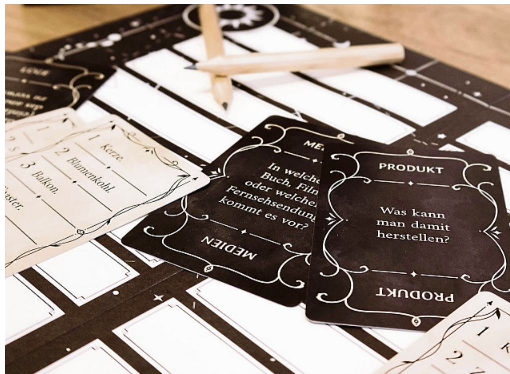
Bei „Ghost Writer“ werden Elemente aus kooperativen und kompetitiven Spielen gemixt, denn es ist ein Wortspiel für zwei Teams, die gegeneinander antreten.