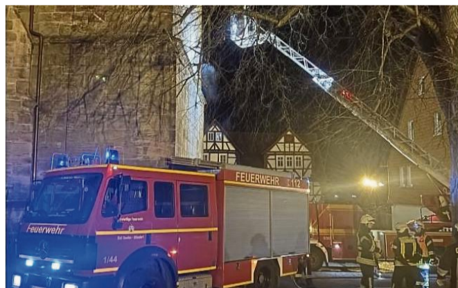
Abendlicher Einsatz: Bei einer Übung gingen die Feuerwehren von einem Brand im Turm der St.-Crucis-Kirche aus.

Dichter Qualm – ausgelöst durch eine so bezeichnete Nebelmaschine – lies drei Trupps von je zwei Mann nur mit Atemschutzgeräten zum Brandherd vorrücken. Gefangen war die Familie auf der ersten Empore des Turmes in einer Höhe von etwa 15 Metern.