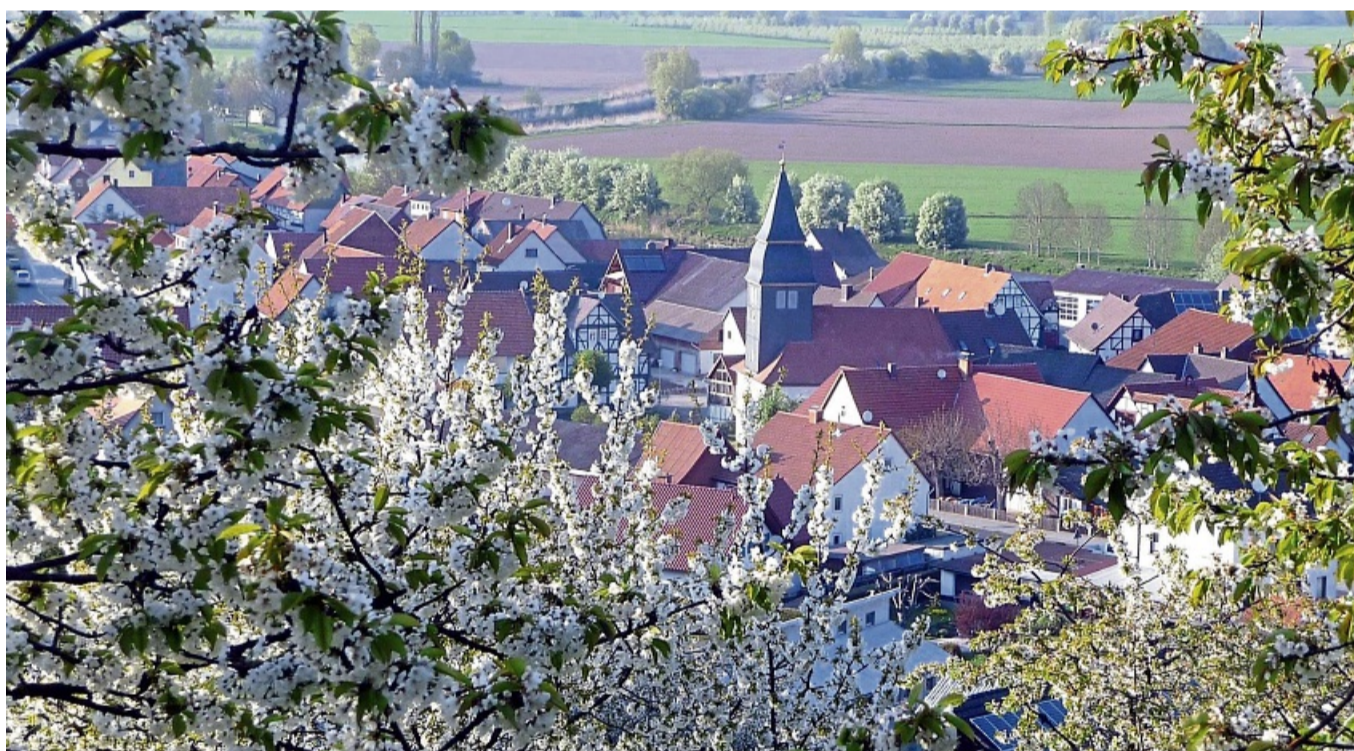
Beginn der Kirschblüte im Kirschenland: Wenn die Kirschbäume rund um Wendershausen aufblühen, tauchen sie die Landschaft in ein zartes Weiß. Ein Naturschauspiel, das jedes Jahr zahlreiche Besucher anlockt.

Den Auftakt macht am Samstag, 5. April, eine Tour durch das Kirschenland bei Wendershausen. Unter der Leitung von Agata Stawinoga, einer ausgewiesenen Kirsch-Expertin, geht es von 10 bis 13 Uhr durch Plantagen und Streuobstwiesen. Die Teilnehmer erfahren Wissenswertes über Kirscharten, Baumpflege und die Bedeutung der Obstwiesen für die Tierwelt. Eine zweite Wanderung folgt am Ostersonntag, 19. April, wenn die Kirschblüte in