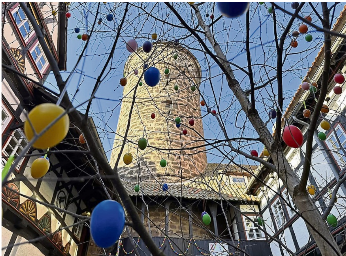
Vor historischer Kulisse: Der 40. Ostermarkt auf Burg Ludwigstein lädt Besucher ein, kunsthandwerkliche Tradition zu entdecken.

Für die jüngsten Besucher hält die Bastelstube kreative Mitmachangebote rund um das Thema Ostern bereit, heißt es in der Ankündigung weiter. Während die Kinder dort unter liebevoller Anleitung basteln, können Eltern in aller Ruhe durch die historischen Gemäu-