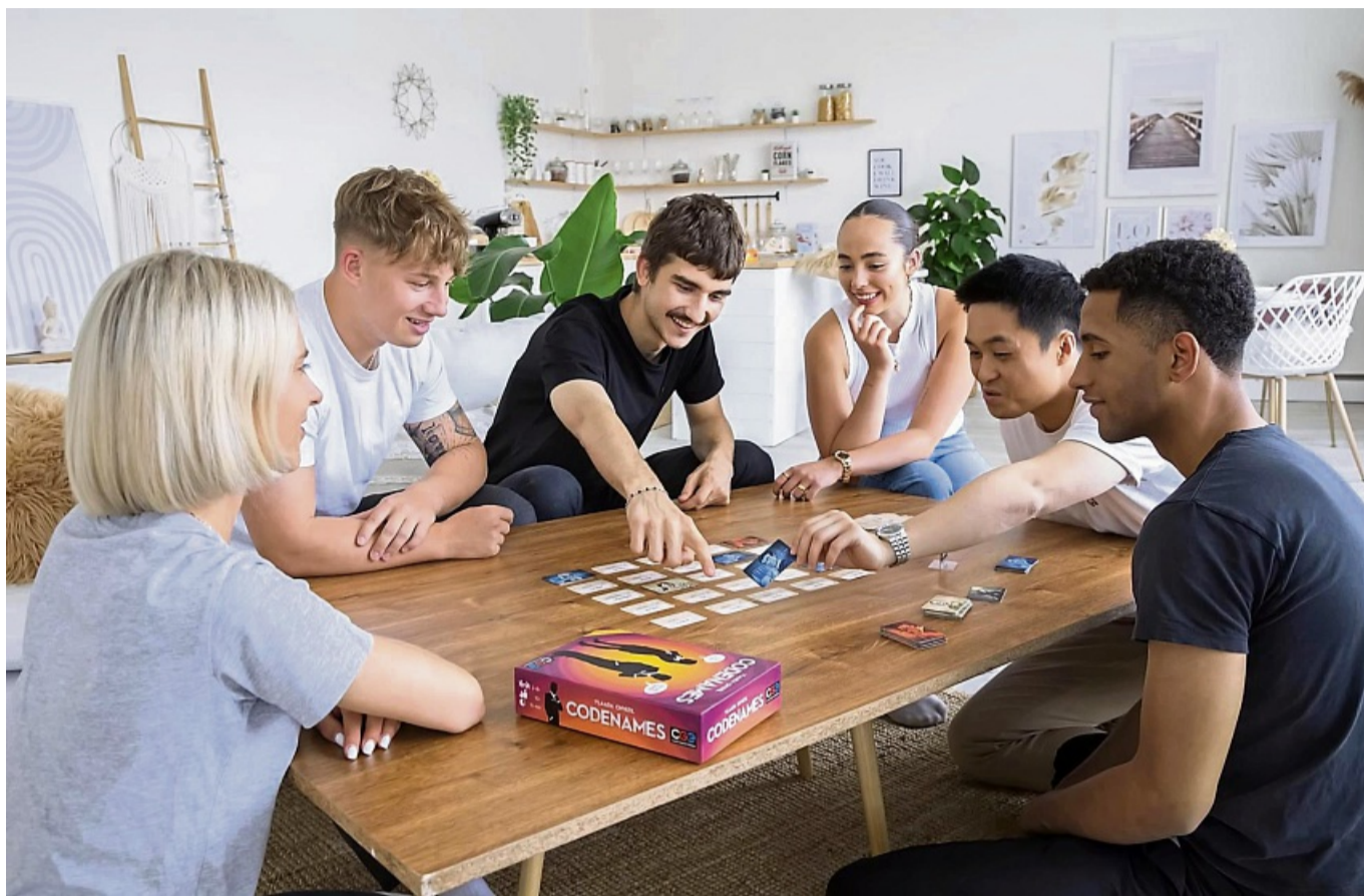
Verkaufsschlager: Das Spiel «Codenames» kam in unterschiedlichen Variationen – auch als erfolgreiche digitale App – heraus und ist mittlerweile in 47 Sprachen verfügbar.

In den Jahren nach „Codenames“ erschienen viele weitere, teilweise richtig gute Wortspiele auf dem Markt. Eine empfehlenswerte Auswahl: