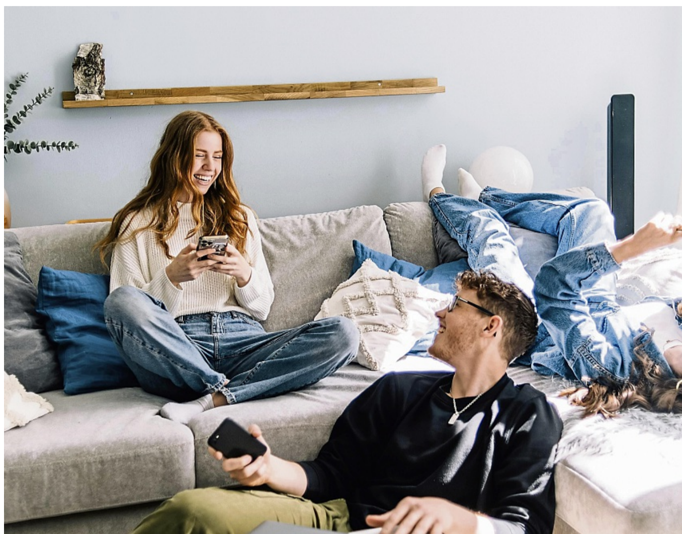
Mal laut, mal leise – aber immer besonders: Die Beziehung zu Geschwistern prägt uns nachhaltig.

Schenken spielt dabei ebenfalls eine Rolle: Rund die Hälfte macht Geschwistern zu Anlässen wie Geburtstagen eine kleine Freude. Für manche sind das persönliche Fotogeschenke,