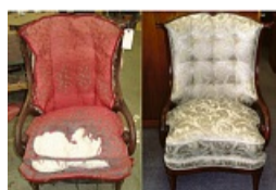
Aus alt mach neu