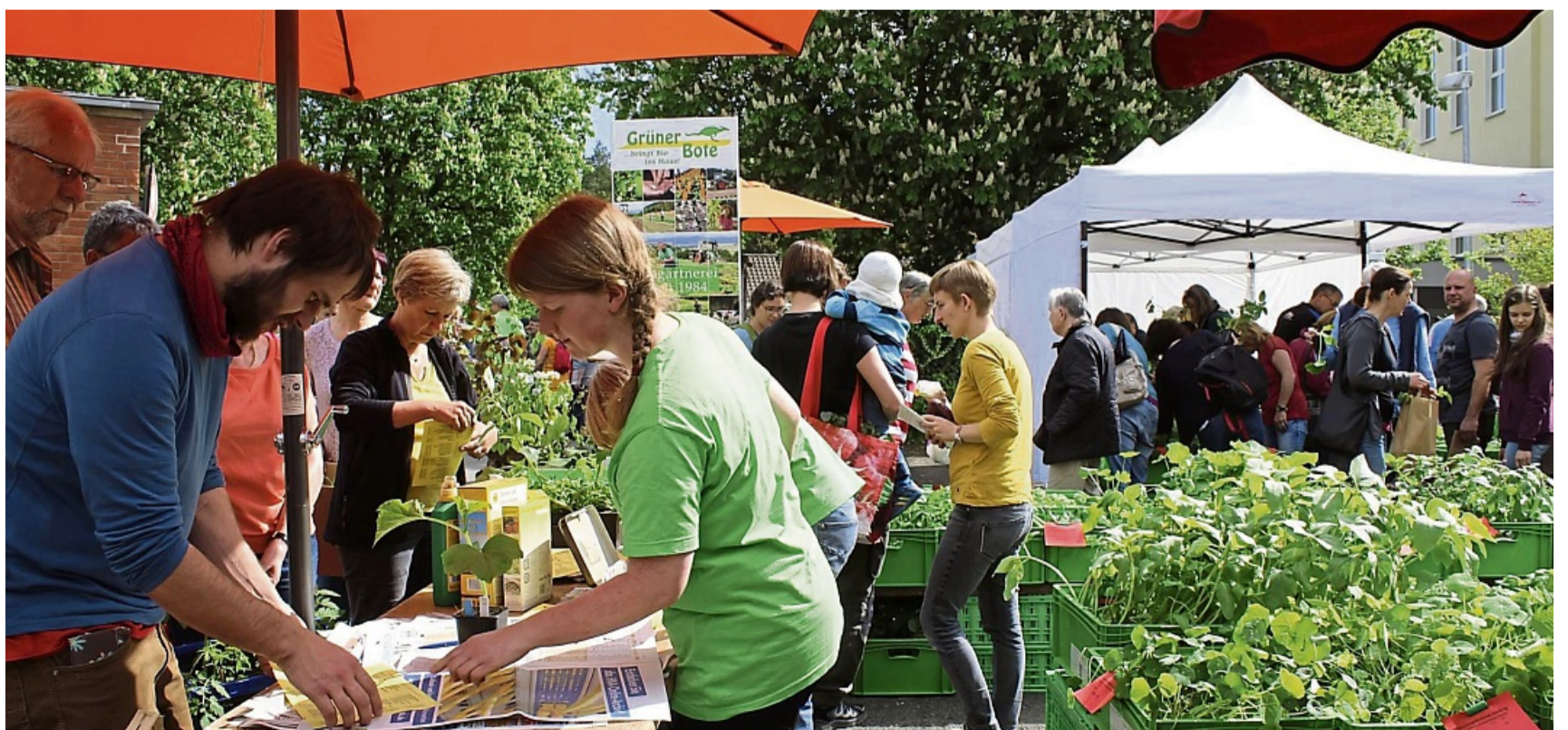
Grüne Vielfalt entdecken: Beim Pflanzenmarkt am Tropengewächshaus in Witzenhausen erwartet Besucher eine große Auswahl an Pflanzen sowie fachkundige Beratung und ein buntes Rahmenprogramm.

Parallel zum Markt öffnet der Fachbereich ökologische Agrarwissenschaften seine Türen. Im Rahmen des Tags der offenen Tür und Studieninfotags erwarten die Besucher Führungen, Aktionen und Kurzvorträge. Auch das Museum auf dem Campus sowie die Bibliothek des Ditsl (Deutsches Institut für