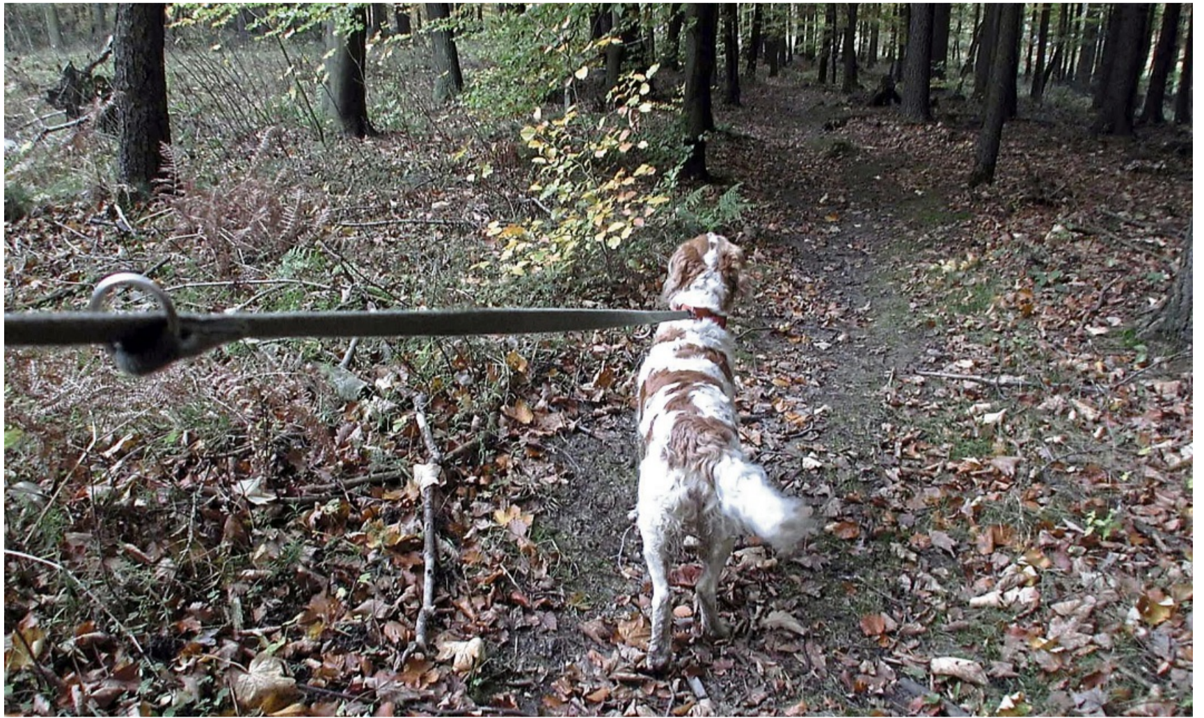
Die Pflicht zum Anleinen von Hunden zwischen dem 1. April und dem 15. Juli außerhalb von Ortschaften beruht auf dem Niedersächsischen Gesetz über den Wald und die Landschaftsordnung.

Die Anleinpflcht gilt in der freien Landschaft und in Wäldern. Viele frei lebende Tiere