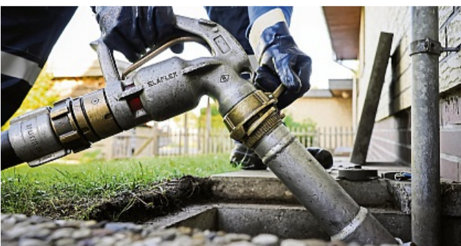
Frühjahrszeit ist Nachfüllzeit: Wer jetzt bestellt, kann von sinkender Nachfrage profitieren.

Ist Ihr Heizöl-Vorrat durch den Winter beinahe aufgebraucht? Dann stellt sich die Frage: Wann lässt sich der Tank möglichst günstig wieder befüllen? „Allgemein kann man sagen, dass der Preis sinkt, wenn die Nachfrage geringer ist“, sagt Energieberater Alexander Beer, der unter anderem für die Verbraucherzentralen tätig ist. Und das ist in der Regel nach den Wintermonaten der Fall. Wenn das Öl im Winter wieder gebraucht wird, steigt regelmäßig die Nachfrage, was den Preis nach oben treibt. Aktuell kosten 100 Liter Heizöl um die 90 Euro. Wer einen 3.000 Liter-Tank vollmachen möchte, muss also allein für das Öl mit einer Rechnung von rund 2.700 Euro rechnen - An- und Abfahrt des Tankwagens noch nicht inklusive. „Allerdings ist der Preis immer auch von der Welpolitik abhängig, dadurch wird diese Feststellung nicht immer zutreffen“, sagt Beer. In der aktuell dynamischen Situation mit US-Importzöllen und entsprechenden Gegenzöllen gehen Prognosen Beer zufolge davon aus, dass die Preise für Öl und Gas zunächst sinken, weil die Nachfrage durch die Wirtschaft vorerst rückläufig sein könnte. Wer sich nicht auf Prognosen verlassen möchte, kann sich günstigere Preise stellenweise dadurch sichern, dass besonders viel Öl auf einmal abgenommen wird. Ob die Sammelbestellung, zum Beispiel mit Nachbarn, aus finanzieller Sicht Sinn ergibt oder nicht, hängt laut Beer aber vom jeweiligen Lieferanten ab.