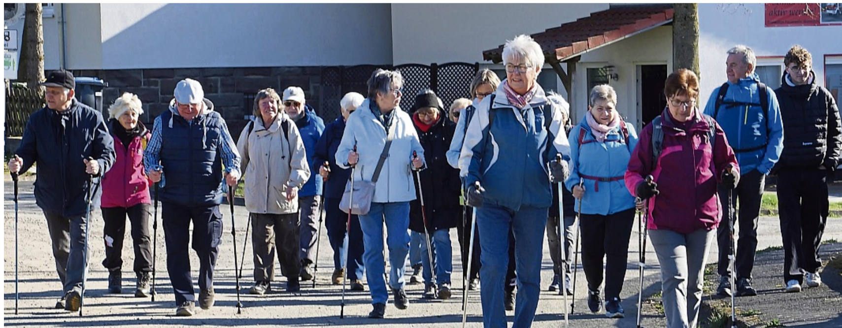
Velmedener und Lichtenauer gehen bei der Frühlingswanderung des Turngaus Werra gemeinsam auf Tour.