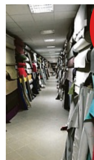
Über 7.000 Stoffe