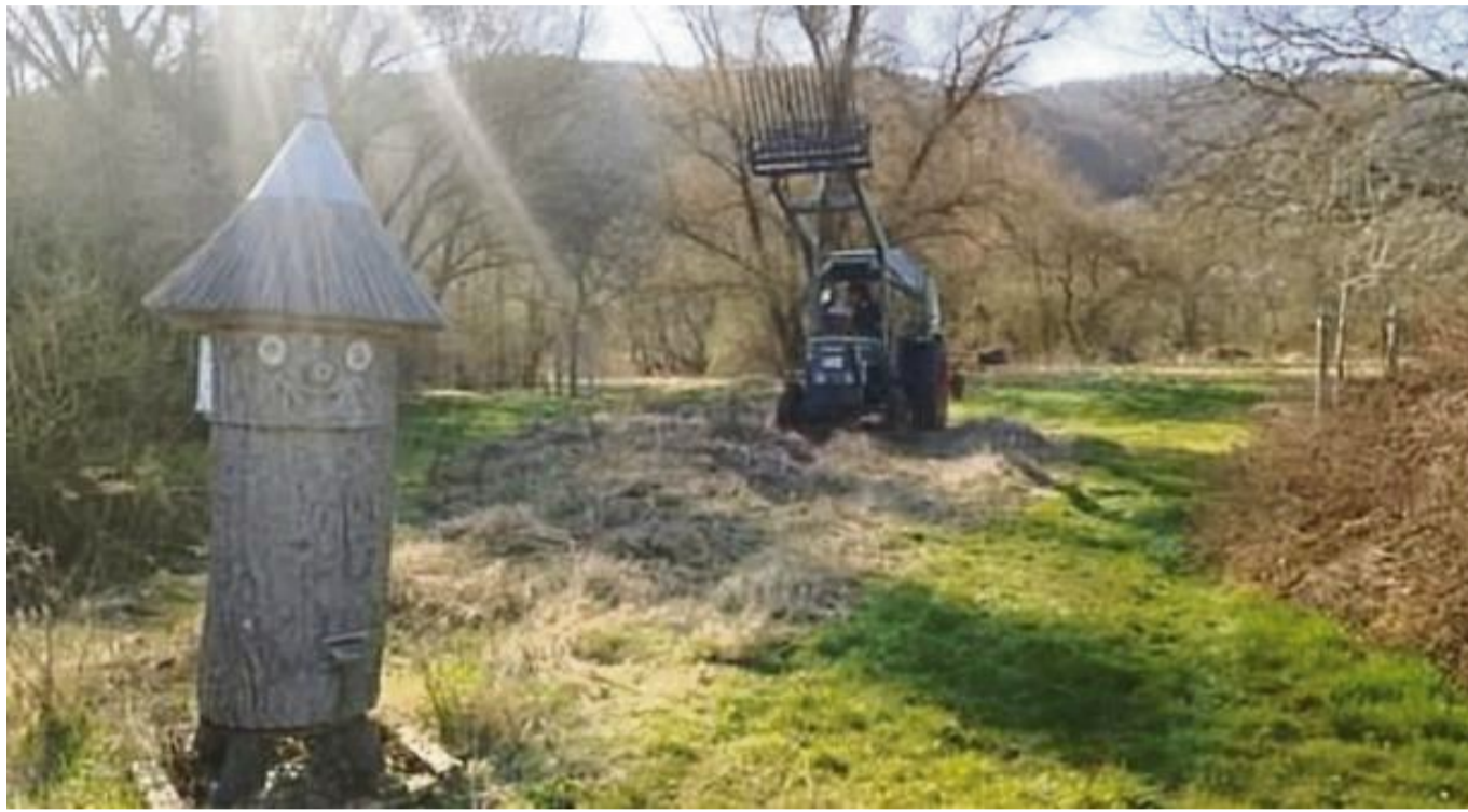
Mit vereinten Kräften für die Natur: Mitglieder des Imker-Vereins Bad Sooden-Allendorf bereiten die Bienenwiese an den Bruchteichen vor.

Die Blühwiese dient nicht nur als optischer Blickfang, sondern erfüllt eine ökologische Funktion. Sie liefert eine wichtige Nahrungsquelle für Honigbienen, Wildbienen und weitere Bestäuber, die eine zentrale Rolle im Ökosystem spielen. Doch nicht nur die Natur profitiert von der Initiative. Auch Spaziergänger können sich umfassend informieren. Wie es weiter heißt, hat der Verein das Bilder- und Infomaterial rund um die Bruchteiche erneuert. Tafeln bieten nun ei-