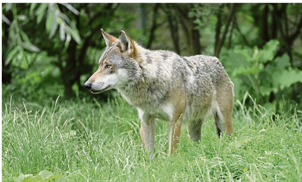
Wolfsichtungen sollten nur über die offiziellen Kanäle gemeldet werden.

Das Wolfszentrum Hessen (WZH) beim Landesbetrieb Hessen Forst ist die zentrale Anlaufstelle für alle Fragen und Meldungen zum Thema Wolf in Hessen. Es erfasst und bewertet Sichtungen, Spuren, Kotfunde und Rissereignisse, bei denen der Verdacht auf die Beteiligung eines Wolfes besteht. Auch das hessische Wolfsmonitoring liegt in der Verantwortung der staatlichen Wolfsexperten, heißt es in einer Mitteilung von Hessen Forst. Jeder Bürger könne die dauerhaft Überwachungen der