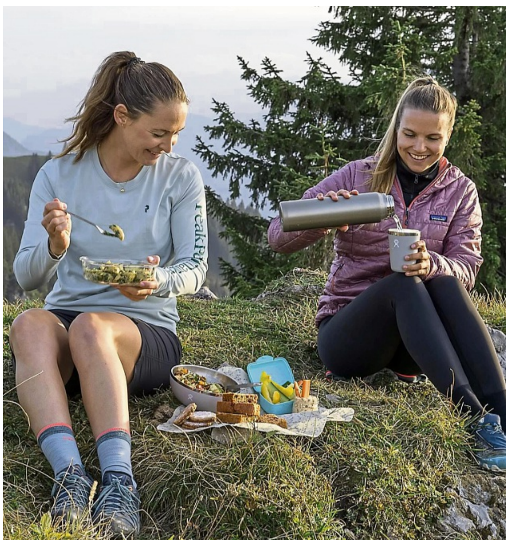
Leckeres Essen schön verpackt lässt sich bei einer Rast während der Wanderung gut genießen.

Für den Hokkaido-Hummus von Pauline Joos wird Kürbis in Scheiben geschnitten, im Ofen