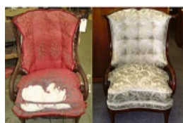
Aus alt mach neu