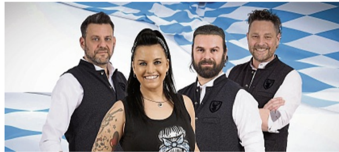
Wollen am Samstagabend das Festzelt rocken: die Musiker der Partyband Honeybee & Kisses.