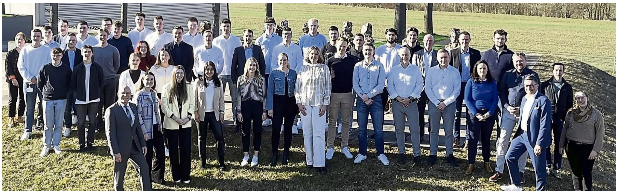
Stolz auf ihre Leistung: 36 Absolventen haben im Winter ihre Ausbildung oder ihr Studium bei B. Braun abgeschlossen.

auch Veranstaltungen, wie beispielsweise das Otto-Braun-Fußballturnier. Dadurch durfte ich großartige Menschen kennenlernen, wodurch ich mich fachlich sowie persönlich weiterentwickelt habe.“ Die insgesamt 36 Auszubildenden und Studierenden unterteilen sich in 30 technische und sechs kaufmännische Absolventen. 35 der Absolventen werden laut Mitteilung ihren Karriereweg bei B. Braun fortsetzen. bkz