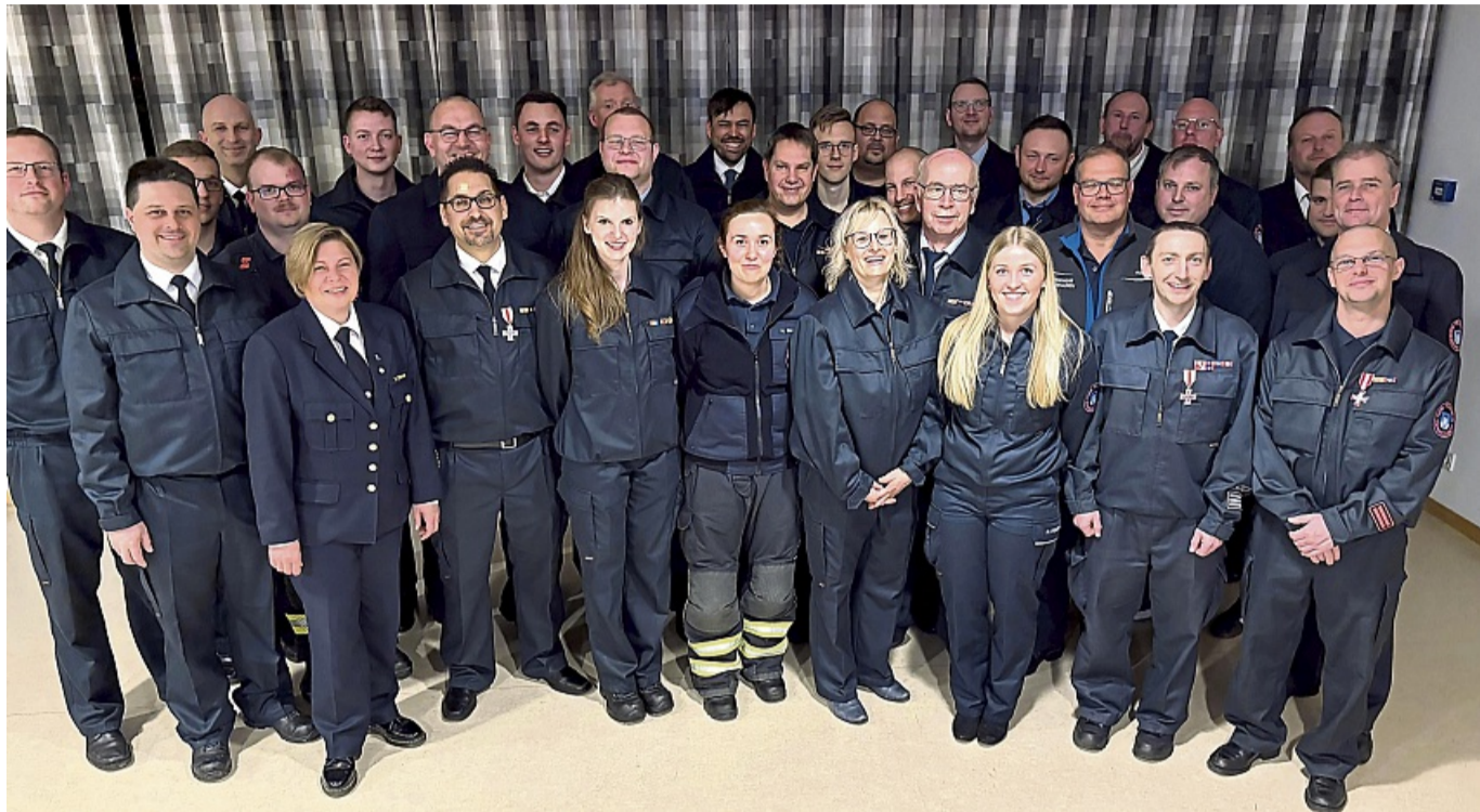
Bei der gemeinsamen Jahreshauptversammlung kamen die Ehrenamtlichen der Melsunger Feuerwehren im Dorfgemeinschaftshaus in Kirchhof zusammen.

Metz berichtete, dass im Jahr 2024 die Melsunger Feuerwehren zu insgesamt 255 Einsätzen ausrückten. Darunter 42 Brände, 140 Technische Hilfeleistungen, 61 Fehlalarme, hauptsächlich durch Brandmeldeanlagen, und 12 Brandsicherheitsdienste. Gegenüber dem Vorjahr ein Rückgang um 59. Dieser Rückgang ist hauptsächlich darauf zurückzuführen, dass 2024 keine Unwettereinsätze zu verzeichnen waren. Für den Einsatzdienst standen insgesamt 199 aktive Feuerwehrleute zur Verfügung, die insgesamt 18.933 ehrenamtliche Stunden geleistet haben. In seinem Jahresbericht ging Metz auch beispielhaft auf einige Einsätze, zu denen Lkw-Brände, Wasserrettung und Verkehrsunfälle mit eingeklemmten Personen gehörten, ein. Aus dem Bereich Nach-