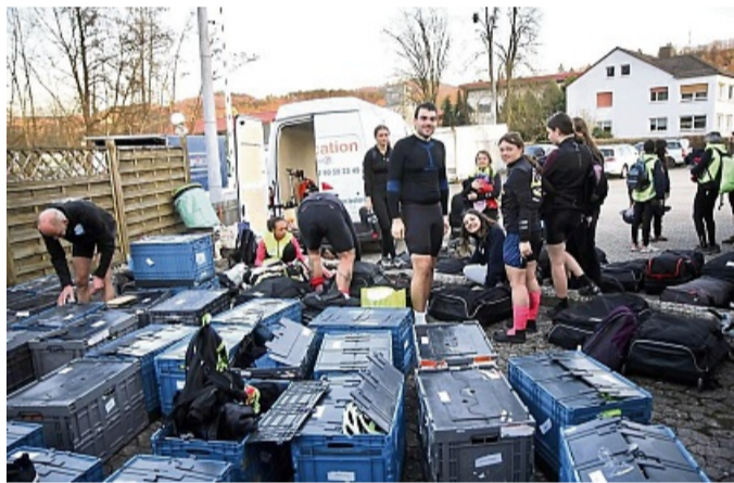
Französische Radler auf der Tour vom Elsass nach Hamburg machen Stopp in Spangenberg.