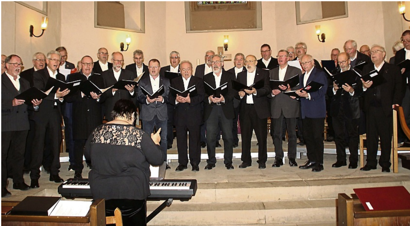
Starke Truppe Dank der Zusammenarbeit mit Heinebach: Der Männergesangverein 1875 Morschen feierte in der Haydauer Klosterkirche mit einem Konzert das 150-jährige Bestehen. Von den Besuchen gab es viel Applaus und zum Schluss als Dank auch noch eine Zugabe.