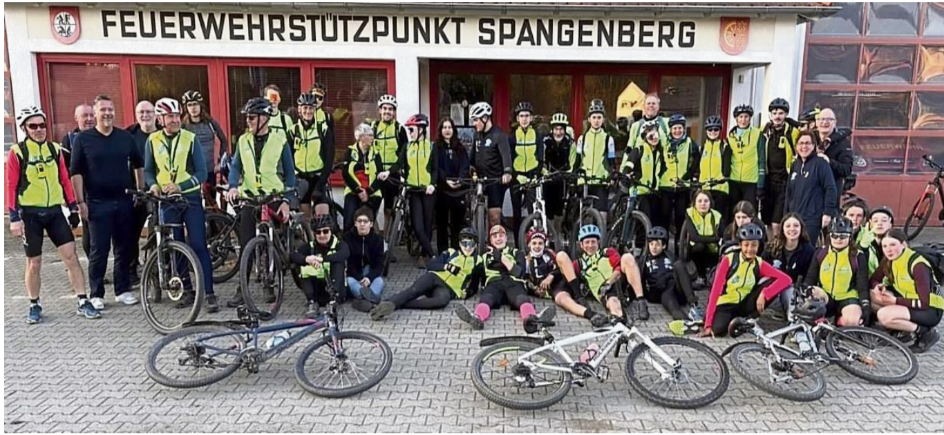
Die Radler und ihre Begleitmannschaft haben sich vor dem Spangenger Feuerwehrstützpunkt zum Gruppenfoto versammelt.

Während die Radler in den Begleitfahrzeugen zum Duschen in die kleine Schulturnhalle gebracht werden, bereitet das Küchenteam das Abendessen vor. Es gibt Spaghetti Carbonara und Salat. Von den Teil-