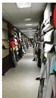
Über 7.000 Stoffe