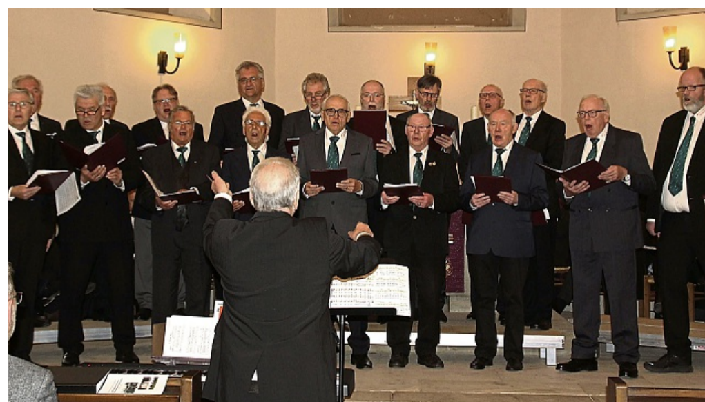
Musikalische Gratulation aus der Nachbarschaft: Der Männergesangverein Liedertafel 1842 Spangenberg bekam in der Klosterkirche ebenso viel Beifall wie der MGV Altmorschen.

Das sei Anlass, positiv in die Zukunft zu schauen. Er wünsche dem MGV Altmorschen, dass er auch in den nächsten 150 Jahren die Menschen erfreuen möge in Frieden und Freiheit. Der Gesang sei auch wichtig für die gesellschaftliche Entwicklung, Musik überwinde Differenzen und baue Brücken für die Menschen.