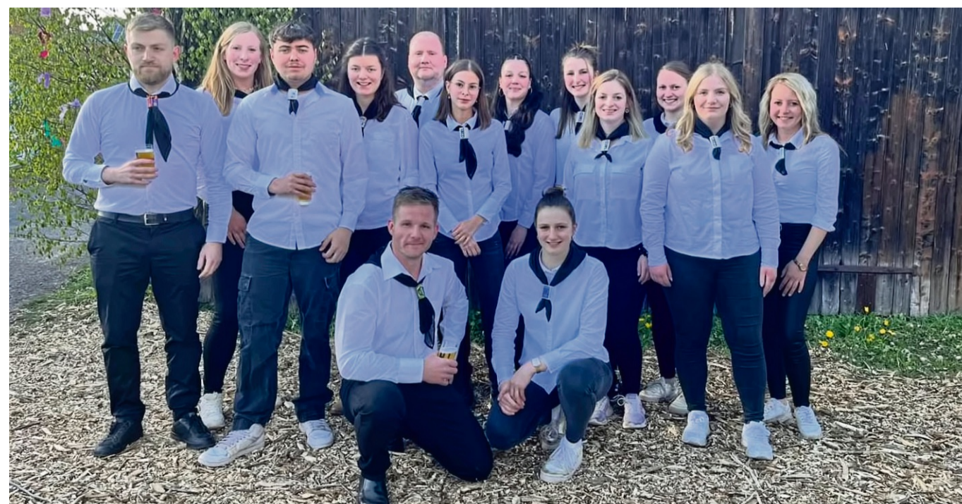
Der Kirmesverein im schicken, nahezu einheitlichen Outfit beim letztjährigen Event.

großzügige Unterstützung verschiedener Firmen möchten wir uns herzlich bedanken.“