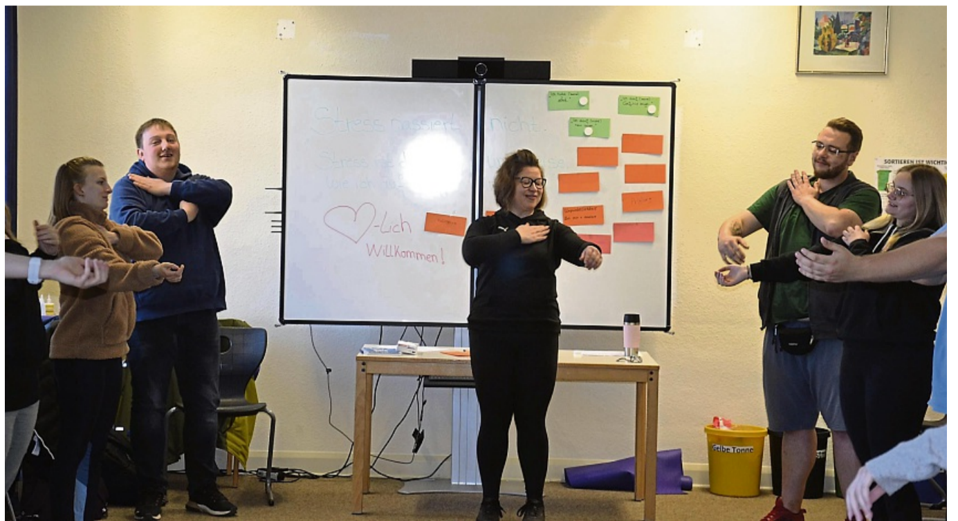
Alle Körperteile abklopfen: Die „Mehlsackübung“ ist eine entspannende Aufgabe.