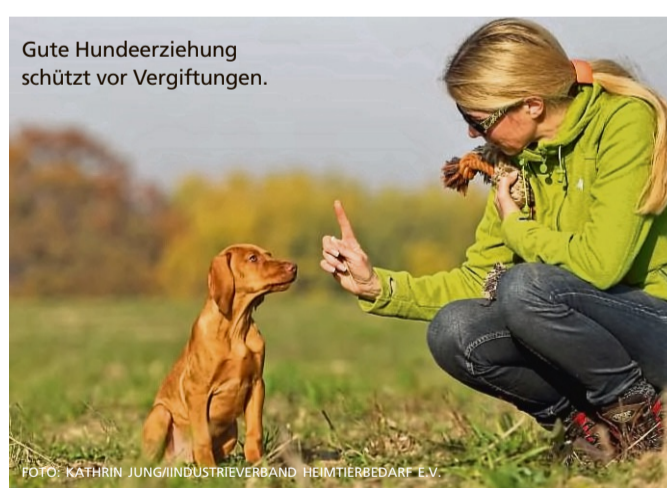
Gute Hundeeziehung schützt vor Vergiftungen.

Einmal gelernt schützt diese Erziehung den Hund auch im eigenen Garten. Hier werden zwar keine Giftköder zu finden sein, doch es gibt potenziell einige Pflanzen, die