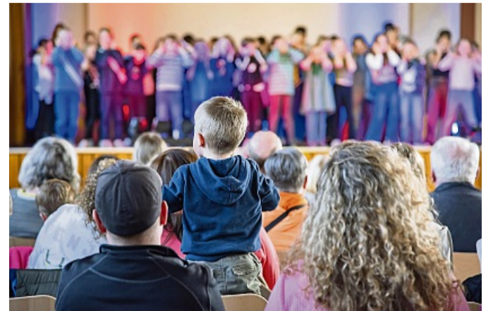
Die Musicalaufführung „Die Reise nach Jerusalem“ wurde von Familien und Freunden der Kindermusikfreizeit bejubelt.