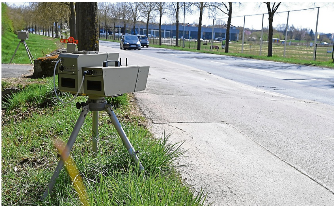
Ihre Geschwindigkeit im Blick behalten mussten besonders am Dienstag Autofahrer im gesamten Landkreis. So wie auf unserem Bild am Korbacher Südring „blitzte“ die Polizei die Raser und kontrollierte Fahrzeuge.

In Nordhessen waren 1009 Fahrzeuge zu schnell unterwegs, 154 davon wurden im Landkreis Waldeck-Frankenberg gemessen. Davon kamen