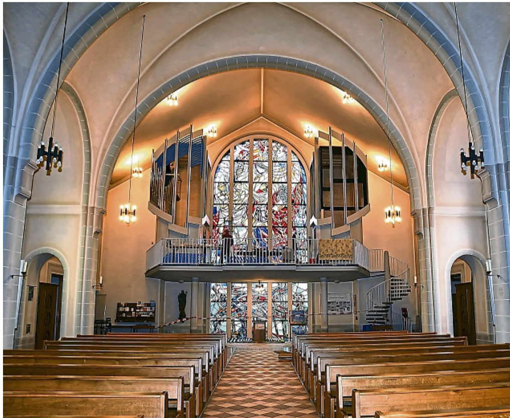
Die neue Orgel wird in St. Marien aufgebaut: Das große, zentrale Buntglasfenster der Korbacher Kirche kommt künftig besonders zur Geltung.

Trotzdem wird St. Marien praktisch eine neuwertige Orgel erhalten: „Es ist eigentlich ein komplett technischer Neu-