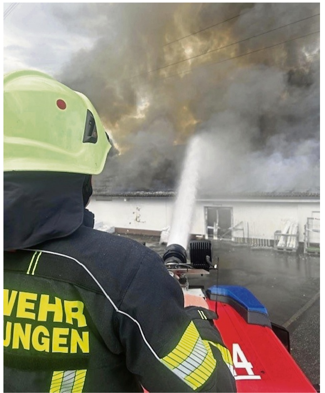
Unter anderen zwei „Wenderohre“ schossen von Drehleitern aus bis zu 2500 Liter pro Minute auf den Brand.

Nach rund einer Stunde hatten die Feuerwehren das Feuer endgültig unter Kontrolle. Die Wildunger Kernstadtwehr setzte ihre Drohne ein, um mit der daran montierten Wärme-