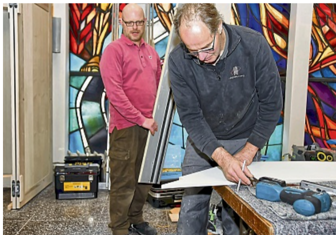
Neue Orgel wird in St. Marien aufgebaut.

Gemeinde geht damit bald ein langgehegter Wunsch in Erfüllung – und für Organist Uteschil ein ganz besonderer: „Ich habe immer gehofft, noch vor meinem 70. Geburtstag auf der neuen Orgel spielen zu können.“ Den feiert er in diesem Jahr. LUTZ BENSELER