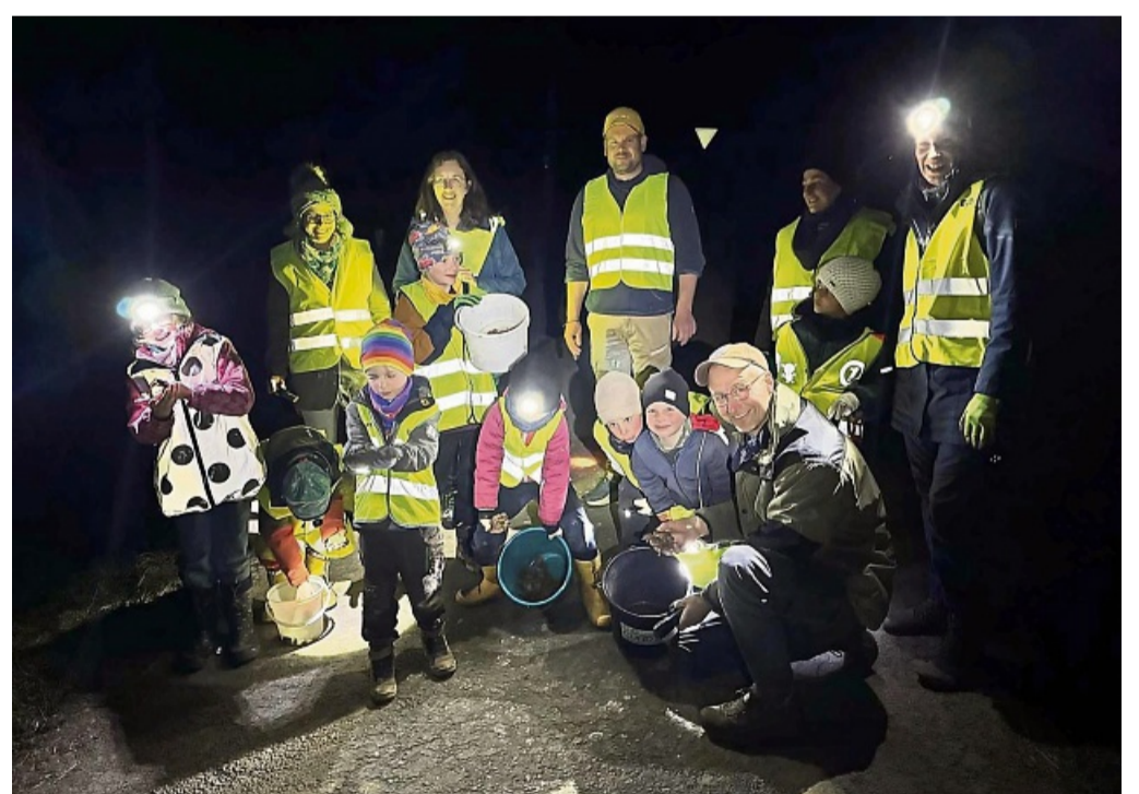
Einsatz mit Herz: Die aus dem Wald kommenden Tiere werden morgens und abends gesammelt und über die stark befahrene Landstraße gebracht. Kinder helfen gern.

Bei den aus dem Wald kommenden Tieren handelt es sich hauptsächlich um Erdkröten – auch dank des Schutzzeinsatzes ist dort noch eine der letzten großen Erdkrötenpopulatio-