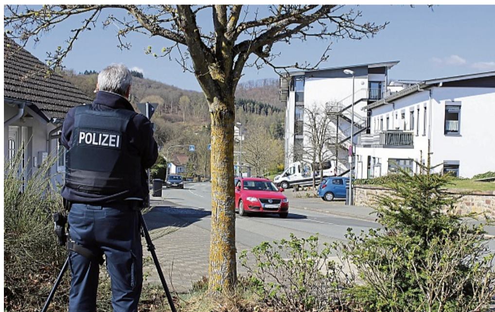
Speedmarathon, 09.04.2024, Battenberg, Dodenauer Straße, zwischen Grundschule und Burgberghalle, Geschwindigkeitsbegrenzung 30