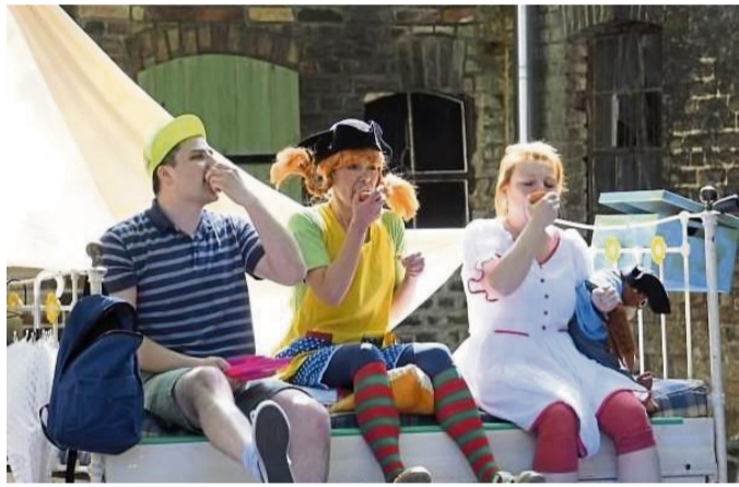
Pippi Langstrumpf schnappt sich ihre Freunde Tommy und Annika und macht sich auf, ihren Vater zu retten.