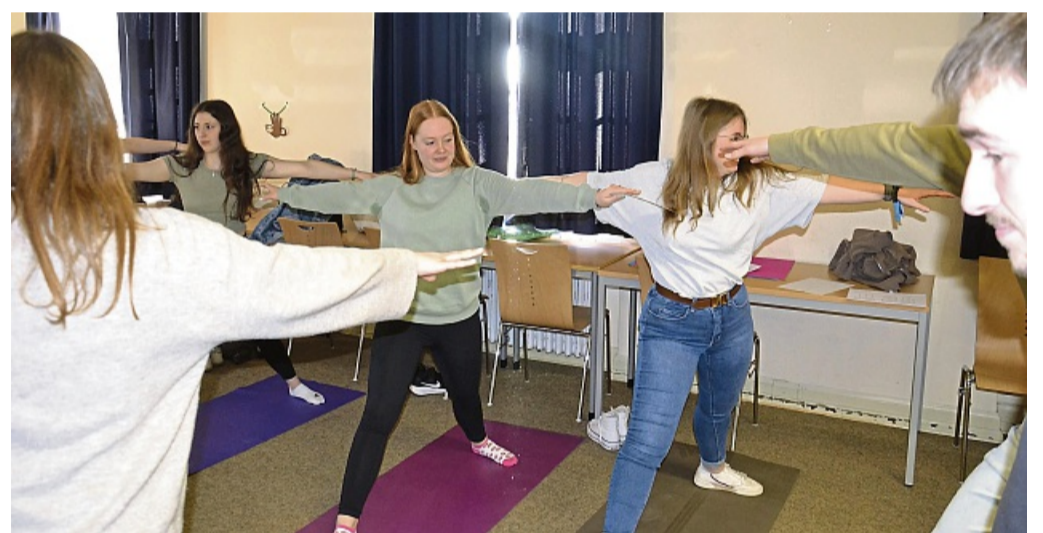
Den Körper spüren war ein wichtiger Punkt bei den Entspannungsworkshops.

So einiges probieren die Entspannungsexperten mit ihren