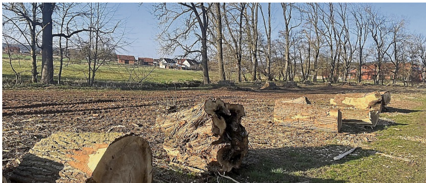
Am Rande des Naturschutzgebietes Stadtbruch wurden ausgewachsene Hybridpappeln gefällt. Es war die Vorbereitung für die Umsetzung der Renaturierungsmaßnahmen im Verlauf der Twiste.

serverband vor. Um im Herbst loslegen zu können, seien rechtzeitig vor Beginn der Schonfristen alle störenden Pappeln im Bereich zwischen Stadthalle und Hundeübungsplatz entnommen worden. Vahle. Die Hybridpappeln gehören eigentlich sowieso nicht in den Stadtbruch. Außerdem waren die Bäume schon nahe an ihrem natürlichen Maximalalter angelangt. Die an gleicher Stelle stehenden Eschen seien nicht angerührt worden, weil sie als standortgerecht gelten. An dem Trampelpfad und weiter bis zum Brausewehr sollen Flutmulden geschaffen werden, die bei Hochwasser Entlastung für die Altstadt bringen und von hohem ökologischen Wert seien.