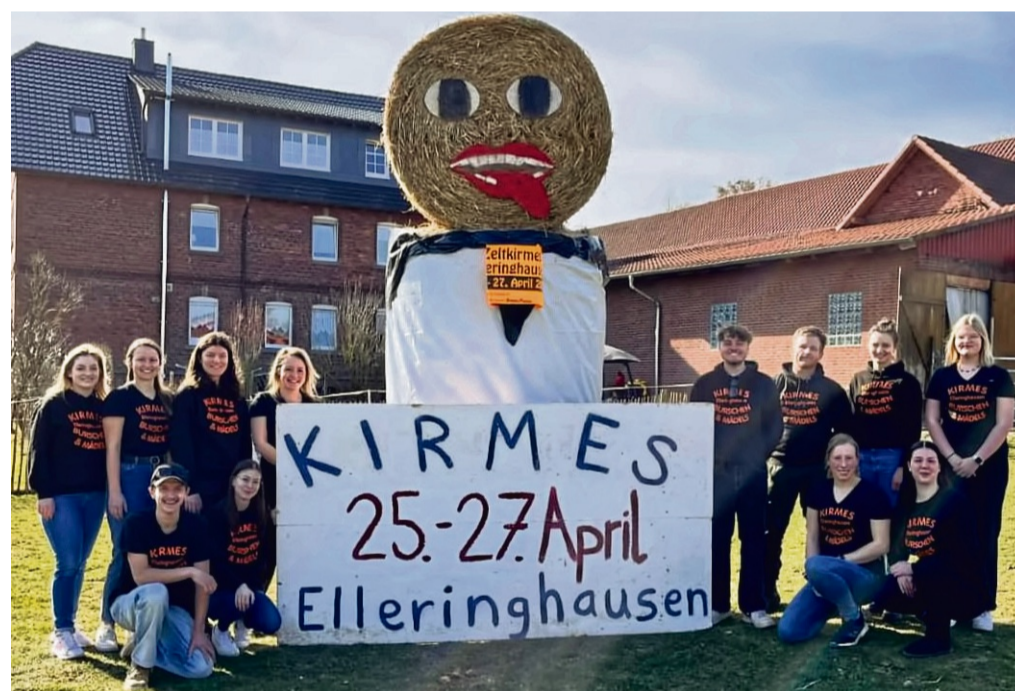
Die Kirmesburschen und -Mädels freuen sich schon riesig auf ihr Event.

Am Kirmessonntag ab 15 Uhr laden die Elleringhäuser herzlich zu Kaffee und Kuchen ein, der durch die Unterstützung der „Wilden Bie-