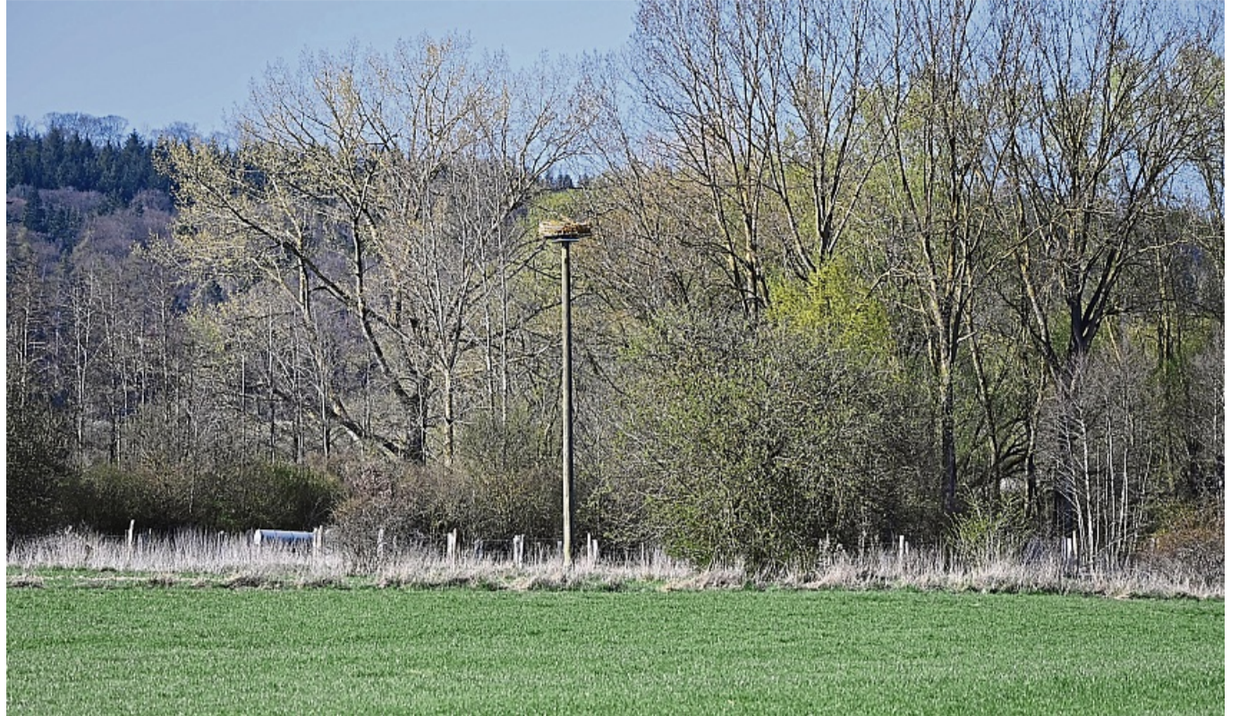
Aufgestellter Storchenmast vor Lelbach in unmittelbarer Nähe vieler ökologisch hochwertiger Flächen des NABU und eines Biolandwirtes.

Tickets für die Vorstellung in der Stadthalle kosten zwischen elf und 15 Euro und sind bei der Korbach-Information, Prof.-Bier-Straße 15, oder auch online unter korbach.reservix.de erhältlich.