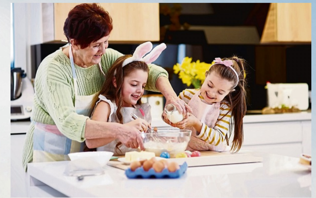
Gemeinsame Zeit genießen: Für Kinder gehört das Backen süßer Leckereien zur Osterzeit mit dazu.

Für alle, die es zu Ostern etwas gesünder mögen, lassen sich klassische Rezepte problemlos abwandeln. Statt Weißmehl kann etwa