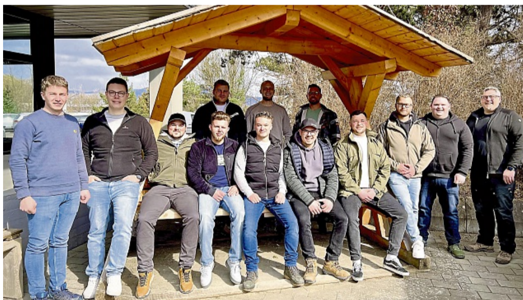
Können jetzt Chefs am Bau sein: die Absolventen der Aufstiegsfortbildung zum „Geprüften Polier“.

Aufstiegsfortbildung am Bildungszentrum der Bauwirtschaft