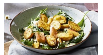
Frühlingsfrisch: Kartoffel-Rhabarber-Salat bringt saisonale Abwechslung auf den Tisch.

Viele halten Rhabarber für Obst. Botanisch gesehen ist er aber ein Gemüse. Warum also die Stängel nicht mal herzhaft servieren? Etwa in diesem Kartoffel-Rhabarber-Salat der Kartoffel-Marketing-Gesellschaft: