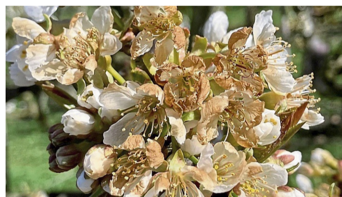
Weiß zu braun: Frostige Temperaturen sorgen für Schäden an den geöffneten Blüten.