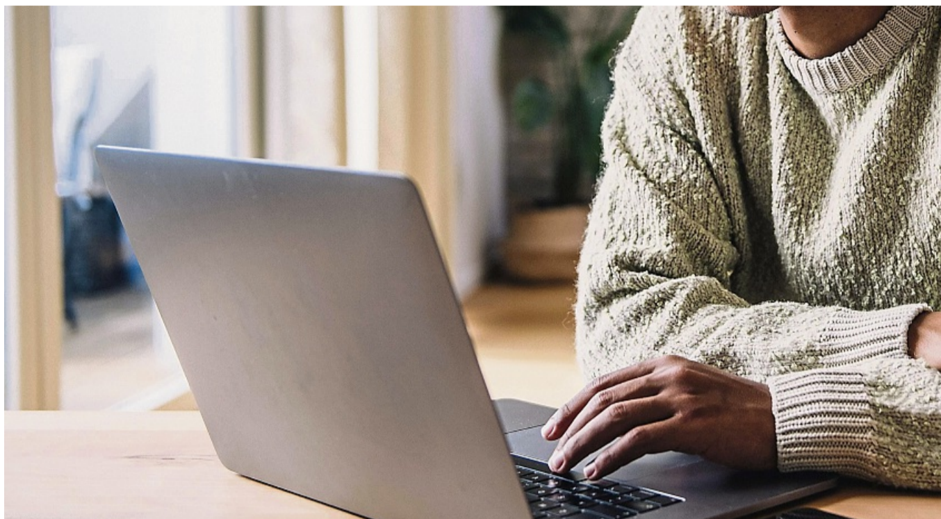
Länger Freude am Laptop: Mit regelmäßigen Backups und Updates lassen sich viele Probleme vermeiden.

Wichtig zu beachten: Um Schadsoftware zu vermeiden, sollte ein Antivirenprogramm