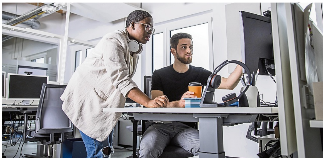
Gute Planung zahlt sich aus: Wer früh Urlaub für Brückentage beantragt, hat bessere Chancen, freizubekommen.

Gut zu wissen: Ist der Urlaub einmal genehmigt, kann der Arbeitgeber ihn aber nicht einfach so widerrufen. Andersrum darf der Arbeitgeber Beschäftigte in der Regel auch nicht dazu zwingen, an Brückentagen Urlaub zu nehmen. Das ist laut Volker Görzel nur erlaubt, wenn wirklich wichtige Gründe in dem Betrieb vorliegen. tmn