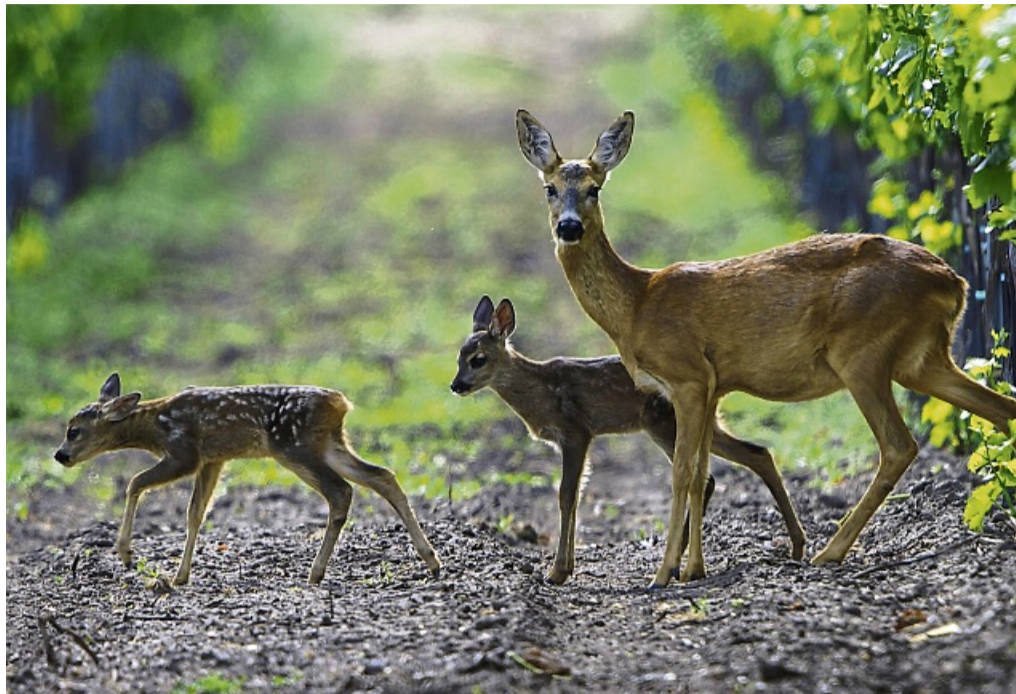
Brauchen eine möglichst störungsfreie Kinderstube: eine Ricke mit zwei Kitzen. Die Jungtiere werden spätestens im Mai geboren, aber auch die trächtigen Tiere sind derzeit durch jagende Hunde in Gefahr.

„Im Frühjahr sind die Wildtiere besonders störungsempfindlich“, erklärt Brauneis, der auch für den Landesjagdverband Hessen tätig ist. „Die Vegetation entwickelt sich gerade erst und die Tiere finden noch wenig Deckung im Wald und besonders auch in den Feldflur-