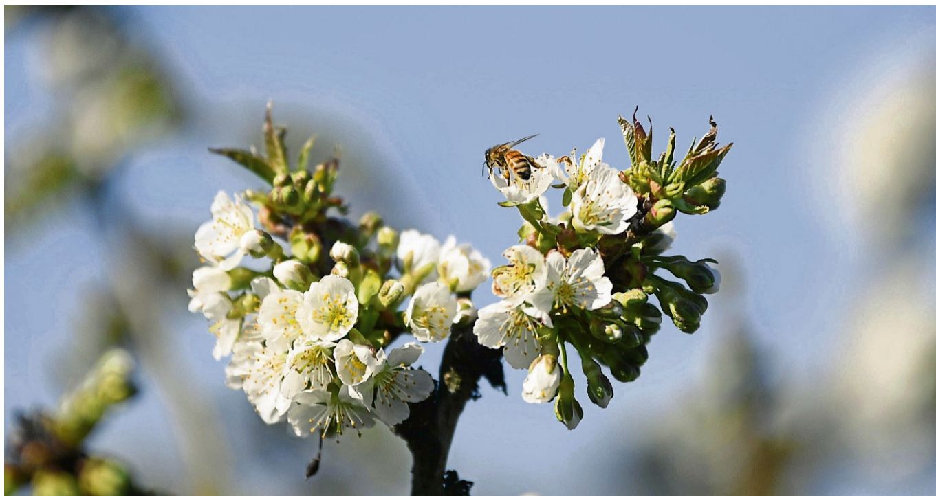
Die erste Kirschblüte 2025: Eine Biene sitzt auf den blühenden Ästen eines Kirschbaums in Unterrieden.

Einen kleinen Rückschlag für die Kirschblüte stellen die Frostschäden in Folge der gesunkenen Temperaturen in den vergangenen Nächten dar. „Es sind etwa 40 bis 50 Prozent der Blüten von frühblühenden Sorten betroffen“, berichtet