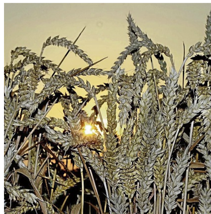
Benötigt zum Wachsen die richtige Pflege: Weizen mag nitrat-haltige Dünger.

transportiert werden. Solange die Pflanze transpiriert, kann sie also auch den Stickstoff aufnehmen. Bei anstehenden Maßnahmen Herbizid wird empfohlen Mangan – ca. 250g/ha – mitzunehmen. Auch Mittel zur Stressreduzierung können sinnvoll sein.