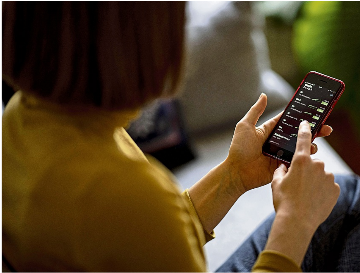
Bringt langfristig gesehen deutlich mehr Rendite als eine Tagesgeldanlage: die breit gestreute Geldanlage an der Börse.

Aufgrund der unterschiedlichen durchschnittlichen Ren-