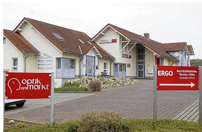
Auch das ist das Blumenfeld: Vom Optiker über Physiotherapie bis zur Versicherungsagentur – die Vielfalt wächst mit.