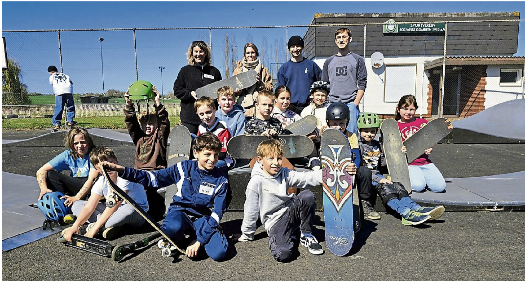
Die bis Ende Juni gemietete Pumptrackanlage in Gombeth ist eine Attraktion: Kinder und Jugendliche testeten sie am Eröffnungstag mit Rädern und Skateboards. Mitglieder vom Skateboardclub Mr Wilson aus Kassel gaben Workshops.