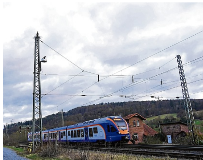
Gefährlicher Standort: In Körle nisten Störche auf einem Oberleitungsmast in der Nähe des Bauhofs.

chen Stromschlag bekämen. „Für die Jungvögel kann die Lage des Nests auch gefährlich werden“, sagt Krüger-Wiegand. Sie seien noch unerfahren und könnten deshalb vor vorbeifahrenden Zügen fliegen. Manchmal komme es zudem zu Storchenkämpfen. Das dabei entstehende Chaos könne auch zu Unfällen mit den Zügen oder den Oberleitungen führen. Um die Vögel zu schützen, ist es möglich, das Nest zu entfernen. „Wenn die Störche schon brüten, geht das aber nicht mehr“, sagt Krüger-Wiegand. Umsetzen könne man das Nest nicht. „Das nehmen die Störche nicht an.“ Für das Entfernen des Nestes