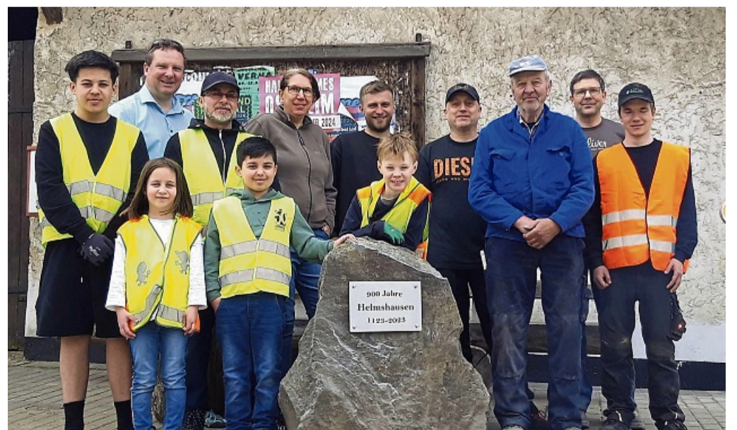
Aufgestellt: Die Helmshäuser mit ihrem neuen Gedenkstein im Ort.

Dem Ruf folgten 23 Helmshäuser bei bestem Wetter. Jung und Alt – alle machten fleißig mit, heißt es vom Ortsbeirat.