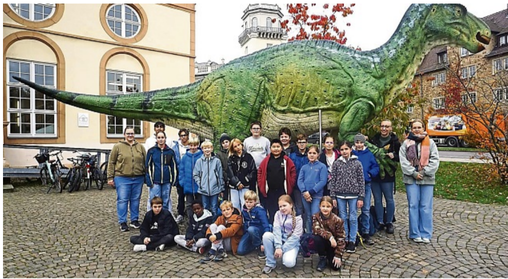
Veranstaltungen begleiten: Die Haspel bietet Teamerschulungen an, bei der junge Menschen ausgebildet werden, um Gruppenveranstaltungen wie beispielsweise die Ferienspiele zu begleiten.

Begleitet werde die Schulung von Referenten, die das Programm mit spannenden, wissenschaftlichen sowie interaktiven Inhalten füllen. Durch verschiedene Gruppenaufgaben sollen die Teilnehmer erfahren, als Team zusammenzuarbeiten und dabei ein Gruppengefühl zu entwickeln, heißt es weiter.