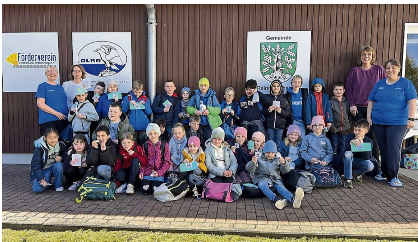
Schwimmpässe und erworbene Abzeichen durften die Kinder der Königshofschule nach der Projektwoche mit nach Hause nehmen.

Am Ende der Woche wurden die Prüfungen für 8 Seepferdchen-, 12 Bronze- und 2 Silberabzeichen bestanden, was ein