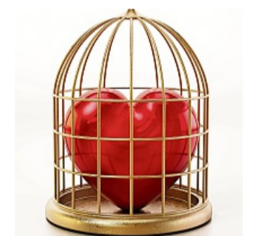
Die böse Hexe verwandelt junge Mädchen in Vögel und steckt sie in Käfige

Joringel deutete den Traum als einen Wink des Schicksals, und als er erwachte, machte er sich auf die Suche nach einer solchen Blume. Tatsächlich fand er sie nach neun Tagen, eilte zum Schloss und fand den Saal, in dem die Zauberin gera-