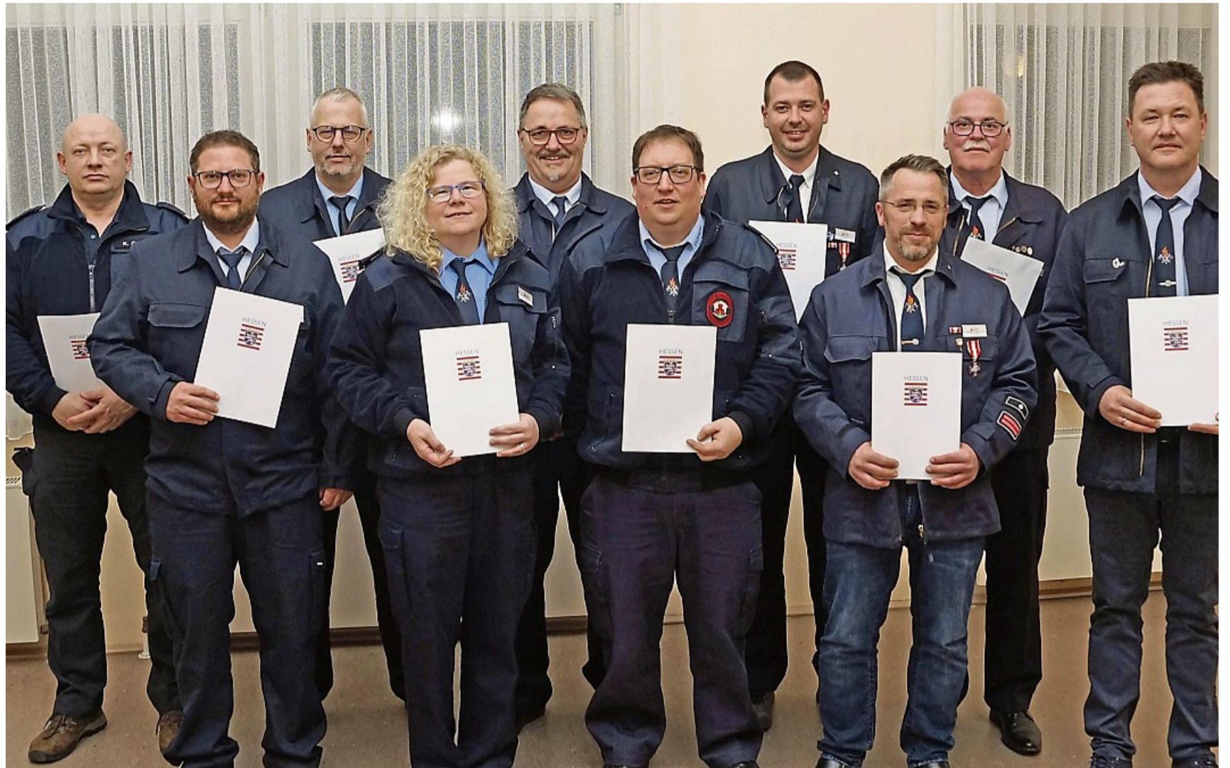
Für ihren langjährigen aktiven Dienst erhielten einige das Silberne Brandschutzehrenzeichen, andere eine Anerkennungsprämie.

Er bezweifelt, dass das bei den Kommunen zur Lösung drückender Probleme im Brandschutz beitrage. Zudem