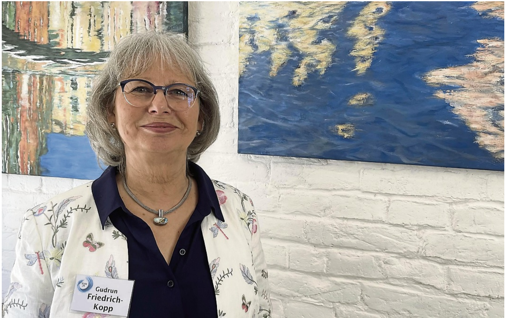
Bei den Werken der Künstlerin Gudrun Friedrich-Kopp steht das Element Wasser im Vordergrund.

Als Betrachter wirkt das Meer in einigen Werken als Bedrohung, in anderen Darstellungen machen sich die Weite und eine Sehnsucht nach Frei-