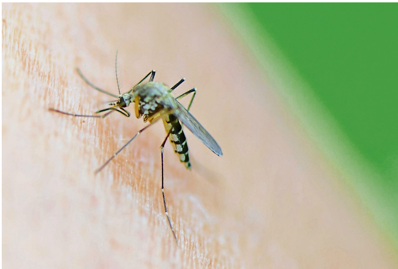
Damit es gar nicht so weit kommt, nutzen viele im Sommer gern Insektensprays. Was sie taugen, hat die Stiftung Warentest untersucht.

„Protect Mücken Schutzspray“ von Mosquito (Note 2,1).