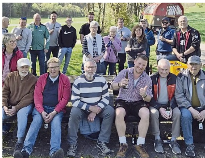
TSV Ulfgrund: Die Wanderung der Alten Herren von Ulfen nach Breitau

Gerne würden wir weitere Mitglieder für einen kleinen Mitgliedsbeitrag in unserer schönen Gemeinschaft der Alten Herren im TSV Ulfgrund begrüßen.