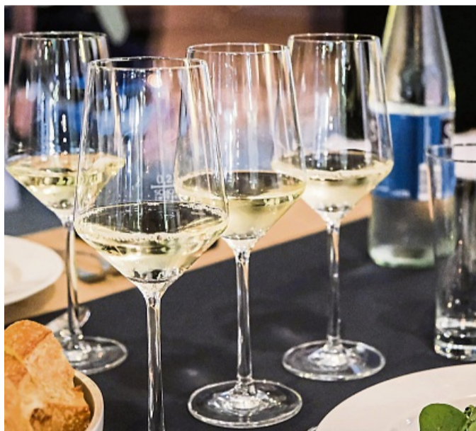
Welcher Tropfen mundet mir mehr? Um eine Antwort zu finden, ist der direkte Vergleich von Weinen hilfreich.

und sich durch die hiesigen Weinregionen zu kosten.