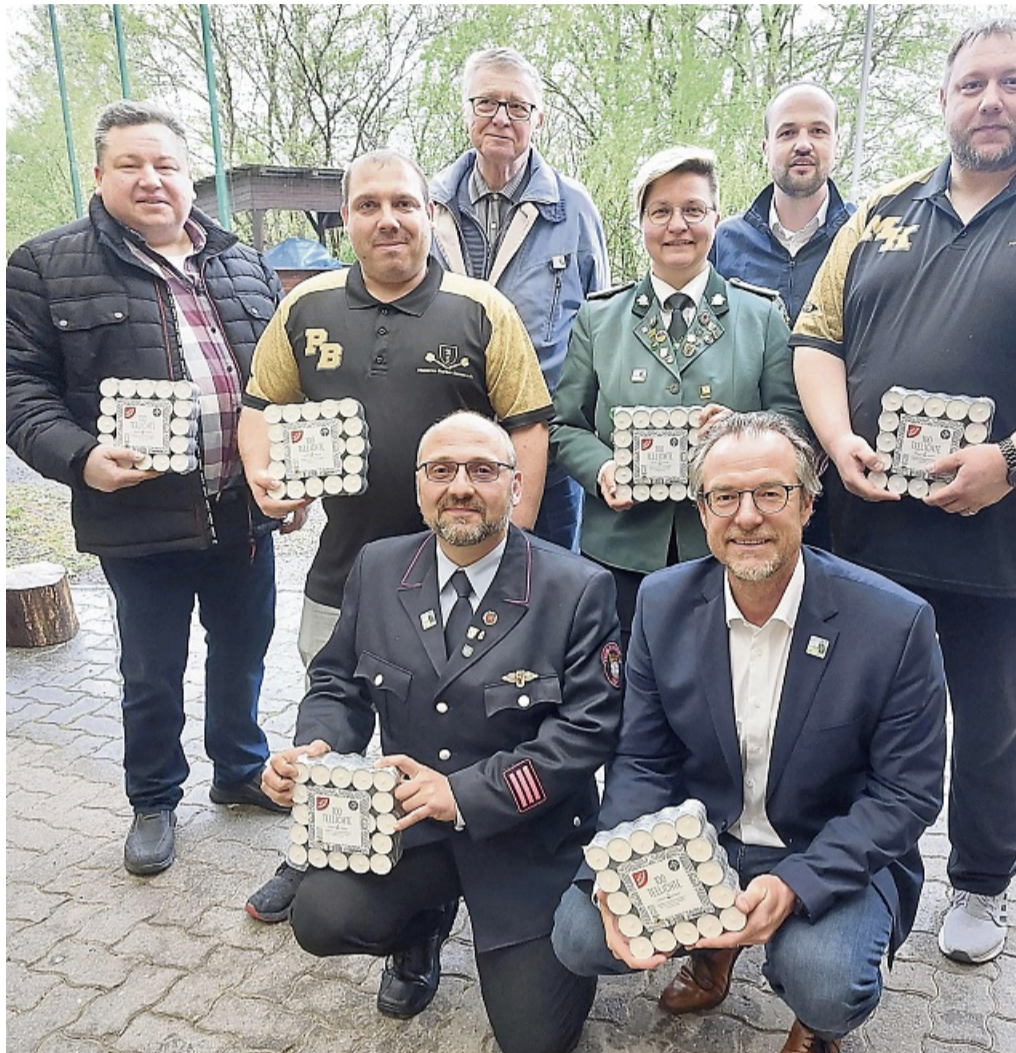
Ein herzliches Dankeschön geht an die Vereine und Unternehmen, die durch das Spenden der Teelichter das „Lichter-Meer Sontra“ ermöglichen.

„Das Lichterfest im vergangenen Jahr war eine großartige Neuerung auf der BREiTWiESN. Mit einem tollen Flair und vielen teilnehmenden Kindern und Familien, wird es si-