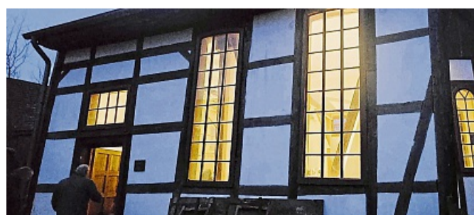
Ziel des Ausfluges ist die Synagoge in Harmuthsachsen.

Das Orga-Team Heinrich Gümpel und Willi Eckhardt