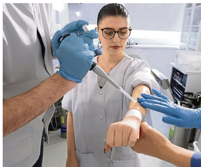
Zehn Mittel gegen Mücken und Zecken haben die Warentester geprüft.

Vom Wirkstoff PMD sind die Testerinnen und Tester insgesamt weniger überzeugt – er wirkt nur mittelmäßig gegen Mücken. Und auch hier kann es zu starken Augenreizungen