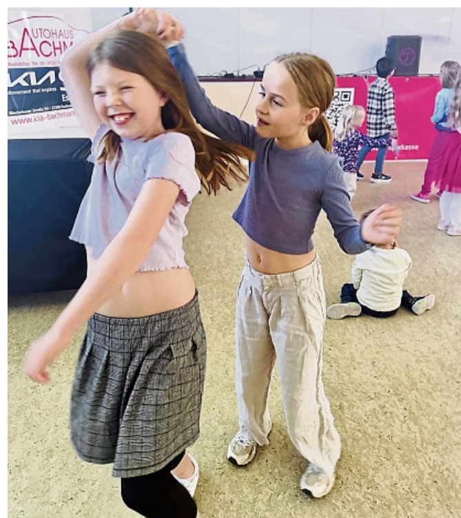
Dieser Tag gehörte ihnen: den tanzversessenen Mädchen.