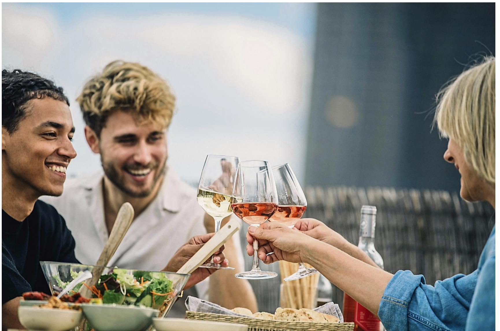
Zwei, drei Weine kaufen, gemeinsam mit Freunden verkosten und darüber sprechen: Auch das hilft, Vorlieben klarer zu definieren.