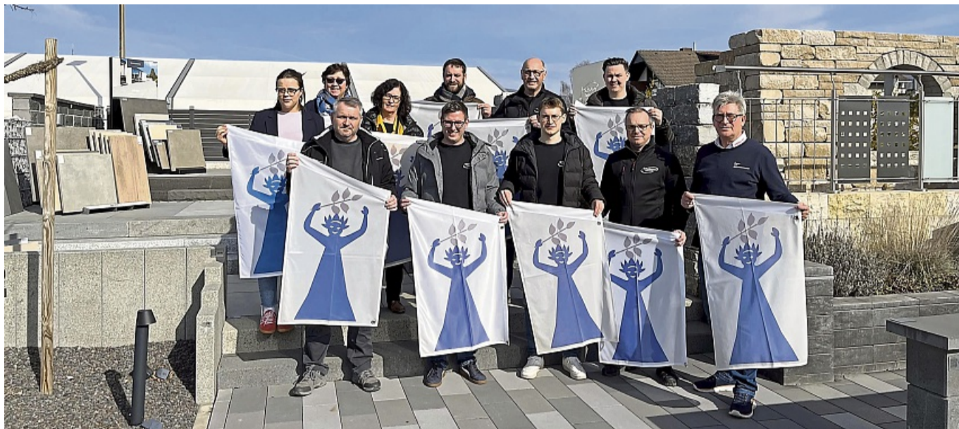
Das Orga-Team vom Thüringer Straßenfest lädt Groß und Klein herzlich ein: Am 4. Mai gibt es auf der zwei Kilometer langen Festmeile wieder ein tolles Programm.

Auch in diesem Jahr gibt es wieder das beliebte Stempelotto: Wer acht Stempel sammelt, ist im Rennen um den Preis: Es gibt ein Erlebniswochenende im Klimahaus Bremerhaven inklusive Übernachtung und Ta-