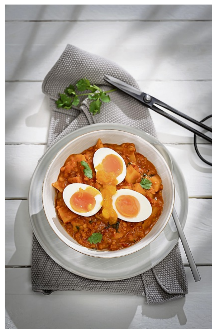
Wer dieses Curry fleischlos genießen will, gibt statt Brühwürstchen einfach gekochte Eier hinein.

Für die Variante mit Fleisch die Würstchen ganz oder klein