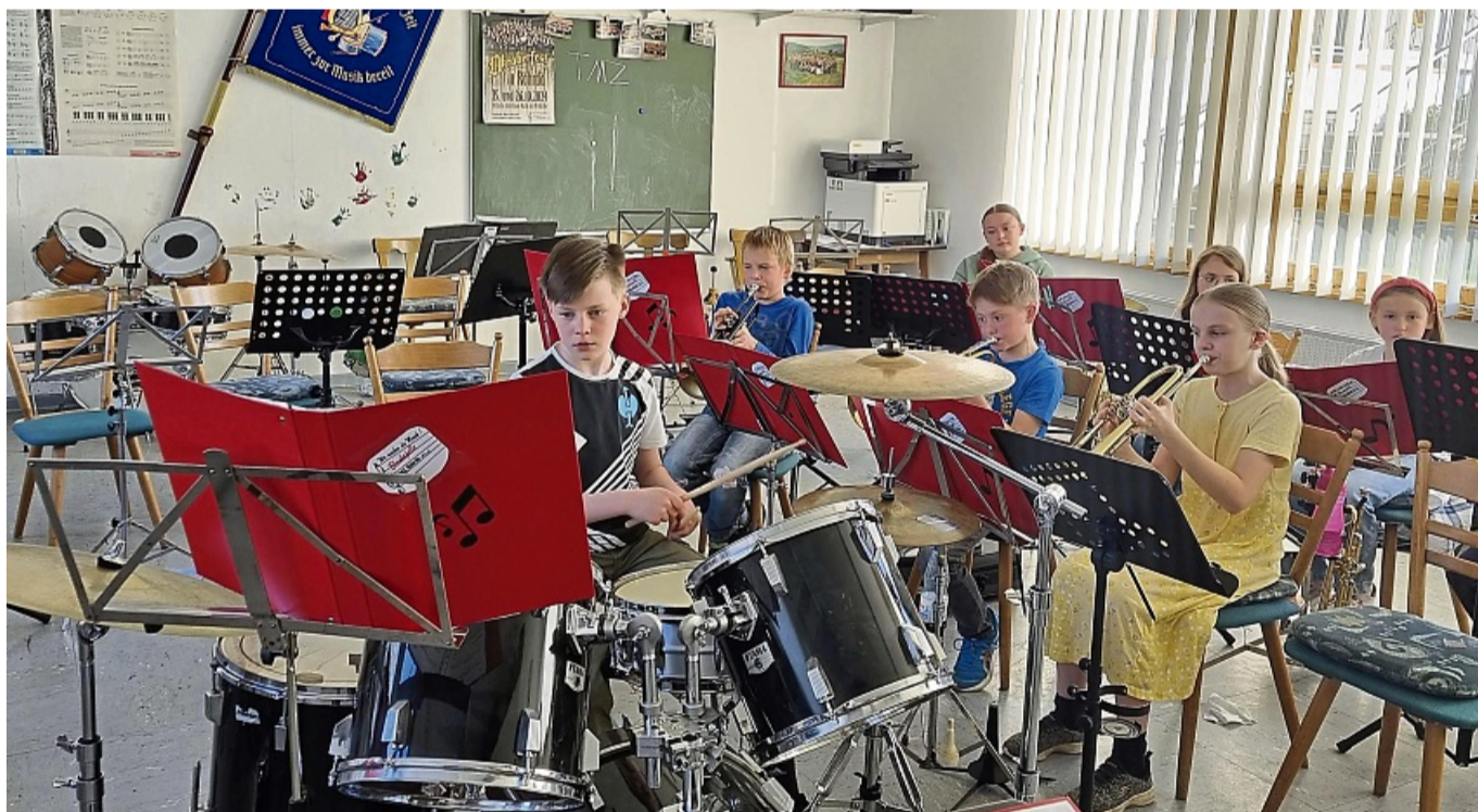
Der Nachwuchs beim Musizieren: 13 Kinder gehören aktuell neuem dem Jugendorchester des TMZ Röhrda an. Viele von ihnen haben den Weg zur Musik über das Instrumentenkarussell im vorigen Jahr gefunden.

Musikbegeisterte sind auch jederzeit bei einer der Proben willkommen. Diese finden jeweils Montag von 20 bis 22 Uhr an der Leimkaute 4 in Ringgau-Röhrda statt.