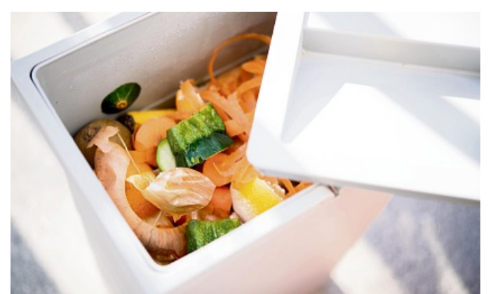
Ob roh, gekocht oder verdorben: Essensreste finden ihren Platz im Biomüll.

Generell kommt so gut wie alles, was aus der Natur kommt, in die Biotonne. Dabei kann es sich etwa um pflanzliche Objekte wie Laub, Rasenschnitte, Blumen, Topfpflanzen für die Biotonne strenger. Da zu oft Fremdstoffe mit entsorgt werden, sollen mehr Kontrollen dabei helfen, das zu reduzieren. Denn der Bioabfall ist wichtig. Aus ihm werden unter anderem Gartenerde und Dünger gemacht. Doch dafür muss richtig getrennt werden.