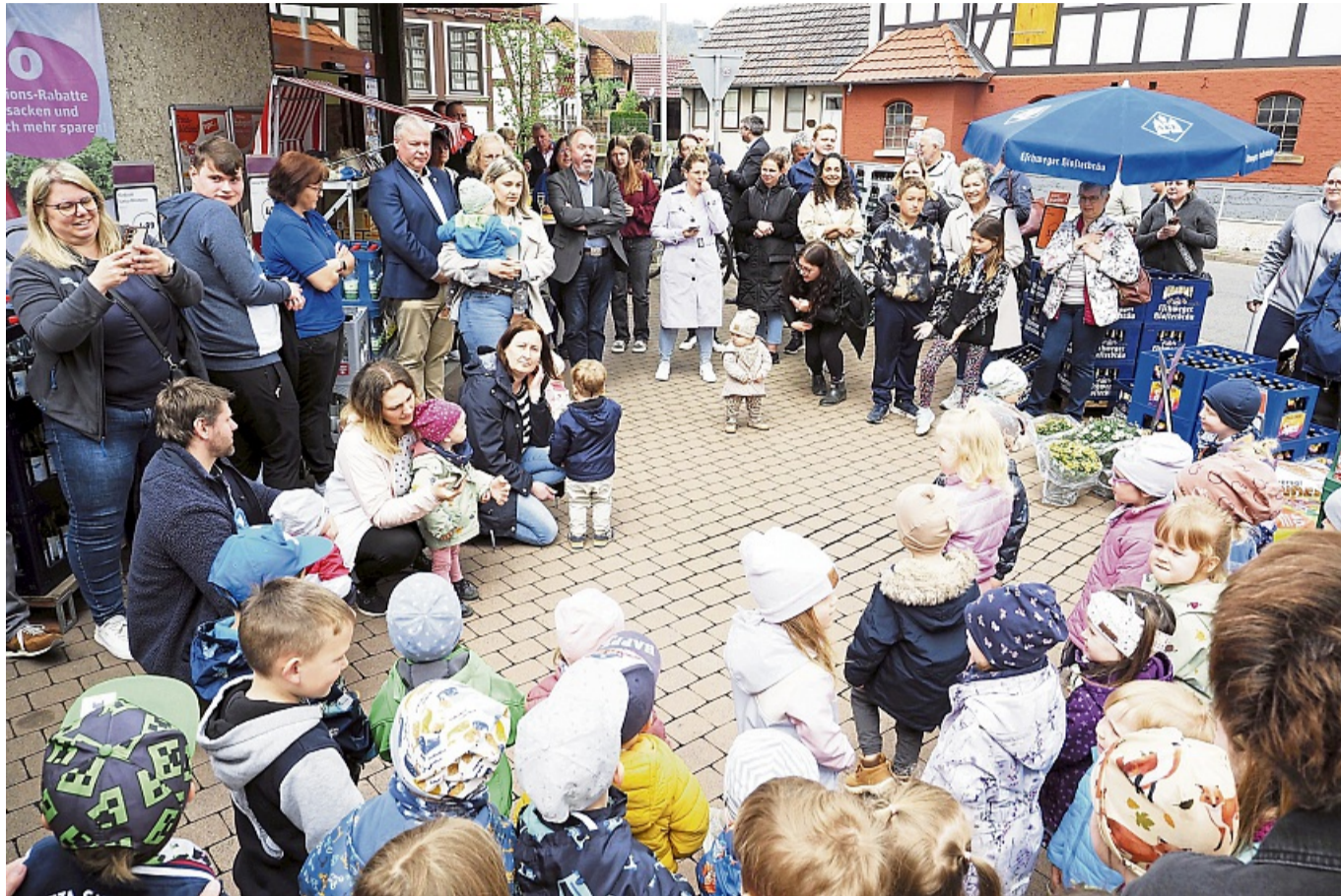
Das „Lädchen“ ist ein Treffpunkt für den Ort: Ein Geburtstagsständchen sangen zum Auftakt der Jubiläumswche die Mädchen und Jungen des Kindergartens.