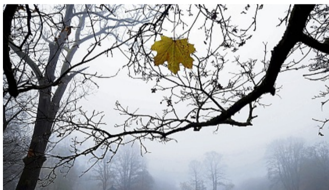
Depression ist eine Krankheit , die viele betrifft. In der „Selbsthilfegruppe Gedankenfrei“ können sich Betroffene darüber austauschen.

Geeignet ist die Selbsthilfegruppe daher für Menschen, die an einer Depression und