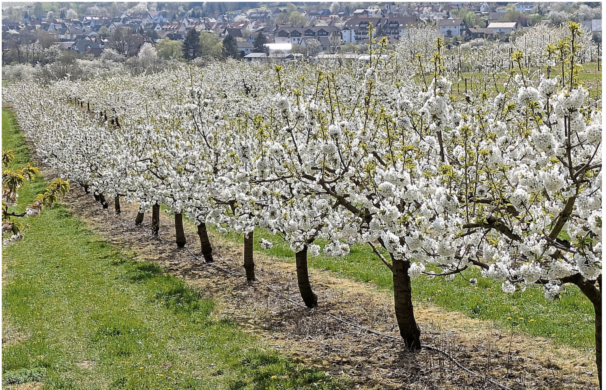
Auch in diesem Jahr gibt es wieder schöne Foto-Motive von der Kirschblüte , so wie dieses vom 15. April in Witzenhausen. Die Aufnahme wurde im Bereich Hof Kindervatter mit Witzenhausen im Hintergrund von HNA-Leser Karl Heinz Goebel aus Laudenbach während einer Radtour gemacht.

Witzenhausen – Die Kirschen im Kirschenland Witzenhausen liegen voll in ihrer Blüte. Wie aus einer Mitteilung des Geo-Naturparks Frau-Hollerland hervorgeht, haben in der Woche vor Ostern die Bäume der frühen Sorten zu blühen begonnen. Auch in den kommenden Tagen steht das Blütenmeer an den Hängen und Plantagen in seiner vollen Pracht, zur Freude von Spaziergängern, Wanderern und Radfahrern, die die Region im Frühling besonders schätzen.