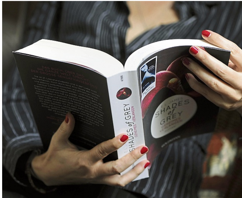
Fesselnde Fantasien: Dark Romance begeistert – doch nicht ohne innere Wirkung.