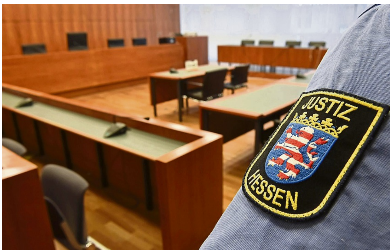
Der Schwurgerichtssaal des Landgerichts in Kassel: Hier wurde am Donnerstag die Hauptverhandlung gegen den Mann aus Witzenhausen geführt.

Oberstaatsanwalt Blosche verlas die Anklageschrift gegen