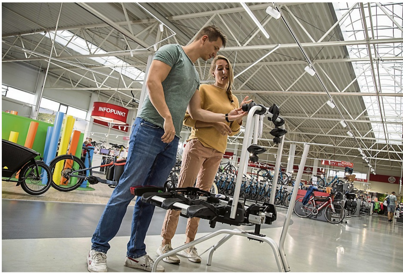
Sicherheit geht vor: Stützlast und Fahrradgewicht sollten unbedingt zusammenpassen und beim Kauf berücksichtigt werden.

Vermutlich kommen trotz der Einschränkungen zahlreiche Modelle für Sie infrage.