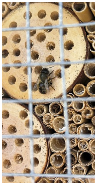
Erste Bewohner sind schon da: Insekten nahmen das neue Zuhause gut an.

Im Anschluss stärkten sich Kinder und Erwachsene am