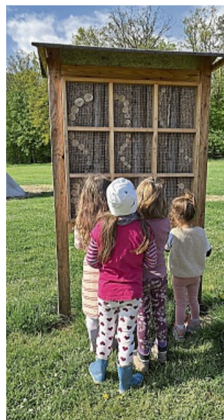
Einweihungsfest Waldkindergarten Rehkids Neues Insektenhotel im Waldkindergarten Rehkids feierlich eingeweiht