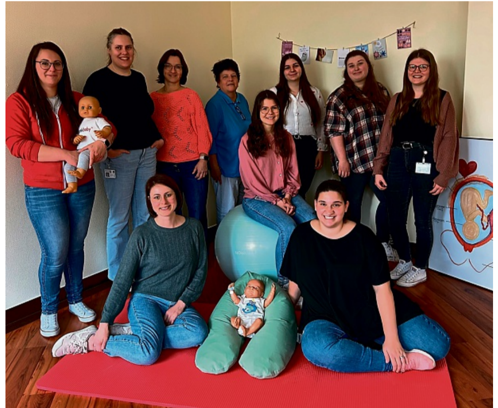
Sie helfen beim Start ins Leben: Die Hebammen der Geburtsstation im Asklepios Klinikum Schwalmstadt.

Der Geburtsvorbereitungskurs bietet beispielsweise eine ganzheitliche Unterstützung für alle, die ein Kind erwarten. Mit fundiertem Wissen und praktischen Tipps helfen die Hebammen, sich auf die Geburt und die Zeit danach vorzubereiten – und mögliche Ängste abzubauen. Die Geburtshelferinnen vermitteln wertvolles Wissen und zeigen in praktischen Übungen, wie die Gebärenden den Geburtsvorgang aktiv unterstützen können. Die Teilnahme ist zwischen der 24. und der 32. Schwangerschaftswoche empfehlenswert. Die Kurse sind sowohl für Einzelpersonen als auch für Paare konzipiert. Die Geburtsvorbereitung für Frauen findet jeweils montags ab 18 Uhr in der Frauenklinik des Ziegenhainer Krankenhauses statt – für Paare gibt es einmal im Monat einen Wochenend-Crash-Kurs. Für Schwangere