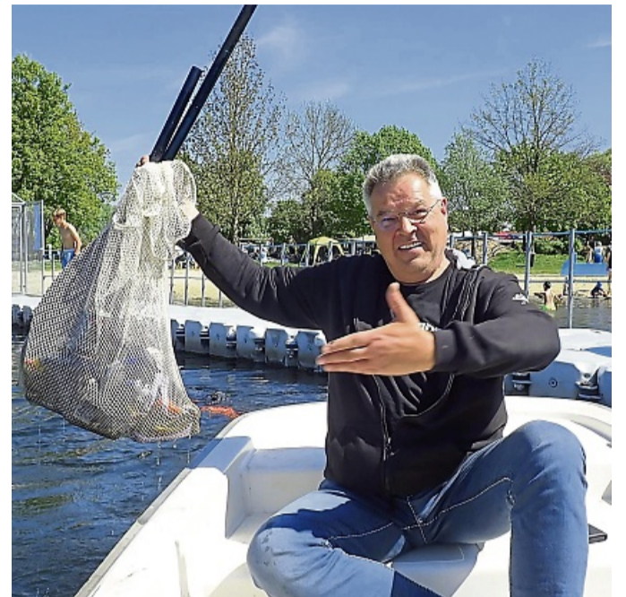
Kemper mit Fundstücken