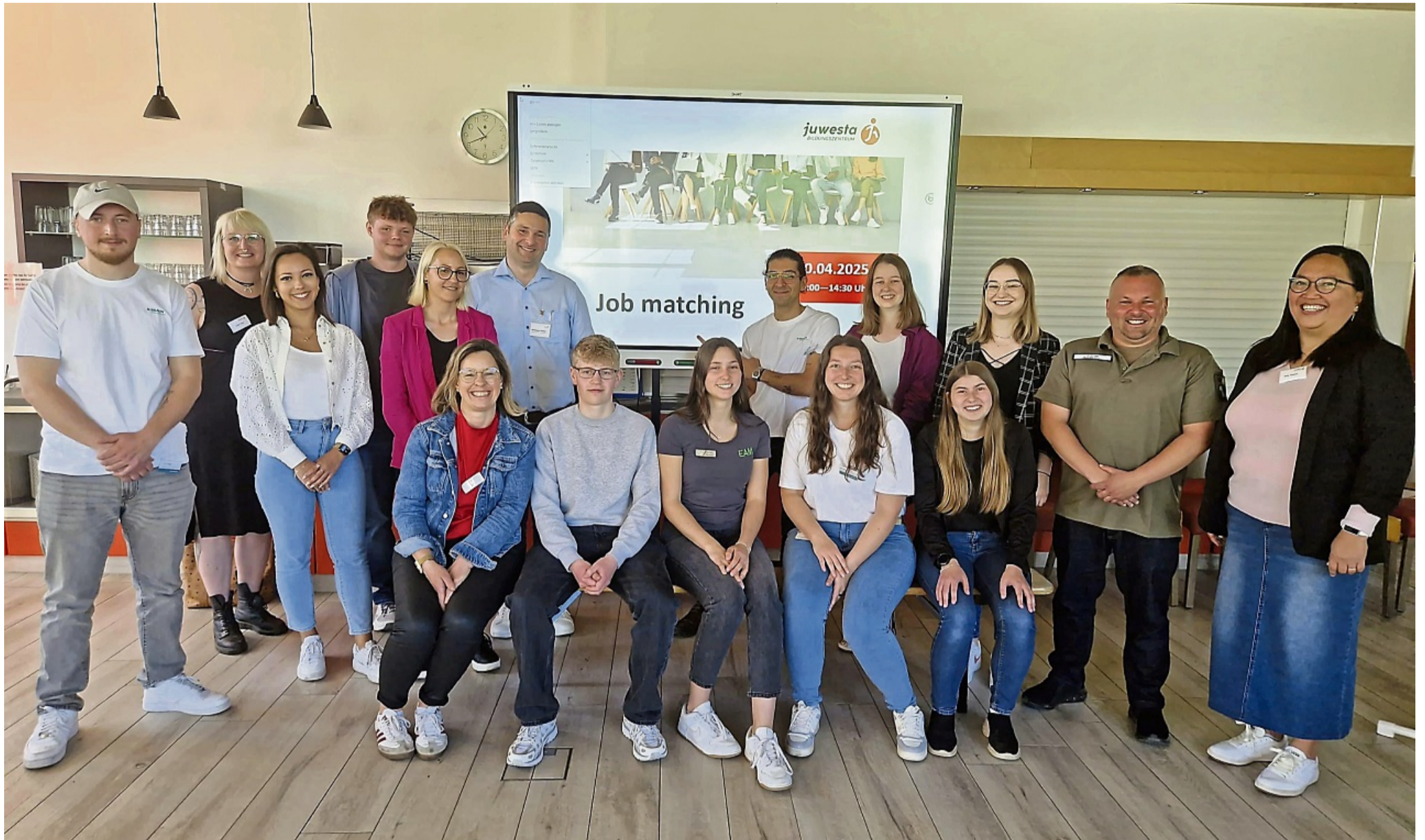
Format kam gut an: Die Teilnehmer beim Job-Speed-Dating hatten jeweils zehn Minuten Zeit, ins Gespräch zu kommen.