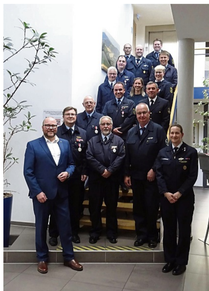
Auszeichnungen, Beförderungen und Ehrungen: Die Gemeinde Morschen hat Feuerwehrangehörige für ihren langjährigen ehrenamtlichen Einsatz und besondere Verdienste geehrt.