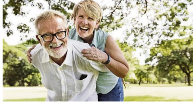
Alles neu macht der Mai: Der Wonnemonat lädt zum Flirten an unterschiedlichen Orten ein.

Vielleicht begegnen Sie Ihrer großen Liebe im Freibad, vielleicht auch im Urlaub oder beim Speed Dating. Oder sie wartet schon ganz in Ihrer Nähe auf Sie und Sie finden Ihren Traummann oder Ihre Traumfrau bei partner.HNA.de. Einen Versuch ist es jedenfalls wert, oder?