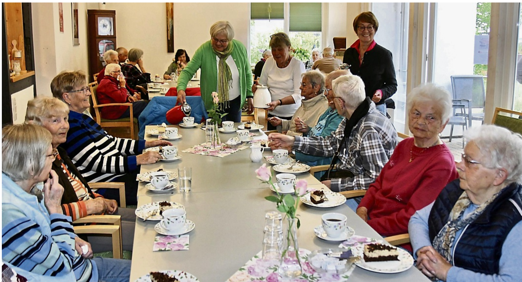
Das Begegnungs-Café in Beiseförth findet großen Anklang: Die Ehrenamtlichen versorgen die Teilnehmer mit Kaffee und Kuchen.

Mit Spannung erwarten die Teilnehmer immer die Kuchenauswahl, heißt es vom Verein. Eine Auswahl stehe am Eingang, aus der sich jeder aussuchen kann, was ihm am liebsten ist. Wie die Teilnehmer sagten, sind die Torten „das Leckerste“ in ganz Malsfeld, denn sie werden von den fünf Helfe-