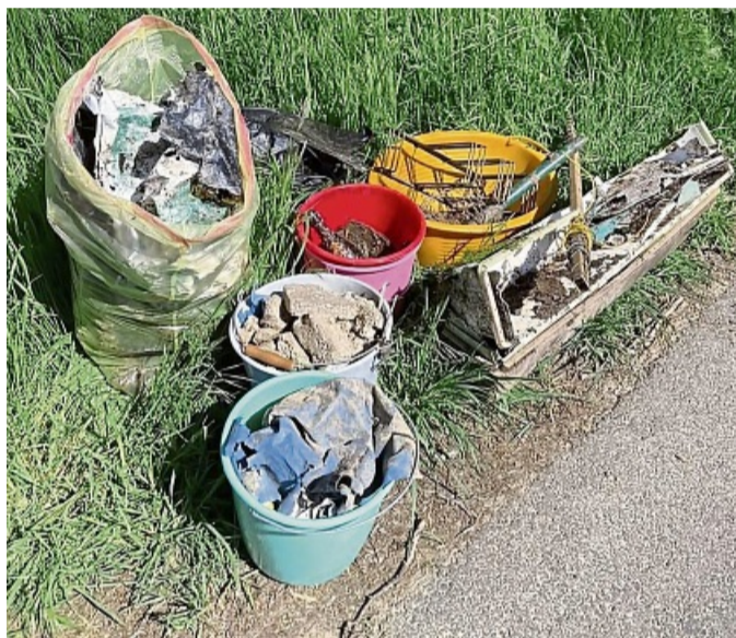
Ausbeute: Bei der Aktion sauberer Wengesberg sammelten Anwohner Müll.