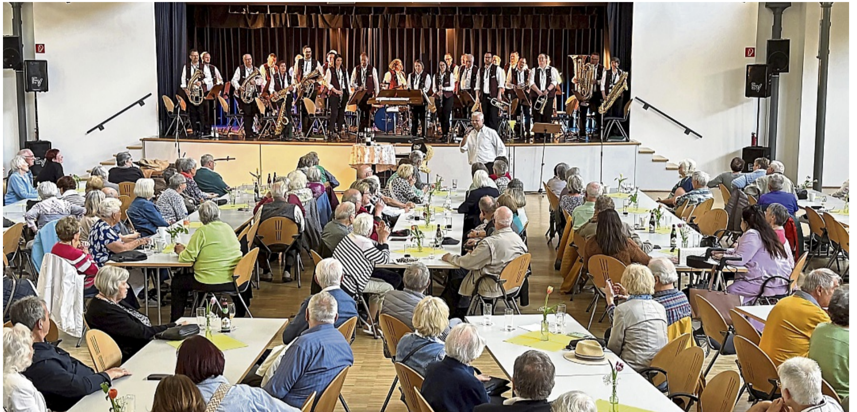
Voller Saal: Zu dem Konzert kamen rund 250 Gäste in die Kulturfabrik nach Melsungen. Sie applaudierten begeistert für die Blasmusiker.

Begrüßt haben die Blasmusiker ihre Gäste mit „Grüß Gott, ihr Freunde“. Schon nach wenigen Takten war der Funke zum Publikum übersprungen und sie klatschten und sangen begeistert mit. Märsche, Polkas und Walzer boten den Zuhörern ein buntes und abwechslungsreiches Programm. Nach dem „Böhmischen Wind“ ließen die Musiker mit ihrer perfekten musikalischen Untermalung zur Melodie der „Finckensteiner Polka“ das Publikum von einem Bergpanorama