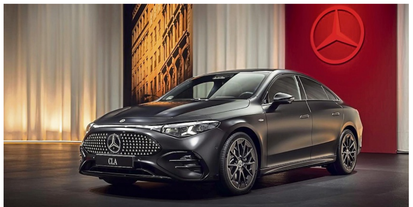
Das Autohaus Karl Weinhold präsentiert den neuen CLA

Am Samstag, den 17. Mai, und Sonntag, den 18. Mai 2025, präsentiert das Autohaus Karl Weinhold in Fritzlar aktuelle Neuheiten aus der Mercedes-Benz Welt. Im Mittelpunkt steht der neue CLA, das erste Modell einer neuen Fahrzeugfamilie auf der Mercedes Modular Architecture (MMA). Dieses Fahrzeug markiert den Beginn eines neuen Kapitels im Einstiegssegment von Mercedes-Benz. Mit Fokus auf Reichweite, Effizienz und Ladegeschwindigkeit setzt der neue CLA Maßstäbe in seiner Klasse. Das integrierte Betriebssystem MB.OS macht ihn zum bislang intelligentesten Modell von Mercedes-Benz. Angeboten wird der neue CLA mit Elektro- oder Hightech-Hybridantrieb. Neben dem neuen CLA können sich Interessierte auch über eine Vielzahl weiterer Modelle informieren – vom geräumigen SUV über sportliche Limousinen bis hin zum Mercedes-AMG SL. Auch vollelektrische Fahrzeuge aus der Mercedes-EQ-Reihe, die für