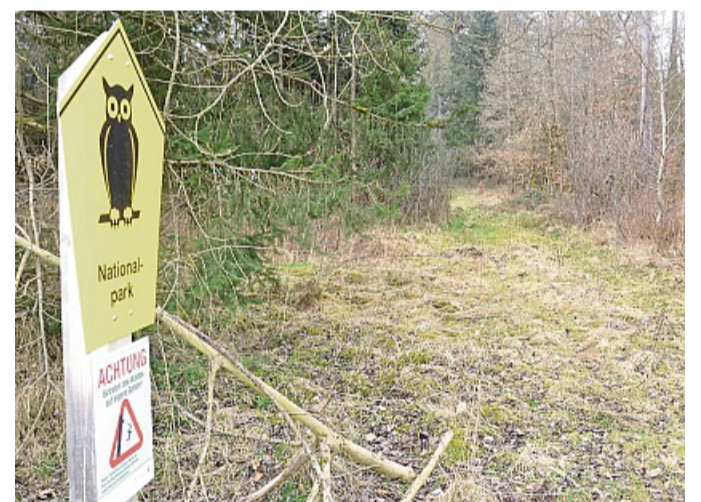
An der Grenze zum Nationalpark Kellerwald-Edersee soll bei Basdorf ein Friedwald von 42 Hektar Größe entstehen.