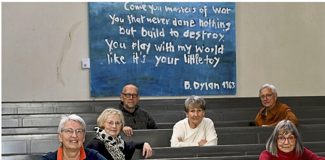
Künstlergruppe „artur“ eröffnet ihre Ausstellung zu „War and Peace“ in der Korbacher Kilianskirche.