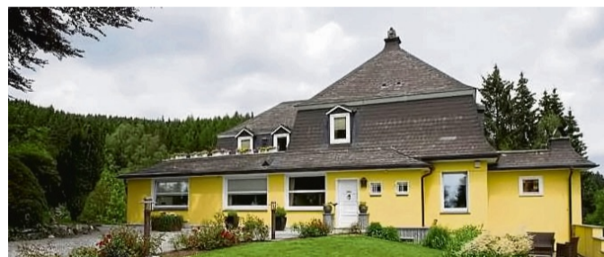
33 Projektstandorte werden von hier aus koordiniert: der Sitz der Verwaltung der Let's go! e.V. Jugendhilfe in Brilon-Wald.

bei regelmäßigen Treffen die Möglichkeit, Erfahrungen auszutauschen oder andere Wohngruppen kennenzulernen. „Nach der Ausbildungszeit stehen die Chancen sehr gut, übernommen zu werden. Zudem besteht die Möglichkeit, ein duales Studium zu absolvieren oder als Werkstudent/-in praktische Erfahrungen zu sammeln“, teilt „Let's go!“ mit. Der Verein bietet seinen Mitarbeitern ein facettenreiches Angebot an Entwicklungsmöglichkeiten sowie Benefits.