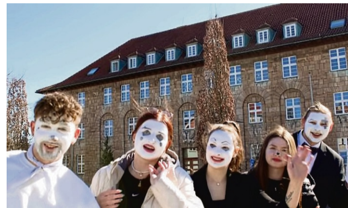
Als Erzieher in verschiedene Rollen schlüpfen: Im Modul „Darstellendes Spiel“ wird das in der Ausbildung schon mal ausprobiert.