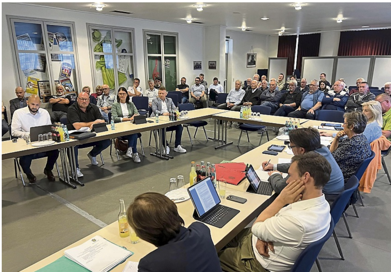
Großes Publikumsinteresse: Der Ausschuss für Umwelt, Planung und Stadtentwicklung tagte im Gemeinschaftsraum der Stadthalle Mengeringhausen zum Thema Jugendleistungszentrum auf dem Sportplatz Hagenstraße.

Inzwischen aber sei die Planung konkretisiert worden. Außerdem seien in vier Jahren die allgemeinen Baupreise gestiegen, sodass man nun mit Kosten in Höhe von 3,924 Milli-