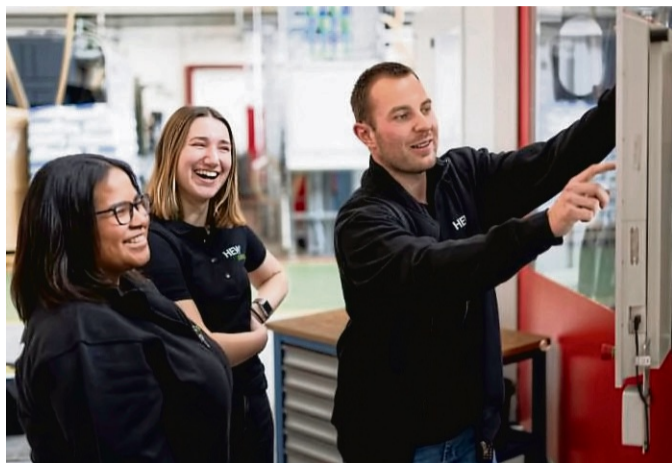
Auszubildende bei HEWI: Das moderne und erfolgreiche Familienunternehmen beschäftigt rund 550 Mitarbeitende weltweit – und das schon seit 1929.

Egal, ob man handwerklich begabt ist, sich für kaufmännische Abläufe interessiert oder Präzision und Perfektion sein Ding sind – bei HEWI wartet die passende Ausbildung. „Werde Teil ei-