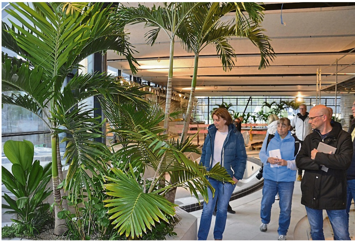
Ein wenig Flair: Die Begrünung im Lagunenbad akklimatisiert sich bereits.

Im Gastronomiebereich fehlt die Decke noch, in den meisten anderen Räumen sind nur noch Lücken für Beleuchtung und die Verkleidung der Sprinkleranlage offen. Die Schalldämmung funktioniere