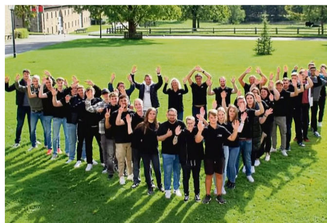
Die Auszubildenden der ALMO-Erzeugnisse Erwin Busch GmbH in Bad Arolsen.

WhatsApp: 05691 8961300 Instagram: almo_erzeugnisse