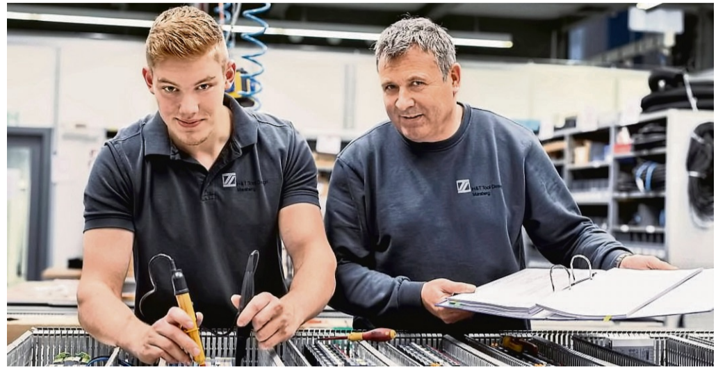
Die Ausbildung bei der Heitkamp & Thumann Group in Marsberg garantiert eine hohe Qualität und Weiterbildungsmöglichkeiten.

Tel. 0 56 31 - 50 50 80 www.froebelseminar.de