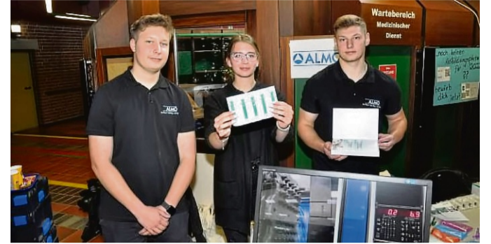
Auch die Firma Almo informiert bei der Ausbildungsbörse Nordwaldeck im Berufsbildungswerk Bad Arolsen.