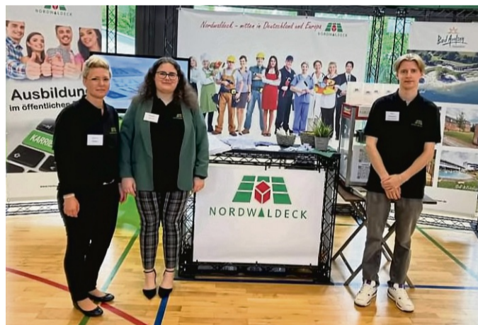
Am Stand der Stadt Bad Arolsen bei der Ausbildungsbörse Nordwaldeck im vergangenen Jahr.

waldecks gemeinsam ins Leben gerufen, um eine weitere Möglichkeit zur Berufsorientierung zu bieten.