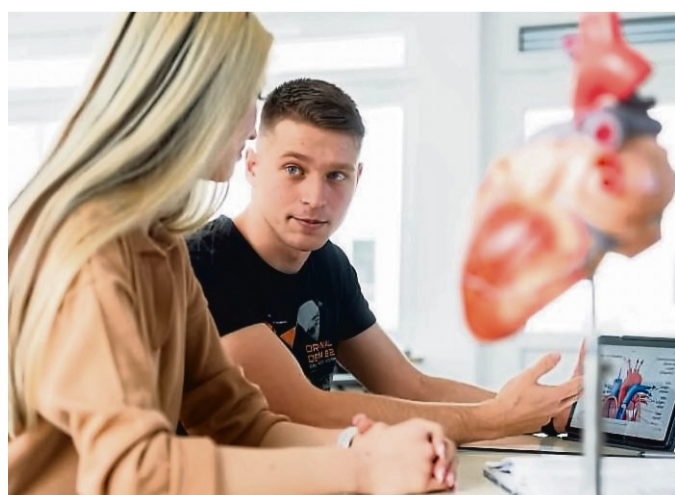
Die Pflegeausbildung am Korbacher Stadtkrankenhaus ist vielfältig und spannend.

eng mit weiteren Partnern zusammen. Die dreijährige Ausbildung ist im Blocksystem organisiert: Schulblöcke und praktische Einsätze wechseln sich ab. Nach erfolgreicher Ausbildung stehen zahlreiche Weiterbildungs- und Studienmöglichkeiten im Bereich der Pflege zur Verfügung. 72 Ausbildungsplätze stehen im Bildungszentrum bereit. Voraussetzung für die neue Ausbildung ist ein mittlerer Schulabschluss oder eine zehnjährige allgemeine Schulbildung. Hauptschulabsolventen können die Ausbildung absolvieren, wenn sie über weitere Qualifikationen verfügen. Ausbildungsbeginn ist der 1. Oktober eines jeden Jahres.