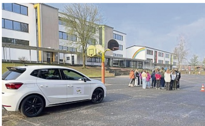
„Achtung Auto 2.0“ der ADAC Stiftung als innovative Unterrichtseinheit an der Adam-von-Trott-Schule in Sontra