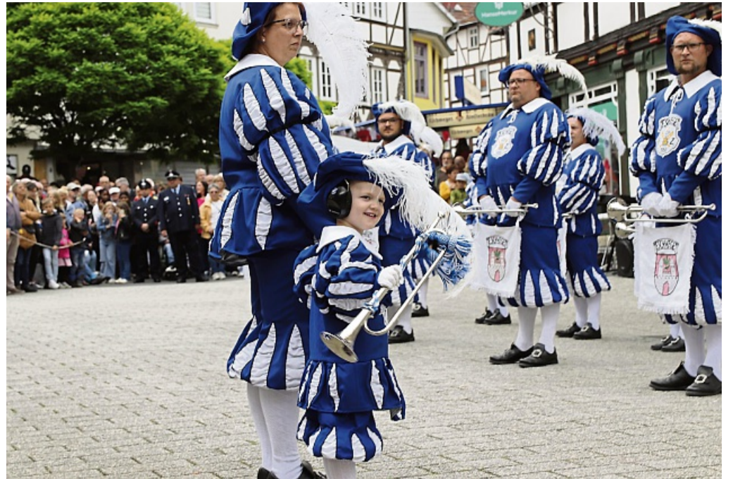
Von der Pike auf wird hier Musik gemacht: beim Fanfarenzug Eschwege.

Der Nachwuchs des Spielmannszugs Werratal sorgte mit Hits wie „Cordula Grün“