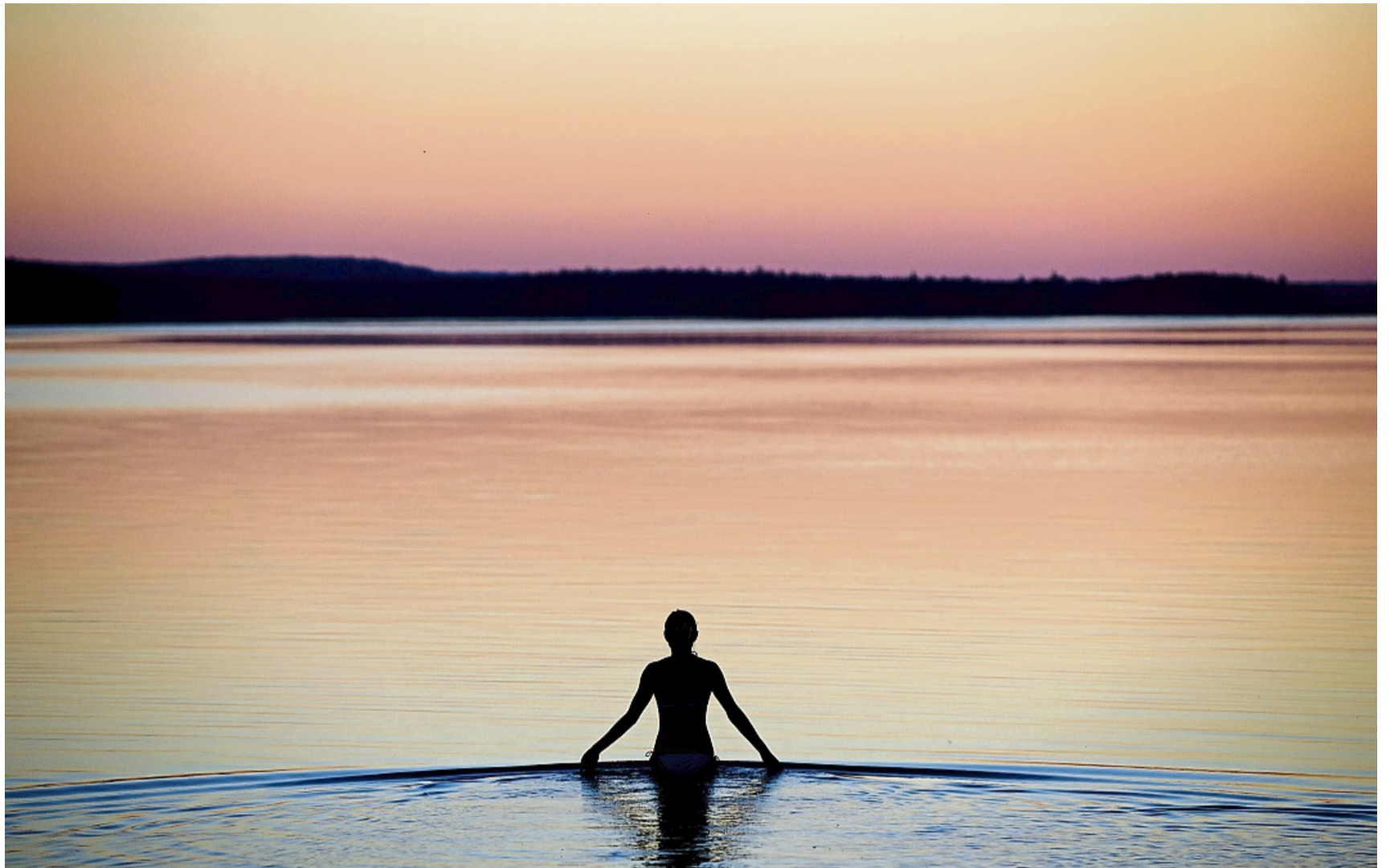
Es kann beruhigen oder die Gedanken in Bewegung bringen: Studien belegen die unterschiedlichen Wirkungen von Wasser auf Seele und Geist.