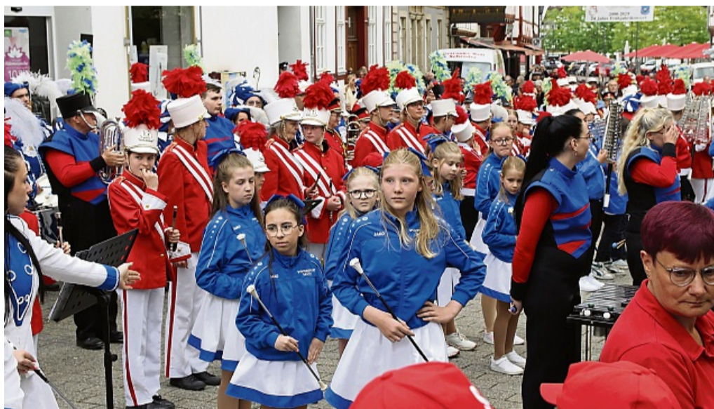
Präsentieren ihren Zusammenhalt: die Eschweger Musikzüge beim diesjährigen Frühjahrskonzert auf dem Eschweger Obermarkt am Samstagvormittag.

oder „Bella Napoli“ für Festzelt-Atmosphäre: „Die Rotjacks sind längst kein Ausbildungszug mehr, sondern ein talentierter Spielmannszug“, fasst Moderator Simon Bartels treffend zusammen. Die „Großen“ des Spielmannszugs eröffneten dramatisch und mit viel Humor, als der Einmarsch stoppte, um auf ihren Vorsitzenden zu warten, der am anderen Ende des Platzes die Zeit am Getränkewagen aus den Augen verlor. Ausgefeilte, neue Tanzinlagen und Formationen unterstrichen die Leiden-