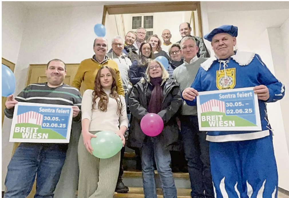
Die letzten Vorbereitungen für die BREITWIESN wurden besprochen – Arbeitskreis organisiert Heimat- und Volksfest.

Am Samstag, 31. Mai, findet der bunte Familiennachmittag im Festzelt und auf dem Festplatz statt. Zuvor werden um 13.30 Uhr Luftballons für den Luftballon-Wettbewerb am Marktplatz ausgegeben und nach einem gemeinsamen Zug durch die Sontraer Straßen am EDEKA-Markt steigen gelassen.