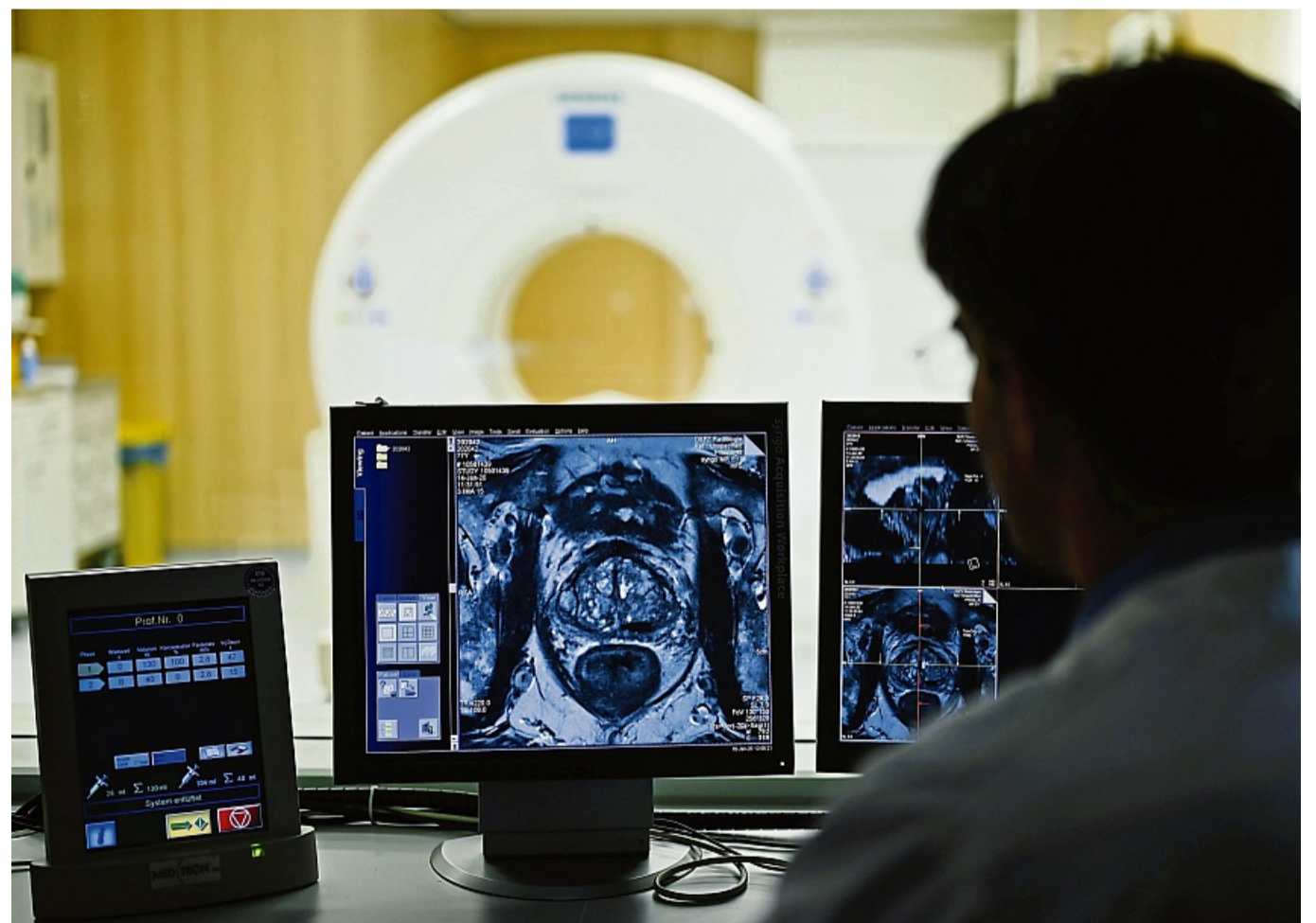
Nach dem Anfangsverdacht: Im Verlauf einer Diagnostik kommen auch bildgebende Verfahren zum Einsatz.

Fachleute und -organisationen weisen aber darauf hin, dass es auch Nachteile gebe, etwa Überdiagnosen und Überbehandlung – auch deshalb wird