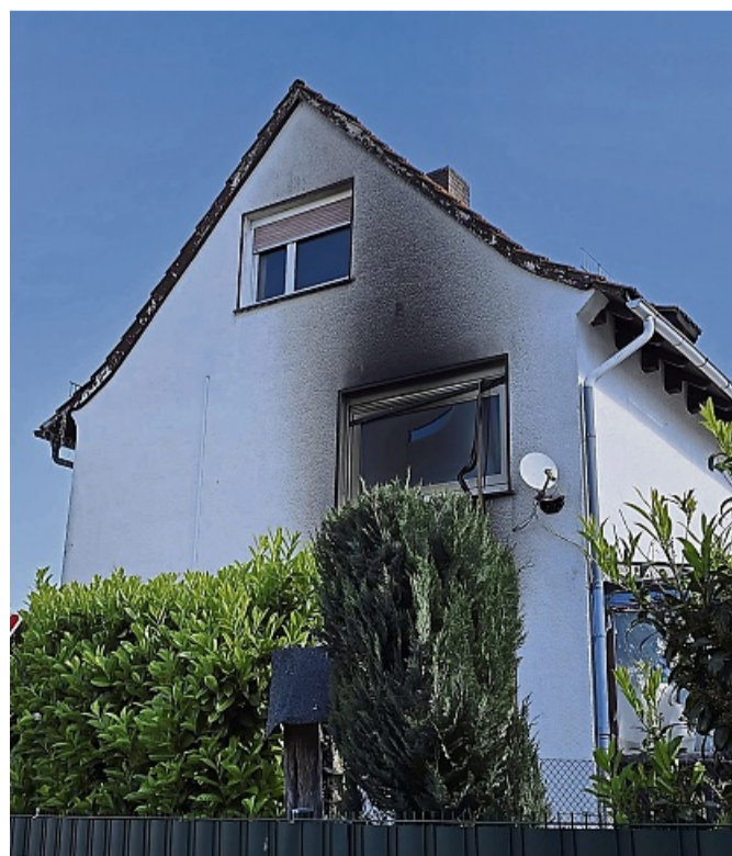
Ausgebrannt: das Wohnhaus einer fünfköpfigen Familie in Neuerode. Ursache des Feuers war laut Polizei Brandstiftung.

Das Wohnhaus der Familie war in der Nacht von Sonntag auf Montag bei einem Feuer völlig ausgebrannt und ist nicht mehr bewohnbar. Die Mutter hatte gegen 22 Uhr das Gebäude mit ihren drei Kindern verlassen, nachdem es zwischen ihr und ihrem Mann zu einer Auseinandersetzung gekommen war. Der Mann hatte daraufhin laut der Polizei Feuer in dem Haus gelegt und war geflohen. Er wurde später in der Nacht bei Niederhone gefasst und wegen seines Zustandes zunächst in die Psychiatrie nach Eschwege gebracht. Den entstandenen Sachschaden an dem Gebäude bezifferte die Polizei mit 100.000 bis 150.000 Euro. salz