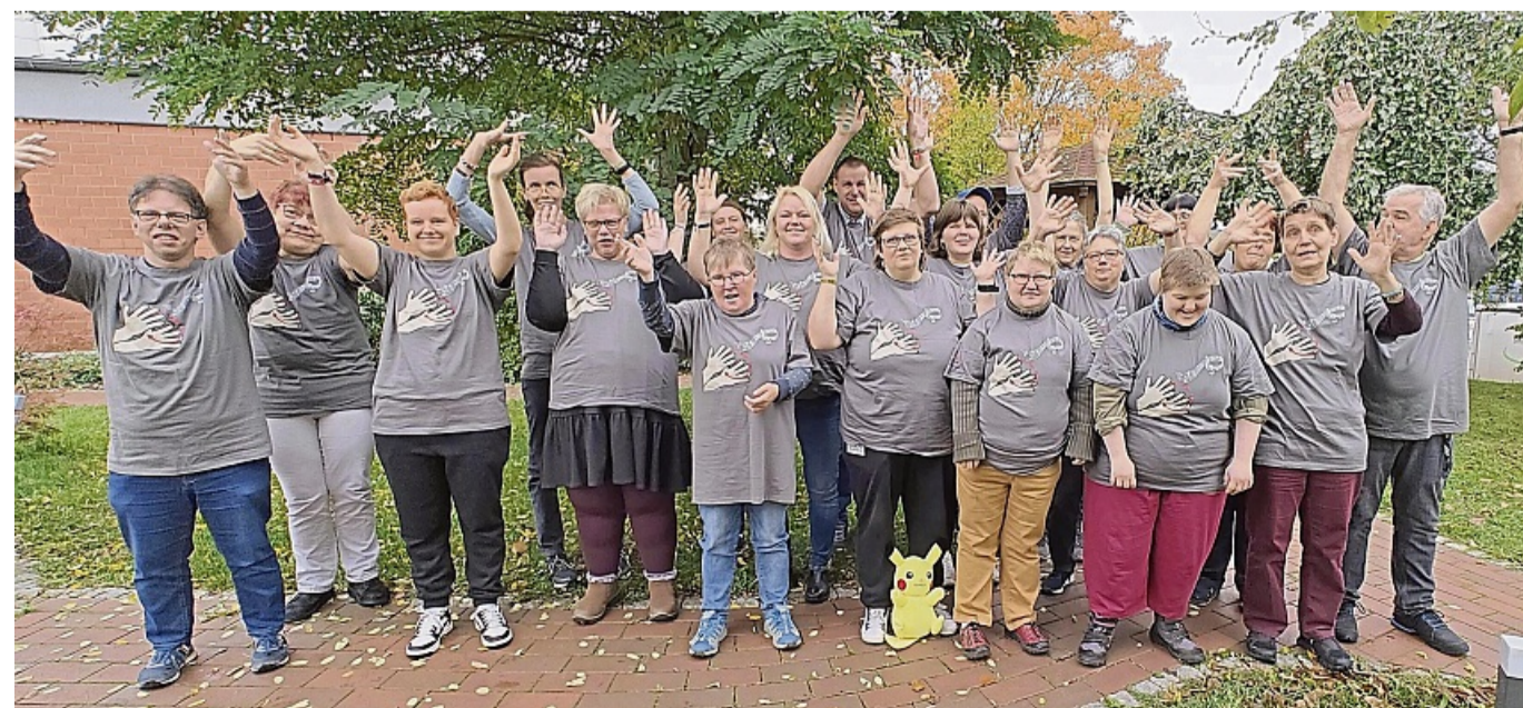
Freut sich, beim Weltrekordversuch in Eisenach dabei zu sein: der Gebärdenchor der Werraland Lebenswelten. Zu Nenas Song „Wunder geschehen“ wird ein starkes gemeinsames Zeichen gesetzt.

Den Auftakt macht ab 18 Uhr der Gospelchor „Salvation choir“ (Mihla), um 19 Uhr ist Sascha Krause an der Reihe. Der Eintritt ist frei. esp