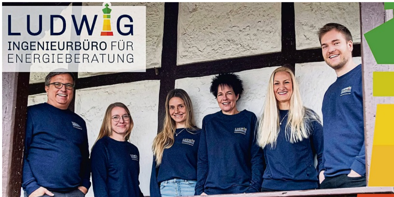
Unterstützung aus der Region: Das freundliche, kompetente Team von Ludwig begleitet Sie auf dem Weg zur Energieeffizienz.

Warum sich energetisches Sanieren jetzt besonders lohnt