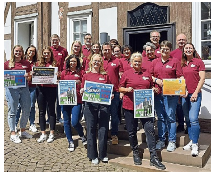
Mitarbeiterinnen und Mitarbeiter der Stadtverwaltung Sontra freuen sich darauf mit einheitlichen Shirts auf die BREITWIESN gehen zu können.

Shirts im Festzelt einen Platz finden und so als Team der Stadt Sontra erkannt wird“, so Bürgermeister Thomas Eckhardt, der auch alle anderen Sontraer Firmen, Vereine, Organisationen und Bürgerinnen und Bürger zur Teilnahme am Bürgerfrühstück am Montag, 2. Juni, mit Fassbieranstich bei musikalischer Unterhaltung durch die Starlight-Showband herzlich einlädt.