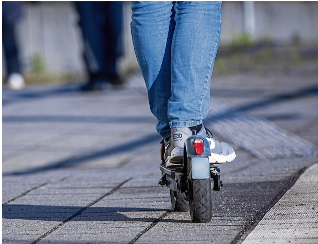
Auf Ausstattung achten: Zwei Bremsen, Licht, Reflektoren und eine Klingel sind gesetzlich vorgeschrieben – mehr Komfort bieten Luftreifen oder Federung.

Ohne Straßenzulassung gemäß der Elektrokleinstfahrzeuge-Verordnung (eKFV) darf ein Scooter nicht auf öffentlichen Straßen und Radwegen fahren. Der ACE rät daher, beim Kauf darauf zu achten, dass es sich um ein typengenehmtes Fahrzeug handelt: ein Typenschild, das die Bezeichnung Elektrokleinstfahrzeug, die bauartbedingte Höchstgeschwindigkeit (in der Regel 20 km/h) sowie die Nummer der Allgemeinen Betriebserlaubnis (ABE) ausweist, muss vorhanden sein. Solche Modelle werden oft beworben als „mit Straßenzulassung gemäß StVZO“. Damit ist sichergestellt, dass der Roller eine – ebenfalls verpflichtende – Versicherungsplakette bekommt – ohne die geht es nämlich auch