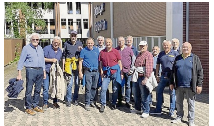
Die Alters- und Ehrenabteilung der Feuerwehr Hornel hatte zu einer Brauereibesichtigung nach Eschwege eingeladen.

Nach Erreichen von Sontra haben noch einige die Gelegenheit genutzt beim Maibaumfest auf dem Marktplatz vorbeizuschauen.