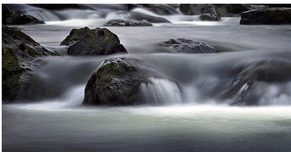
Panta rhei – alles fließt. Wasser bedeutet auch Wandel und Energie.