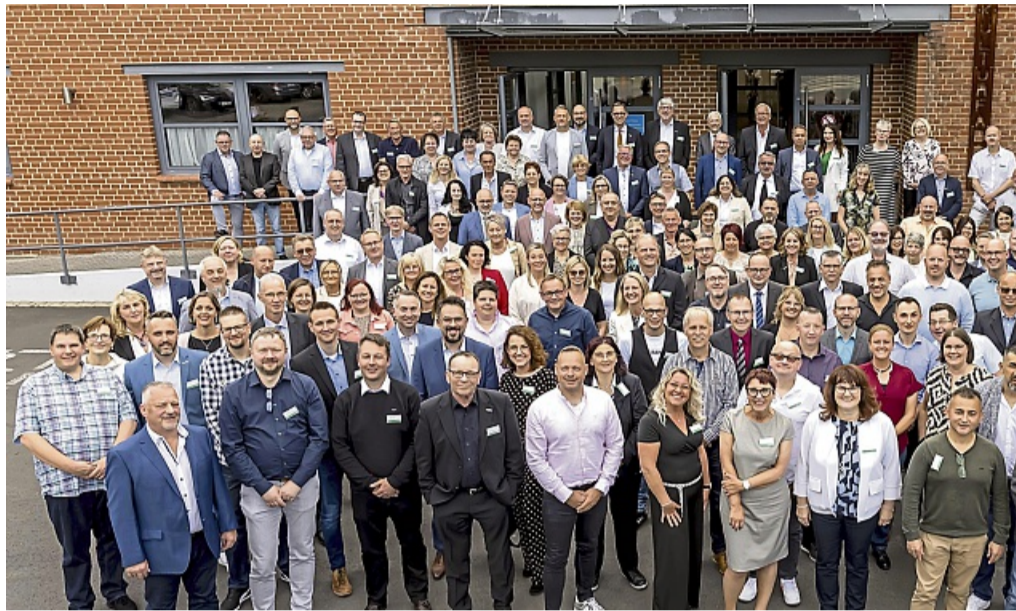
Sind seit Jahrzehnten dem Unternehmen treu: B. Braun dankte 156 Mitarbeitern bei der Jubilarfeier in der Melsunger Kulturfabrik.