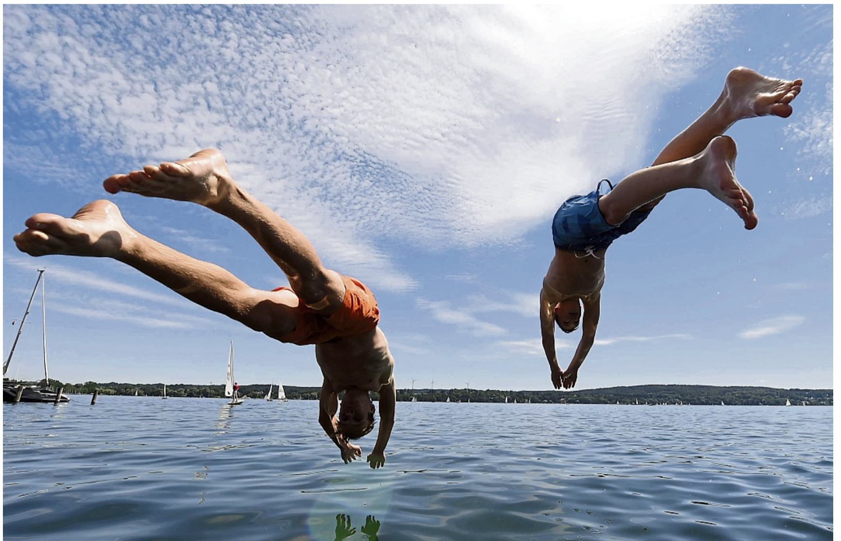
Einen Kopfsprung ins Wasser sollte man nur wagen, wenn es erlaubt und das Wasser sicher tief genug ist.

Übrigens: Gerade zu Beginn der Badesaison müssen Schwimmer damit rechnen, dass tiefere Wasserschichten eines See deutlich kälter sein können als am Ufer. Und in kühleren Sommern kann die Wassertemperatur von Nord- und Ostsee laut Paatz durchaus bei 16 bis 19 Grad bleiben.