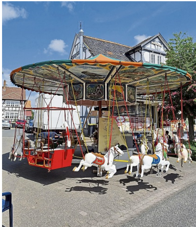
Das nostalgische Kinderkarussell gehört zu den beliebten Klassikern des Himmelfahrtsmarktes Frielendorf.