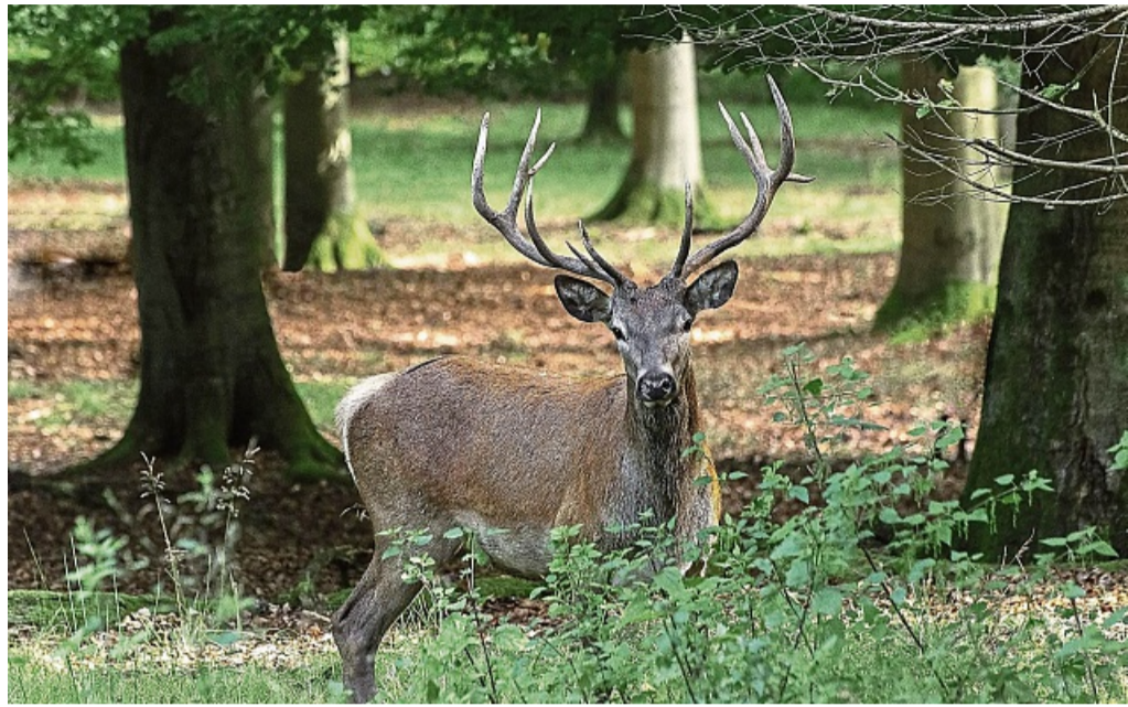
Das Wild richtet oft großen Verbissschaden an: Eine Befliegung von Hessen Forst hat ergeben, dass die Zahl der Hirsche im Kellerwald hoch ist.

Häuslings Vorwurf: Früher habe der Pächter die Tiere gar angefüttert, um sie vom Hochsitz aus vor die Flinte zu bekommen, heute hänge er Salzlecke auf, die sie anzöge.