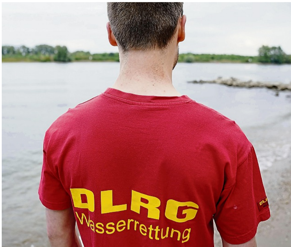
Zahlen der Deutschen Lebens-Rettungs-Gesellschaft (DLRG) zeigen: Mindestens 411 Menschen sind im Jahr 2024 in Deutschland ertrunken.