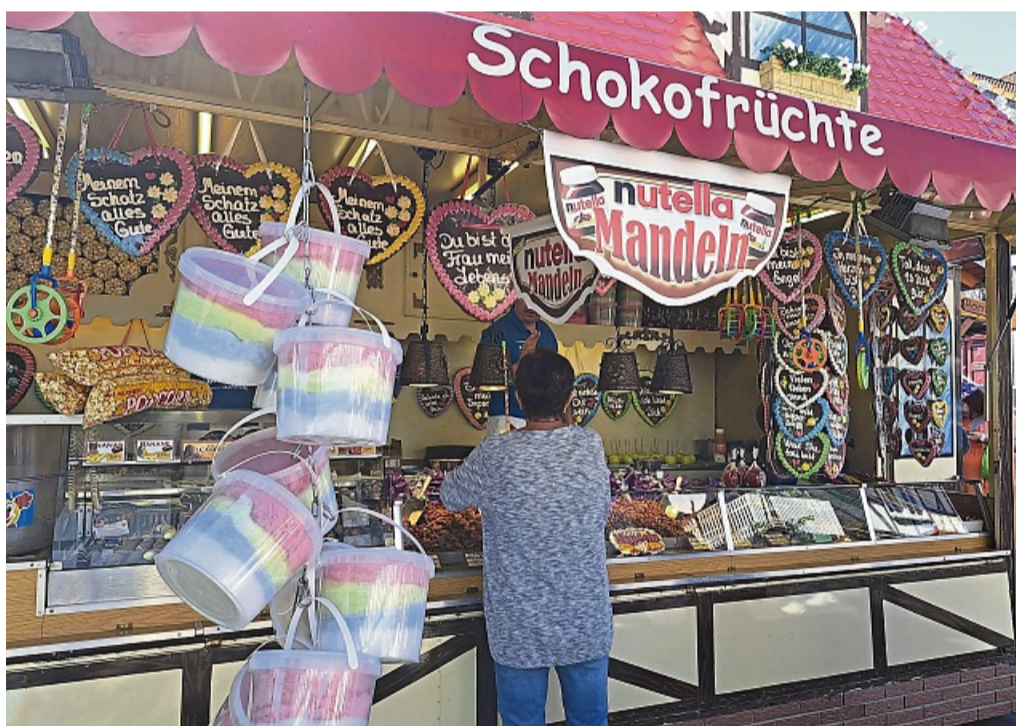
Angebote für die ganze Familie: Der Himmelfahrtsmarkt in Frielendorf hat viel zu bieten.

Um die 100 Stände werden ihre Vielfalt am 28. und 29. Mai in