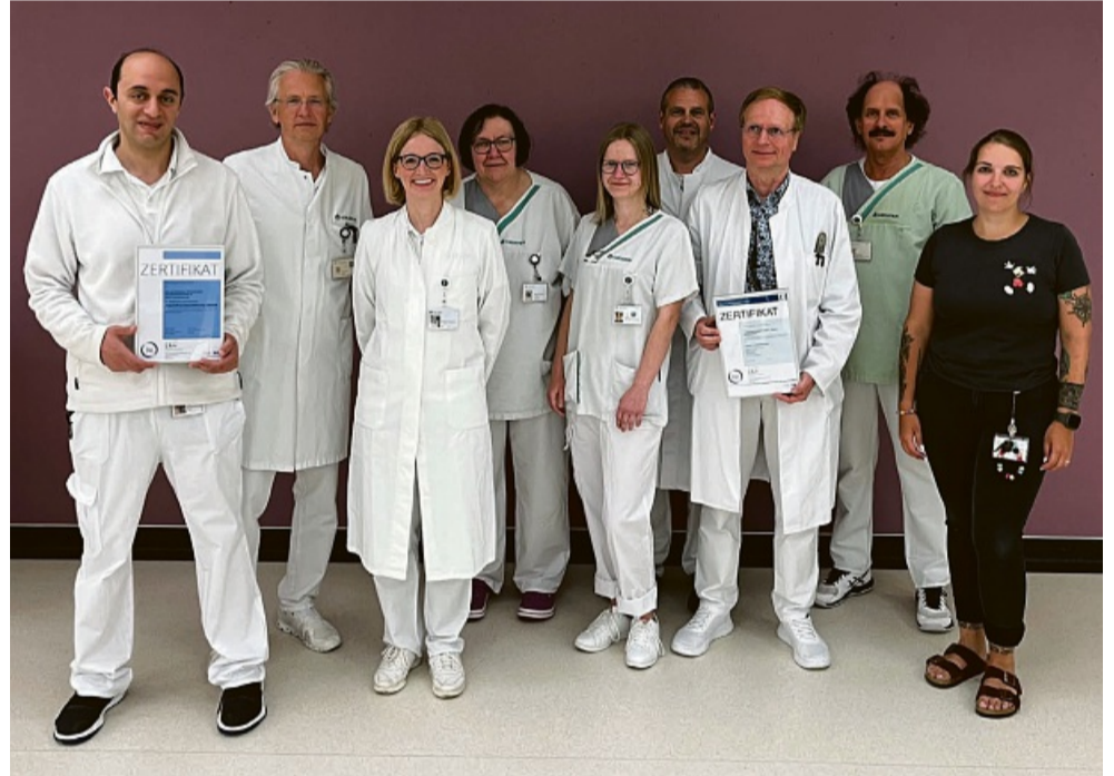
Erfolgreich zertifiziert: Das interdisziplinäre Team freut sich über die Auszeichnungen als AltersTraumaZentrum und TraumaZentrum – ein starkes Zeichen für Qualität und Zusammenarbeit in der Versorgung von Trauma-Patienten.

Mit der Erstzertifizierung des AltersTraumaZentrums erfüllt die Klinik nun offiziell die hohen Anforderungen der Deutschen Gesellschaft für Unfallchirurgie (DGU) zur spezialisierten Behandlung älterer, mehrfachverletzter Patienten. Die interdisziplinäre Zusammenarbeit von Unfallchirurgie, Geriatrie, Pflege und weiteren Fachbereichen gewährleistet eine optimale, auf das Alter abgestimmte Versorgung. Denn je älter ein Mensch wird, umso wahrscheinlicher ist es, dass dieser schlimmstenfalls sogar mehrmals einen Knochenbruch erleidet – häufigste Ursache sind Stürze. Ältere Menschen verletzen sich bei gewöhnlichen, alltäglichen Stürzen oftmals schwer, weil ihre Knochensubstanz in vielen Fällen brüchiger ist und die Muskelmasse abnimmt. Im Ziegenhainer Krankenhaus ist man sehr erfahren darin, ältere und hochbetagte Menschen mit Knochenbrüchen allumfassend zu versorgen – dazu gehört nicht nur die rein medizinische Versorgung der Betroffenen, sondern auch der Blick auf das soziale Umfeld. Ein Team von Fachärzten, Pflegepersonal, Therapeuten und erfahrenen Mitarbeitenden aus dem Sozialdienst kümmern sich individuell um jeden Patienten. Vor der erfolgreichen Zertifizierung hatten eine System-Auditorin und ein Fachexperte eines unabhängigen und akkreditierten Zertifizierungsunternehmens alle Komponenten auf Herz und Nieren geprüft. Dabei konnten die hohen Standards im Asklepios ATZ Schwalmstadt bestätigt werden, zugleich stellten sie fest, dass alle Mitarbeitenden in diesem