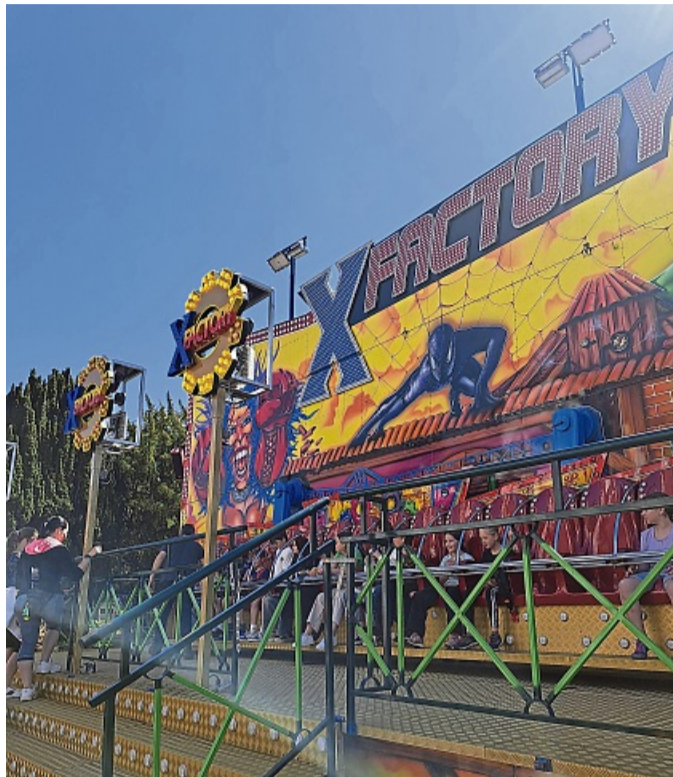
Das Karussell XFactory sorgt für aufregenden Spaß und ist in jedem Jahr ein absoluter Besuchermagnet.

Frielendorf feiert 329. Himmelfahrtsmarkt mit vielfältigem Angebot