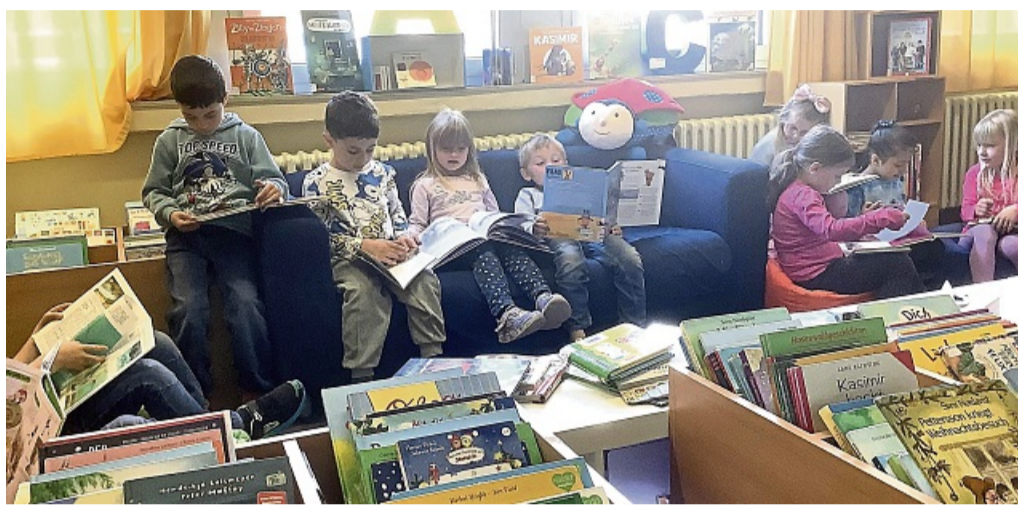
Ganz vertieft in die Bücher: Kindergartenkinder besuchten Sontraer Stadt- und Schulbibliothek

Solche Besuche sind eine wunderbare Möglichkeit, die Neugier der Kinder zu wecken und ihre Liebe zu Büchern zu fördern. Die Bibliothek bietet