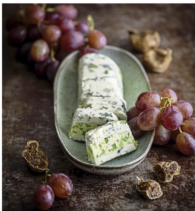
Beim Aufschneiden der Roquefort-Terrine kommen deren Schichten besonders gut zur Geltung.