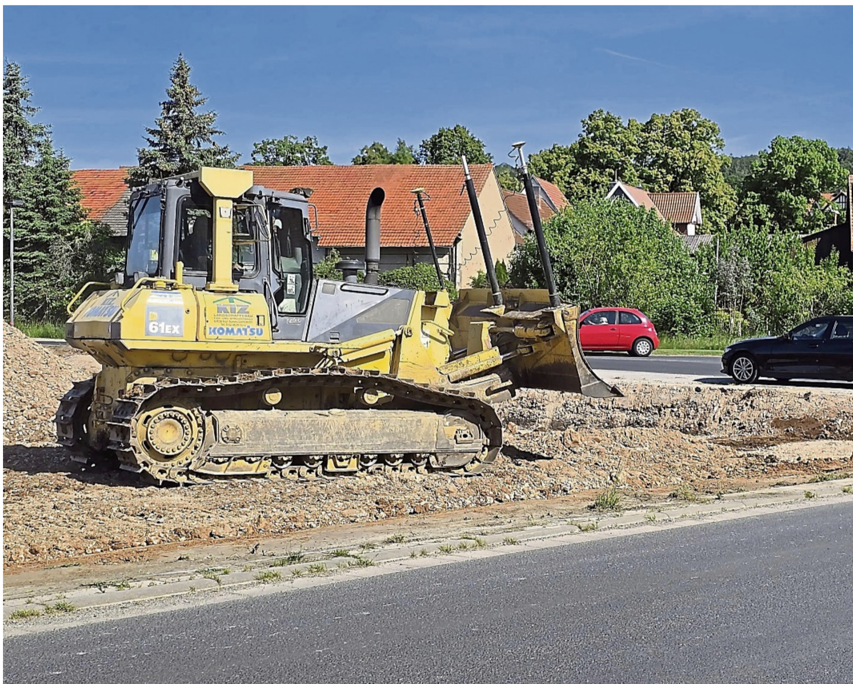
Jetzt kommt Bewegung rein: Das Generalunternehmen KIZ GmbH hat an der Grebendorfer Schindersgasse mit dem Bau eines neuen Netto-Marktes begonnen.