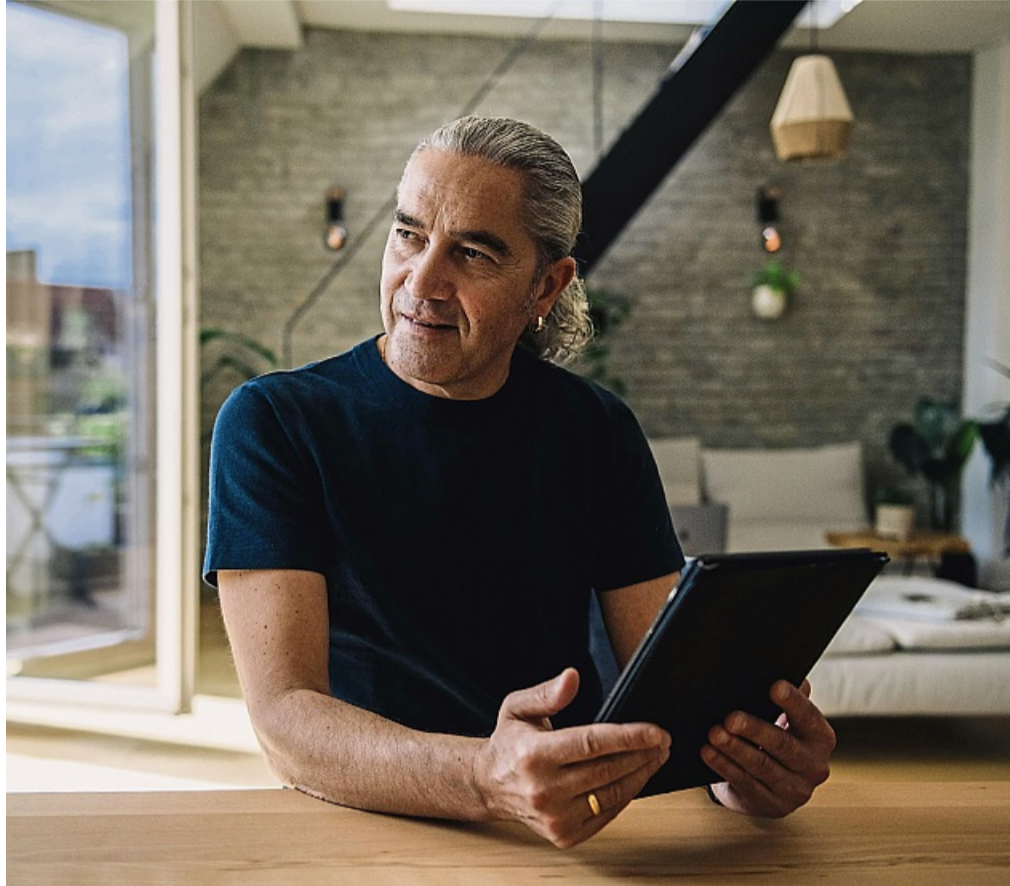
Schneller als zuvor: Ab dem 6. Juni 2025 sollen Kundinnen und Kunden ihren Stromanbieter werktags innerhalb von 24 Stunden wechseln können.

Mit der Gesetzesänderung setzt die Bundesregierung eine EU-Richtlinie um, die den zügi-