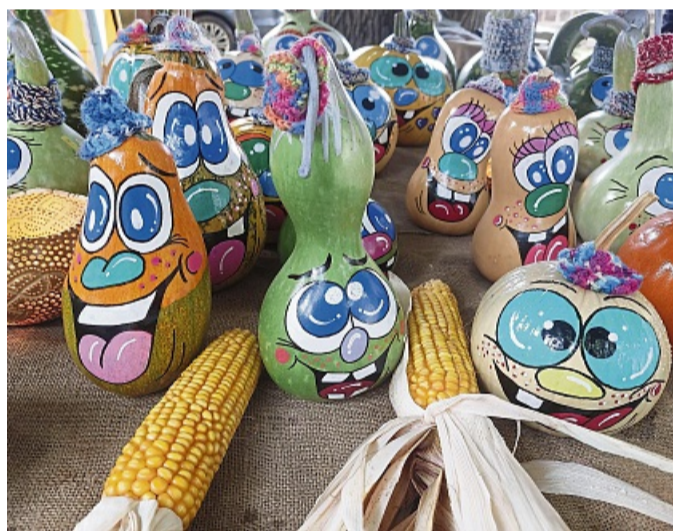
Feierabendmarkt in Wichmannshausen: Bunt bemalte Kürbisse lockten im Herbst.