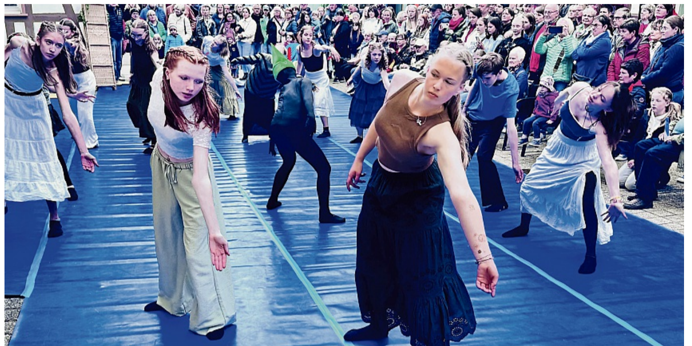
Kraftvoll, ausdrucksstark, mitten in der Stadt: Das Tanztheater Laborinth begeisterte vor dem Eschweger Rathaus mit einer eindrucksvollen Performance.

Ob beim Tanztheater vor dem Eschweger Rathaus, bei Musikacts auf improvisierten Bühnen oder bei Wortbeiträgen im Schaufenster – die Vielfalt war spürbar. Vor allem junge Musiker aus der Region nutzten die Gelegenheit, sich zu zeigen – und machten zugleich deutlich: Diese Stadt hat Stimmen, Klänge, Ideen.