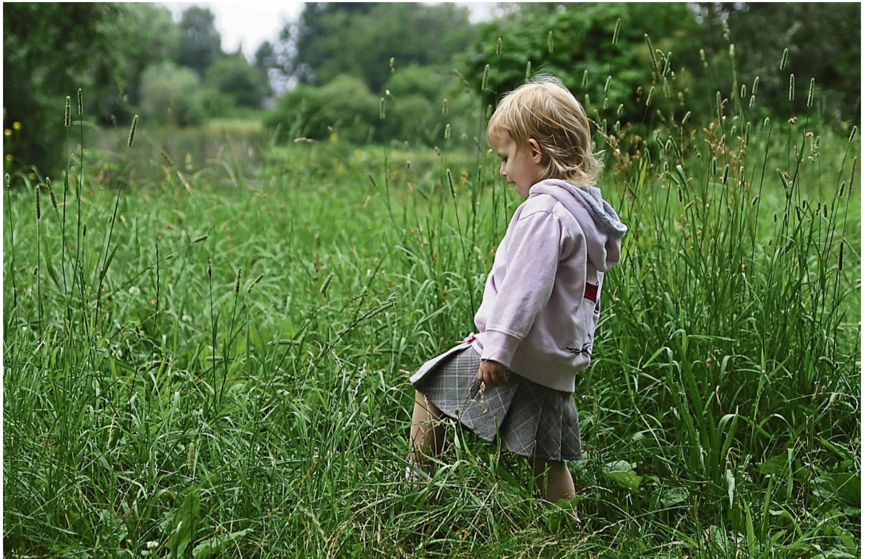
Lange Ärmel und lange Hosenbeine machen es Zecken schwerer.

Zecken tummeln sich im Gebüsch, in Gräsern oder im Un-