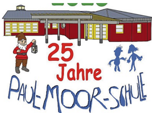
Feiert in diesem Jahr 25-jähriges Bestehen: die Paul-Moor-Schule.