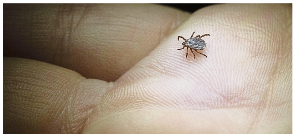
Zecken suchen am Körper nach geschützten Stellen, um zuzustechen. So fühlen sie sich unter den Achseln oder hinter dem Ohr wohl.