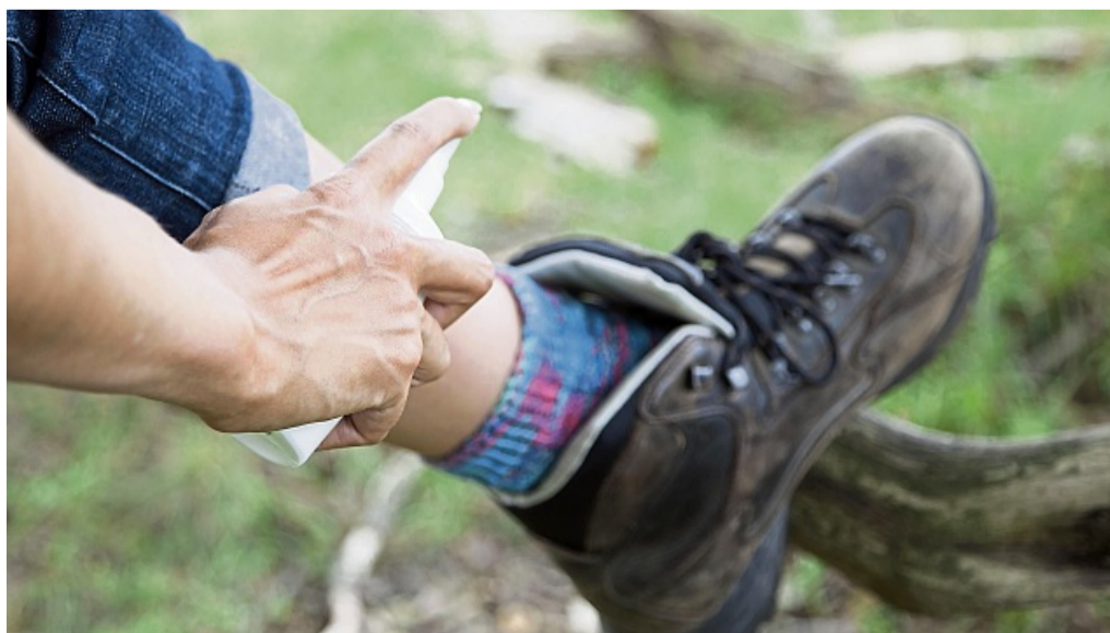
Zeckenschutzmittel verderben den kleinen Tierchen gehörig den Appetit.