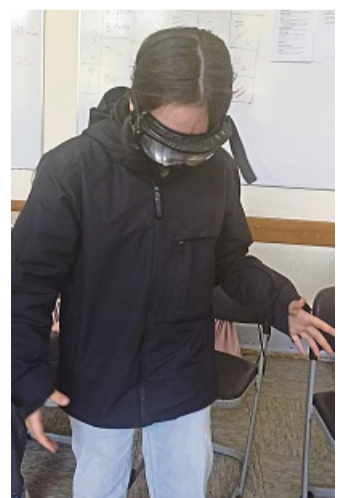
Workshop: Mit einer „Rauschbrille“ wird ein alkoholisierten Zustand simuliert. Dabei wird gezeigt, wie sich die Wahrnehmung und die Sicht nach dem Konsum verändern können.