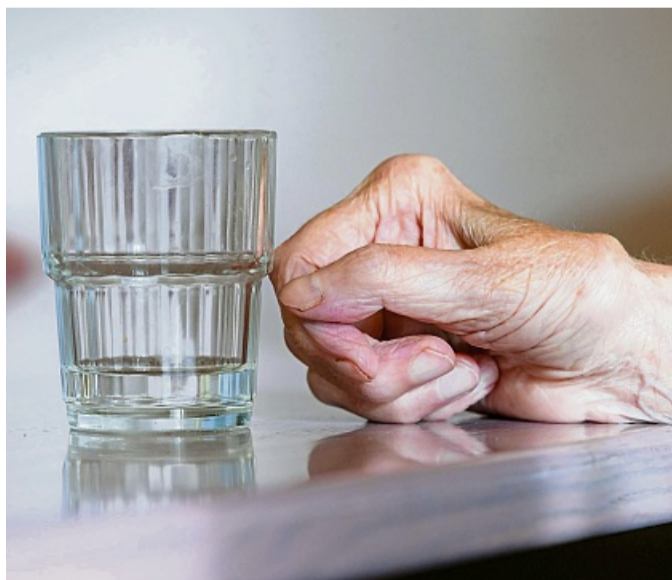
Dass bei vielen alten Menschen der Durst nachlässt, kann an heißen Tagen gefährlich werden.