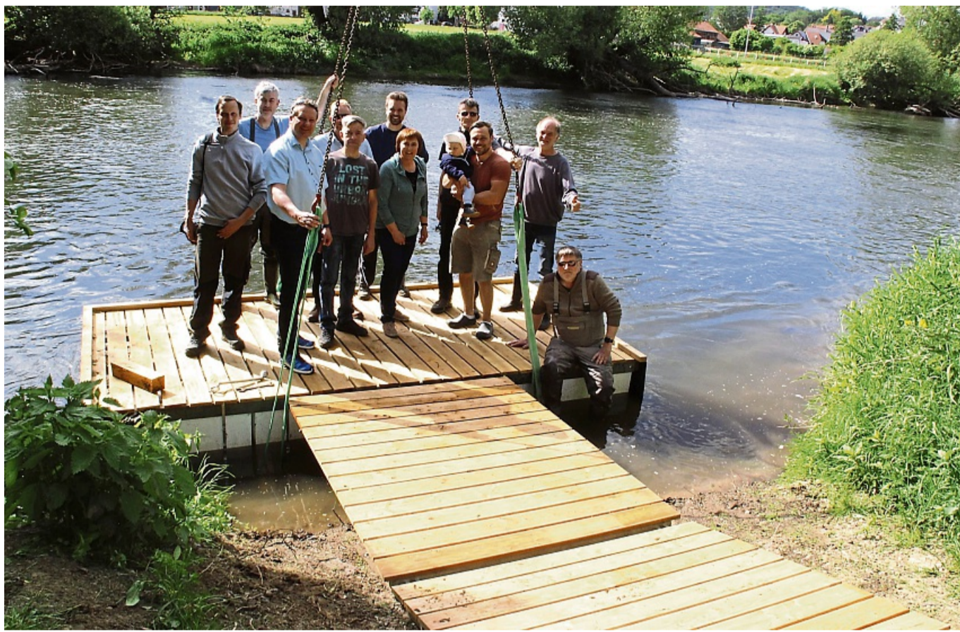
Geschafft: Gruppenbild der Beteiligten nach der Verankerung der Bootsanlegestelle an der Eder in Altenbrunslar. Der Steg wurde Dank der Initiative des Ortsbeirates saniert. Die Stadt Felsberg übernahm die Materialkosten.

Im Sommer vorigen Jahres war der Steg dann nach den Worten der Ortsvorsteherin so morsch geworden, dass die Ge-