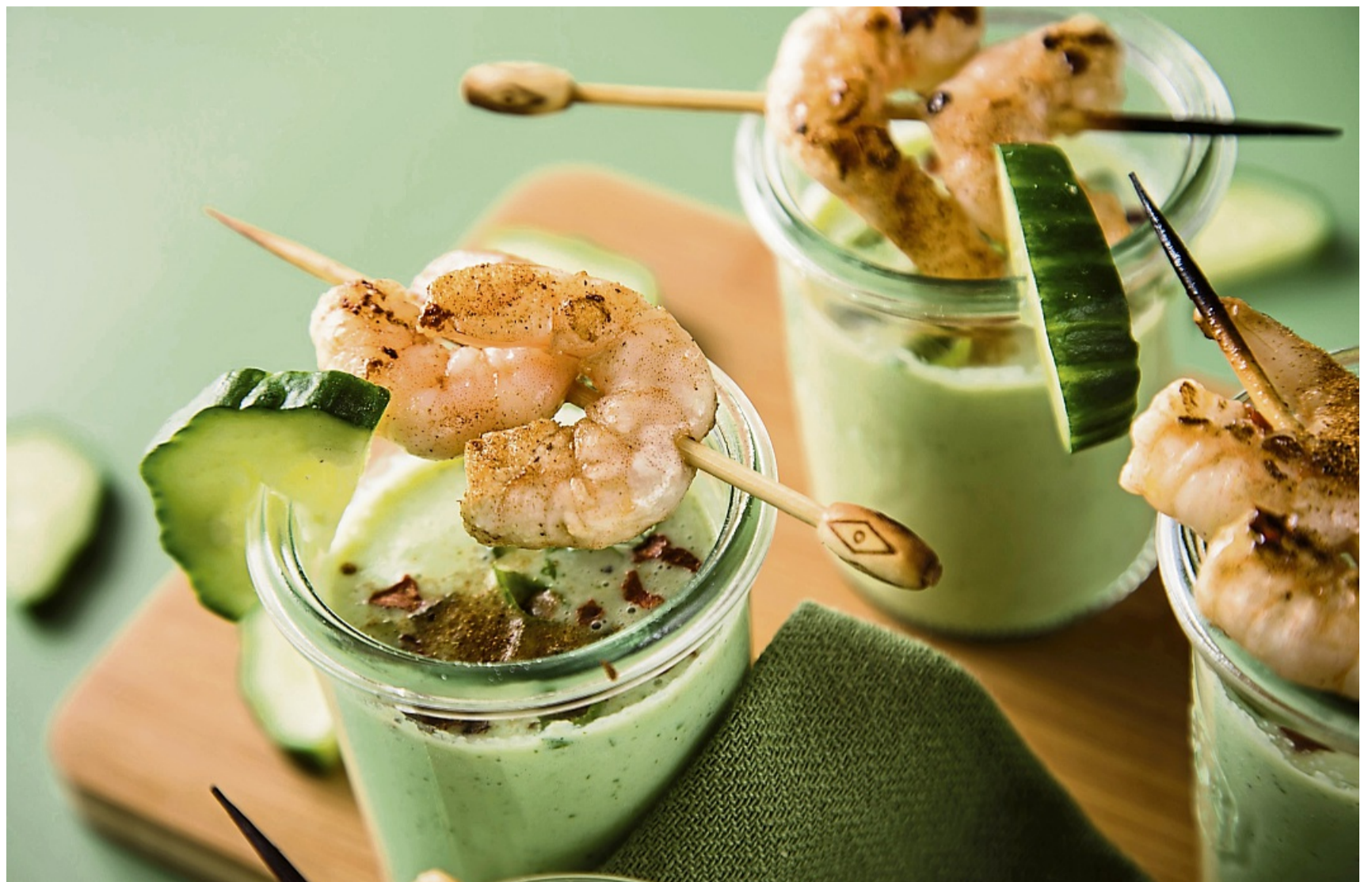
Eine kalte Suppe erfrischt an warmen Tagen – wie diese aus Gurken, Buttermilch und Basilikum, getoppt mit Garnelenspießen, Chiliflocken und Cayennepfeffer.

Generell eignen sich kalte Speisen gut zum Mitbringen