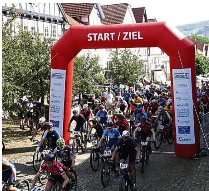
Massenstart auf dem Marktplatz: Es stehen wieder verschiedene Strecken für die Teilnehmer zur Verfügung.

Der Start/Ziel-Bereich findet aufgrund von Straßenbauarbeiten auch in diesem Jahr wieder auf dem Marktplatz in Neumorschen statt. Die Starter ge-