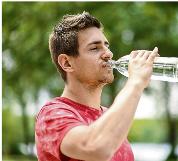
Um der Hitze entgegenzuwirken, braucht der Körper Flüssigkeit.