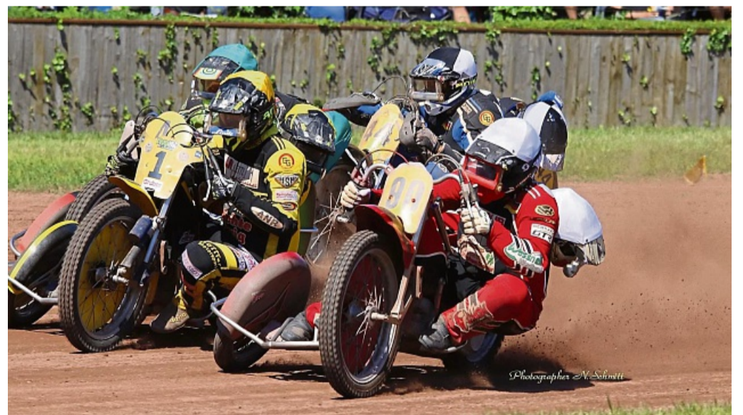
63. Internationale Grasbahnrennen in Melsungen

„Auch dieses Jahr können sich Motorsport Fans auf spannende Rennläufe in sechs