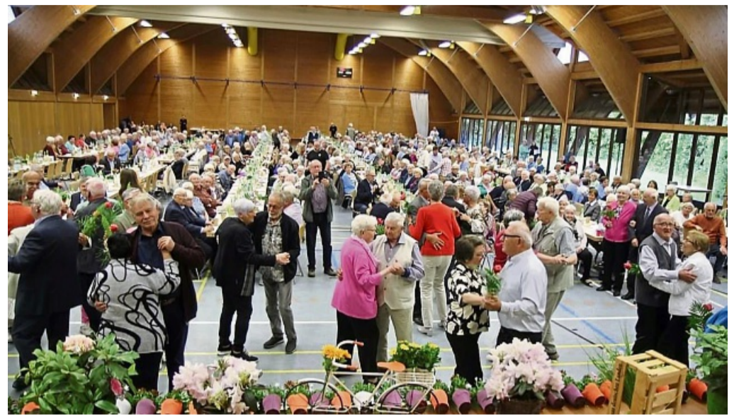
Tanz der Hochzeitspaare: Jede der Damen erhielt vorher eine Rose.

Diesjährige Partnerstadt des Kreissenientags war die Stadt Spangenberg. Bürgermeister Andreas Rehm sagte bei seiner Ansprache, dass diese jährlichen Treffen ein Teil dieser Kontakte sind. Er rief dazu auf, die ältere Generation zu achten. Dies sei ein Stück Wertschätzung, denn ohne die Erfahrungen der Seniorinnen und Senioren und ihre Tätigkeiten wären viele Dinge, die