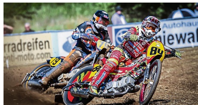
Beim diesjährigen Grasbahnrennen gibt es nur noch einen Renntag. Damit reagiert der MSC auf die wetterbedingten Absagen der vergangenen Jahre.