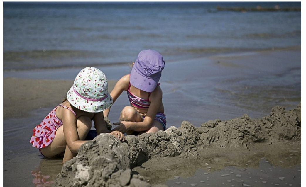
Eine Kopfbedeckung schützt nicht nur Kinder vor Sonne und Hitze.

Lebensbedrohlich wird Hitze dann, wenn die Körpertempe-