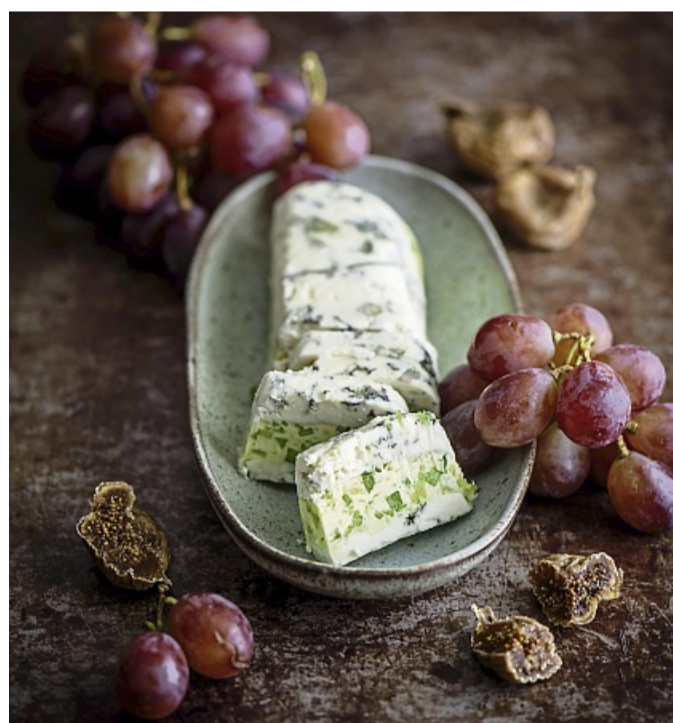
Beim Aufschneiden der Roquefort-Terrine kommen deren Schichten besonders gut zur Geltung.