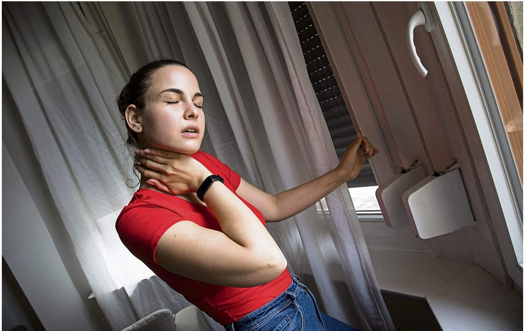
Große Hitze kann dem Körper zu schaffen machen.

Viele dieser Beschwerden hängen mit dem Flüssigkeitsverlust zusammen, der beim Schwitzen entsteht. „Wenn ich nicht ausreichend trinke, bedeutet das im Umkehrschluss, dass mein Blut immer konzen-