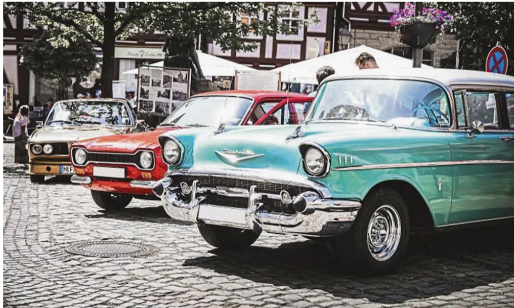
Die Liebenbach Classics locken am Pfingstwochenende nicht nur Oldtimer-Fans in die Spangenberg Altstadt.

Spangenberg lädt ein – und wie! Wenn sich am Pfingstwochenende die Straßen der malerischen Altstadt mit dem Glanz vergangener Jahrzehnte füllen, ist es wieder Zeit für die Liebenbach Classics. Bereits zum dritten Mal verwandelt sich das hessische Fachwerkstädtchen in ein Paradies für Oldtimerfreunde, Nostalgiker und Musikliebhaber, das mit viel Liebe zum Detail und authentischem Flair das Lebensgefühl der Wirtschaftswunderzeit zum Leben erweckt. Ob Kleinwagen, Straßenkreuzer, Roller, Moped oder Motorräder – beim markenoffenen Oldtimertreffen am 7. und 8. Juni sind alle willkommen, die klassische Fahrzeuge lieben und ihre Leidenschaft mit Gleichgesinnten teilen möchten. Hier glänzen nicht nur Chrom und Lack, sondern auch die Augen der Besucher, wenn seltene Modelle, restaurierte Schönheiten und originale Alltagsfahrzeuge