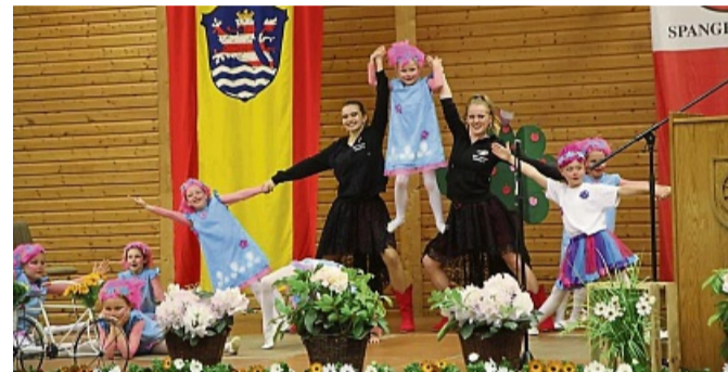
Auftritt der Minis vom Katholischen Karnevalverein Homberg