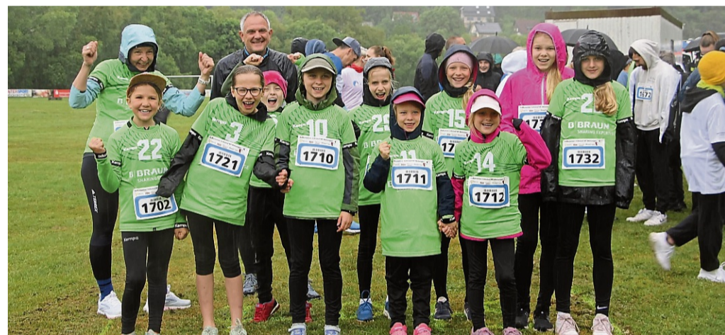
Laufen statt werfen: Von der SG 09 Kirchhof waren einige Handballerinnen am Start.