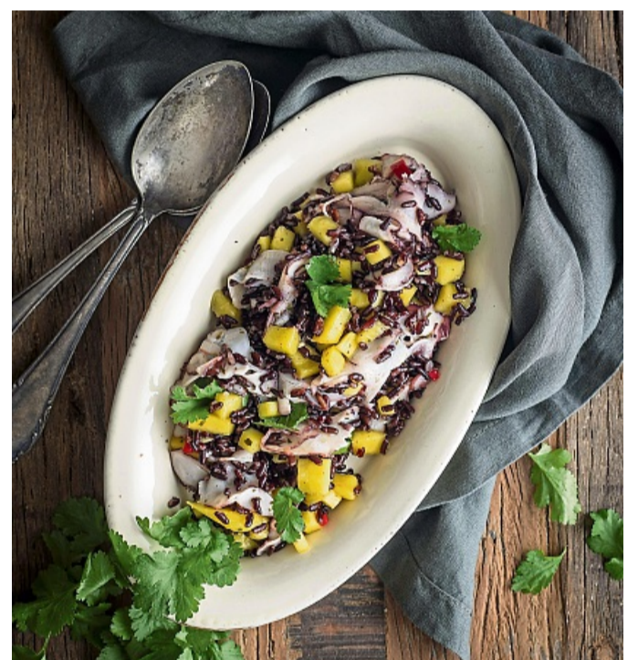
Wenn es mal etwas ganz Exotisches sein soll: Dieser schwarze Reissalat mit Mango und Oktopus sticht auf einer Mitbringfeier sicher heraus.

um saisonales Obst und Gemüse zu verarbeiten – etwa Birnen oder Aprikosen. Auch Marmelade, Gelee und Saft stellt Nagele selbst her. Im April pflückt sie frische saftig grüne Fichtentriebe und trocknet diese im Backofen – als herrliches Aroma für Fichtensalz oder -zucker. „Das riecht wirklich ganz toll nach Nadelwald.“