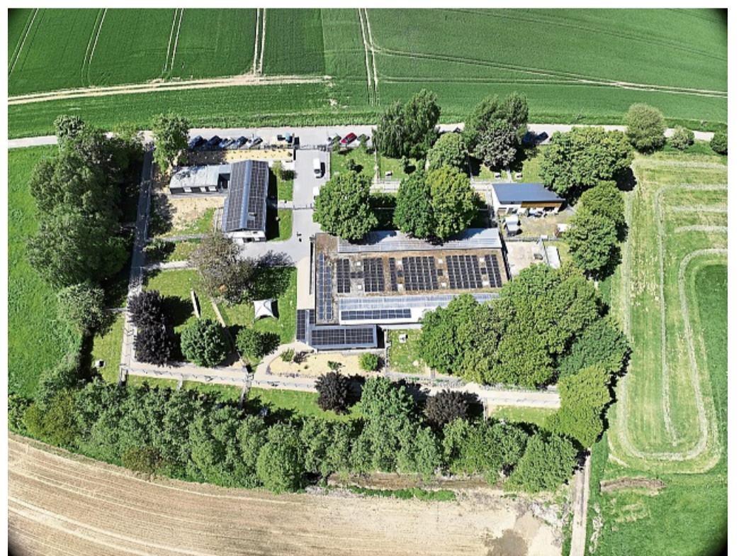
Nachhaltig: Seit 2020 hat das Tierheim den Ausbau der PV-Anlagen vorangetrieben.

Weitere Informationen: auf der Internetseite tierheim-beuern.com