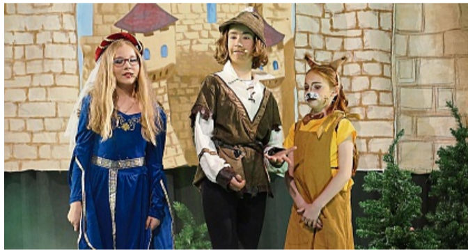
Die Protagonisten des Kinder-Musicals: Maid Marian, Robin und Little John.