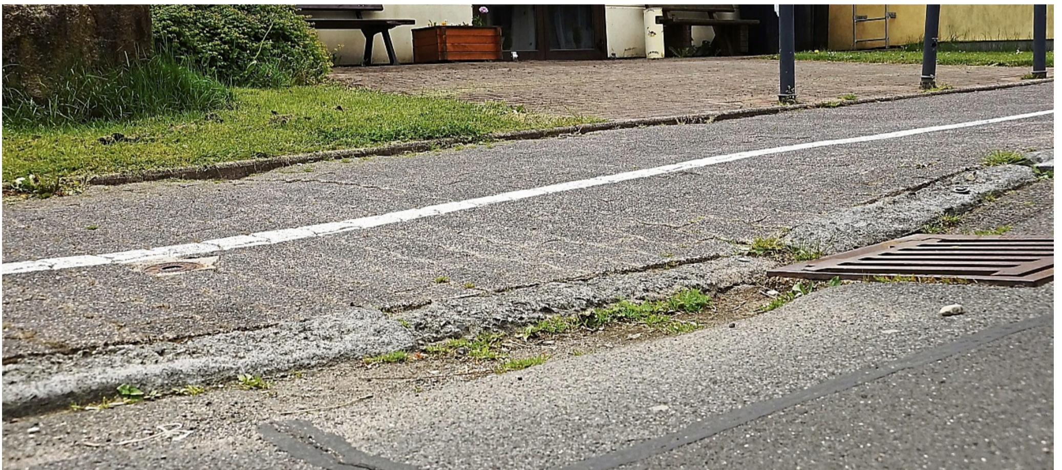
Im Bereich des Wassereinlaufs vor der Mehrzweckhalle hat sich der Boden deutlich gesenkt; und von den Bordsteinen ist nicht mehr viel übrig geblieben.

Ortsbeirat Hopfelde lädt ein zum Bau eines Insektenhotels