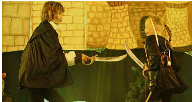
Robin und der Sheriff von Nottingham bestreiten ein Duell.