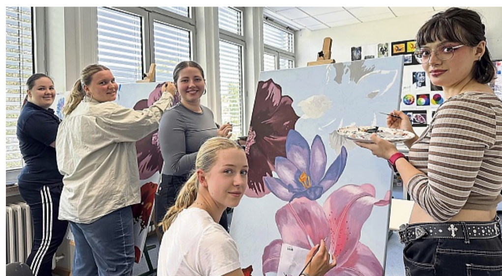
Zwischen Papier, Farbe und Vorfreude: Die Blüten, die bald öffentlich erblühen, wachsen auf Leinwänden im Klassenraum.

Während der Arbeitsphase sorgt eine temporäre Verkehrsberuhigung für Sicherheit. Ver-