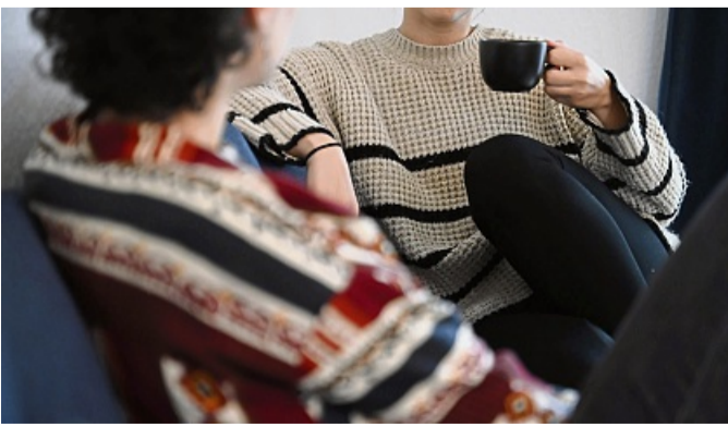
Einfach da sein: Trauernde brauchen keine perfekten Worte – oft genügt ein stilles, mitfühlendes Dasein.

Trauer ist ein schmerzhafter, oft einsamer Prozess – doch muss er das sein? „Wir brauchen liebe Menschen, um gut unterstützt und mit viel Rücksicht aufgenommen zu werden, um diesen langen Weg der Trauer gehen zu können“, sagt die Trauerbegleiterin Chris Paul im Gespräch mit dem Gesundheitsmagazin „Apotheken Umschau“. ist, „Dann reicht es oft, nur ein bisschen da zu sein, zu reden. Das heißt Normalität.“ Bindung statt Loslassen Ein weit verbreitetes Missverständnis: dass Trauern bedeute, loszulassen. „Im Gegenteil“, sagt Chris Paul. Studien zeigten, dass es vielen Menschen helfe, mit den Verstorbenen in Verbindung zu bleiben – sei es durch Erinnerungen, Rituale oder Zeichen. Auch alltägliche Gesten wie das Tragen eines Erinnerungsstücks oder das Gespräch am Grab seien heilsam. „Wenn ich eine gute innere Verbindung zu den Verstorbenen habe, habe ich tatsächlich mehr Entspannung und Liebe für die Lebenden.“ dpa Einfach da sein, kann reichen Viele fühlen sich unsicher im Umgang mit Trauernden. „Man weiß nicht, wie man sich verhalten soll, hat Angst, etwas Falsches zu sagen“, so Paul. Ihre Empfehlung: „Uneitel“ helfen – nicht für ein Dankeschön, sondern weil ein Mensch in Not