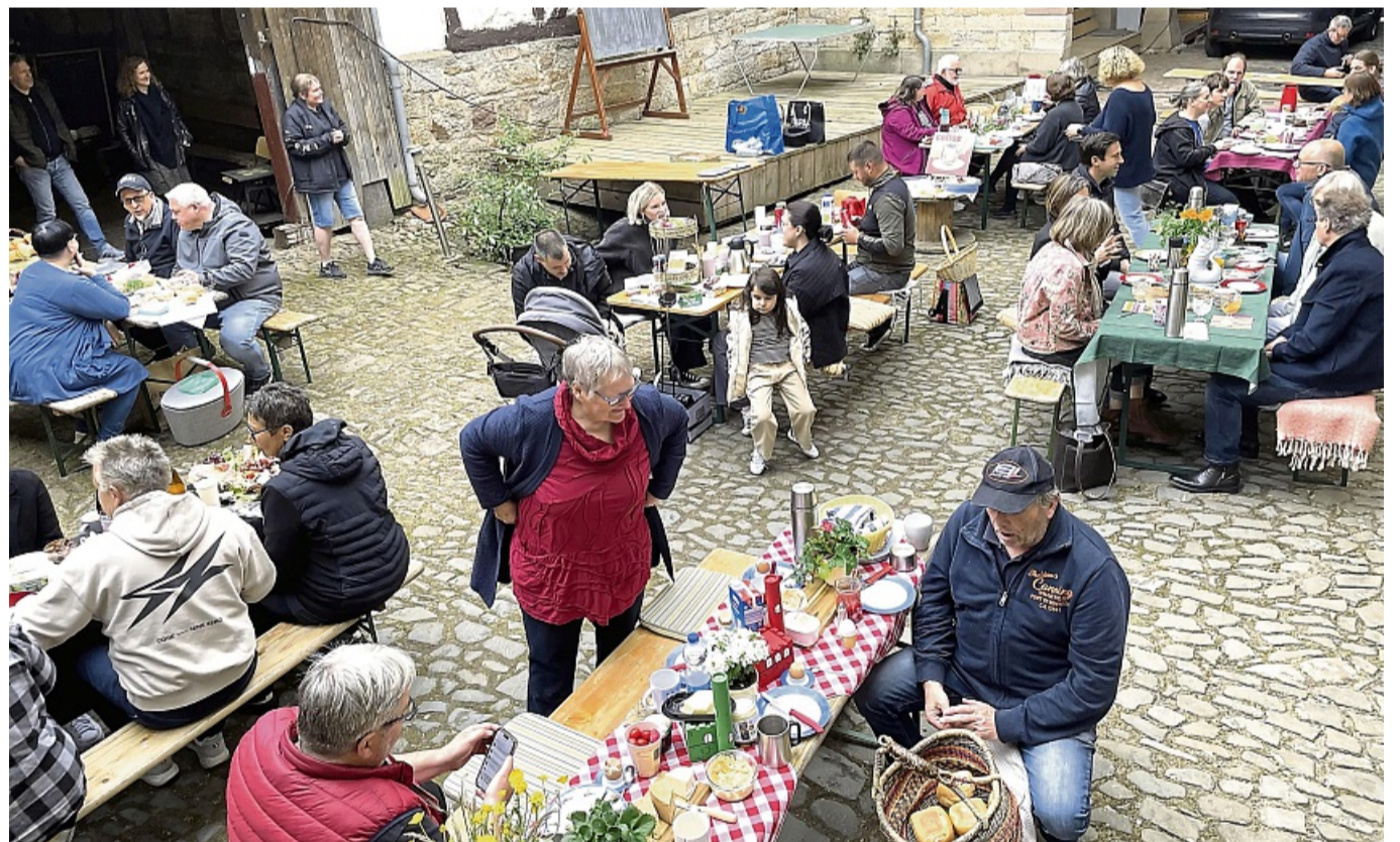
In der schönen Atmosphäre im Hof des historischen Packhofes fühlten sich die Bürgerfrühstücksgäste wohl.