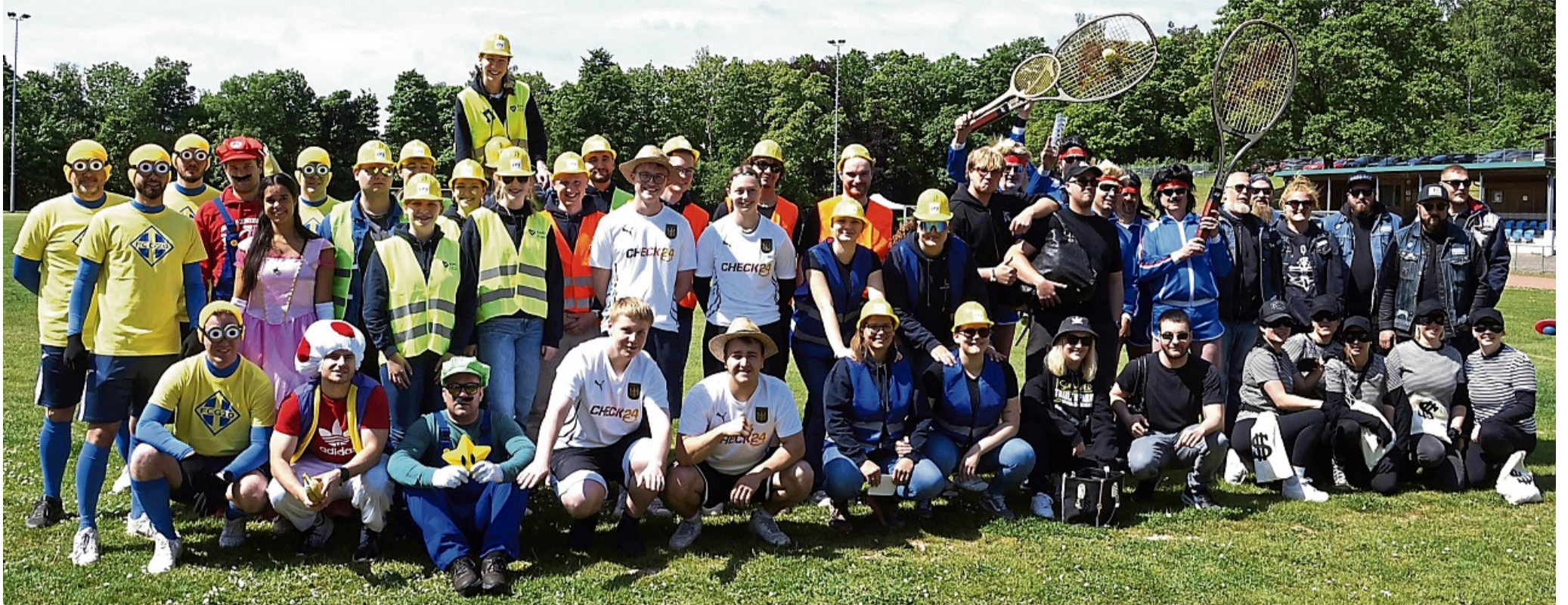
Mehr als 50 Teilnehmer waren in elf kostümierten Teams beim „Spiel ohne Grenzen“ im Schwarzenbergstadion am Start.