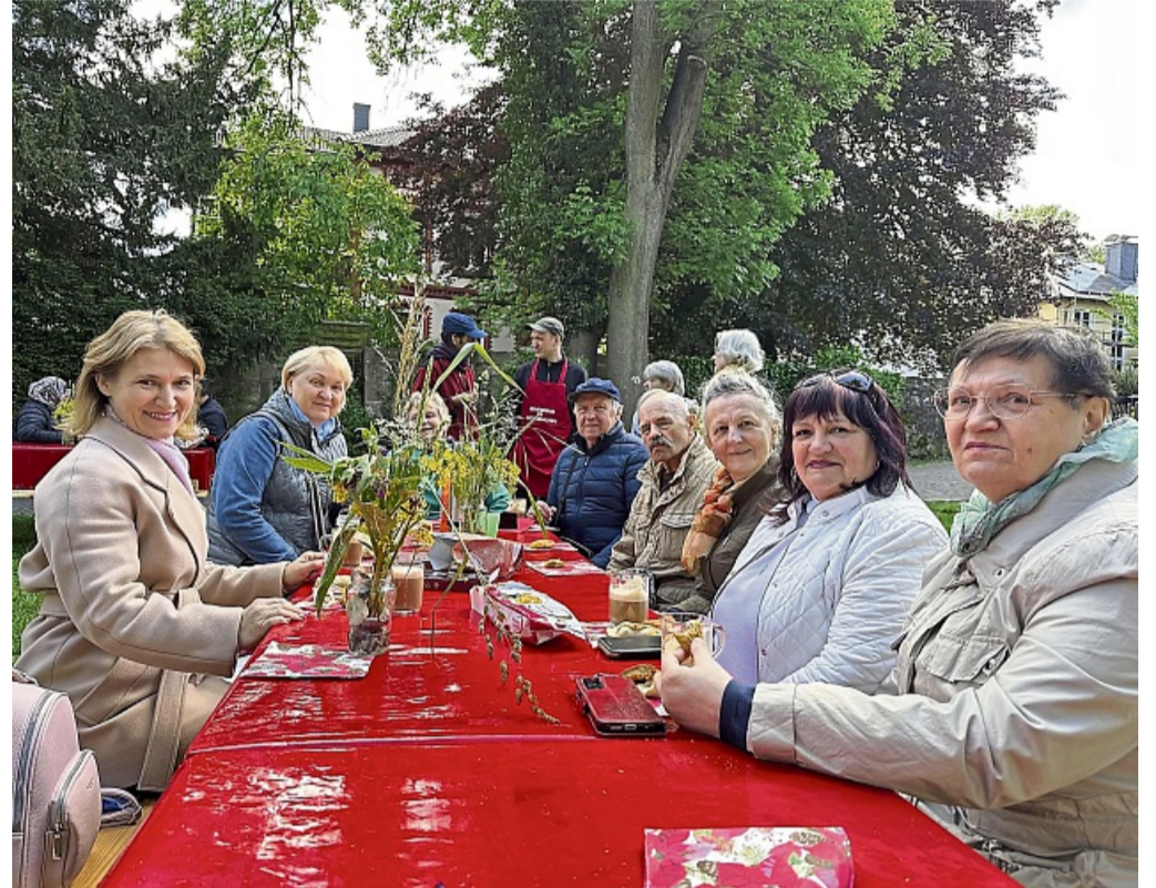
Sprachbarriere? Nicht am Kuchenteller: Ukrainische Gäste im Stadtpark, der gedeckte Tisch dient als Ort des Ankommens und Austauschs.