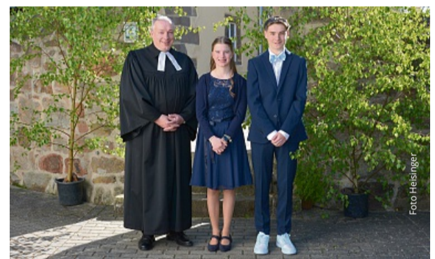
Niederjossa, 11. Mai 2025