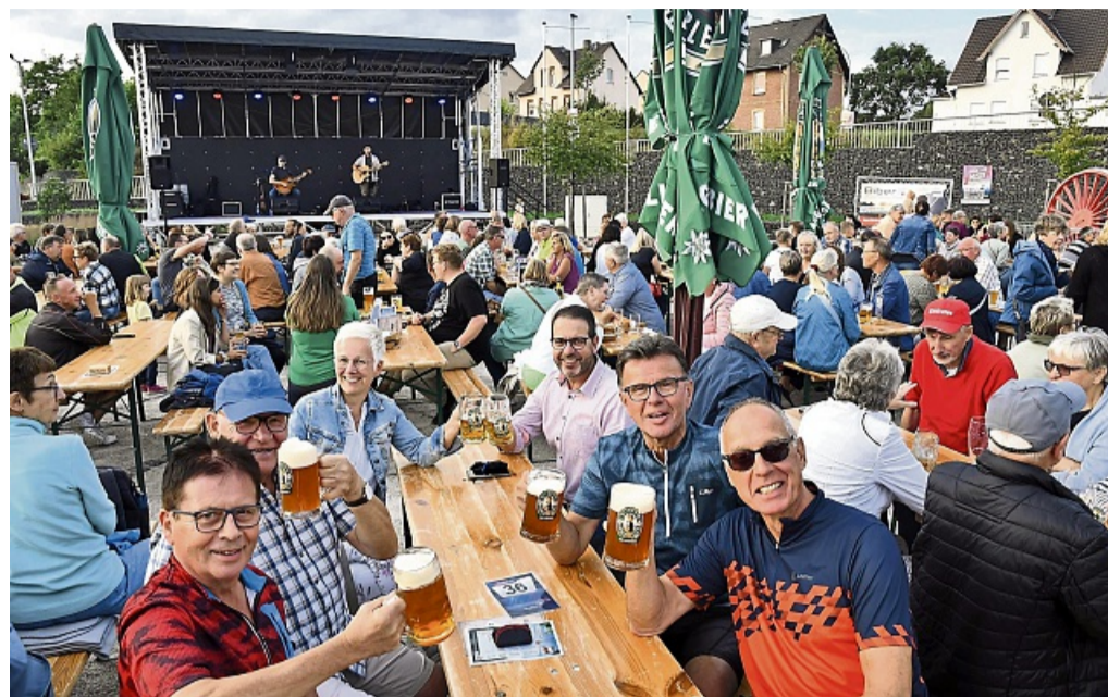
Mehr als 600 Besucher und damit einen neuen Saison-Rekord verzeichnete der Lokschnuppen bei „Mittwochs in Bebra“ im vergangenen August.

Veranstaltungen, die bereits geplant waren und für die