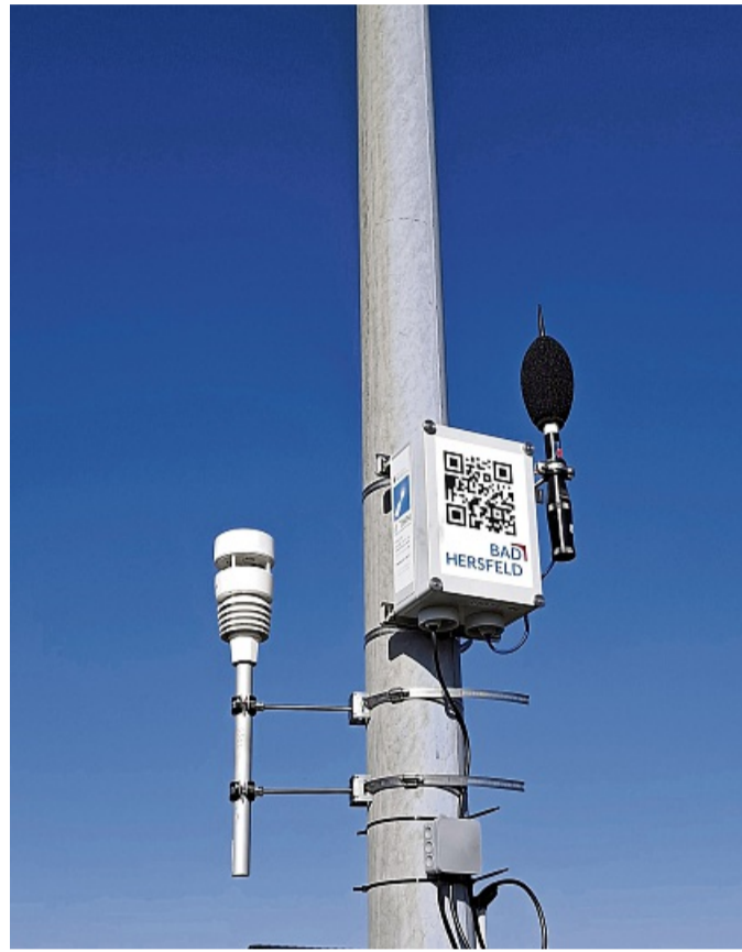
Eine Messeinrichtung für Lärm- und Umweltdaten.

Das interkommunale Projekt „Lärm-Lab“ wird vom Hessischen Ministerium für Digitalisierung und Innovation durch eine Förderung aus dem Programm „Starke Heimat Hessen“ mit mehr als 1,13 Millionen Euro unterstützt. Digital-