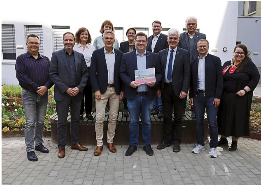
Gemeinsam stark: Vertreter aus Politik, Verwaltung, Wirtschaft und Bildungseinrichtungen setzen sie sich für eine starke Berufsorientierung ein.

Hersfeld-Rotenburg – Seit Jahren ist die hessenweite sogenannte „OloV-Strategie“ – das steht für „Optimierung der lokalen Vermittlungsarbeit im Übergang Schule-Beruf“ – ein wichtiger Faktor für die Berufsorientierung für viele Schülerinnen und Schüler im Landkreis Hersfeld-Rotenburg. Mit der Zusammenarbeit zwischen Schulen, Unternehmen, Verbänden und öffentlichen Einrichtungen wurden in den vergangenen Jahren gute Ergebnisse erzielt. Die strategische Ausrichtung wollen alle Beteiligten weiter intensivieren.