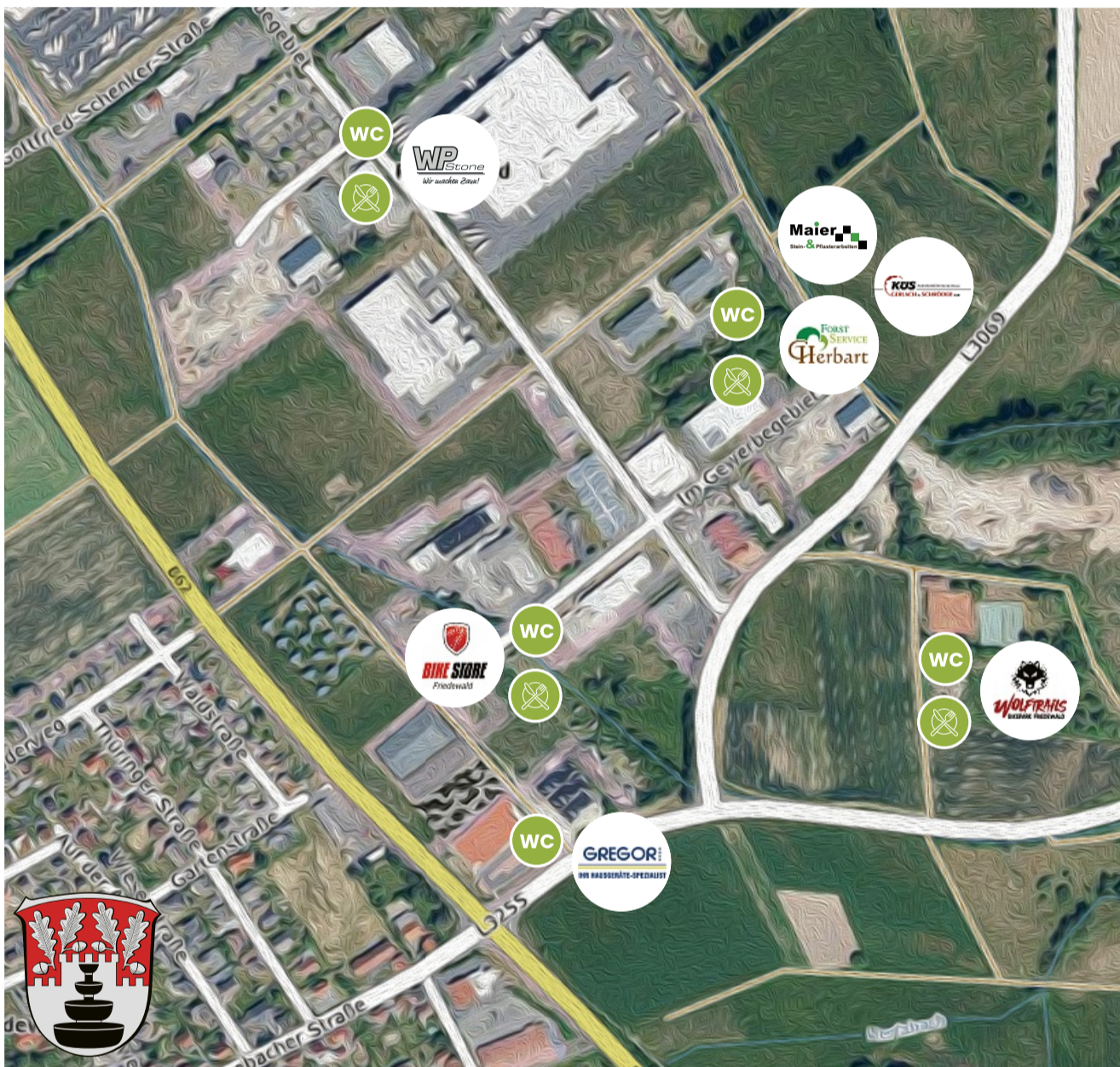
Diese Übersichtskarte zeigt, wo welche Betriebe am Tag der offenen Tür mitmachen.