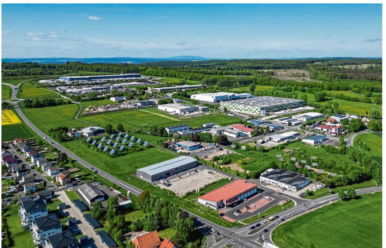
Zum Tag der offenen Tür im Gewerbegebiet wird in Friedewald einiges los sein.

Im Gewerbegebiet 7 ☎ 06674 796 30 11 36289 Friedewald ☎ 0151 590 843 18 ✉ info@ratz-automobile.de