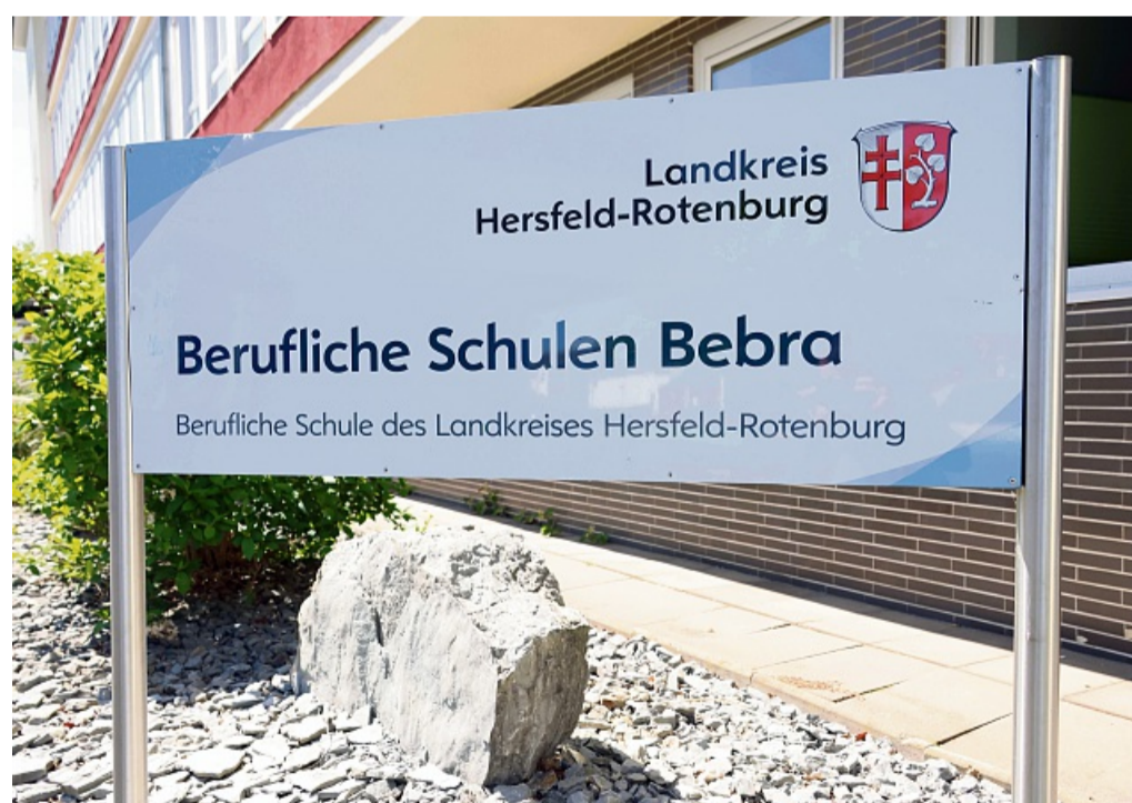
Fertigstellung nach vier Jahren: Das Ergebnis kann sich sehen lassen.

Das Werkstattgebäude wurde während der Baumaßnahme komplett entkernt und nach den neuesten Anforderungen der verschiedenen Ausbildungsberufe saniert. Durch das breite Angebot der Beruflichen Schule Bebra benötigt es dafür spezielle Materialien und neueste Technik. Unter anderem ist im neuen Gebäudekomplex eine Werkstattgrube entstanden. Die ersten IHK-Prüfungen konnten im neuen Werkstattgebäude bereits erfolgreich absolviert werden. Das Projekt hat insgesamt ein Gesamtvolumen von 5,7 Millionen Euro.