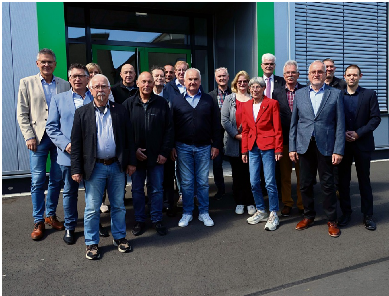
Viele zufriedene Gesichter: Die neue Berufsschule ist fertig