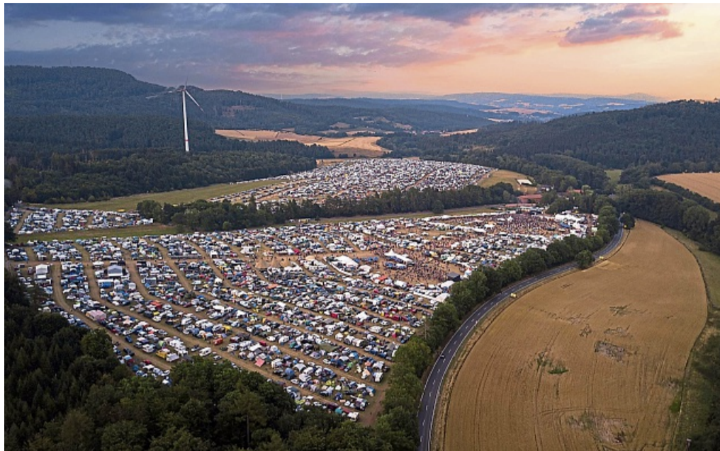
„Love & Peace“ auf dem Herzberg Festival: Auch in diesem Jahr findet wieder das friedliche Musikfest am Fuße der alten Burg in Breitenbach statt.

Über 200 Künstlerinnen und Künstler aus Musik, Literatur, Theater und Performance verwandeln das Herzberg-Festival auch im Sommer 2025 wieder in einen magischen Ort. Dieses Jahr sind neben anderen mit dabei: Devon Allman's Blues Summit, Cari Cari, Motorpsycho, Il Civetto, Weather Systems, DeWolff, The Magic Mumble Jumble, Marley's Ghost & Friends feat. Dellé, Queen Omega & the Royal Souls, Make a Move, BCUC, Ah-