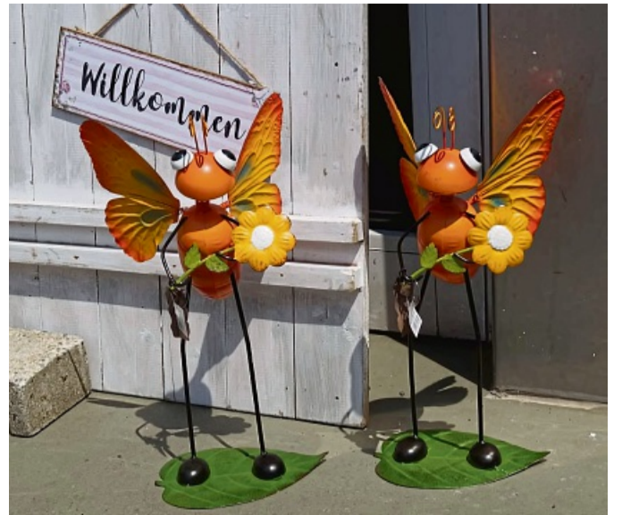
Die besonderen Angebote am 7. Juni laden zum Entdecken ein.

Am letzten Tag des Stadtradelns lohnt sich die Anreise per Rad umso mehr und die Parkplatzsuche gestaltet sich außerdem deutlich flexibler. Besuchen Sie am 7. Juni das Friedewalder Gewerbegebiet und lassen sich von den Produktneuheiten und Aktionen vor Ort begeistern.