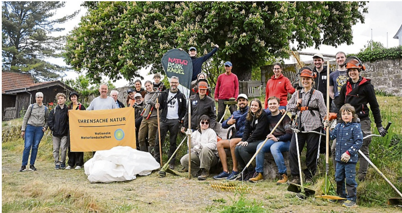
Gemeinsamer Naturschutzeinsatz im Naturpark Knüll auf Schloss Neuenstein mit der WWF-Jugend, dem NABU und weiteren Freiwilligen.

Der Naturgarten am Schloss Neuenstein ist so steil, dass dort von Hand gemäht werden muss. Aus diesem Grund ist die notwendige regelmäßige Pflege eine große Herausforderung. Denn die Handarbeit ist zeitaufwändig und kräftezehrend, ging aber mit so vielen engagierten Menschen gut und freudig von der Hand. Das Mä-