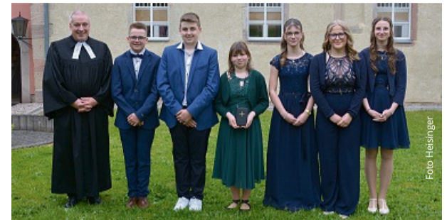
Mengshausen, 4. Mai 2025