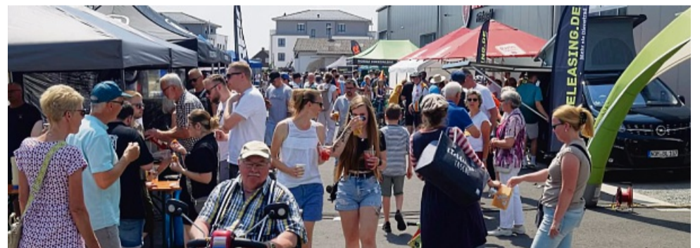
Schon das Gewerbegebietsfest im Jahr 2023 war ein regelrechter Besuchermagnet und erfreute sich bestem Wetter.

Wendorf www.Hoehenverleih.de Wir verleihen Höhe 0177 6949955