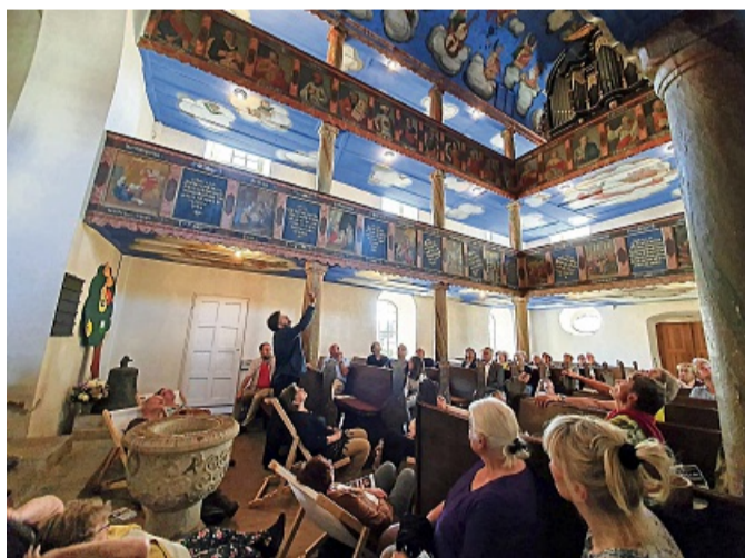
Der Blick geht nach oben: Die prächtige Kirche im Stil des Bauern-Barock in Odensachsen besticht durch die Deckenmalerei.

Zur Route 1 wird ein Bustransfer angeboten, die Route 2 findet als Fahrradtour statt. Die einzelnen Stationen können aber auch selbständig angefahren werden. Eine Anmeldung für die Busfahrt ist aufgrund der begrenzten Plätze erforderlich, an der Fahrradtour und bei individueller Anreise zu den Stationen kann ohne Anmeldung teilgenommen werden. Organisiert werden die Entdeckertouren von den elf betei-