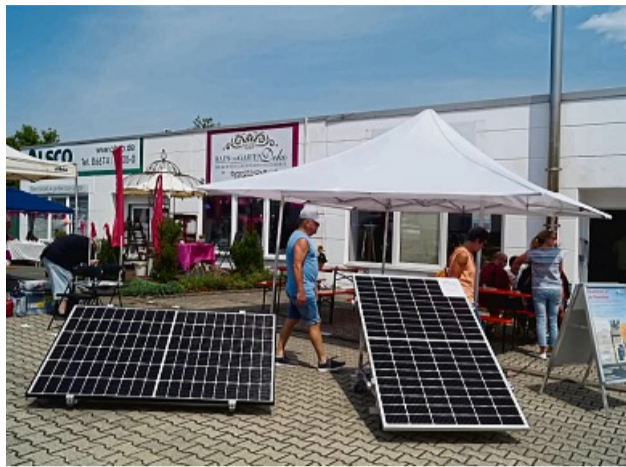
Produktneuheiten zum Anfassen und Gespräche mit den Profis vor Ort gibt es am Tag der offenen Tür.