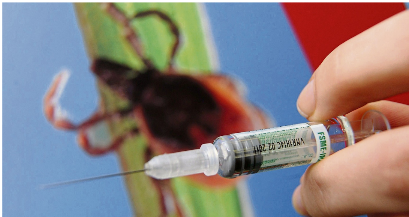
Zeckenalarm: Die kleinen Tiere können im schlimmsten Fall Borreliose übertragen, die mit schweren Symptomen einhergeht.