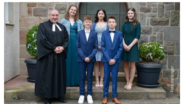
Hattenbach, 18. Mai 2025