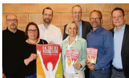
Freuen sich auf den Tag der Ausbildung: Die Aussteller und Veranstalter.

Die Bandbreite reicht von A wie Ante-Holz über S wie Sparkasse bis V wie Vitos: Mit 60 Ausstellern öffnet am kommenden Donnerstag, 12. Juni, das Philipp-Soldan-Forum in Frankenberg von 10 bis 15 Uhr seine Türen für den 24.