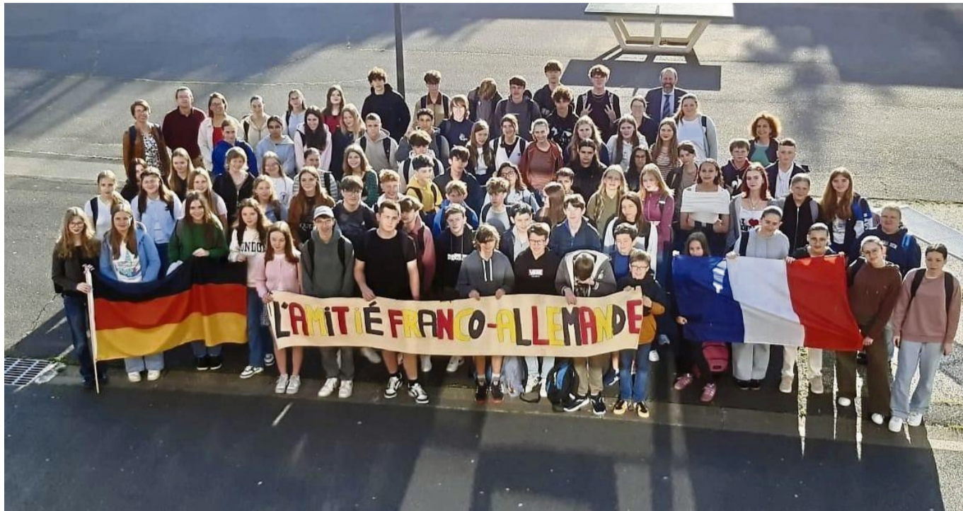
Gegenbesuch in Vendôme: Schüler der Upland-Schule UPS Willingen und der Christian-Rauch-Schule CRS Bad Arolsen erlebten eine spannende Woche an einem französischen Gymnasium.

Die Schülerinnen und Schüler waren in Gastfamilien untergebracht. Für viele Schüler war es ein freudiges Wiedersehen mit den französischen Schülern, die vor wenigen Wochen noch zu Besuch im Waldecker Land waren. Beim Gegenbesuch gab es eine Menge zu entdecken. Besonders das Kennenlernen der französischen Schule war spannend: „Vieles läuft dort doch anders. Wir schnupperten Unterricht und Ambiente, aßen in der Kantine und besichtigten Vendôme, das Dreifaltigkeitskloster Abbaye de la Trinité und genossen das private Programm, teils in Kleingruppen“, berichten die Lehrerinnen.