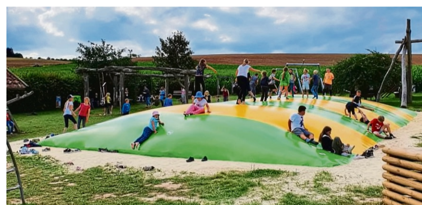
Spiel und Spaß gibt es auf vielfältige Art und Weise.