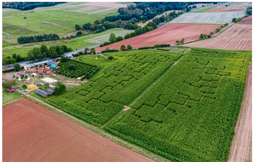
Der Blick aus der Vogelperspektive verdeutlicht die Entwicklung des Maislabyrinths am Edersee.

In enger Zusammenarbeit mit den touristischen Einrichtungen der Gemeinde Vöhl, dem Landkreis Waldeck-Frankenberg, Naturpark und Nationalpark Kellerwald-Edersee sowie der „Grimm-Heimat NordHessen“ wurde der Betrieb ständig erweitert und zu einem weit über die Grenzen des Landkreises hinaus bekannten Ausflugsziel weiterentwickelt. Im Jahr 2000 haben die Betreiber mit einem kleinen Grill unterm