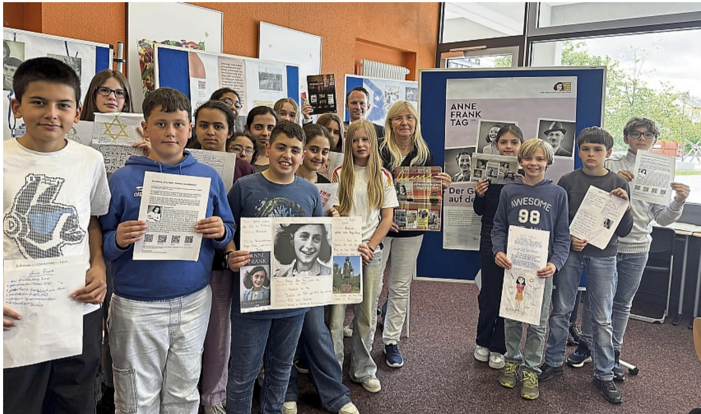
Schülerinnen und Schüler der Alten Landesschule in Korbach setzen mit der Anne-Frank-Ausstellung ein starkes Zeichen gegen Antisemitismus und für eine demokratische Gesellschaft.

Zu sehen sind nicht nur Plakate, sondern auch Zeichnungen, Bilder, Zeittafeln und digitale Präsentationen, die das Leben von Anne Frank und die Schrecken des Holocaust anschaulich darstellen.