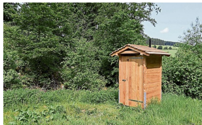
Auch die Notdurft lässt sich im Wald verrichten.

Nicht ganz unerheblich seien hingegen die formalen Vorgaben und Anträge. Umso schöner sei es, dass das Projekt so schnell habe umgesetzt werden können, waren sich Ortsvorsteher, Gemeindevorstand,