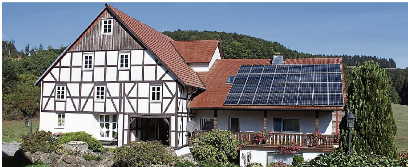
Kulturgut: Die Speiermühle bei Hemmighausen bietet am deutschlandweiten Tag der offenen Mühlen Führungen für Besucherinnen und Besucher an.

Es finden an diesem Tag auch mehrere Mühlenführungen statt. Dabei wird unter anderem über die Arbeit des Müllers in den früheren Zeiten berichtet. Zu sehen sind die Mühle mit Mühleneinrichtung und eine moderne Turbinenanlage, die zur Erzeugung von Elektrizität dient. Es werden außerdem die Themen vom Korn bis zum Mehl und umweltfreundliche Energieerzeugung aus Wasser näher dargestellt. In Hessen beteiligen sich in diesem Jahr insgesamt 34 Mühlen am Deutschen Mühlentag. red