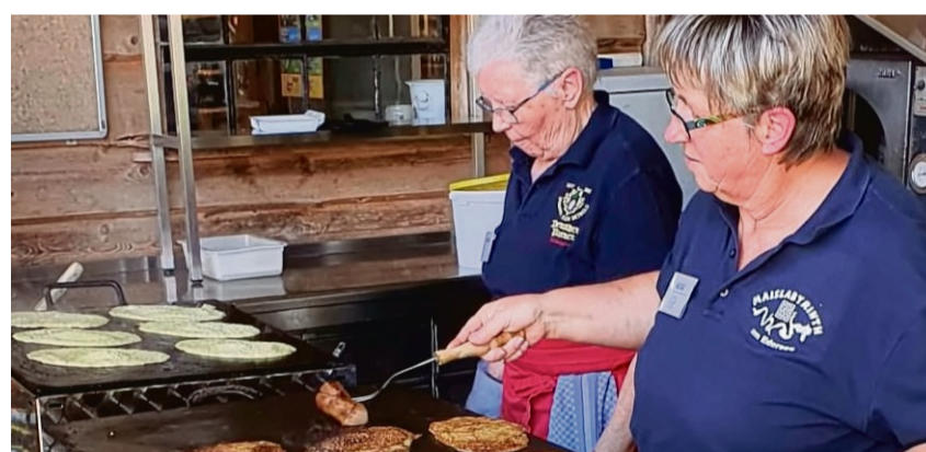
Leckere Speisen aus der Region runden den Besuch am Maislabyrinth ab.