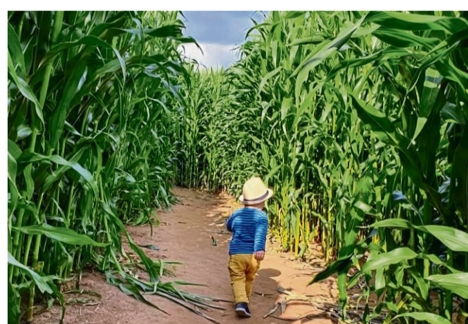
Den Reiz des Verirrrens können junge und ältere Besucher gleichermaßen erproben.

Dank eines geänderten Flächennutzungsplanes konnten im Jahr 2010 ein Gastraum und ein Konferenzraum sowie drei Unterstände als Freilichtmuseum angebaut werden. Seit rund