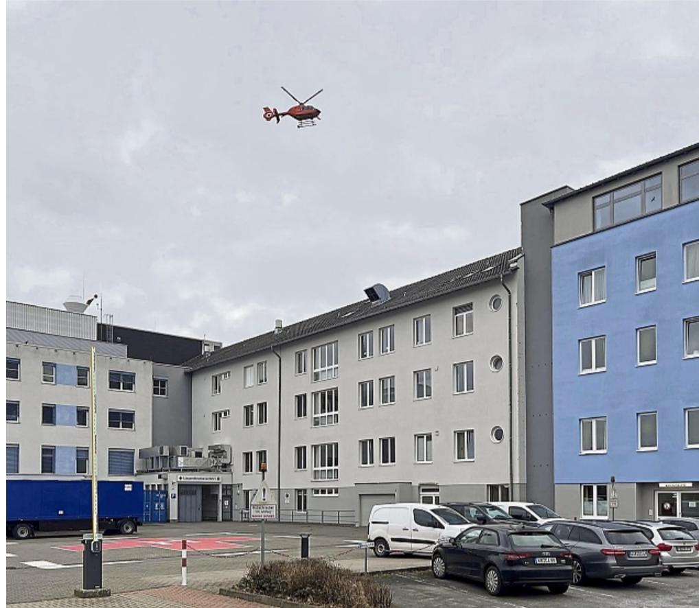
Rettungshubschrauber fliegen das Krankenhaus in Bad Arolsen nicht mehr an, weil es hier keine chirurgische Abteilung mehr gibt. Das Foto entstand zufällig im Februar 2024 beim Landeanflug auf das Arolser Schulzentrum.

Dr. Alexi: „Wir müssen auch darauf achten, dass alle Patienten, die in Waldeck-Frankenberg behandelt werden können, auch tatsächlich in einem Krankenhaus in Waldeck-Fran-