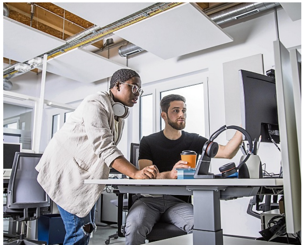
In vielen Unternehmen fangen Teammitglieder die Abwesenheiten anderer in der Urlaubszeit auf – das ist oft stressig.

Kommt es doch dazu, dass man sich in der Zeit, in der man zusätzlich zum eigentlichen Job eine Urlaubsvertretung hat, überlastet fühlt, ist es wichtig, dies der Führungskraft mitzuteilen. „Entschei-