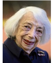
Margot Friedländer Holocaust-Überlebende

Vöhl – Der Förderkreis der Synagoge in Vöhl zeigt am Dienstag, 10. Juni, in seiner Reihe „Dienstagskino in der Synagoge“ einen Film über das Leben der am 9. Mai 2025 verstorbenen Holocaust-Überlebenden Margot Friedländer. „Damit möchten wir an eine herausragende Persönlichkeit erinnern, die sich in besonderer Weise für die Aufklärungs- und Erinnerungsarbeit verdient gemacht hat“, teilt der Förderkreis mit.