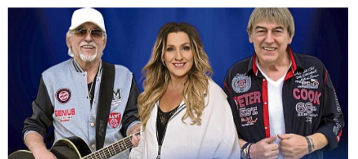
Am 13. Juni 2026 in Korbach: Die Amigos mit Daniela Alfinito.

Seit mehr als 55 Jahren stehen die Brüder Bernd und Karl-Heinz Ulrich als die Amigos auf der Bühne. Ihre Alben landeten 16 Mal auf Platz 1 der deutschen Charts. Im August 2025 er-