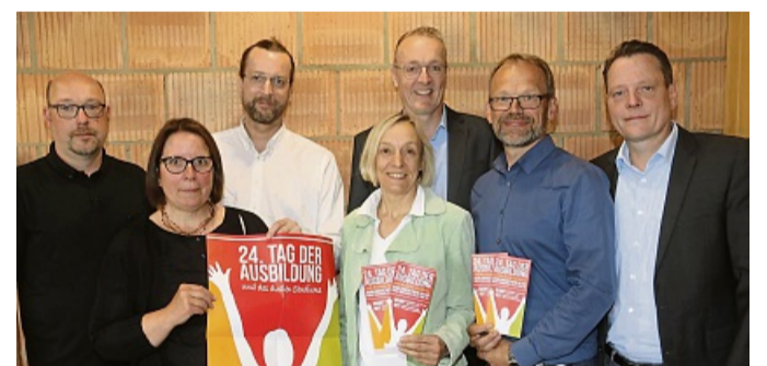
Freuen sich auf den Tag der Ausbildung: Die Aussteller und Veranstalter

Die Bandbreite reicht von A wie Ante-Holz über S wie Sparkasse bis V wie Vitos: Mit 60 Ausstellern öffnet am kommenden Donnerstag, 12. Juni, das Philipp-Soldan-Forum in Frankenberg von 10 bis 15 Uhr seine Türen für den 24. „Tag der Ausbildung“.