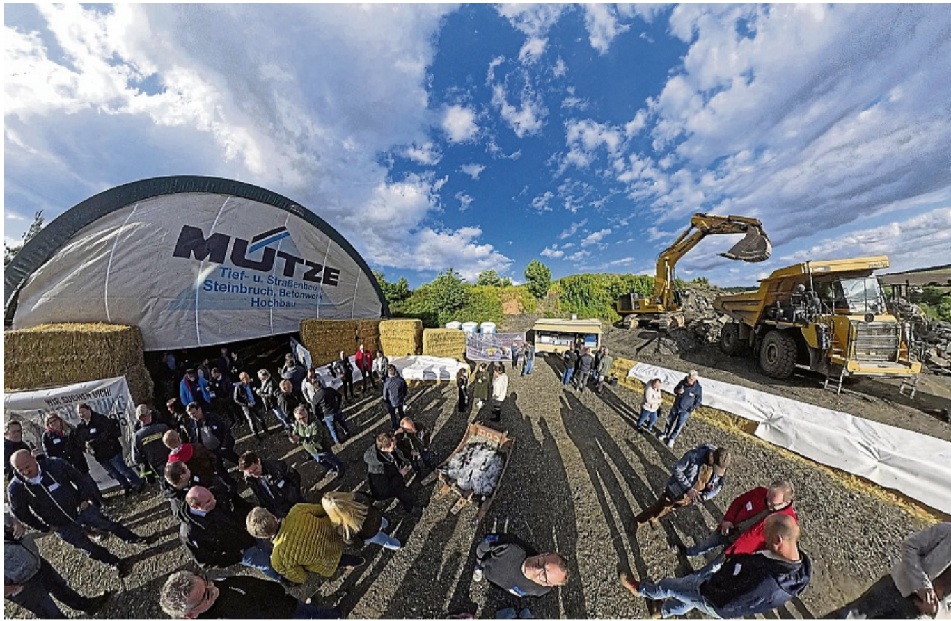
Im Steinbruch Hunold bei Dainrode trafen sich Unternehmer und Führungskräfte mit Wirtschaftsförderern zum Austausch.