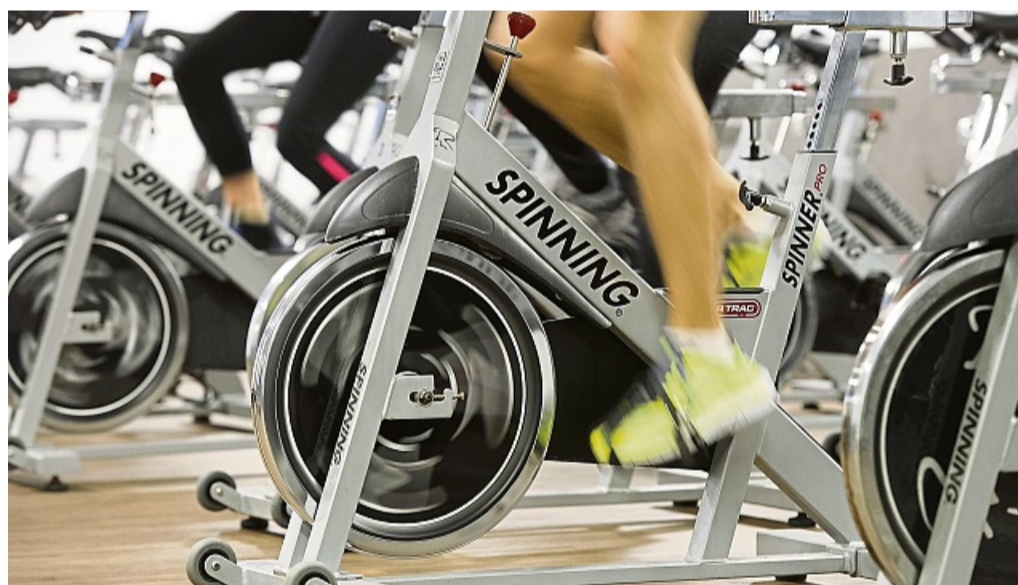
Indoorcycling statt Rennradrunde draußen: Bei Sommerhitze ist es sinnvoll, das Training ins gut klimatisierte Fitnessstudio zu verlegen.