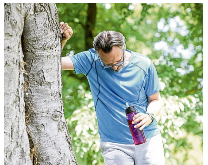
Kopfwahl, Schwindel, Übelkeit? Dann sollten Sportlerinnen und Sportler ihr Training unbedingt unterbrechen.