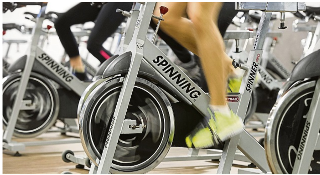
Indoorcycling statt Rennradrunde draußen: Bei Sommerhitze ist es sinnvoll, das Training ins gut klimatisierte Fitnessstudio zu verlegen.