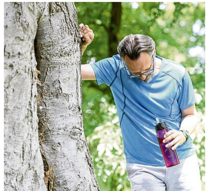
Kopfwahl, Schwindel, Übelkeit? Dann sollten Sportlerinnen und Sportler ihr Training unbedingt unterbrechen.