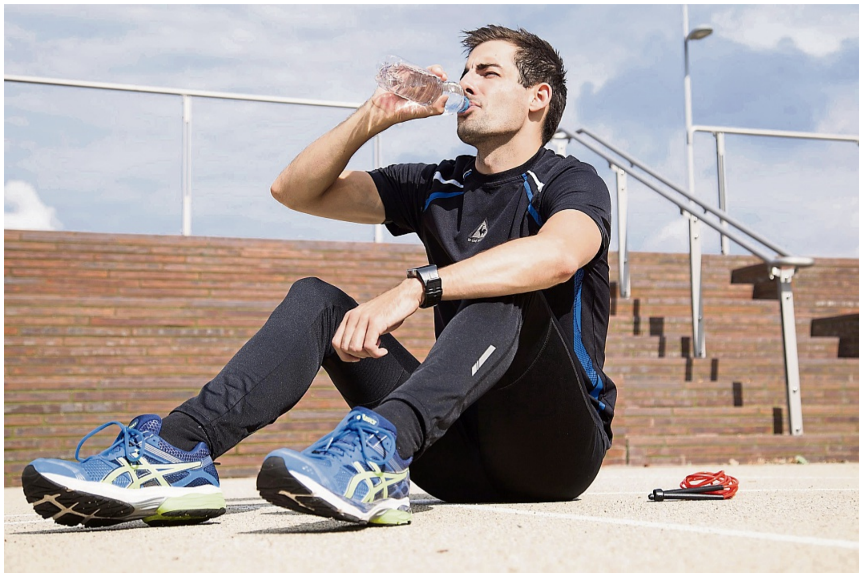
Wichtig vor und nach dem Training: genug trinken. Bei längeren Einheiten sollten Sportlerinnen und Sportler auch währenddessen Flüssigkeit nachlegen.