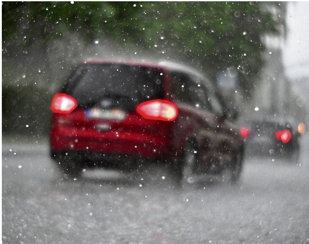
Vorsicht unterwegs: Bei Hagel Tempo drosseln und Warnblinker nutzen.

Laternenparker können überlegen, für den betroffenen Zeitraum in einer öffentlichen Parkgarage unterzustellen –