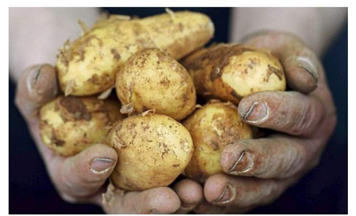
Mit oder ohne Schale: Die zarte Hülle kann bei frischen Knollen gerne mitgegessen werden.

Gerade erst gepflanzt und schon geerntet: Frühkartoffeln haben wegen ihrer kurzen Zeit unter der Erde eine dünnere Schale und ein feines, leicht süßliches bis nussiges Aroma. Zudem ist der Stärkegehalt laut Bundeszentrum für Ernährung (BZfE) etwas geringer als bei normalen Kartoffeln. Vom Feld kommen sie meist direkt auf den Markt oder ins Geschäft und werden auch zu Hause am besten gleich verarbeitet. An einem dunklen, trockenen und kühlen Ort halten sich Frühkartoffeln maximal zwei Wochen. Dünne Schale lässt sich mitessen Aufgrund der dünneren Schale müssen sie nicht unbe- dingt geschält werden. Die Schale aber bitte nur essen, wenn die Knollen sehr frisch und rundum heile sind. Grüne und keimende Stellen immer großzügig entfernen. Wer die zarte Schale nicht mitessen möchte, kann sie unter lauwar-mem Wasser abreiben oder ab-bürsten – oder die Kartoffeln nach dem Garen mit dem Mes-ser pellen. Auch Frühkartoffeln gibt es in verschiedenen Sorten: etwa als fest kochende Annabelle, vorwiegend festkochende Aga-ta oder mehlig kochende Au-gusta. Je nach Geschmack eigen sie sich für Pell- und Salz-kartoffeln, Salat oder zusam-men mit Frühlingsgemüse wie Spargel, Kohlrabi und Radies-chen. dpa