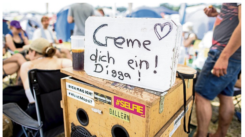
Stundenlang in der prallen Sonne: Wer sich nicht mit hohem Lichtschutzfaktor eincremt, riskiert einen Sonnenbrand.