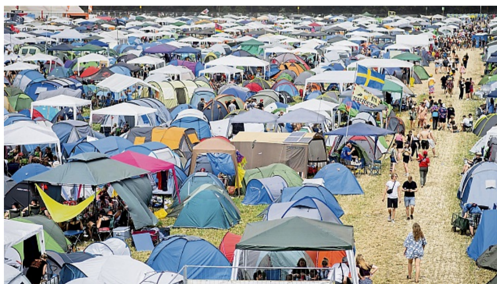
Kreislaufprobleme, Kater, Schnittverletzungen am Fuß – alles keine Seltenheit auf Musikfestivals.