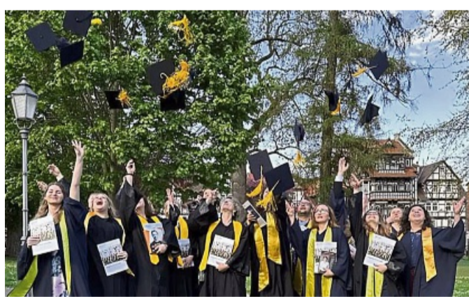
Voller Leichtigkeit und Stolz: Absolventinnen und Absolventen der Diploma-Hochschule werfen ihre Hüte in den Himmel und feiern das Erreichen ihrer Abschlüsse.

In festlichem Glanz präsentierte sich der Campus in Bad Sooden-Allendorf, der sich zur Kulisse für gleich zwei feierliche Veranstaltungen wandelte. Mehr als 280 Absolventinnen und Absolventen folgten der Einladung der Hochschule und feierten ihren Erfolg im Beisein von Familie, Freundinnen und Freunden, Lehrkräften sowie