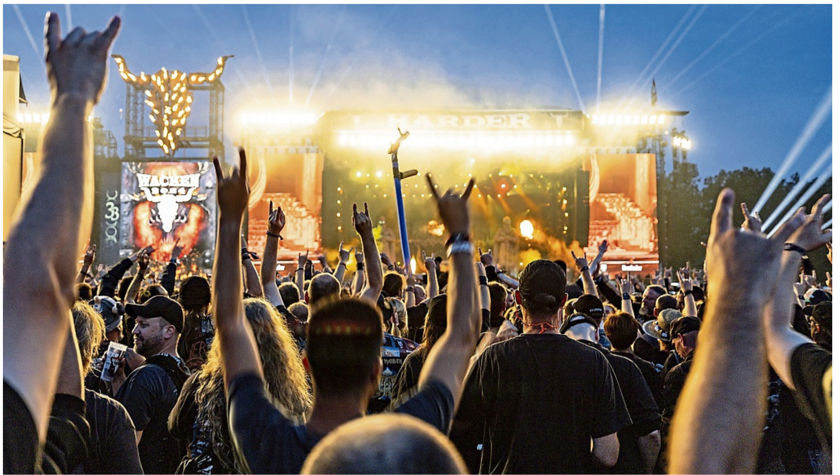
Gemeinsam die liebsten Bands feiern – so machen Festivals Spaß. Bei kleineren Gesundheitsproblemen hilft eine gut ausgestattete Festival-Apotheke.

Wer jetzt keinen halben Festivaltag an den Kater verlieren will, kann versuchen, ihn in den Griff zu bekommen. Vorsorglich packen Fans am besten jeweils Mittel gegen Kopf-