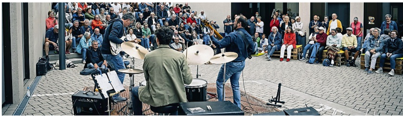
Die imposante Rathhaustreppe wird wieder zur Tribüne bei einem besonderen Musikerlebnis in Korbach. Das Foto entstand beim Treppenkonzert im vergangenen Jahr.