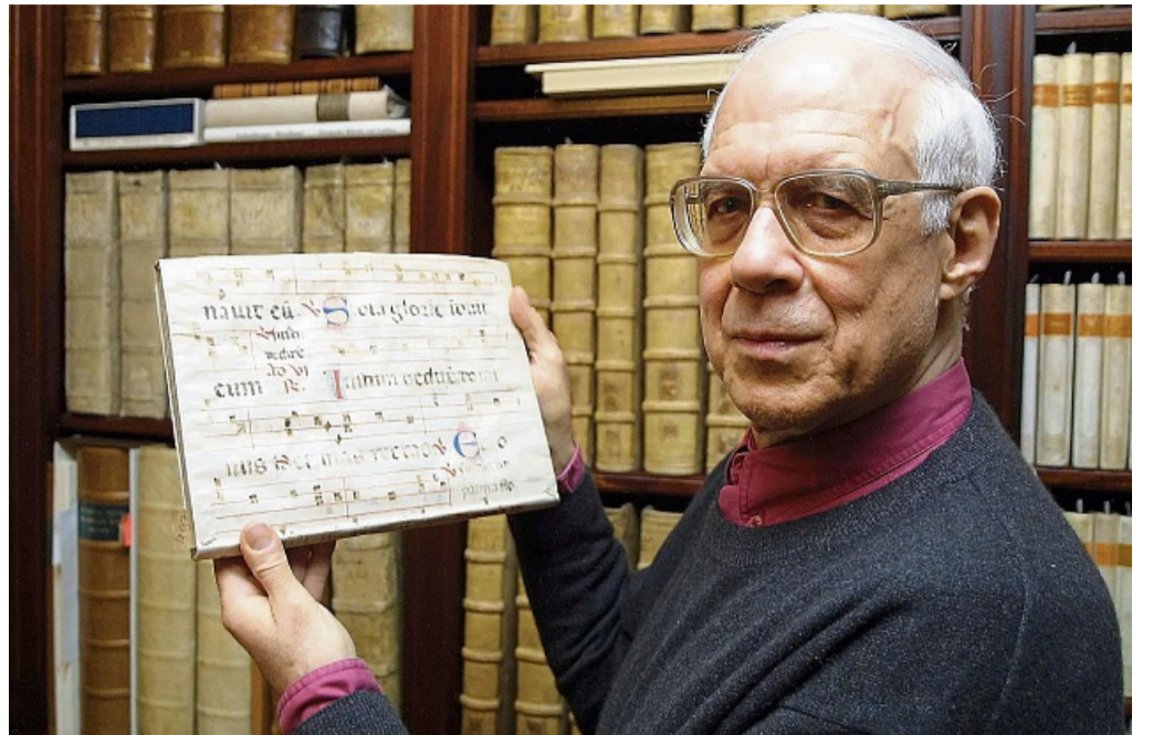
Büchersammler Adolf Brehm auf einem seltenen Foto aus dem Jahr 2002. Der inzwischen verstorbene Schweizer Unternehmer hat sein gesamtes Vermögen in den Aufbau einer bemerkenswerten Bibliothek gesteckt.

Die Geschichte der Bibliothek Brehm Stiftung war in den letzten dreieinhalb Jahrzehnten durchaus turbulent. Es bedurfte enormer Anstrengungen, um die wertvolle Bibliothek mit mehr als 40.000 Büchern, Handschriften, Urkunden, historischen Karten, Kupferstichen, antikem Mobiliar und Kunstobjekten zu sichern und angemessen zu präsentieren, aber letztlich verfügen die Stadt Bad Arolsen und der Landkreis mit der Bibliothek Brehm über einen einmaligen kulturellen Schatz. Die Stiftung hat sich der Pflege und Erhaltung der Bibliothek von Adolf Brehm, einer der wenigen öffentlich zugänglichen