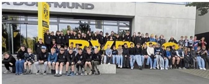
Besuch von Freunden aus England: Die Stadionführung in Dortmund war einer der Höhepunkte der Woche.

Vöhl – Mit strahlenden Gesichtern und unvergesslichen Erinnerungen im Gepäck traten 35 englische Kinder die Heimreise nach Bugbrooke an. Eine Woche lang waren sie zu Gast beim TSV Vöhl und erlebten gemeinsam mit deutschen Altersgenossen ein abwechslungsreiches Programm aus Sport, Bildung und Kultur.