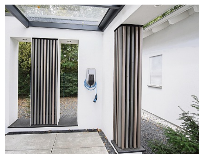
E-Mobilität im Eigenheim: Die Ladeinfrastruktur lässt sich am besten gleich beim Bau integrieren.