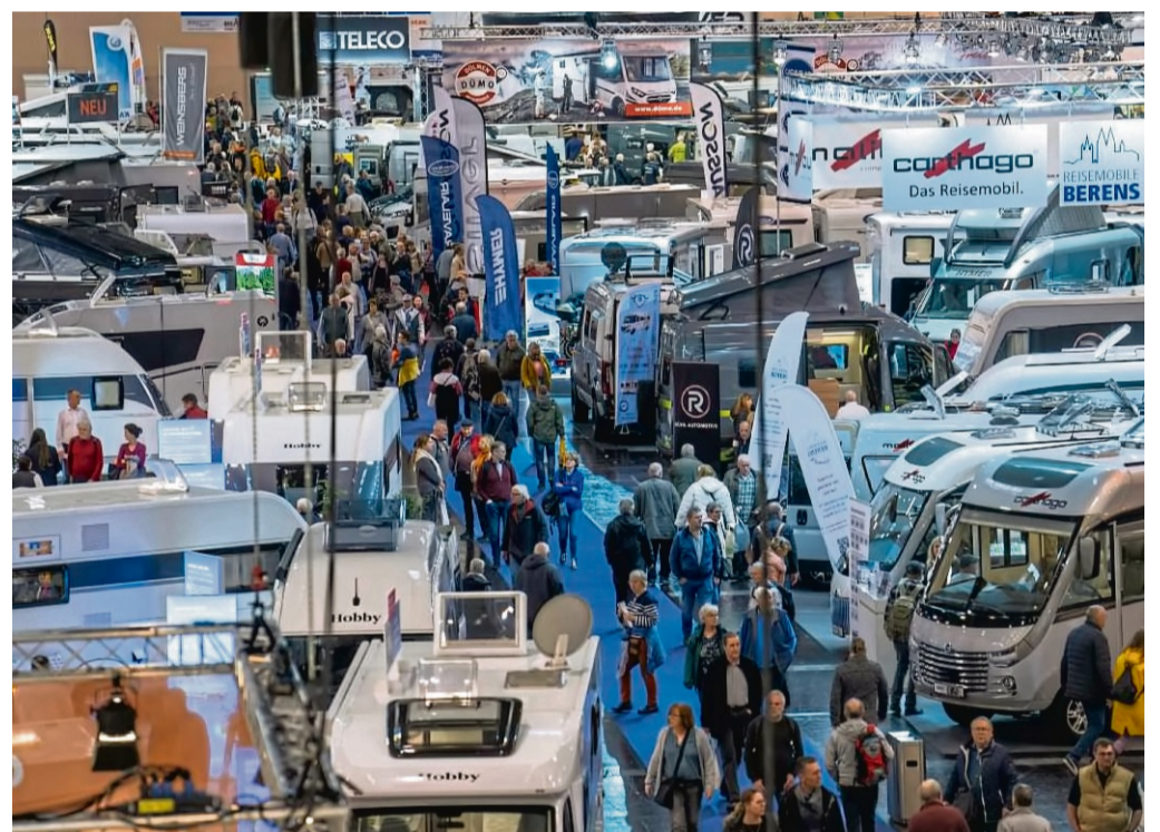
Großes Interesse: der Bestand an Wohnmobilen hat sich mehr als verdoppelt.

Ob Frühstück mit Blick auf den See, spontane Abstecher zu Sehenswürdigkeiten oder der Abend am Lagerfeuer – diese Form des Reisens macht Erlebnisse intensiver und nachhaltiger. Wichtig ist dabei ein respektvoller Umgang mit Natur und Mitmenschen.