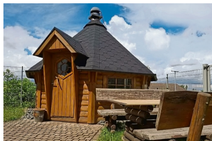
Highlight im Außenbereich bei Angelo: Die Grill-Kota.