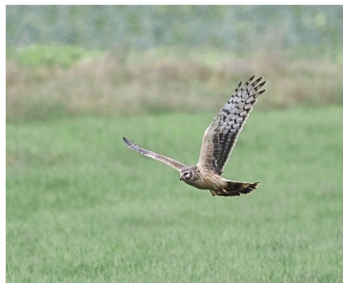
Eine weibchenfarbene Kornweihe: Für Greifvögel ist die Hochfläche wichtig.

Sparen % Sparen % Sparen % Super-Feiertags-Rabatt