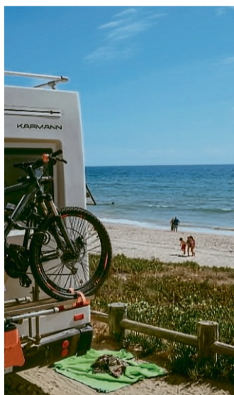
Der Reiz des Wohnmobilurlaubs liegt im direkten Kontakt mit der Umgebung.

Statt starrer Hotelbuchungen oder überfüllter Flughäfen steht beim Wohnmobilurlaub das Erleben der Natur, der Regionen und der Spontaneität im Vordergrund.