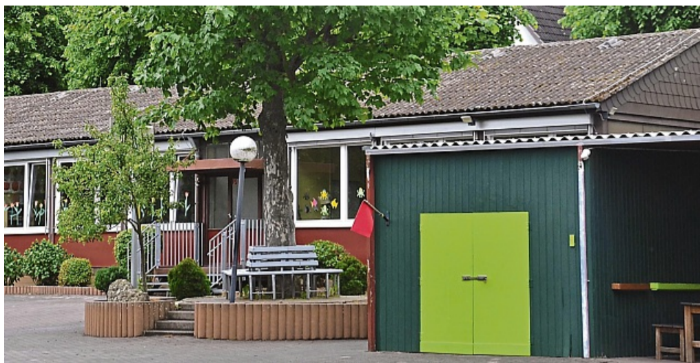
Zu klein, nicht erweiterbar und sanierungsbedürftig ist der Pavillon laut Landkreis.

Sanierungsmaßnahmen an anderen Schulen im Stadtgebiet seien abgeschlossen: An Humboldtschule, Westwallschule und Marker Breite sei