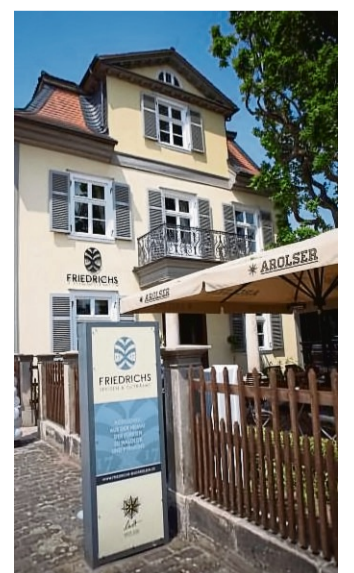
Das „FRIEDRICHS“ in Bad Arolsen.