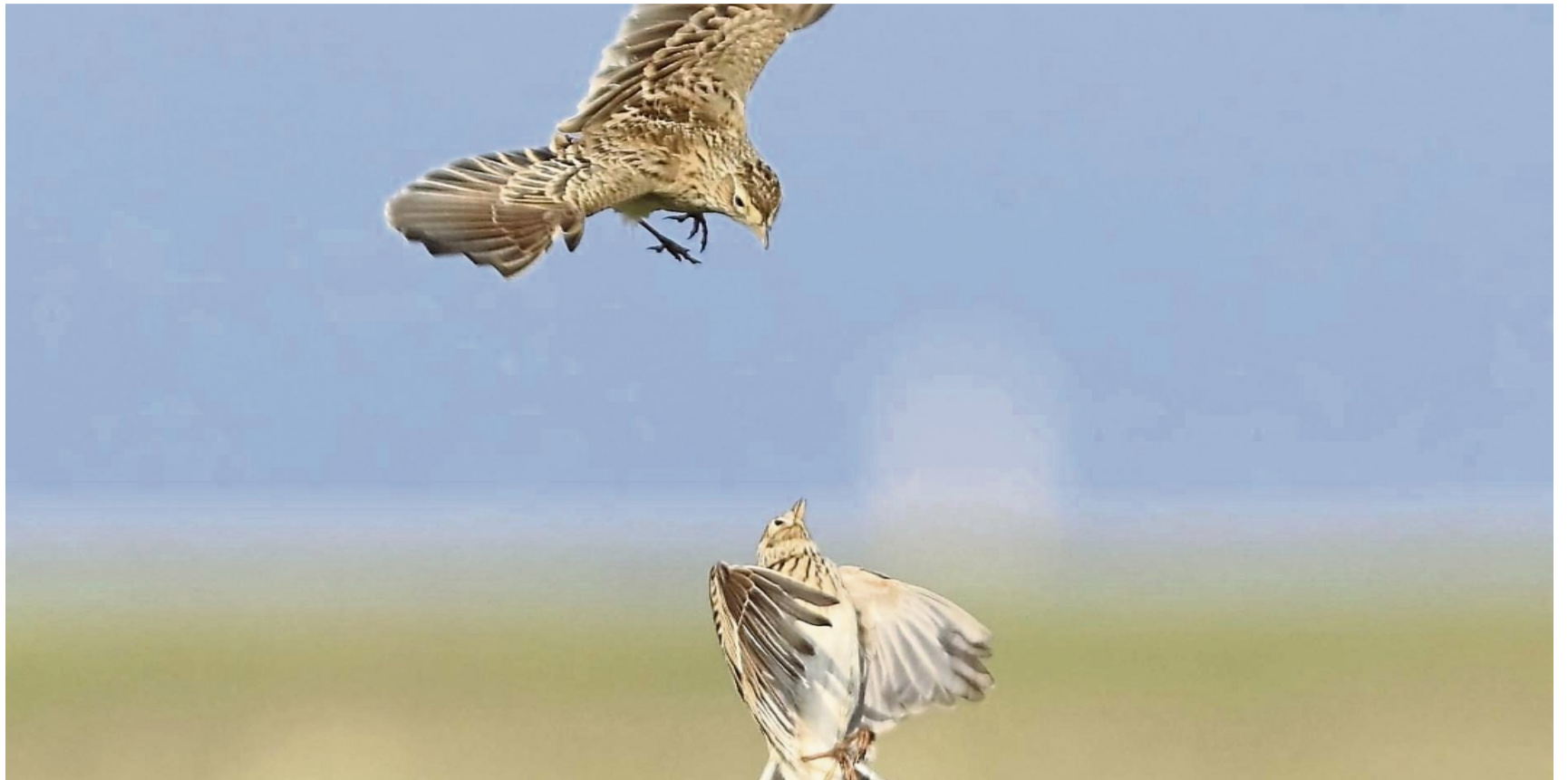
Revierkampf von zwei Feldlerchen in der Goddelsheimer Hochfläche. Die Vögel weisen mit 492 Revieren eine überraschend hohe Siedlungsdichte auf.

Doch die Bedeutung der Hochfläche geht weit über die Brutzeit hinaus. Sie dient vie-