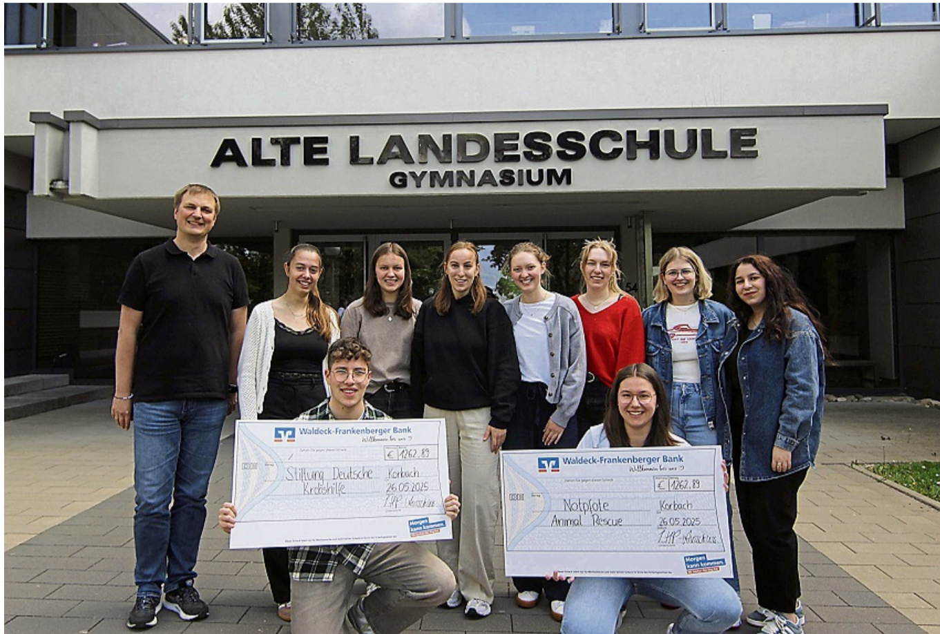
Stolzer Betrag: 2500 Euro wurden im vergangenen November bei der Lehrerhitparade erwirtschaftet. Jeweils die Hälfte des Geldes erhalten die Deutsche Kinderkrebshilfe und die Tierschutzorganisation „Notpfote“ als Spende.

Die Show selbst dauerte gut zweieinhalb Stunden, die Planung hingegen ein knappes Jahr. Seit Januar 2024 plante der LHP-Ausschuss gemeinsam mit dem aktuellen Leiter der