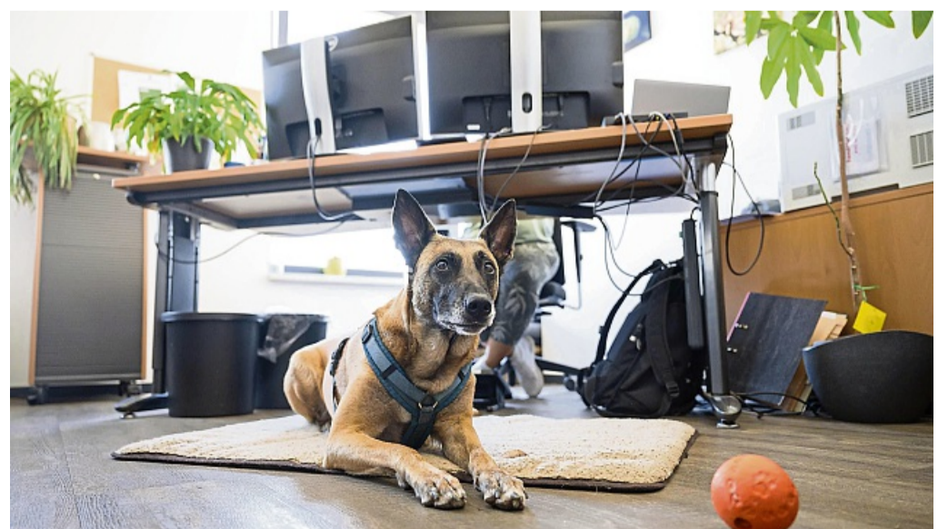
Am Arbeitsplatz braucht der Hund ein ungestörtes Plätzchen zum Ausruhen.