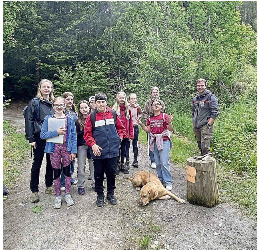
Waldjugendspiele an der Adam-von-Trott-Schule Sontra: Ein gelungener Tag im Zeichen der Natur.

Ein wesentlicher Bestandteil der Veranstaltung war die Unterstützung durch Schülerinnen und Schüler der Q2. Sie übernahmen eigenständig die Leitung einzelner Stationen und trugen mit Fachwissen und pädagogischem Geschick zur gelungenen Durchführung bei.