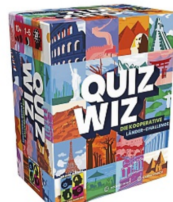
«QuizWiz»: Autor: Rodrigo Rego, Brain Games/Asmodee, ab 10 Jahren, für 1-5 Spielende, ca. 20 Minuten, Preis ca. 20 Euro