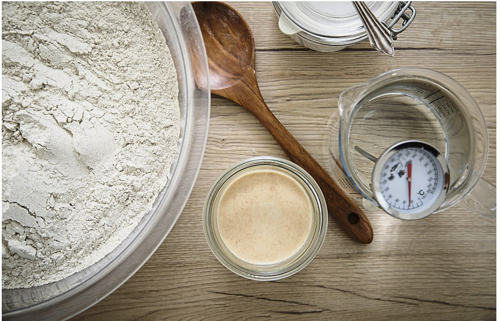
Die Zutaten fürs Sauerteigbrot bestehen eigentlich nur aus Mehl und Wasser. Falls vorhanden, kommt auch Sauerteigansatz (Anstellgut) und je nach Rezept etwas Salz und Hefe hinzu.

Gefüttert werden immer wieder 50 Gramm Mehl und 50 Gramm Wasser. Entweder erhöht sich damit die Sauerteigmenge – praktisch, wenn man zum Backen am Ende ein paar hundert Gramm braucht. Man könne aber auch nach zwei oder drei Tagen zum Beispiel 25 Gramm vom Sauerteigansatz abnehmen und diesem das 50-50-Futter geben, erklärt Lutz Geißler.