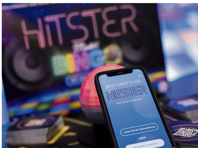
Für das interaktive Musik-Kartenspiel «Hitster» braucht man eine App und Spotify.