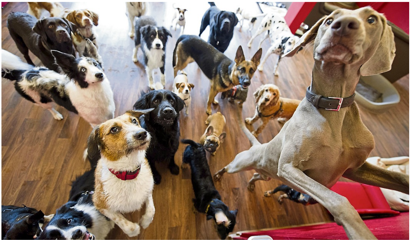
In einer Tagesstätte hat der Hund die Möglichkeit, enge Freundschaften zu anderen Hunden zu entwickeln.

Was die Kita für Eltern ist, ist die Huta für Hundebesitzer: Auf dem Weg zur Arbeit wird der Hund morgens in der Tagesstätte abgeliefert - und nachmittags wieder abgeholt. Vorteil für Herrchen und Frauchen: Sie wissen, dass ihre Vierbeiner nicht allein sind oder unter Einsamkeit und Längeweile leiden. Im besten Fall haben sie sogar noch ein paar Buddies zum Toben.