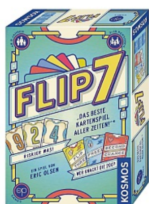
«Flip 7»: Autor: Eric Olsen, Kosmos, ab 8 Jahren, für 3-18 Spielende, ca. 20 Minuten, Preis ca. 15 Euro