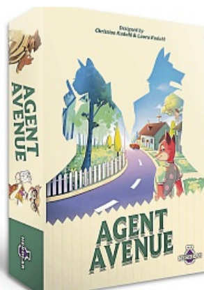
«Agent Avenue»: Autoren: Christian und Laura Kudahl, Nerdlab Games, ab 8 Jahren, für 2-4 Spielende, ca. 10-15 Minuten, Preis ca. 20 Euro