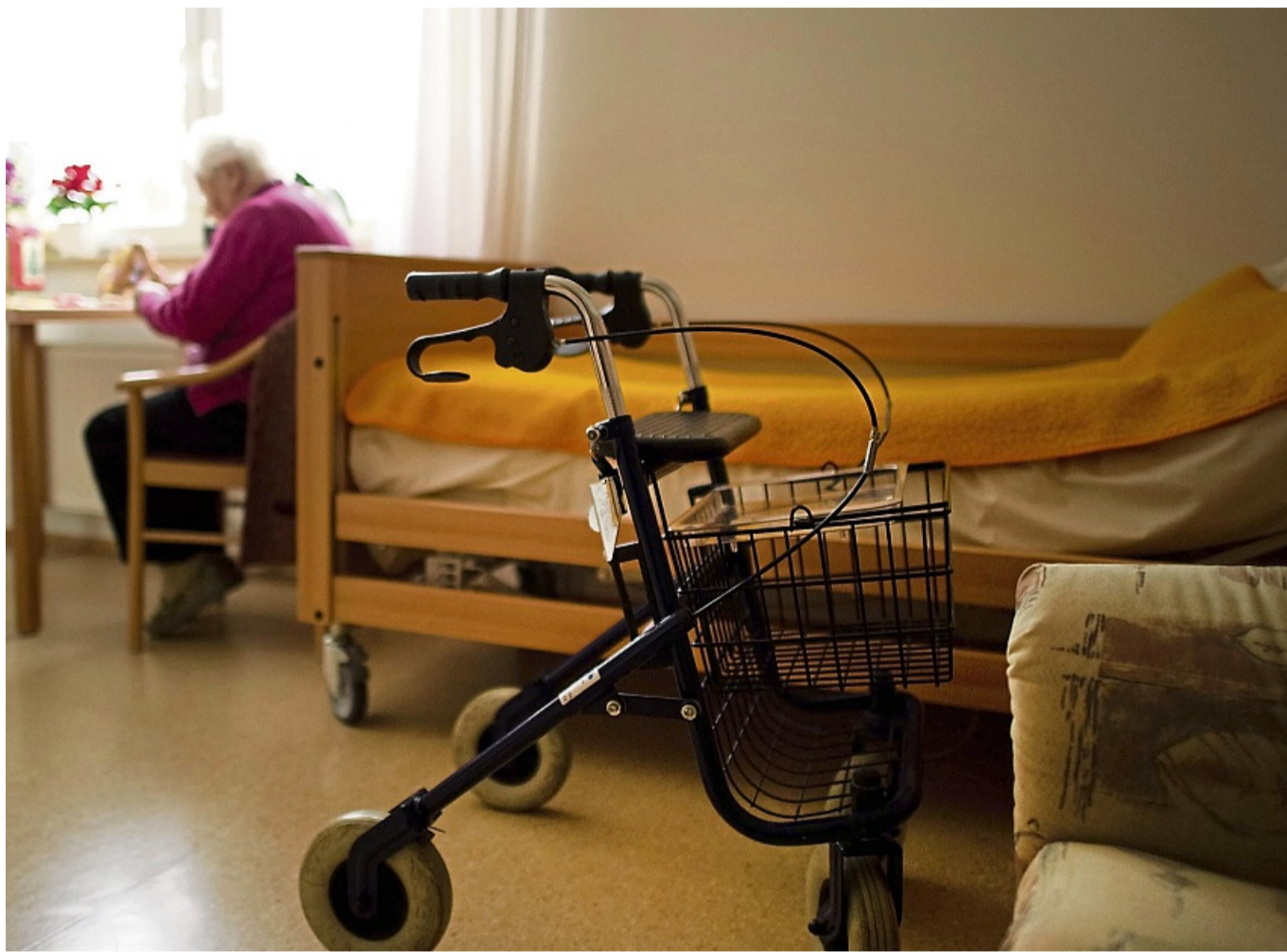
Struktur gibt Sicherheit: Ein geregelter Tagesrhythmus hilft besonders bei Demenz und kann das Einschlafen erleichtern.

Weil es sich mit kalten Füßen schlecht schläft, kann zudem ein warmes Fußbad vor dem Zubettgehen ein wohltuendes Ritual sein, das auf die Nacht einstimmt. Alternativ kann man am Abend auch Strümpfe auf die Heizung legen und sie