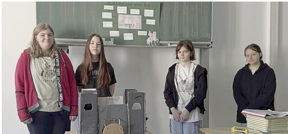
Schülerinnen üben für die Abschlussprüfungen mit kreativen Projekten.

Die Bandbreite der Projekte war auch in diesem Jahr beeindruckend: Während eine Gruppe länderübergreifende Gerichte wie Schnitzel, Kartoffeln, Gurkensalat, Kaiserschmarrn und marokkanischen Tee zubereitete, beschäftigten sich andere