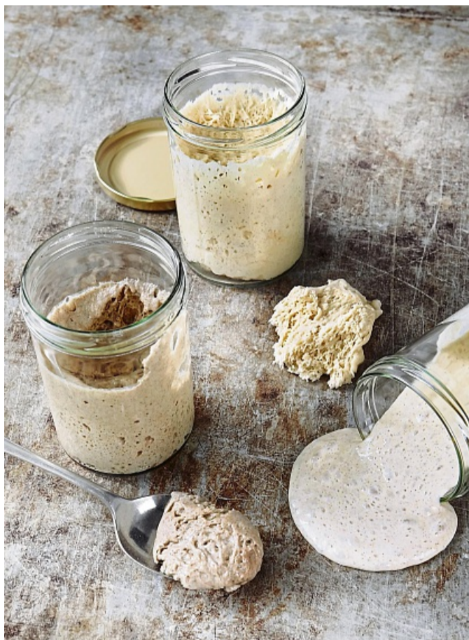
Die «Geburt» eines Sauerteigs dauert drei bis fünf Tage. In der Zeit muss er immer wieder mit Mehl und Wasser gefüttert werden.