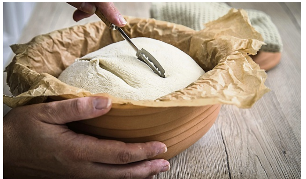
Sauerteig für Weizenbrot kann im Römertopf gebacken werden und wird vor dem Backen eingeknetet.

Für Einsteiger hat der Brotbäcker ein einfaches Rezept: 500 Gramm Sauerteig werden mit 360 g Mehl (z. B. Roggenvollkorn- oder helles Roggenmehl) sowie 220 g warmem Wasser