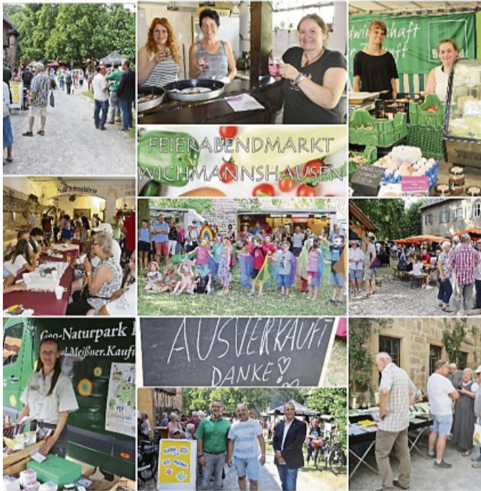
Immer einen Besuch wert: Impressionen vom Feierabendmarkt in Wichmannshausen.

ne fröhliche und einladende Atmosphäre sorgen. Neben regionalen Angeboten, bietet die Walking-Gruppe Wichmannshausen leckeren Kuchen und der Museumsverein erfrischende Getränke im umgebauten Pferdestall an. Die Band Silver Lions Sontra wird ihr musikalisches Repertoire vorstellen und Musiker Jan Finkhäuser spielt auf dem Markt und in den Abendstunden im Pferdestall. Das klingt nach einem tollen Event, bei dem für jeden etwas dabei ist – sie sind herzlich eingeladen. Weitere Feierabendmarkt-Termine: 20. August, Netra, Untergasse/rund um das Rathaus, und 17. September, Reichenachsen, rund um das Rathaus