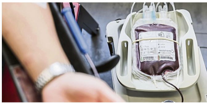
Blut spenden: Am 20. Juni ist der nächste Termin in Sontra.

Die Blutspende gehört zu den einfachsten und schnellsten guten Taten: Benötigt wird maximal eine Stunde Zeit,