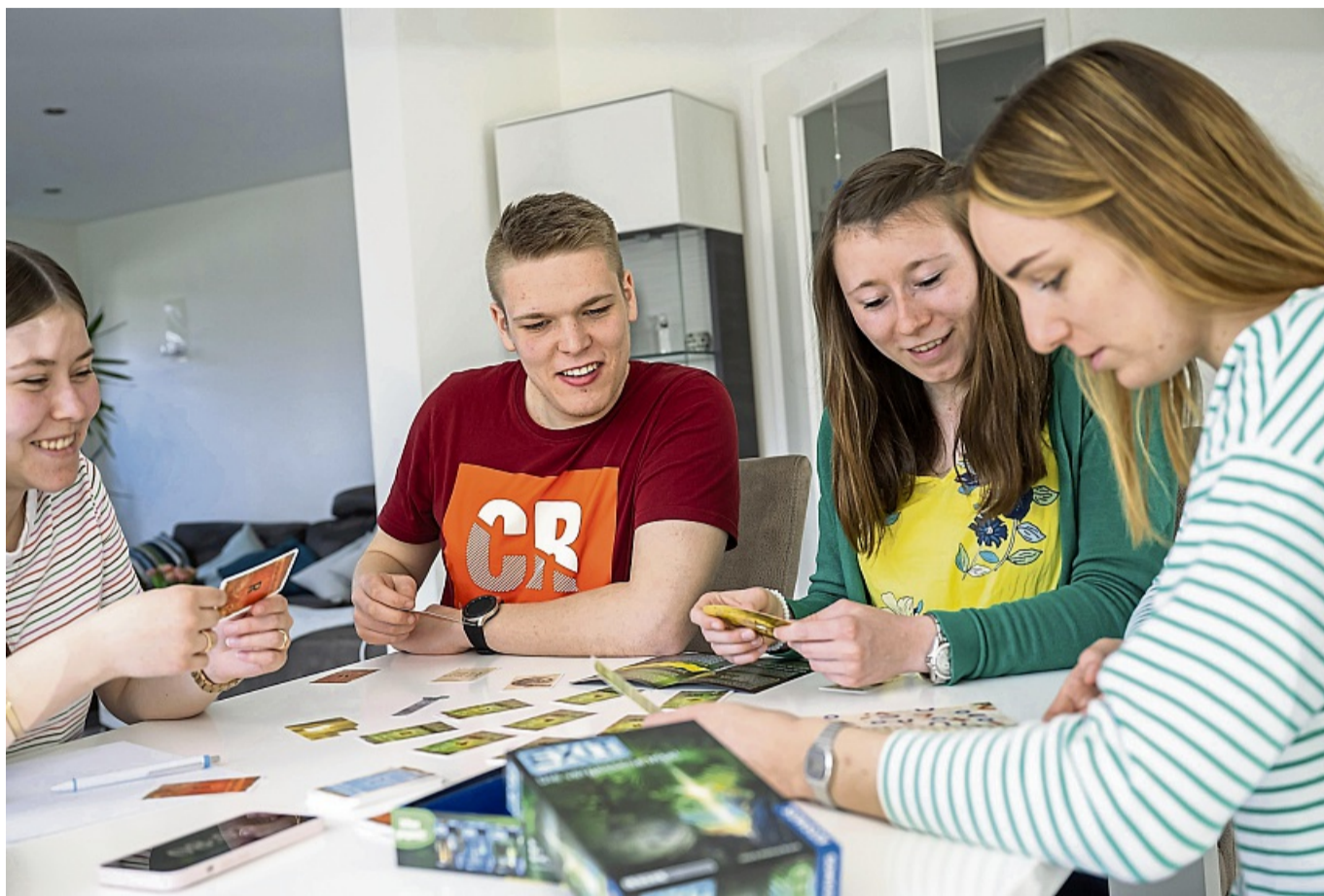
Einfach erklärt, schnell gespielt: Gerade einfache Spiele sorgen oft für den größten Spielspaß.

„Hitster“: Autor: Marcus Carleson/Team Jumbo, Jumbo,