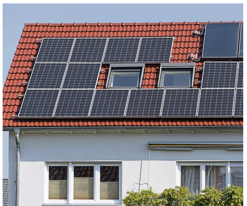
Wer optimal profitieren will, sollte vor der Installation der PV-Anlage darauf achten, in welche Himmelsrichtung das Dach ausgerichtet ist.

Allerdings könne der Speicher nichts daran ändern, dass PV-Anlagen im Sommer den meisten Strom produzieren, während der Wärmebedarf im Winter am höchsten ist, gibt Brandis zu bedenken. „Batteriespeicher können heute nur den Solarstrom vom Tag für den Bedarf am Abend und in