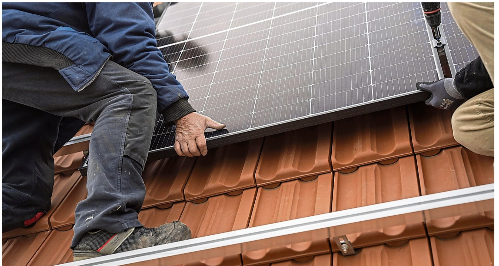
Alles auf einer Fläche: Die einzelnen Module der PV-Anlage sollten eng nebeneinander montiert werden.

Entscheidend für den Ertrag ist unter anderem die Ausrichtung und Lage des Daches. „Das Dach sollte möglichst Schat-