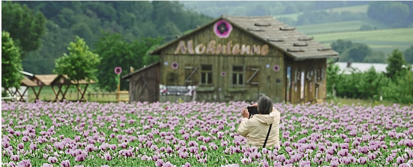
Eine der ersten Besucherinnen fotografiert die bereits blühenden Mohnblüten der Sorte Viola: Die Blüte der pinkfarbenen Mohnblumen wird noch erwartet.

schiedene Veranstaltungen angeboten. Darunter etwa Genuss-Wanderungen, Whiskey-Wanderungen, Comedy mit Lilli, Walking Acts und vielem mehr. Der Klick auf die Seite mohnbluetefrauholle.land lohnt sich, denn hier gibt es eine ausführliche Programmübersicht sowie aktuelle Informationen und Prognosen zur Mohnblüte 2025.