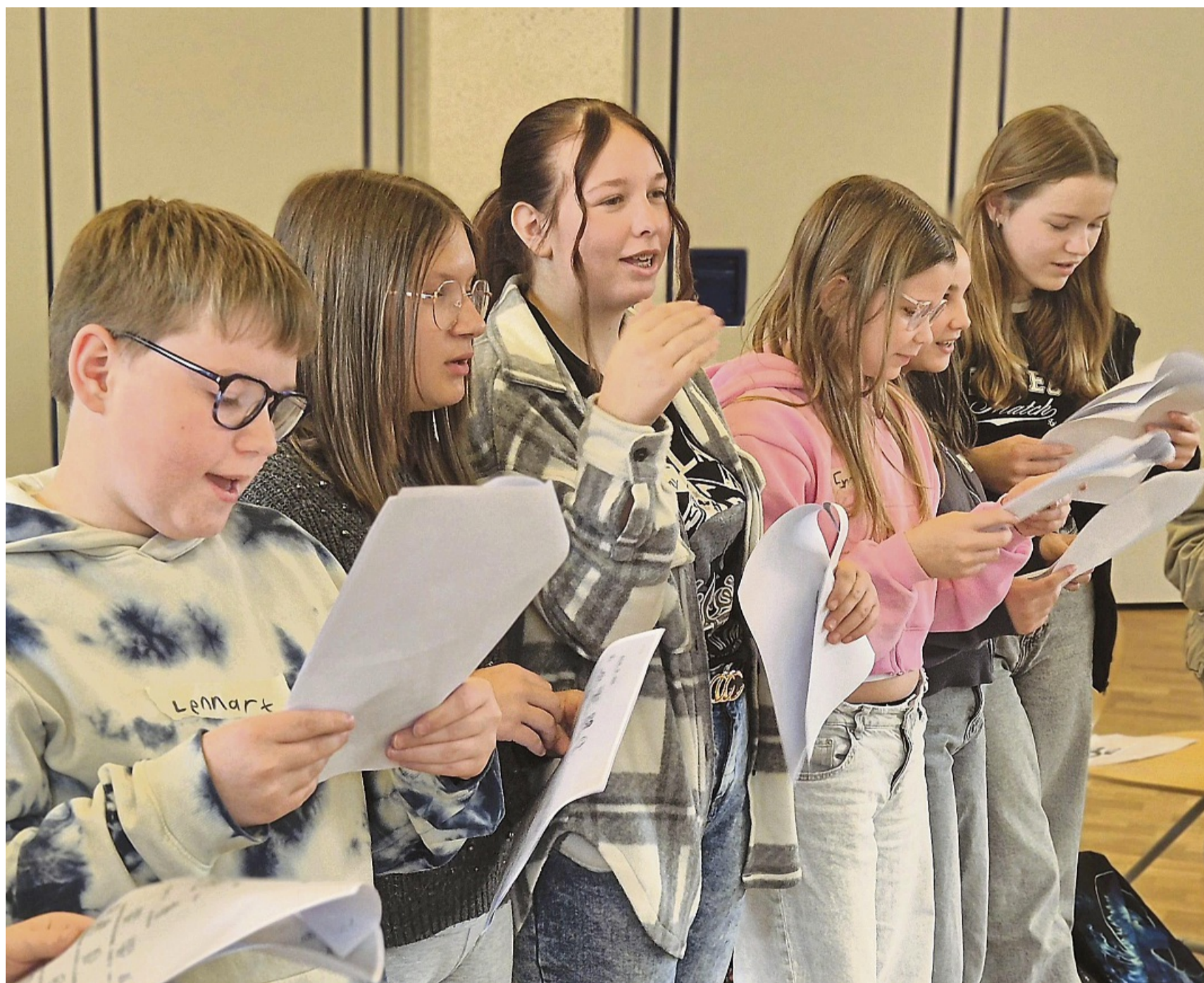
Gänsehaut-Erlebnis: Die Brüder-Grimm-Schüler gebärden und singen das Schullied der Paul-Moor-Schule – Unterstützung gab ein „Spickzettel“ mit den Gebärden.