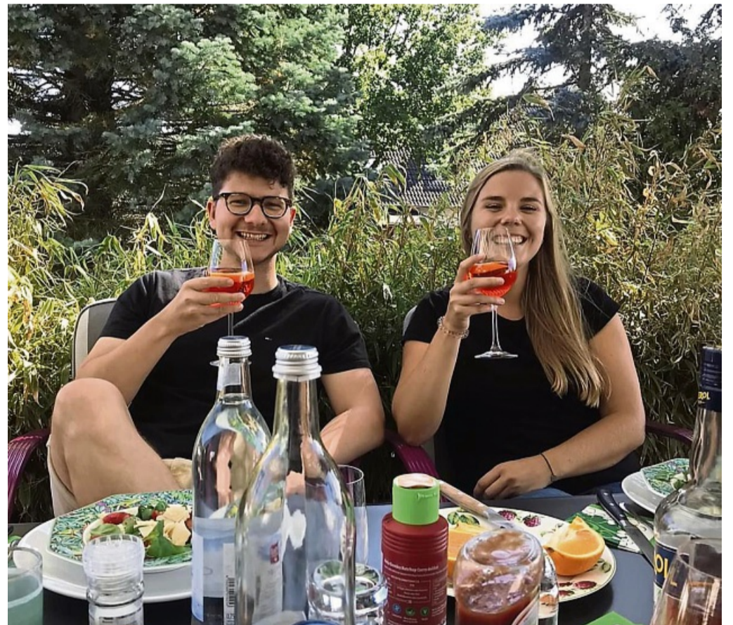
Netter Grillabend: Das Grillen auf der Terrasse oder im eigenen Garten mit gemütlichem Beisammensein mit der Familie ist höchst beliebt.