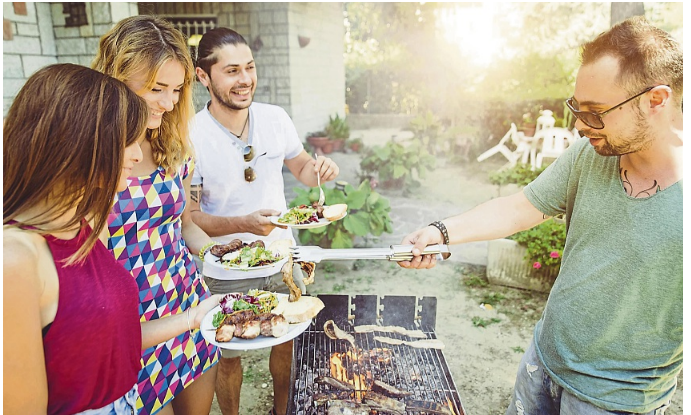
Das Grillen mit Freunden gehört zum Sommer einfach dazu.

Zeit für Grillpartys und gemeinsame Zeit zu verbringen