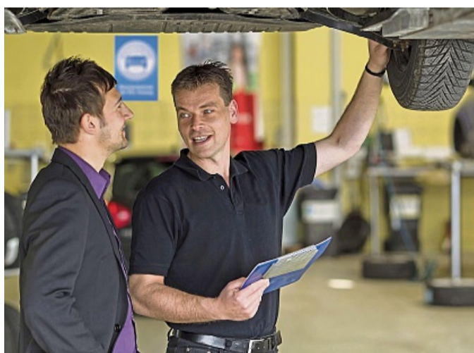
Wer mit einem älteren Fahrzeug in den Urlaub fahren möchte, tut gut daran vor der Abfahrt noch einmal in der Werkstatt vorbeizuschauen.

xier des Triebwerks sollte auf Maximum aufgefüllt werden. Aber nicht darüber, das ist genau so schädlich wie zu wenig Öl. Liegt der letzte Ölwechsel schon lange zurück oder ist bald fällig, besser noch vor der