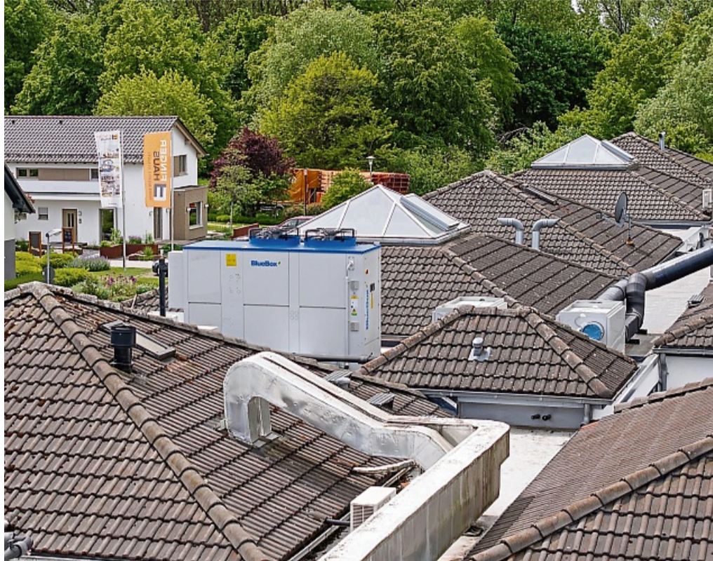
Zwei neue Wärmepumpen und eine leistungsstarke Lüftungsanlage wurden bei Finger-Haus in Frankenberg installiert.

In einem weiteren Verwaltungsgebäude wurden drei ältere Wärmepumpen durch zwei moderne Geräte ersetzt. Die neuen Systeme arbeiten mit einem natürlichen Kältemittel und profitieren von idealen Betriebsbedingungen dank vorhandener Fußbodenheizung und moderner Lüftungstechnik. Die rund 1200 Quadratmeter große Fläche werde nun noch effizienter beheizt und gekühlt. Erste Berechnungen lassen eine Ein-