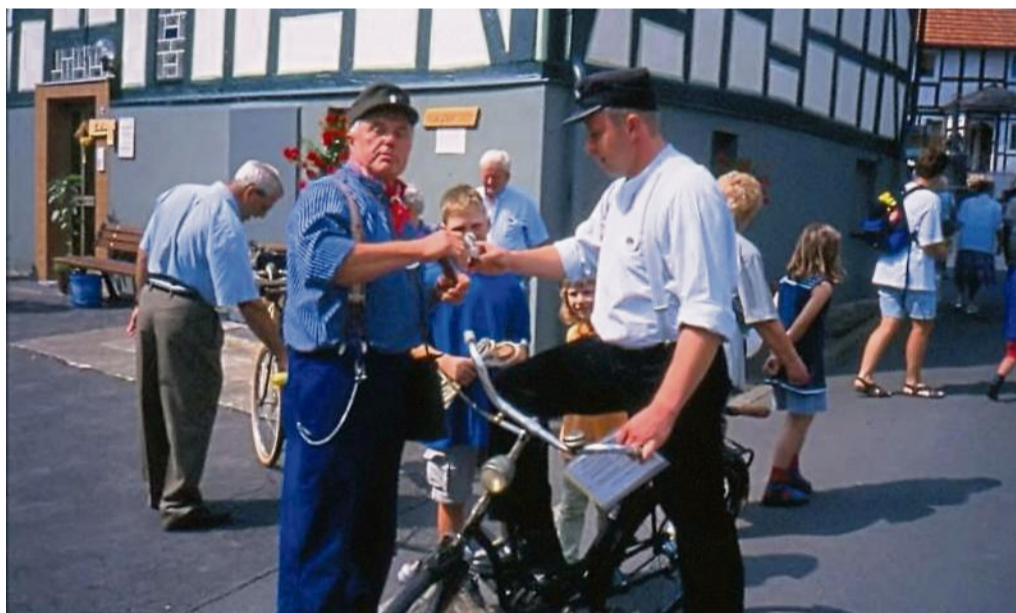
Fand schon vor 25 Jahren statt: Das Jubiläum in Viermünden

Der heutige staatlich anerkannte Erholungsort Viermünden liegt etwa sechs Kilometer nördlich der Kernstadt Frankenberg. Viermünden hat rund 800 Einwohner. Unter dem Namen „Fiormenni“ wurde das Dorf erstmals im Jahr 850 in einer Urkunde des Klosters Fulda. Die Petri-Kirche ist eine der ältesten Hallenkirchen in Hessen. Vermutlich entstand der massive Unterbau der Kirche bereits in der Zeit der Frühromanik, das heißt im 9. oder 10. Jahrhundert. Unter der Kirche