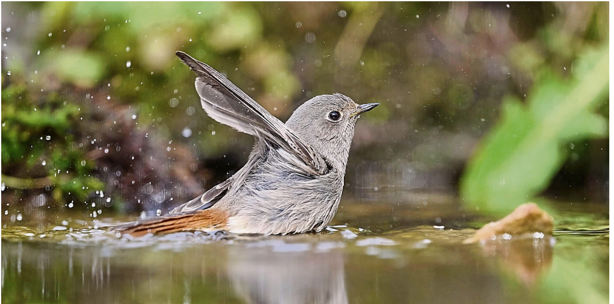
Der Hausrotschwanz ist der Vogel des Jahres. Im Landkreis Waldeck-Frankenberg wurden bei der diesjährigen Zählung 81 Exemplare gesichtet.

Ergebnisse zur „Stunde der Gartenvögel“: Population in Deutschland geht weiter zurück