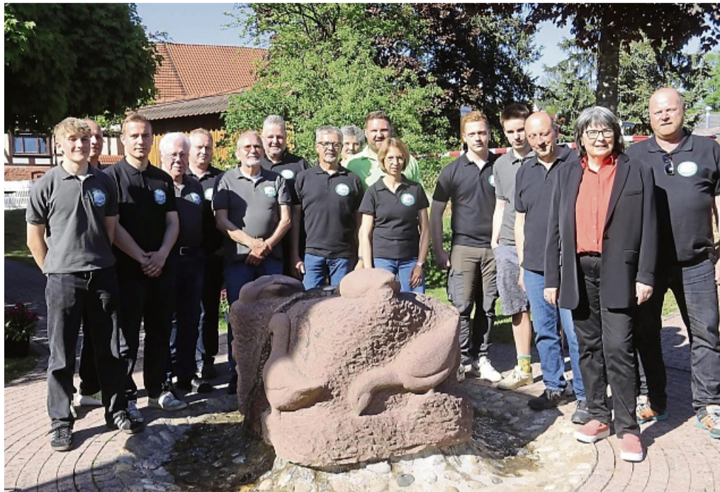
Festausschuss: Bei der Einweihung des neuen Ständebaums im Mai war auch der Festausschuss vollzählig dabei.

Die 1175-Jahr-Feier ist für Schreufa ein bedeutendes Ereignis - dabei sollen insbesondere die lange Geschichte und auch die kulturelle Identität des Ortes gefeiert werden. Schon in den vergangenen Monaten hatte der heutige Frankenberg Stadtteil mit etlichen Veranstaltungen auf sein Jubiläum aufmerksam gemacht - unter anderem mit einem gemeinsamen Bruch der Dorfbewohner im Haus des Gastes, mit Aufführungen der Theatergruppe an mehreren Abenden und auch mit der Einweihung des neuen Ständebaums. Schreufa kann auf eine beeindruckende Vergangenheit zurückblicken, die bis ins Jahr 850 reicht, als der Ort erstmals urkundlich erwähnt wurde.