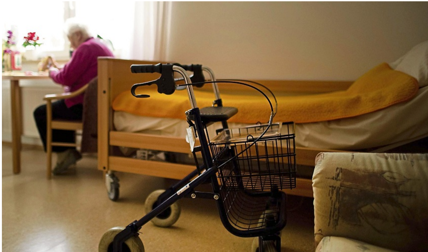
Struktur gibt Sicherheit: Ein geregelter Tagesrhythmus hilft besonders bei Demenz und kann das Einschlafen erleichtern.

Weil es sich mit kalten Füßen schlecht schläft, kann zudem ein warmes Fußbad vor dem Zubettgehen ein wohltuendes