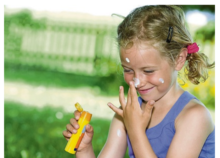
Gerade bei Sonnenschein gilt: Eincremen nicht vergessen.

Wenn einem die Sonne dann doch einmal zu sehr auf den Kopf geschienen ist, ruhig mal eine Pause machen. Am besten im eigenen Bett. In den Fachgeschäften gibt es eine große Auswahl an Bettgestellen, die man sogar nach allen Wünschen konfigurieren kann.