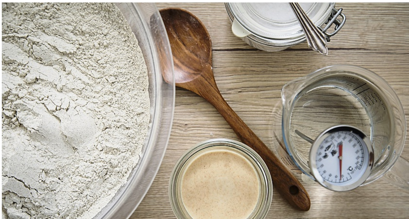
Die Zutaten fürs Sauerteigbrot bestehen eigentlich nur aus Mehl und Wasser. Falls vorhanden, kommt auch Sauerteigansatz (Anstellgut) und je nach Rezept etwas Salz und Hefe hinzu.