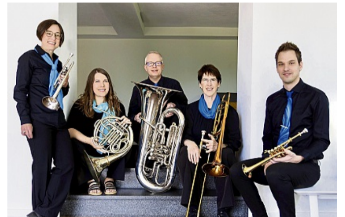
Kommt am 14. Juni nach Hatzfeld: „Eurobrass- das Quintett“ unter der Leitung von Angie Hunter.