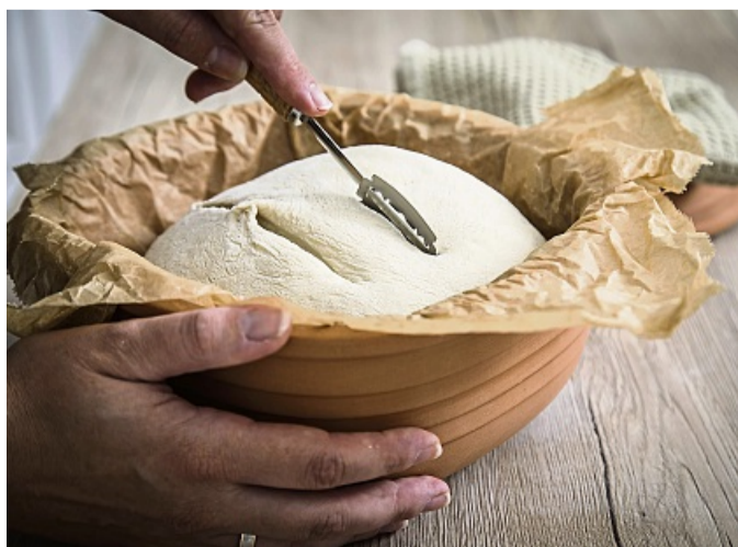
Sauerteig für Weizenbrot kann im Römertopf gebacken werden und wird vor dem Backen eingeschnitten.

Übrigens: Eingefroren wird Sauerteig laut Sonja Bauer besser nicht. Für eine längere Pause, etwa während eines Urlaubs, füttert man das Anstellgut einfach mit mehr Mehl, sodass es fester ist. Eine Stunde abwarten und ihn dann möglichst kalt stellen. „Zum Beispiel im Kühlschrank ganz hinten auf der Glasplatte.“ Dann kann es nach dem Urlaub wieder losgehen. tmn