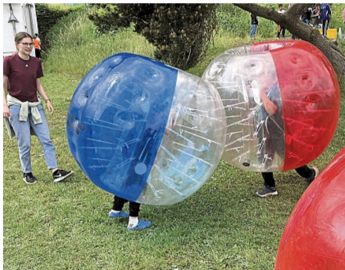
Rund, bunt, lustig: Beim Spiel mit dem Bumper-Ball tut sich keiner weh.