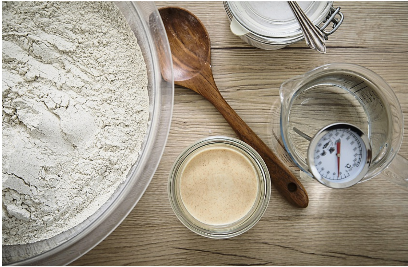
Die Zutaten fürs Sauerteigbrot bestehen eigentlich nur aus Mehl und Wasser. Falls vorhanden, kommt auch Sauerteigansatz (Anstellgut) und je nach Rezept etwas Salz und Hefe hinzu.