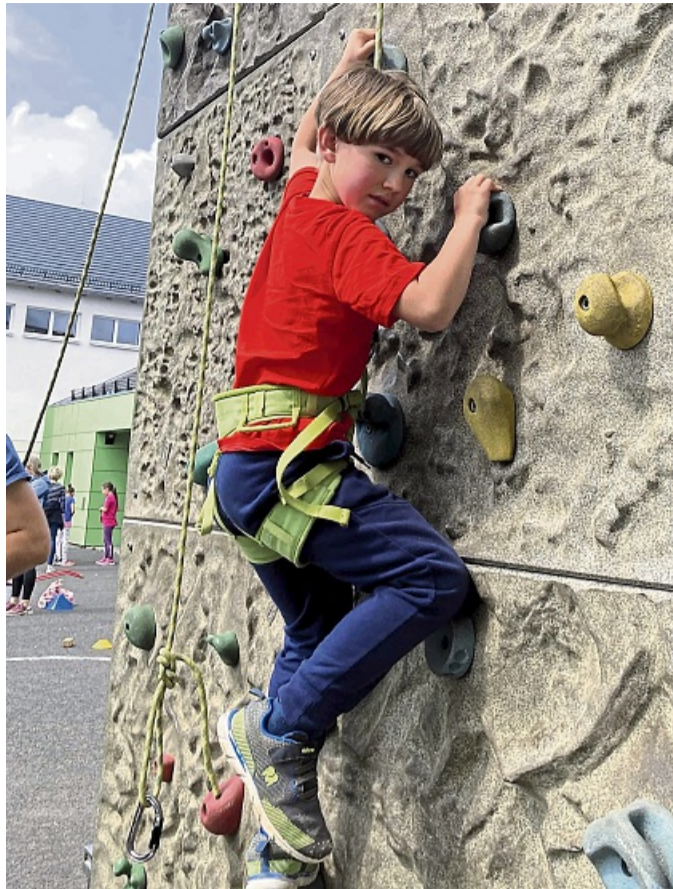
Erfordert Mut: die Kletterwand.