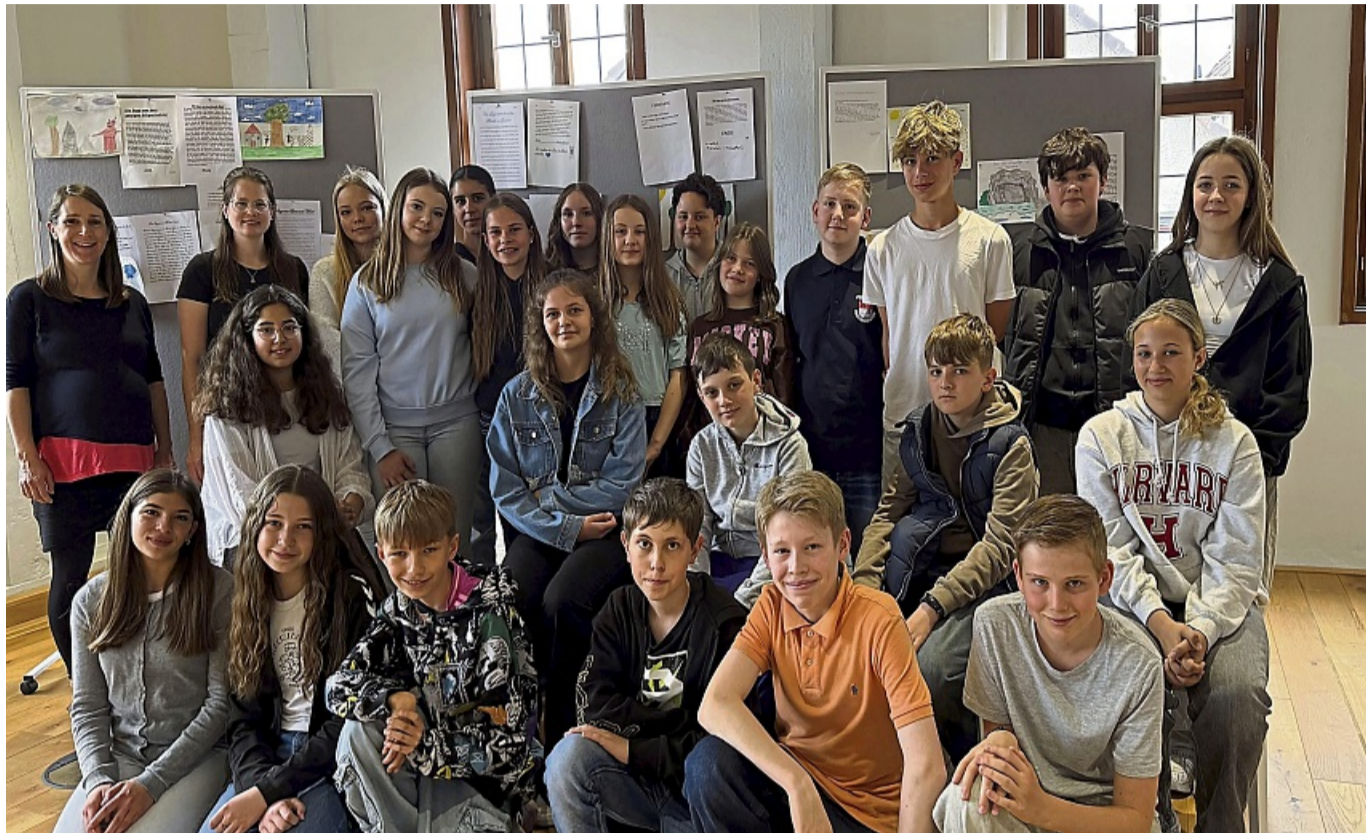
Junge Autoren: Die Schüler der 6. Klasse der Ursulinenschule in Fritzlar haben eigene Geschichten verfasst und stellen sie im Museum Hochzeitshaus aus.