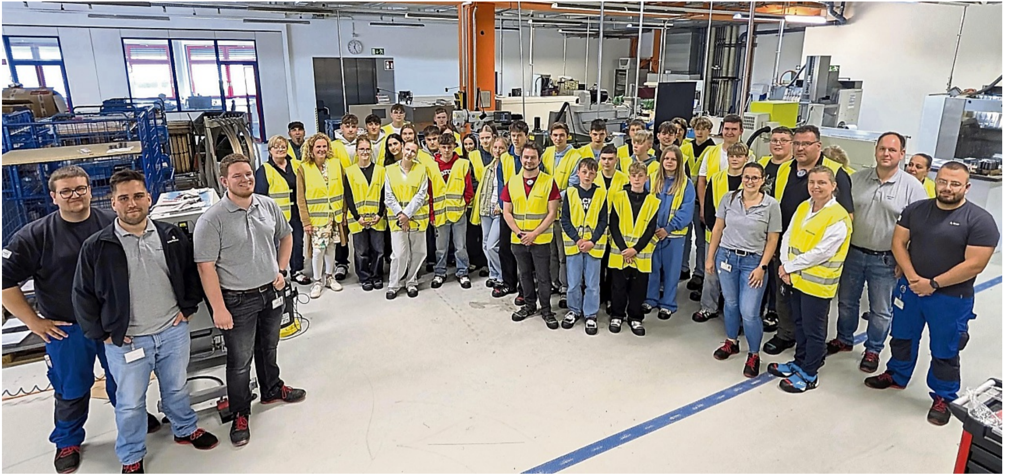
Rundgang durch die Fertigungshalle: Azubis standen Schülern in der Spangenberg Sägefabrik Wikus Rede und Antwort.