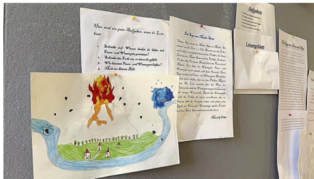
Sagenhafte Ausstellung: Die Sagen der Schüler der Ursulinenschule werden im Hochzeitshaus ausgestellt.