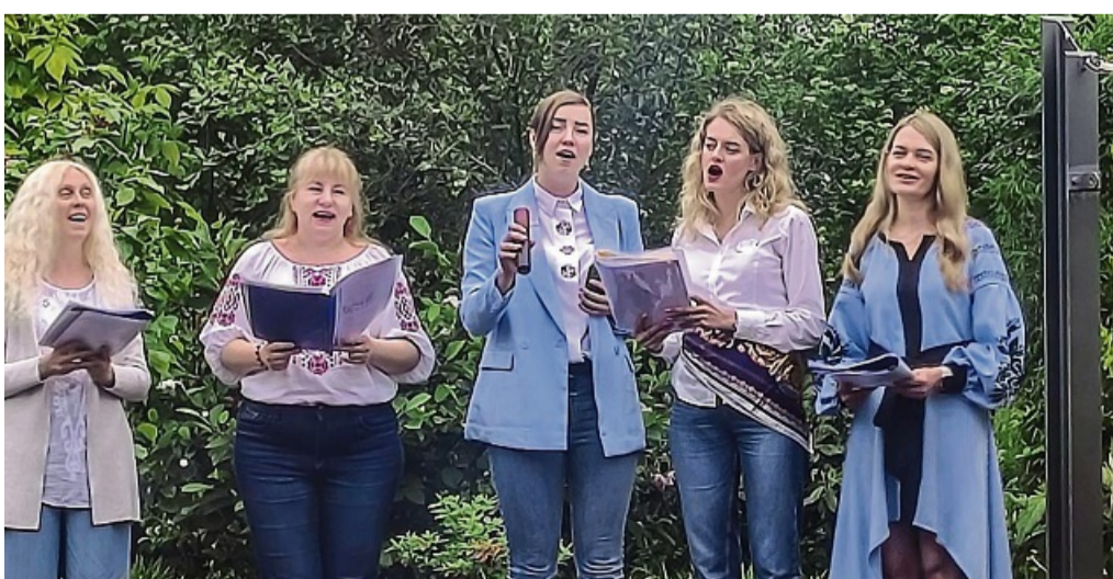
Felsberg Spendengala für den Mädchentreff der ukrainische Frauenchor „Dzherelo“, auf deutsch „Quelle“. Die Frauen singen neben klassischen und volkstümlichen Liedern aus der Ukraine Lieder in deutscher und englischer Sprache

Das Konzert von Niklas Vaupel werde zeitnah nachgeholt, da der Hauptakt wegen der schlechten Wetterprognose abgesagt wurde. Besucher der Veranstaltung kamen sogar aus Hannover und genossen das Angebot bei bester Stimmung, teilt Döll mit.