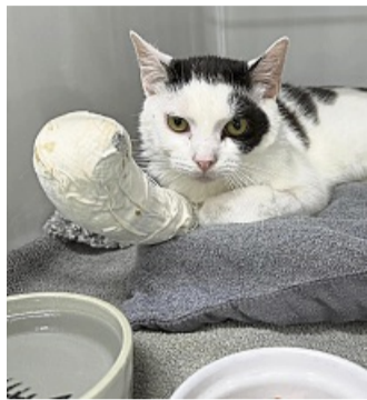
Auf dem Weg der Besserung: Kater Willi wurde durch einen Biss schlimm an der Pfote verletzt.

Immer mehr Fund- oder Abgabtiere erreichten das Tierheim in einem sehr schlechten körperlichen Zustand. Dadurch entstanden dem Tierheim hohe Tierarztkosten. „Bei Willi werden es am Ende 2500 bis 3000 Euro sein“, sagt Pomplum. Im Durchschnitt könne