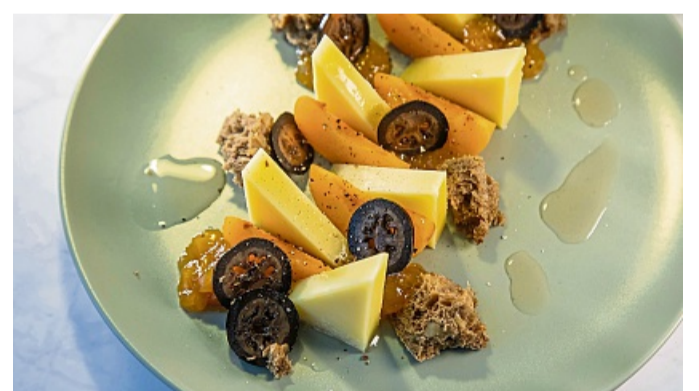
Eine leckere Kombi: Dünne Scheibchen der schwarzen Walnüsse verfeinern den Bergkäse mit frischen Aprikosen, Aprikosenmarmelade und Walnussbrot. (zu dpa: «Schwarze Walnüsse: Für die Delikatesse zählt Ernte-Timing»)