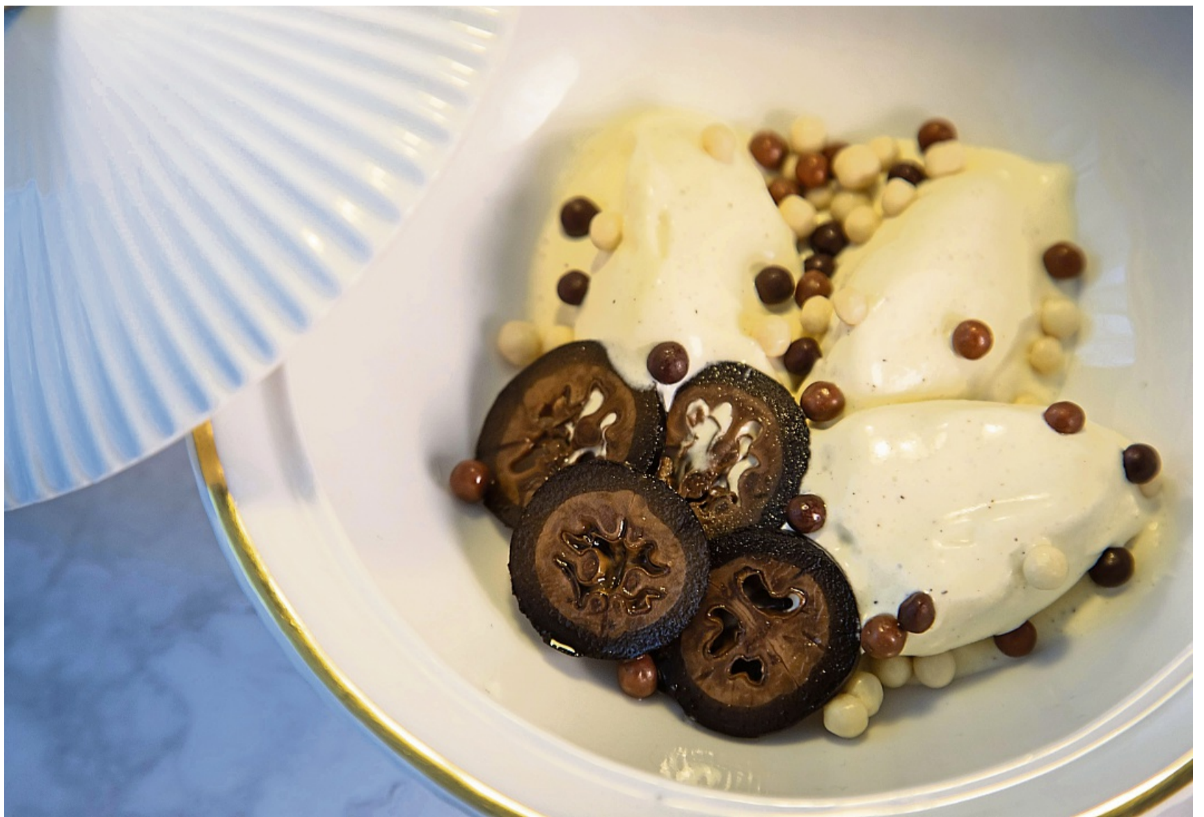
Schwarze Walnüsse in feine Scheiben geschnitten geben dem Vanilleeis mit Schokoladenkugeln einen Extra-Kick.

Die eingestochenen Walnüsse gibt man dann in einen großen Topf und übergießt sie mit reichlich kaltem Wasser. „Sie sollten darin schwimmen können“, so Braun. Das Wasser färbt sich nach Beobachtung von Johannes Geng dann grün-