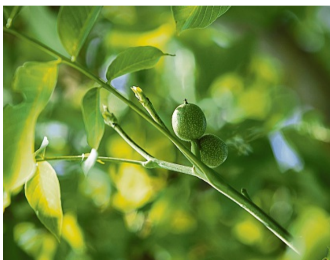
Die grünen Walnüsse am Baum sind zwar noch nicht ausge-reift. Aber wenn man sie bis zum Johannistag erntet und ihnen mit einer Wasser- und Einmach-Prozedur die Bitterstoffe entzieht, werden sie zur Delikatesse. (zu dpa: «Schwarze Walnüsse: Für die Delikatesse zählt Ernte-Timing»)

lich-braun und wird zweimal täglich weggeschüttet. Dann begießt man die Walnüsse wieder mit reichlich kaltem Wasser.