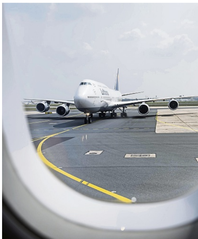
Mulmiges Gefühl bei Start oder Landung: Bis zu 25 Prozent der Menschen empfinden Unwohlsein oder Angst vor dem Fliegen.

„Im Zentrum steht jedoch die Konfrontation mit der angstauslösenden Situation“, so Wortelboer. Diese erfolgt in der Regel schrittweise, von angstauslösenden Gedanken über Bilder bis zu Orten oder Situationen, die mit dem Fliegen