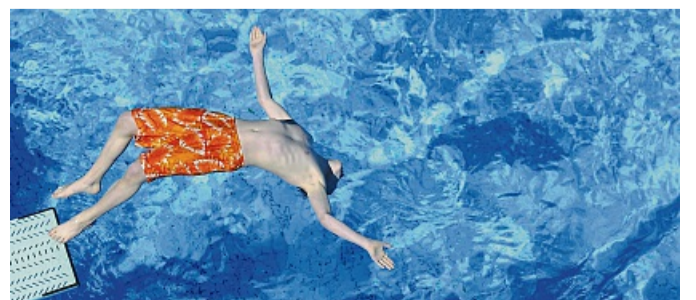
Chlor und Sonnencreme: Damit die Badehose lange strahlt, kommt es auf die richtige Pflege an.

Ob am Strand, im Freibad oder am Badesee: Im Sommer sorgt der Sprung ins Wasser oft für die nötige Abkühlung. Damit Bikini, Badehose und Co. möglichst lange ihre Form und Farbe behalten, kommt es auf die richtige Pflege an. Und so geht's. Der Industrieverband Körperpflege- und Waschmittel (IKW) rät, Badesachen direkt nach dem Tragen gründlich mit kaltem, klarem Wasser auszuwaschen. So lassen sich Rückstände von Chlor, Salz oder Sonnencreme entfernen. Für eine intensivere Reinigung eignet sich ein Bad in kaltem Wasser mit etwas Fein- oder Farbwaschmittel. Die Kleidung kann entweder kurz durchgeknetet oder etwa 15 Minuten eingeweicht werden. Anschließend nochmals gründlich mit kaltem, klarem Wasser ausspülen. Wichtig beim Trocknen: die nasse Badebekleidung nicht in der prallen Sonne aufzuhängen – dort können die Farben ausbleichen. Ein schattiger, luftiger Platz eignet sich ideal. Wer lieber die Waschmaschine nutzt, sollte die Badesachen auf links drehen und – besonders bei Modellen mit Bügeln oder Cups – ein Wäschenetz verwenden. Da die Badetextilien bei zu hoher Schleuderdrehzahl ihre Form verlieren können, empfiehlt der IKW sie im Schonwaschgang bei maximal 30 Grad und einer maximalen Schleuderdrehzahl von 600 Umdrehungen pro Minute zu waschen. Auch nach der Maschinenwäsche gilt: Zum Trocknen aufhängen und direkte Sonne meiden, damit Farben und Form erhalten bleiben.