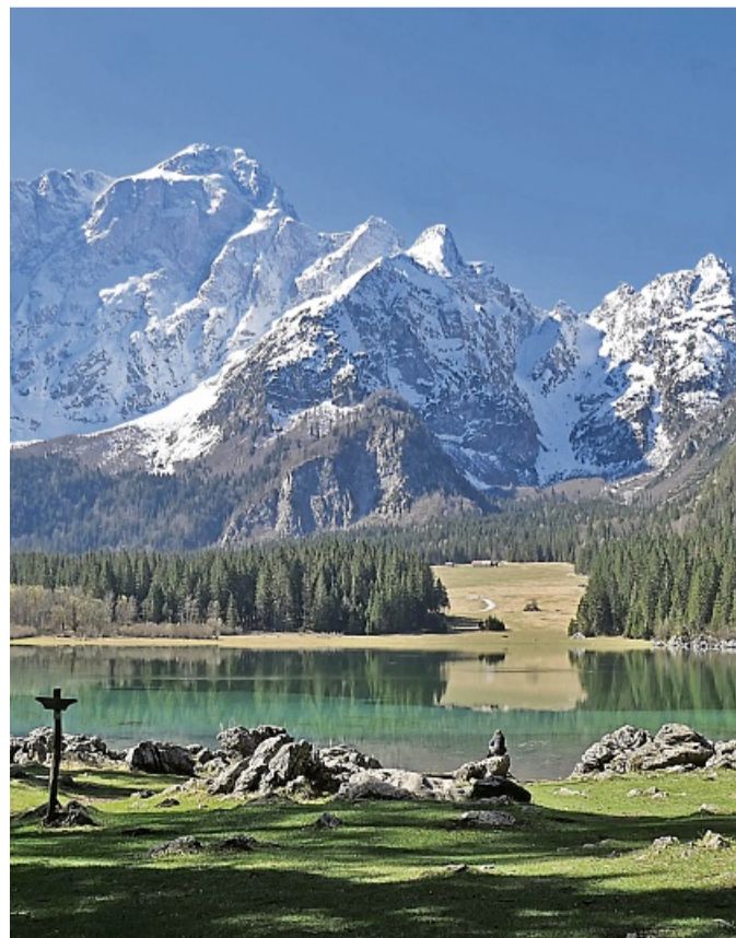
Laghi di Fusine am Dreiländereck Italien-Österreich-Slowenien mit Blick auf den Grenzgipfel I/SLO. Auch hier soll der Wanderweg entlang führen.