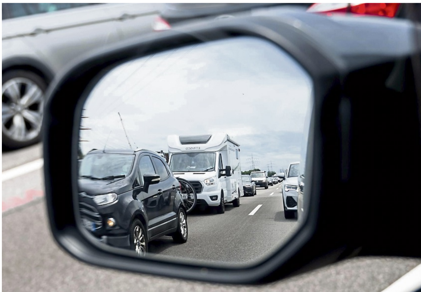
Warum rollt es links und bei mir nicht? Autofahrer sitzen im Stau oft einer getrübbten Wahrnehmung auf.