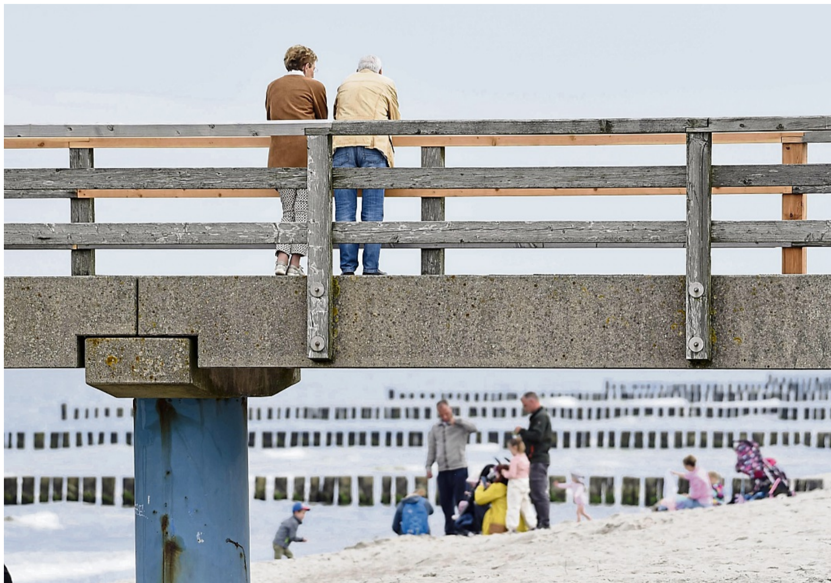
Den Ruhestand genießen: Mit dem Rentenbescheid und der ersten Zahlung beginnt der neue Lebensabschnitt.

Parallel machen potenzielle Ruheändler Kassensturz. Welche Kosten sind da, welche fallen in Zukunft an? Was kommt demnächst rein? Auf der Habenseite können neben der Rente Sparguthaben, Lebensversicherungen und Ries-