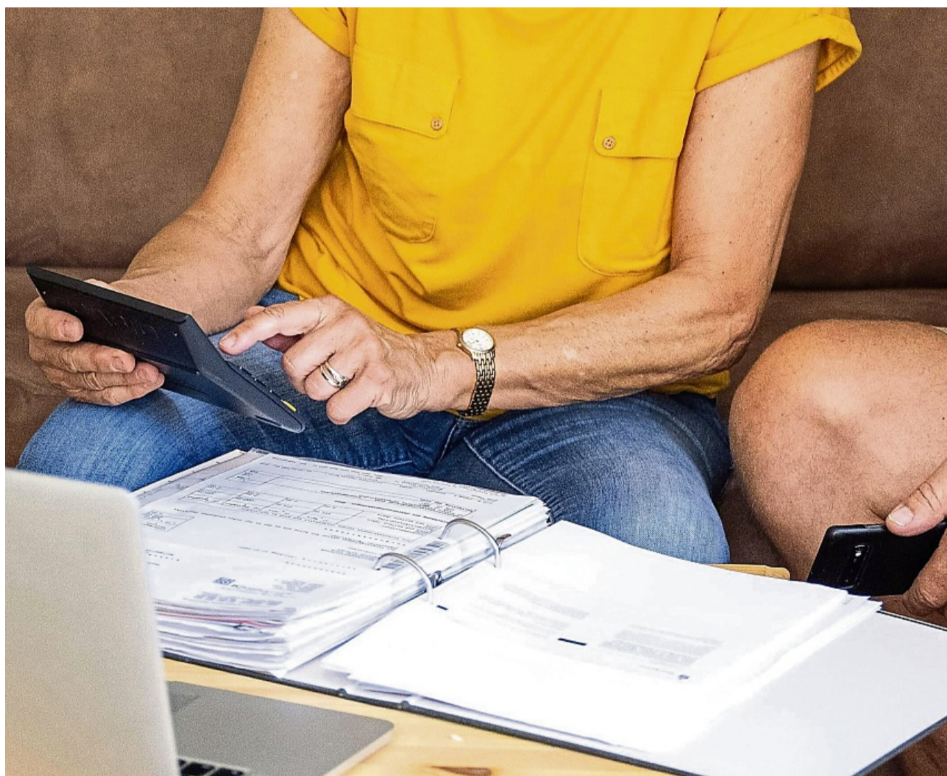
Rentenkonto klären: Der erste Schritt zur Rente ist die Überprüfung der eigenen Rentenansprüche und Zeiten.

Verbraucherschützer Scherfling weist auf Modalitäten im Arbeitsvertrag hin. Dort könnten stehen, ob das Arbeitsverhältnis automatisch mit Rentenbeginn endet oder der Ar-