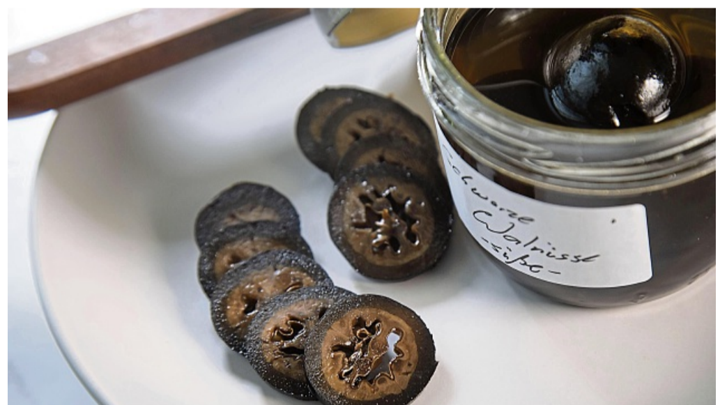
Frühstens an Weihnachten werden die in Gewürzsirup eingelegten schwarzen Walnüsse aufgeschnitten und werden als feines Topping für Eis oder Käse genutzt. (zu dpa: «Eingelegte schwarze Walnüsse: So geht's»)

Bei Braun bleiben die Gläser so bis Weihnachten stehen - an einem dunklen und kühlen Ort, wo die Früchte nachreifen können. „Sie werden in dem Sud immer besser, je älter sie sind. Auch die Gewürzmischung wird immer runder. Das harmonisiert sich weiter wie bei einem Likör“,