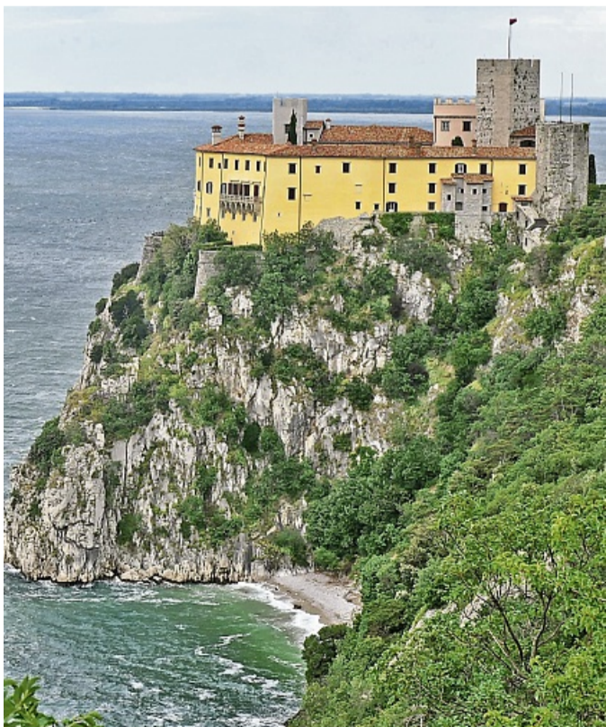
Das Schloss Duino an der italienischen Steilküste bei Triest. Dort war Rainer Maria Rilke öfters bei den Thurn und Taxis zu Gast und hat seine Gedichte vorgetragen. Vom Schloss bis zu der durch den Karst verlaufenden slowenischen Grenze sind es nur drei Kilometer.