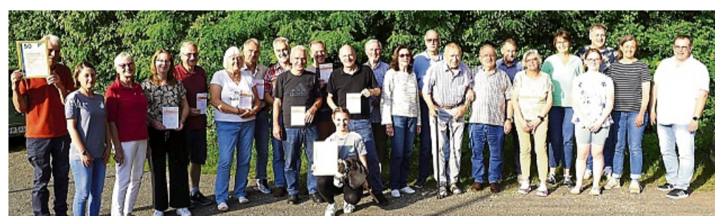
Gute Nachrichten beim TSV Altmorschen: Der Verein verzeichnet Zuwachs bei den Mitgliederzahlen. Das Gruppenbild zeigt den Vorstand zusammen mit allen Geehrten.