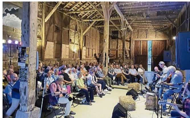
Scheunenkonzert mit Shiregreen.

ren die aktuelle Shiregreen-Single „Time Is Running Out“, ein Aufschrei gegen die Gleichgültigkeit gegenüber Krieg und rechter Hetze, und der Cohen-Klassiker „Halleluja“, heißt es weiter. Zum Ende hin ließ die souverän aufspielende Band auch mal rockige Momente einfließen. So gab es schon zum Ende des zweiten Sets stehende Ovationen und das Publikum forderte und bekam vier Zugaben.