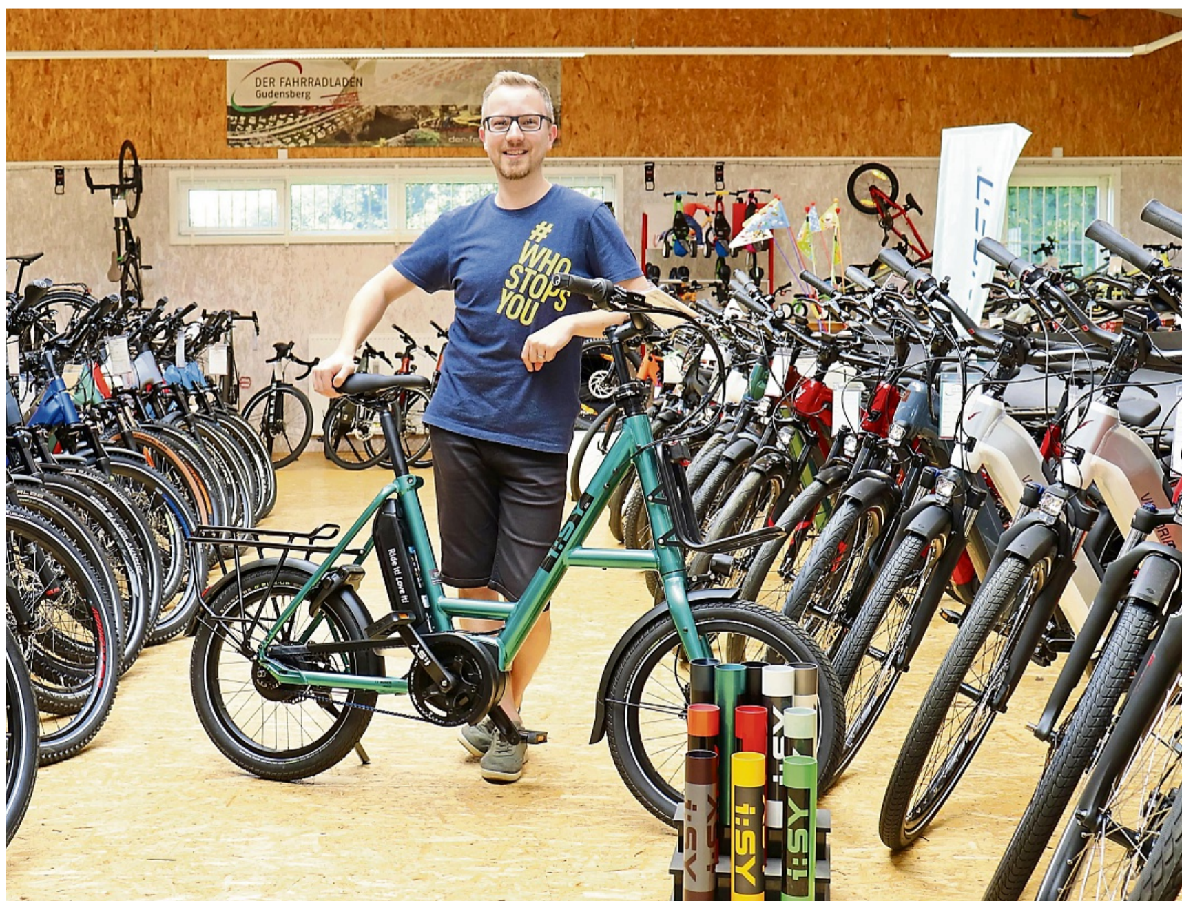
Kompakte Größe, tolle Ausstattung: Die E-Bikes von i:SY gibt es im Fahrradladen Gudensberg in vielen Farben.