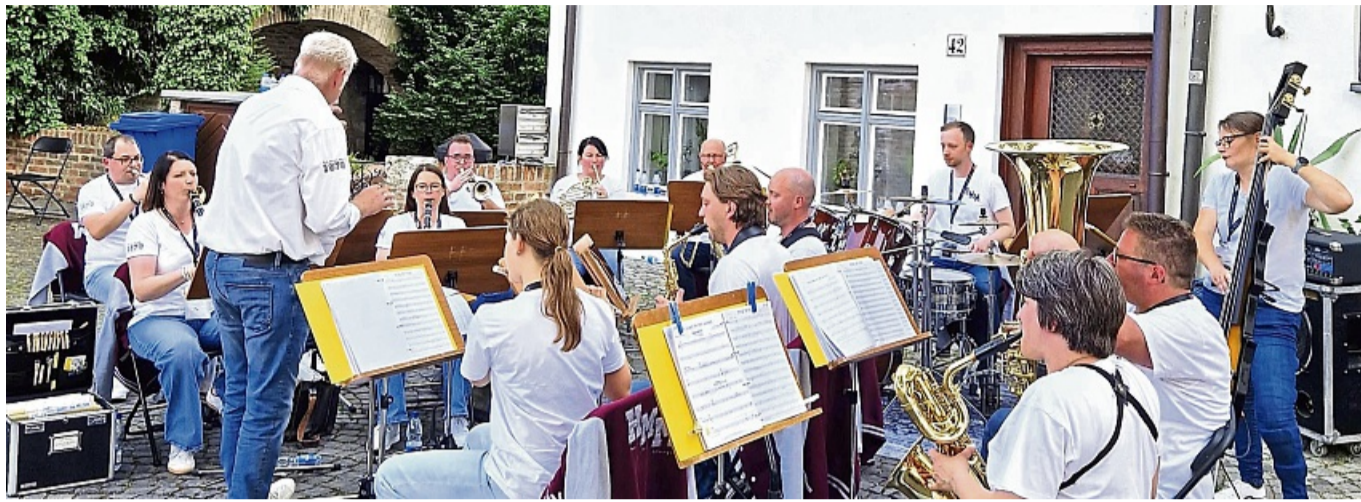
Melsungen / Harmonie Musik / Teilnahme am Deutschen Musikfest in Ulm und Neu-Ulm / Foto: HarmonieMusik Melsungen e.V. AGENTUR kes

Neben zwei Platzkonzerten hat das Orchester eine öffentliche Probe in ihrer Unterkunft gegeben. Im Gasthaus Rössle konnten sich die Besucher vom