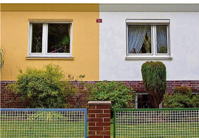
Aus eins mach zwei: Wer vorausschauend baut, kann sein Haus später leichter teilen und etwa zur Miete anbieten.

Einfamilienhäuser sind oft zu starr gedacht. In der Regel sind sie für eine vierköpfige Familie ausgelegt. Sind die Kinder dann aus dem Haus und der Partner nicht mehr da, kann das Einfamilienhaus für viele Menschen zu groß und zu teuer werden, schreibt der Verband Privater Bauherren (VPB). Hilfreich ist es, wenn Bauherren frühzeitig im Planungsprozess an familiäre Veränderungen denken. Sie sollten das Haus also vorausschauend bauen. Dann können Bauherren im Ernstfall besser reagieren und auch mit weniger Budget im Alter länger im vertrauten Umfeld bleiben. Das ist wichtig, zumal für viele Leute das eigene Haus auch eine Säule der Altersversorgung ist. Eine Option ist da laut VPB etwa ein teilbarer Grundriss. Wer bereits bei der Planung die Immobilie als Zweifamilienhaus mitdenkt, kann es später schnell und kostengünstig teilen. Die zweite Haushälfte kann man dann im Bedarfsfall vermieten – falls es vor Ort rechtlich zulässig ist auch gewerblich. Wichtig ist dafür, dass Bauherren solche Optionen frühzeitig im Planungsprozess ansprechend und diese auch vertraglich vereinbart werden.