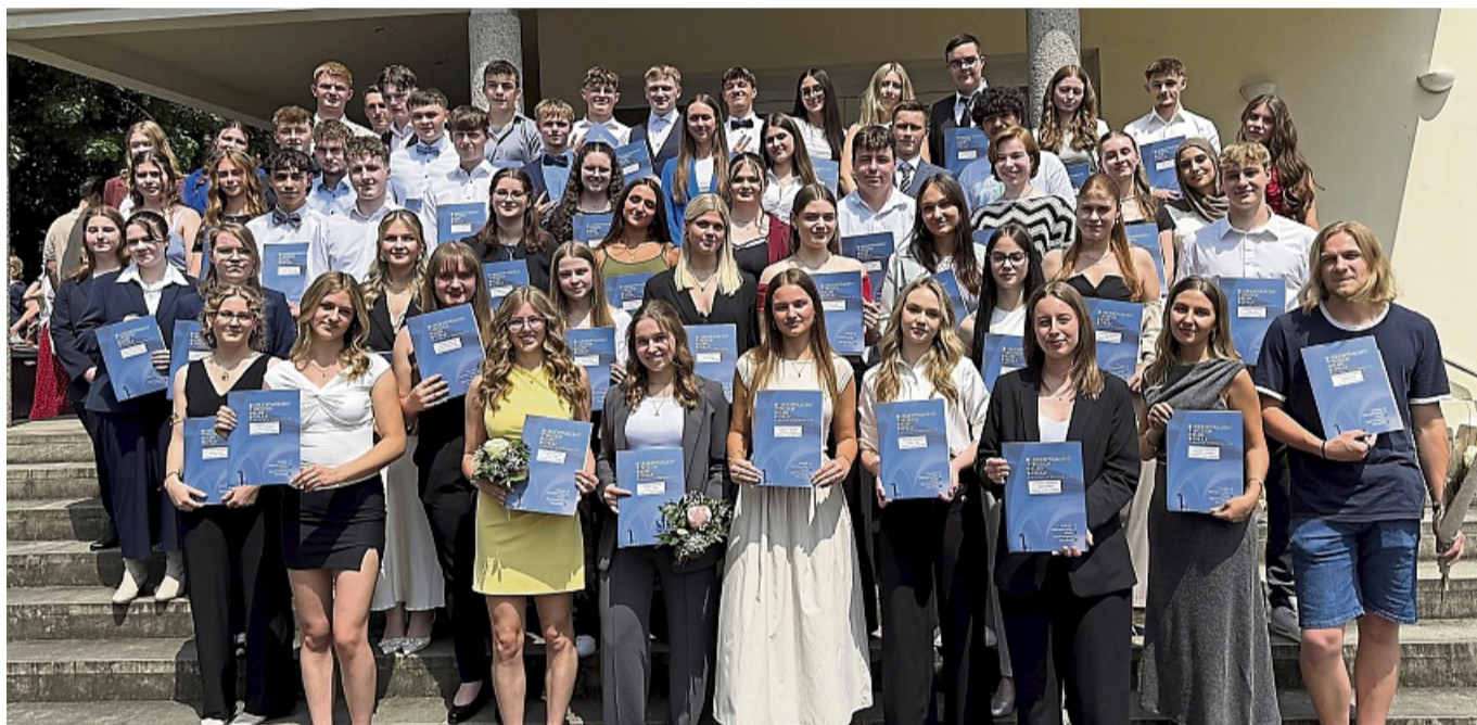
Ihre Leistungen wurden gefeiert: Die 56 Abiturientinnen und Abiturienten der Homberger Bundespräsident Theodor-Heuss-Schule vor der Stadthalle.