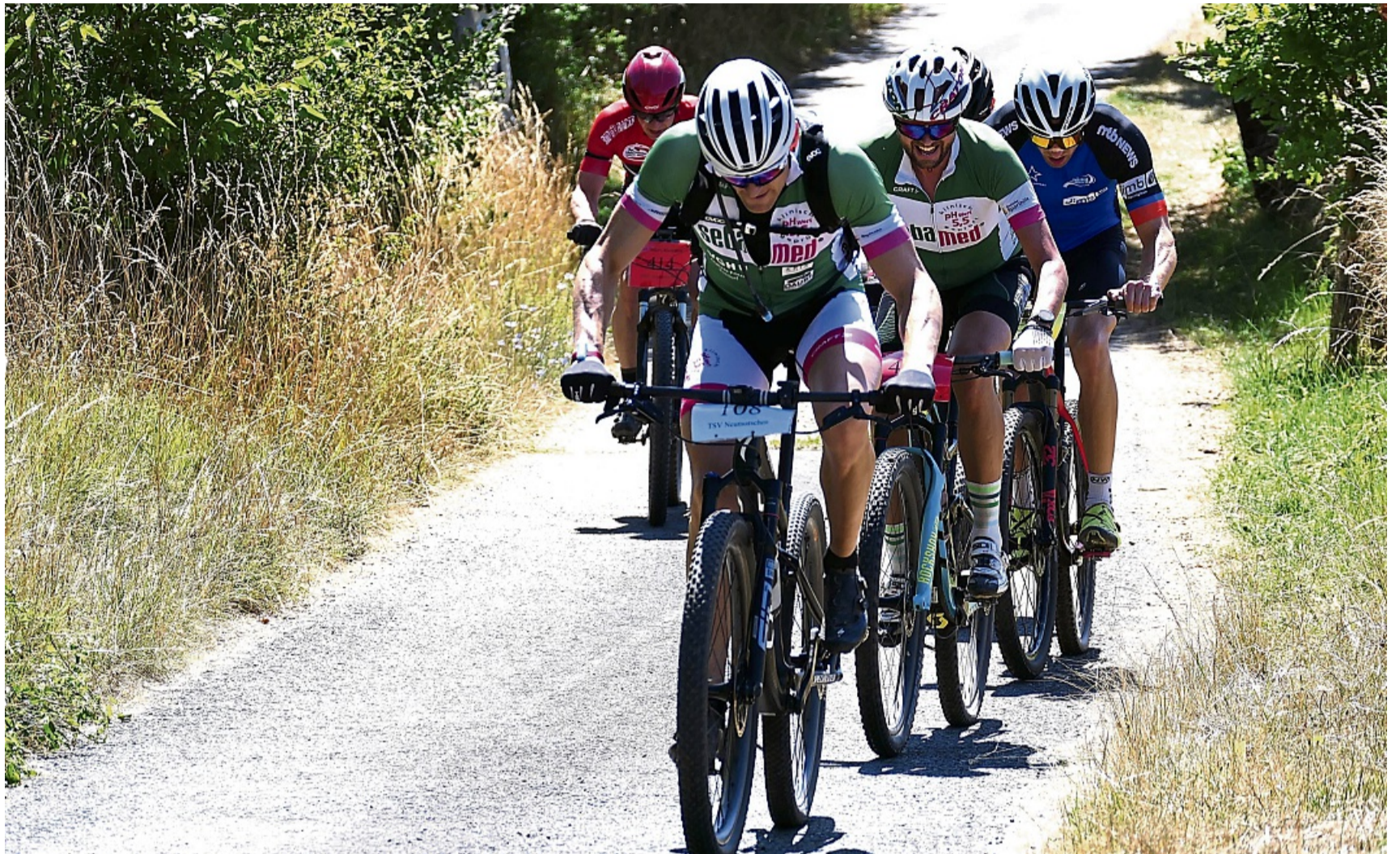
Die beliebteste Distanz war auch in diesem Jahr wieder die 44 Kilometer.

Die Strecke, die die Radler führen, führte von Neumorschen über die Katzenstim bis nach Spangenberg. Von dort aus ging es über einen steilen Anstieg in den Melsunger Stadtwald und über die Elbersdörfer Wand. Eine rasante Abfahrt entlang des Ars-Natura führte die Sportler schließlich nach Adelshausen, von da aus