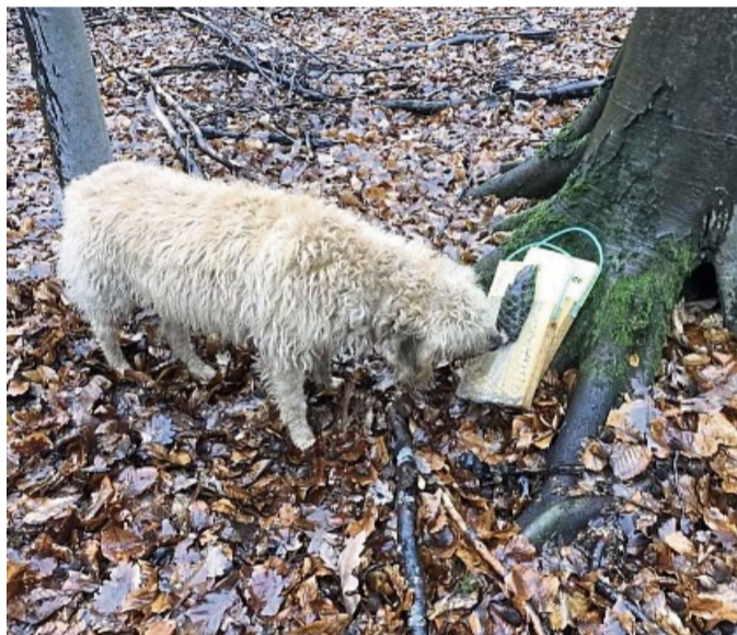
Kadaversuchhunde können eine große Hilfe bei der Eindämmung Afrikanischer Schweinepest sein.