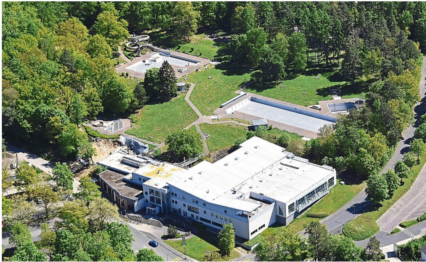
Tolle Anlage: Das Melsunger Waldschwimmbad ist ein Schmuckstück. Das Luftbild zeigt die Ausmaße, es entstand im Mai, da noch ohne Wasser.