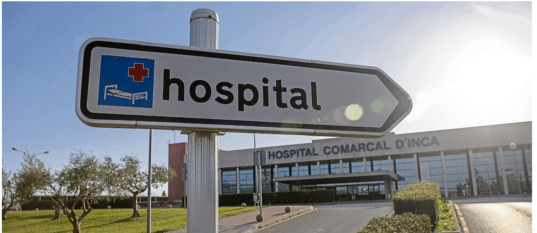
Krankenhausaufenthalte im Ausland können kostspielig werden. Eine Reisekrankenversicherung schützt vor hohen finanziellen Risiken.

Die Police sollte keine Krankheiten ausschließen und keine Erstattungsobergrenzen für Transporte und Behandlungen haben. Rücktransporte sollten schon übernommen werden, wenn sie medizinisch sinnvoll erscheinen und nicht nur bei „medizinischer Notwendigkeit“, so Finanztip. Das heißt: Bereits wenn die Behandlung