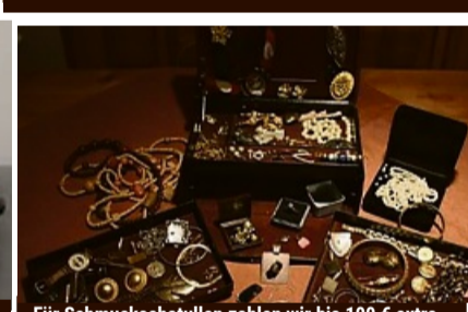
Für Schmuckschatullen zahlen wir bis 100 € extra - wir kaufen auch Modeschmuck