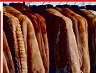
Wir zahlen für Pelze und Nerze bis zu 12.000 €**

Ankauf von: Goldschmuck, Armbänder, bevorzugt in breiter Form Ketten, Ringe, auch defekt, Zahngold, mit und ohne Zähne, Weißgold, Goldmünzen, Thaler, Medaillen, auch defekte, Münzen, Goldbarren, Nuggets, Schmelzgold, Platin, Schmuck, Münzen, Schmelzplatin, Paladium Modeschmuck, vergoldet defekte Uhren Wir kaufen auch größere Mengen von Nachlässen