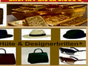
Hüte & Designerbrillen*