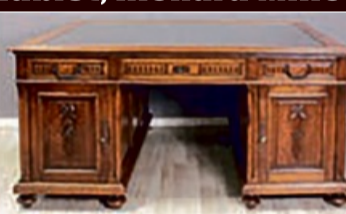
Antiquitäten aller Art