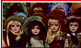
Puppen zu Höchstpreisen von 1.500,- €

Wir kooperieren nicht mit anderen Goldkäufern und haben keine weiteren Filialen!