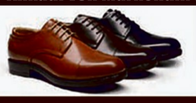
Lederschuhe - mehrere Farboptionen

Wir kaufen Goldschmuck jeglicher Art (auch defekt), sowie Silber in allen Varianten 90/100/800/925 Ankauf von Markenuhren aller Art (auch defekte Uhren), z.B. Rolex, Patek Philippe, Omega, Cartier, Hublot, Richard Mille