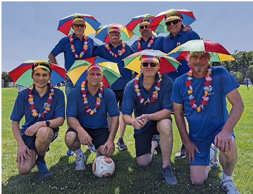
Mit Elan und Sportsgeist: Mitglieder des Heimatfestausschusses zeigen, dass Heimatgefühl und Bewegung zusammengehören.