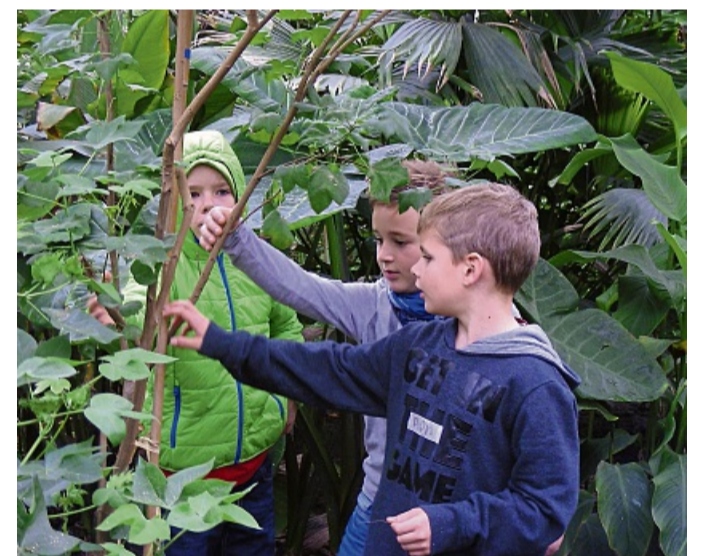
Grüne Entdeckungsreise: Mit allen Sinnen auf Spurensuche, Kinder erforschen im Tropengewächshaus Witzenhäuser, wie Gemüse wächst, schmeckt und was es mit dem Klima zu tun hat.

Tropengewächshaus bietet wieder die Ferien-Kinder-Uni an