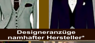
Designeranzüge namhafter Hersteller*