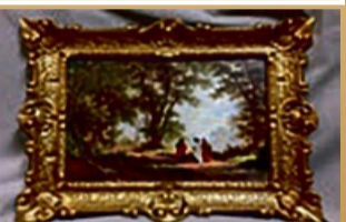
Gemälde aller Art