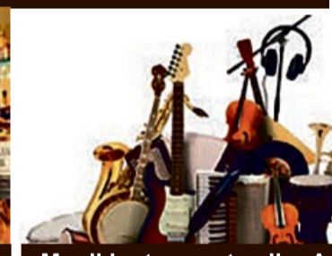
Musikinstrumente aller Art