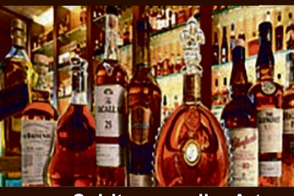
Spirituosen aller Art