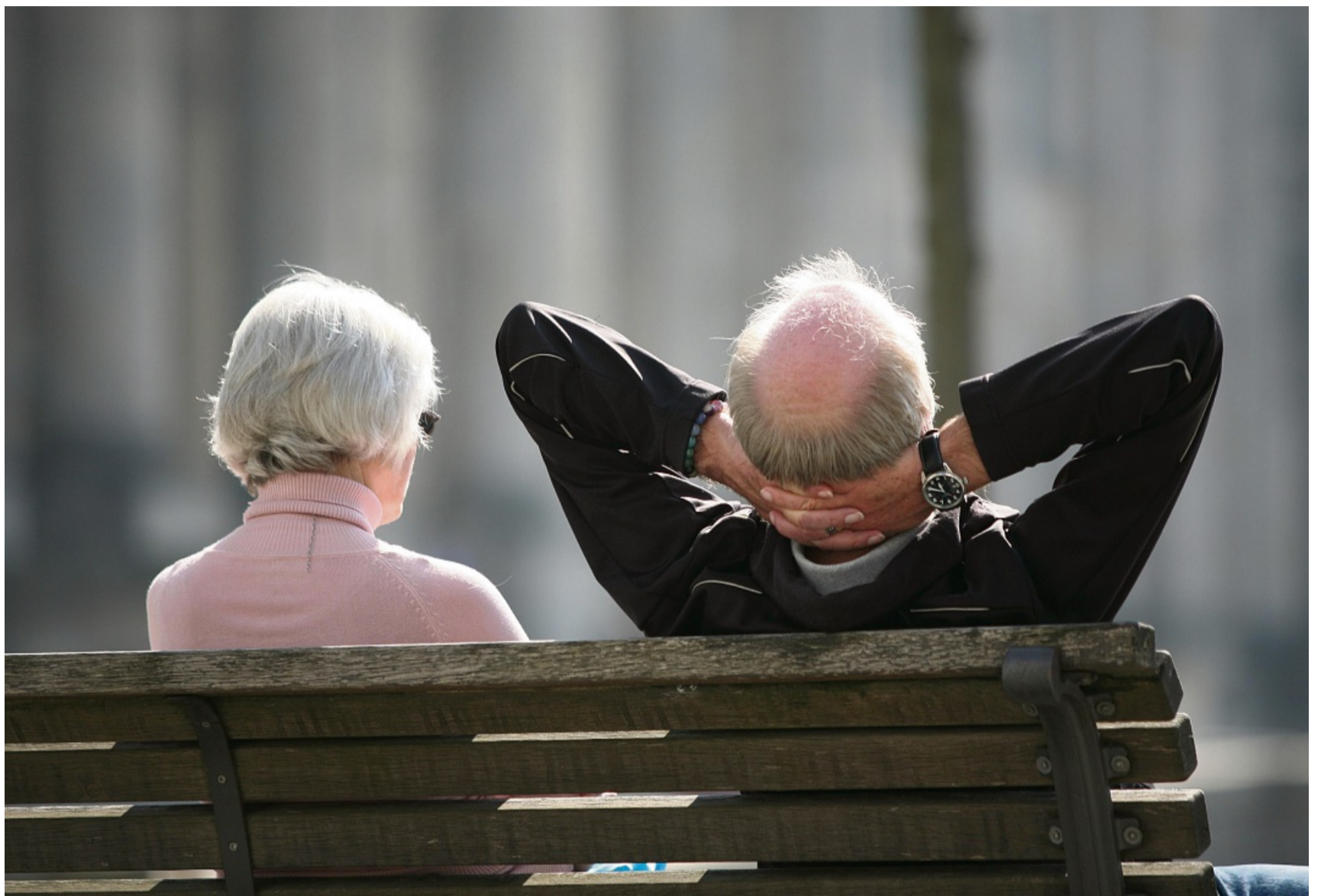
Was geht im Alltag nicht mehr ohne Hilfe? Über Fragen wie diese sollte man sich vor einer Pflegebegutachtung Gedanken machen.

Sie gehen mit den Betroffenen einen festgelegten Fragenkatalog (Begutachtungsassessment) mit 64 Fragen durch. „Damit wollen die Expertinnen und Experten herausfinden, in-