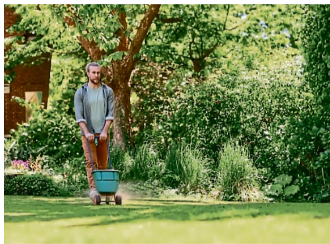
Ein Streuwagen verteilt den Dünger besonders gleichmäßig.

Während langer Trockenperioden im Sommer denken viele Hobbygärtner, dass sie ihrem Rasen einen Gefallen tun, wenn sie ihn täglich wässern. Doch tatsächlich ist genau das Gegenteil der Fall. Denn wird zwar täglich, aber nur kurz gewässert, wird nur die obere Schicht der Rasenfläche und nicht das Wurzelwerk der Gräser durchfeuchtet. Die Konsequenz: Auch wenn der Rasen optisch zunächst grün und gesund aussehen mag - bei anhaltender Hitze trocknet ein so bewässertes Rasen sehr viel schneller aus.