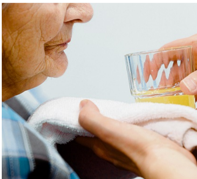
Je höher der Pflegegrad, desto höher ist der Unterstützungsbedarf.

Gegen den Bescheid können Betroffene Widerspruch einlegen. „Dann erfolgt eine sogenannte Zweitbegutachtung durch einen anderen Gutachter“, sagt Ulrike Kempchen. Sind Betroffene auch mit dem Ergebnis des Zweitgutachtens nicht einverstanden, können sie Klage beim zuständigen Sozialgericht einreichen. tmn