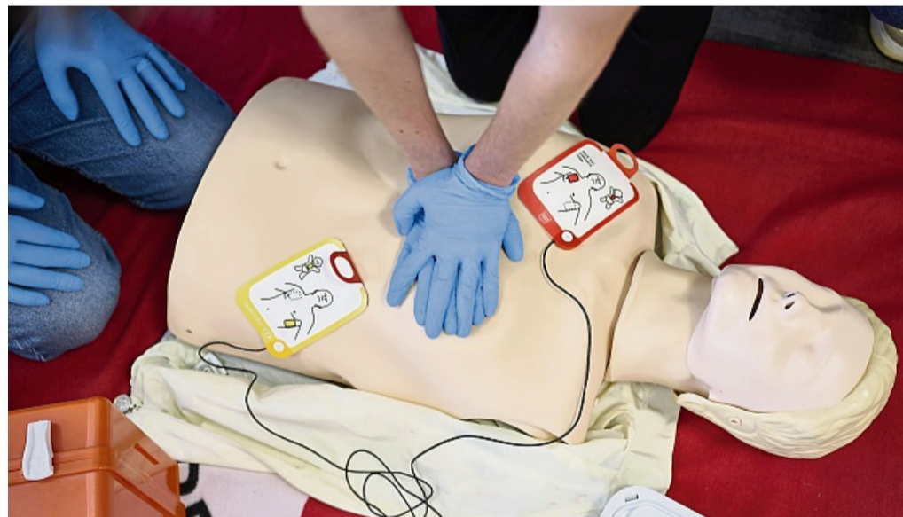
Defibrillatoren können im Notfall lebensrettend sein. Fünf Jugendherbergen in Waldeck-Frankenberg wurden nun damit ausgestattet.