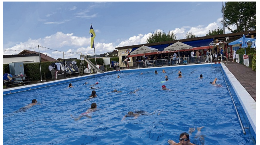
Ausdauer gefragt: Im Vasbecker Freibad können Schwimmerinnen und Schwimmer 24 Stunden Bahnen ziehen.

In den Sommerferien (Hessen und NRW) hat das Vasbecker Freibad täglich von 11 bis 19 Uhr geöffnet. Wer Interesse hat, die Badeaufsicht zu übernehmen, kann sich gerne melden. Voraussetzung ist der DLRG-Schein in Silber und ein aktueller Kurs in Erster-Hilfe. red