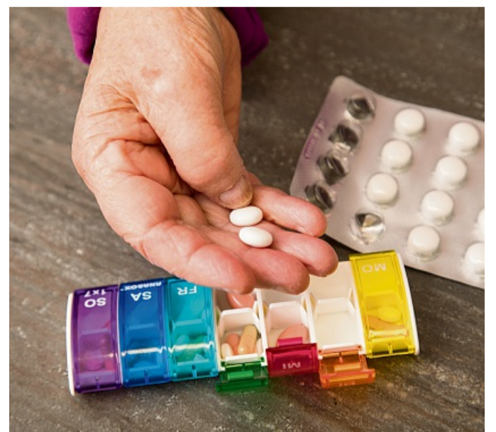
Einen aktuellen Medikationsplan kann man sich vom Hausarzt ausstellen lassen.