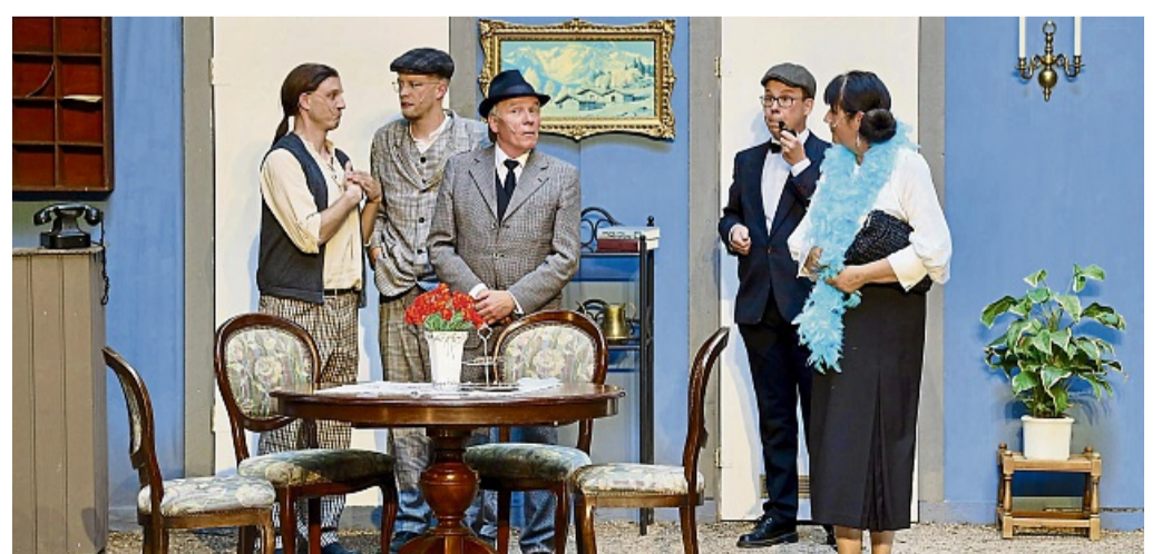
Turbulentes Zusammentreffen in der Pension Schöllner: Wer tickt denn hier nicht ganz richtig?