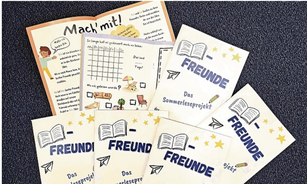
Sommerleseprojekt Bücherfreunde der Stadtbücherei Korbach PRIVAT

Korbach – Das mit dem Hessischen Leseförderpreis 2024 prämierte Sommerleseprojekt der Stadtbücherei Korbach startet in die nächste Runde. Kinder der Klassen 3 bis 6 sind eingeladen, in den Regalen der Stadtbücherei neue „Buch-Freunde“ zu finden.