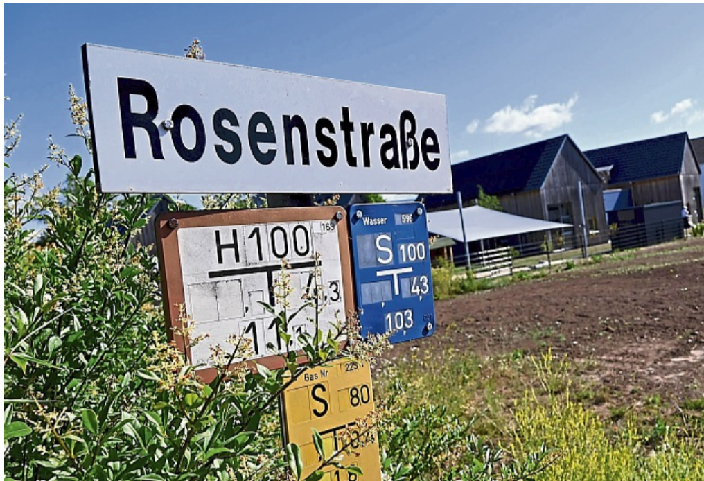
In der Rosenstraße sollen die ersten beiden Bauplätze für sogenannte Tiny-Häuser ausgewiesen werden. Zusätzlich gibt es Flächen an der Moersstraße und als Erweiterung der Holunderflosse.

Fast genau drei Jahre sind vergangen, seit die CDU-Fraktion den Magistrat mit der Prüfung für die Mini-Bauplätze beauftragt hatte. Nun soll es schnell gehen, war der eindeutige Tenor in den Ausschüssen.