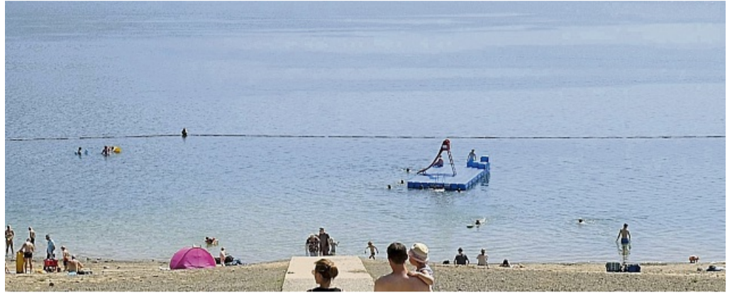
Die Badeinsel am Strandbad Waldeck - hier auf einem Archivbild, wurde am Freitag vor einer Woche Schauplatz eines lebensgefährlichen Badeunfalls.

Im Rahmen einer Firmenfeier im Restaurant Strandhaus Edersee begaben sich zwei Personen zum Baden an den Strand und schwammen zu einer ca. 40 m vom dortigen Ufer entfernten Badeinsel. Eine der Personen, die sich wenige Monate zuvor einer schweren Herz-OP unterzogen hatte, benutzte die auf der Badeinsel angebrachte Rutsche, ruhte sich aus und rutschte erneut. Hierauf trieb sie unvermittelt in Rückenlage hilflos im Wasser. Die andere Person, die sich währenddessen in der Nähe der Badeinsel aufgehalten hatte, kam hinzu und stellte fest, dass der Verletzte auf Ansprache nicht reagierte. Die Person hielt daraufhin den Kopf des Verletzten