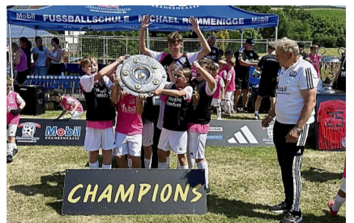
Das Team „Eintracht Frankfurt“ mit der Meisterschale.