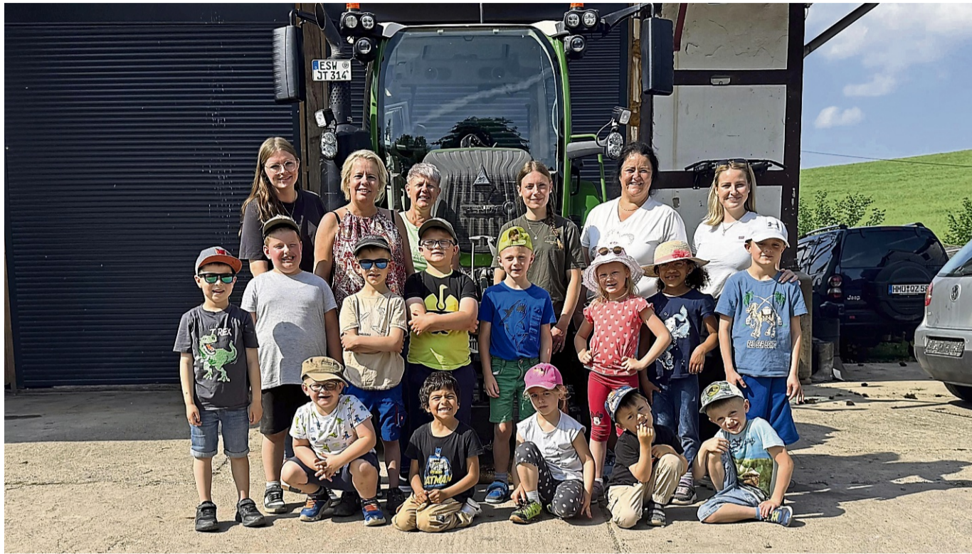
Neugierige Begegnung im Gehege: Die Kinder der Kita „Gelstertaler Spatzen“ lernen was es heißt, Verantwortung für Tiere zu übernehmen.