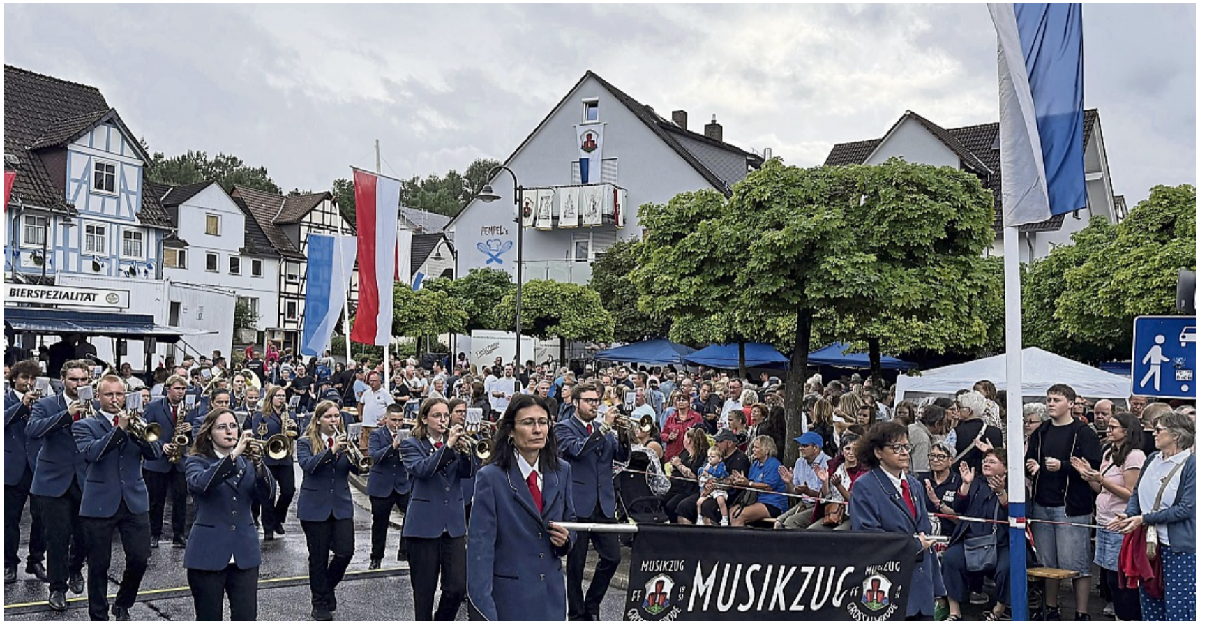
Mit Ton und Takt ins Fest: Der Musikzug Großalmerode stimmte nicht nur Instrumente, sondern auch das Heimatgefühl auf fünf besondere Tage ein.

Zum Abschluss erklang das Lied „Heimat Großalmerode“.