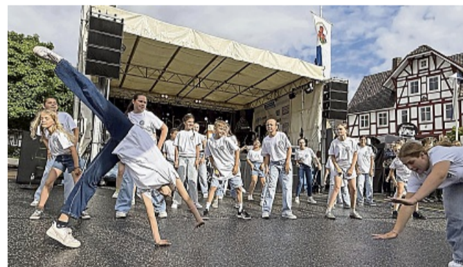
Mit Schwung und Begeisterung: Die jungen Mitglieder der TG 1863 erobern Bühne und Herzen, beweglich, mutig, mit leuchtenden Augen.