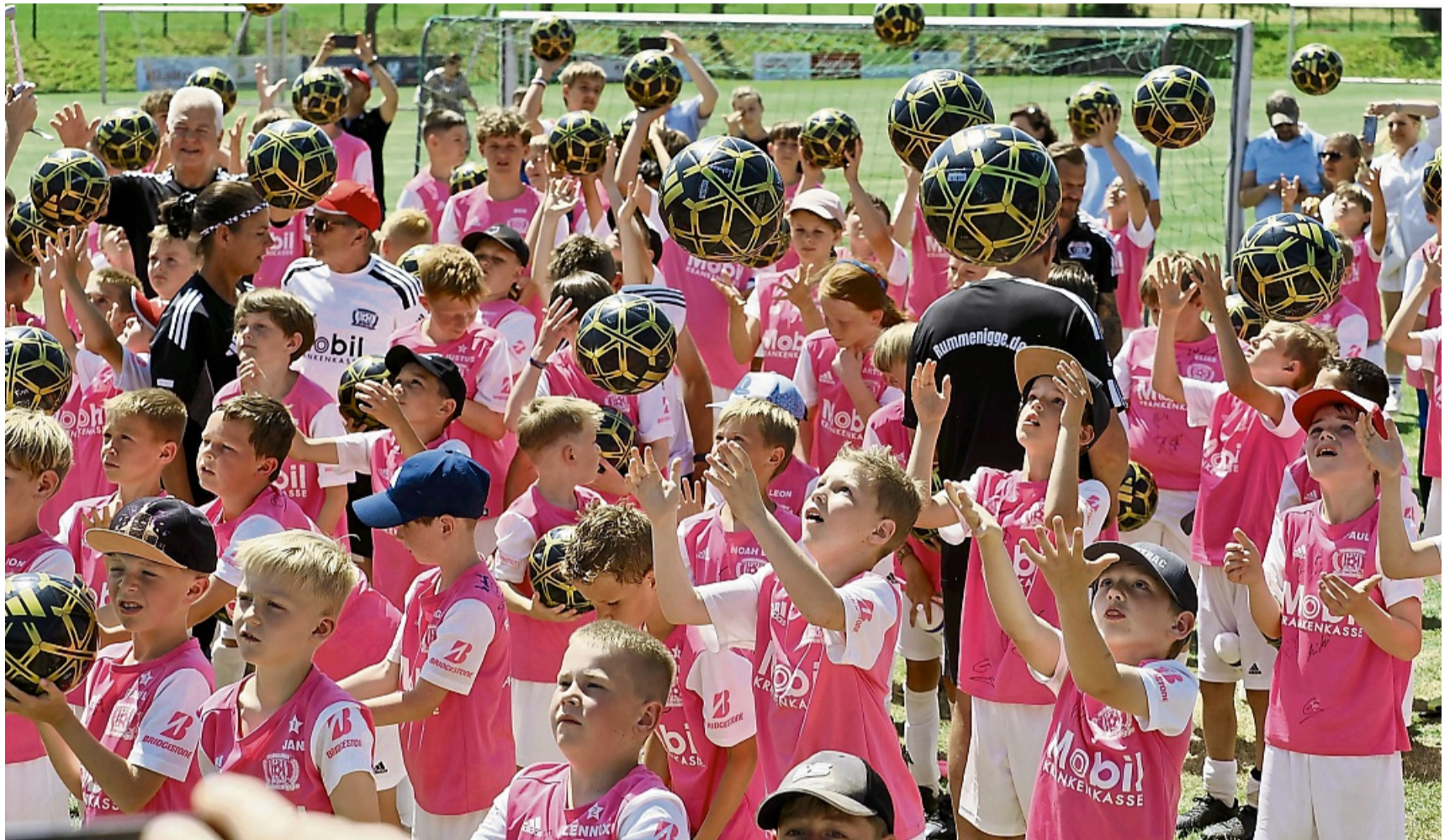
Abschluss und Siegerehrung: Die Teilnehmer am Rummenigge-Camp werfen am Ende ihre Bälle in die Höhe.