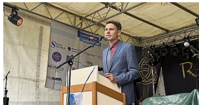
In der Luft und auf der Höhe: Heimatfest als sportliche Bühne. Die TG-Turnabteilung 1863 Großalmerode begeistert mit Tempo, Technik und Teamgeist.

Was bleibt, ist nicht nur der Applaus und der Klang der Glocke, sondern die leise Gewissheit, dass Heimat genau dort entsteht, wo Menschen bleiben, auch wenn der Himmel grau ist.