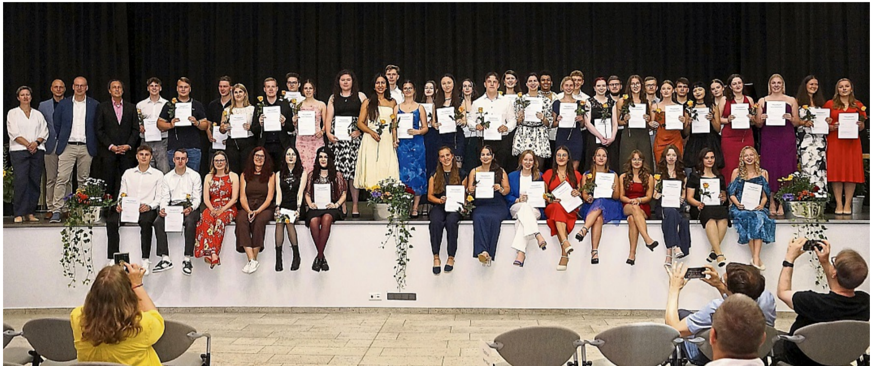
Der Abiturjahrgang der Freiherr-vom-Stein-Schule 2025 mit Schulleitung und Tutoren.