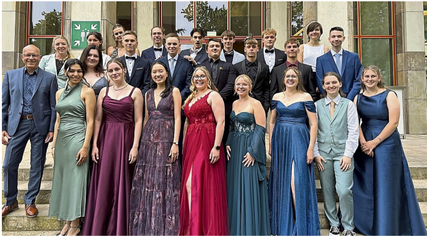
Zwischen Gestern und Morgen: Die Abiturklasse der Rhenanus-Schule mit ihren Tutoren. Ein stilles Gruppenbild, das von Verbundenheit erzählt, aber auch von Aufbruch.