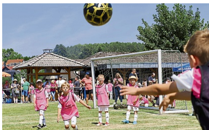
„Finale um die Deutsche Meisterschaft“ zwischen Eintracht Frankfurt (schwarze Trikots) und Bayer Leverkusen.