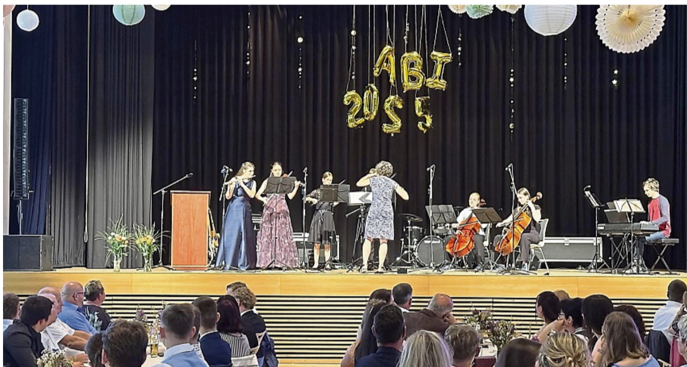
Sie spielten, was Worte nicht sagen konnten: Das Orchester der Rhenanus-Schule gab dem Abschied eine Stimme.