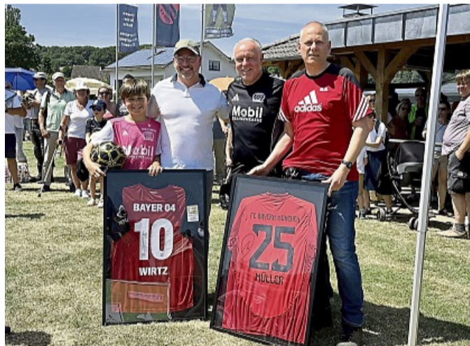
Die Versteigerung von signierten Trikots erlöst 2300 Euro für die Nachwuchsarbeit der TSG Kammerbach.

Die 120 Helfer der TSG Kammerbach können sich nun ausruhen. Im nächsten Jahr stehen beim Camp zwischen dem 26. und 28. Juni zwei runde Geburtstage an: 50 Jahre TSG-Frauenfußball und 30 Jahre Fußballschule Rummenigge. Dann geht es um die Weltmeisterschaft – mit einer Replik des WM-Pokals. EDUARD WARDA