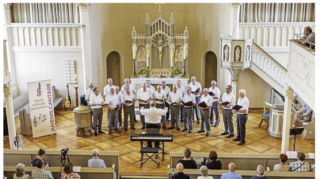
Mit dem Shanty „The Wellerman“ begeisterte der Polizeichor Göttingen das Publikum.