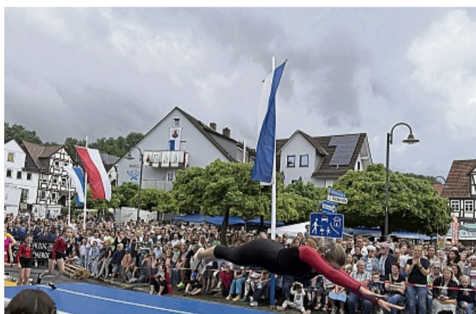
In der Luft und auf der Höhe: Heimatfest als sportliche Bühne. Die TG-Turnabteilung 1863 Großalmerode begeistert mit Tempo, Technik und Teamgeist.