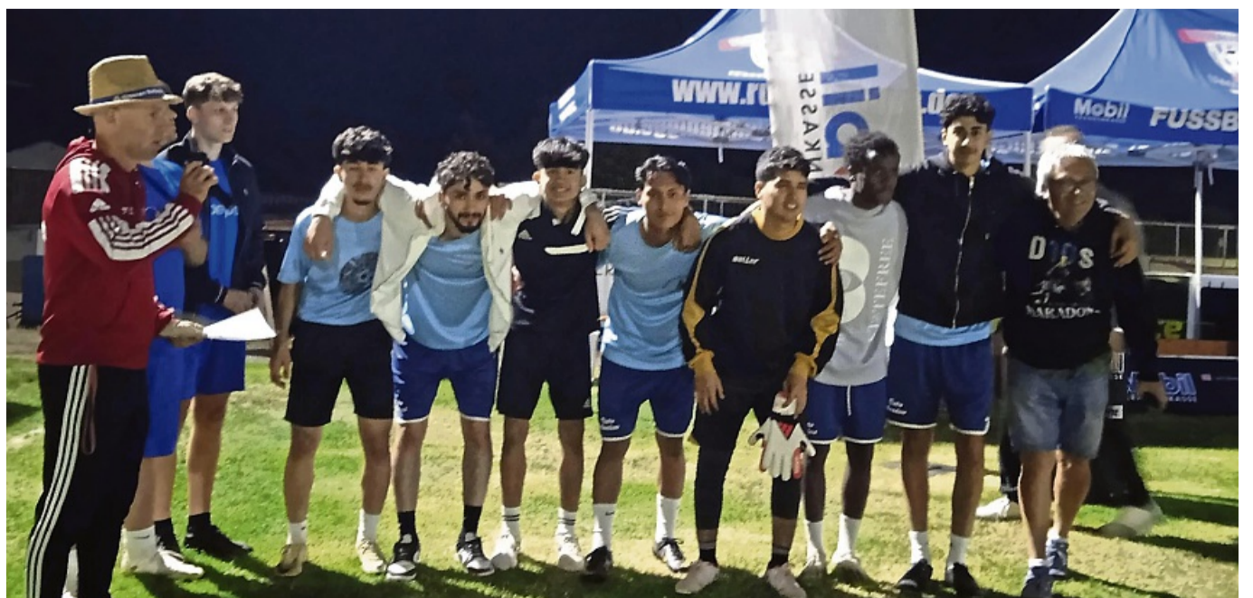
Die „11er Kings“ des Elfer Cups: „Fußball für Jedermann“ darf sich inoffizieller Kreismeister im Elfmeterschießen nennen.