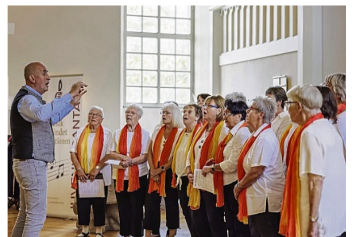
Auftritt des Frauenchores Bühren, aus dessen Reihen bei dem Lied „Ich will keine Schokolade“ spontan Schokoladenkonfekt ins Publikum flog.