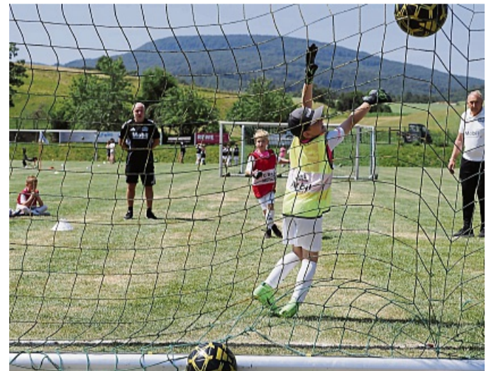
Vom Punkt aus: „Kick it like Rummenigge (I.)“