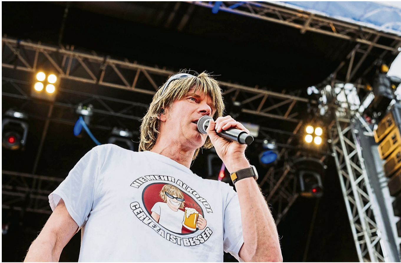
Sorgt am Samstag im Vitalpark für Stimmung: Mickie Krause steht seit vielen Jahren für feuchtfröhliche Party-Musik.

Wer mit dem Auto anreist, kann auf einem der ausgewiesenen Park-and-Ride-Plätze in Heilbad Heiligenstadt oder im Industriegebiet an der A38 parken. Von dort geht es ab 12.30