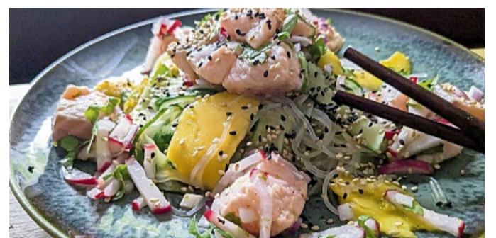
Der Glasnudelsalat mit Lachs-Ceviche wird mit gerösteten weißen und schwarzen Sesamkörnern getoppt.