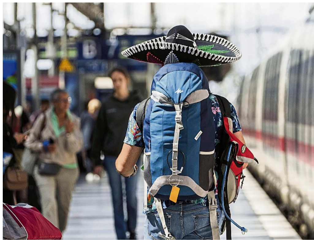
Der Zug fährt gleich? Mit Rucksack auf dem Rücken rennt es sich schneller als mit Koffer in der Hand.

Nicht, wenn der Rucksack vernünftig konstruiert ist und man korrekt packt. „Gute Rucksäcke ziehen einen auch dann nicht nach hinten, wenn da 25 Kilogramm drin sind“, sagt Gnielka hierzu. Gerade wer einen Rucksack mit viel Volumen kauft, sollte deshalb auf Tragekomfort und Lastübertragung achten. Konkret nennt der Fachmann folgende Punkte, die solche Modelle mitbringen sollten: vorgeformte Schultergurte ein stabiler Hüftgurt, sodass die Hauptlast gut auf