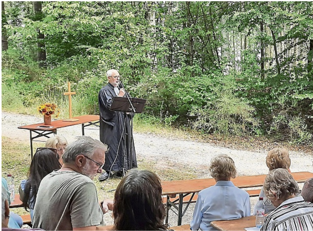
Die Kirchengemeinden Hoheneiche, Mitterode und Wichmannshausen feierten traditioneller Gottesdienst an der Lauseeiche.

Musikalisch unterstrichen wurde die Predigt durch das zum Kirchenlied avancierte ehemalige Volkslied „Geh aus mein Herz“ von Paul Gerhard, das 1653 kurz nach dem 30-jährigen Krieg geschrieben wurde und das der Verfasser ursprünglich auch nach einem