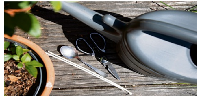
Gießen ohne Brausekopf: Lässt sich mit einem Löffel an der Gießkanne eine größere Fläche bewässern?