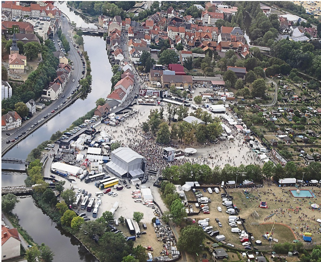
Mitten in der Stadt liegt das Festivalgelände des Open Flairs auf dem Werdchen. Das ist ein besonderer Charme, sorgt aber auch für Konflikte. Gerade die Anwohner von Brückenhausen sind betroffen.

Während der Sperrzeiten. Die sind am Mittwoch, Donnerstag